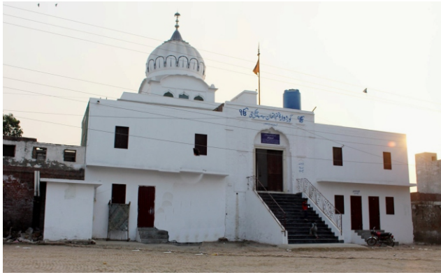
ਗੁਰਦੁਆਰਾ ਡੇਰਾ ਚਾਹਲ (ਲਹੌਰ) ਬੇਬੇ ਨਾਨਕੀ ਦਾ ਜਨਮ ਅਸਥਾਨ। ਗੁਰੂ ਸਾਹਿਬ ਦੇ ਨਾਨਕੇ

ਇਸ ਵਿਆਹ ਦਾ ਵੀ ਗੁਰੂ ਸਾਹਿਬ ਦੇ ਪਵਿਤ੍ਰ ਜੀਵਨ ਨਾਲ ਗੂੜਾ ਸਬੰਧ ਬਣਦਾ ਹੈ। ਇਕ ਤਾਂ ਦੋਵਾਂ ਭੈਣ ਭਰਾ ਦਾ ਬਹੁਤ ਪਿਆਰ ਸੀ। ਹੋਇਆ ਕੁਝ ਇਸ ਤਰਾਂ ਕਿ ਜਦੋਂ ਗੁਰੂ ਸਾਹਿਬ ਦਾ ਜਨਮ ਹੋਇਆ ਓਦੋਂ ਪੰਜਾਬ ਦੀ ਰਾਜਧਾਨੀ ਸੁਲਤਾਨਪੁਰ ਲੋਧੀ ਸੀ। ਇਸ ਸ਼ਹਿਰ ਦਾ ਪੁਰਾਣਾ ਨਾਂ ਕਿਸੇ ਨੇ ਸਰਬਮਾਨ ਪੁਰ ਤੇ ਕਿਸੇ ਨੇ ਕੁਝ ਹੋਰ ਲਿਖਿਆ ਹੈ। ਕਿਉਂਕਿ ਦੌਲਤ ਖਾਂ ਲੋਧੀ ਨੇ ਇਹ ਸ਼ਹਿਰ ਦੁਬਾਰਾ ਵਸਾਇਆ ਸੀ ਇਸ ਕਰਕੇ ਉਹ ਲਹੌਰ ਘੱਟ ਰਹਿੰਦਾ ਤੇ ਜ਼ਿਆਦਾ ਸੁਲਤਾਨਪੁਰ ਹੀ ਰਿਹਾ ਕਰਦਾ ਸੀ। ਓਦੋਂ ਹਿੰਦੋਸਤਾਨ ਦਾ ਬਾਦਸ਼ਾਹ ਸਿਕੰਦਰ ਲੋਧੀ ਸੀ। ਉਸ ਦੀ ਹਕੂਮਤ ਤਹਿਤ ਪੰਜਾਬ ਦਾ ਰਾਜਾ ਦੌਲਤ ਖਾਂ ਲੋਧੀ ਸੀ। ਓਨੀ ਦਿਨੀਂ ਟੈਕਸ (ਕਰ) ਤੇ ਮਾਮਲਾ (ਮਾਮਲੇ ਨੂੰ ਓਦੋਂ ਹਾਲਾ ਕਿਹਾ ਜਾਂਦਾ ਸੀ। ਭਾਵ ਪ੍ਰਤੀ ਹਲ) ਨਕਦ ਨਹੀਂ ਸੀ ਹੁੰਦਾ ਤੇ ਸਬੰਧਤ ਚੀਜ਼ ਵਸਤੂ ਹੀ ਉਗਰਾਉਣ ਵਾਲੇ ਲੈ ਜਾਂਦੇ ਸਨ। ਮਾਮਲਾ ਨਕਦੀ ਵਿੱਚ ਅੰਗਰੇਜ਼ਾਂ ਨੇ ਆ ਕੇ ਸ਼ੁਰੂ ਕੀਤਾ ਸੀ। ਸੋ ਹਾਲਾ ਉਗਰਾਉਣ ਦਾ ਹਿਸਾਬ ਕੁਝ ਇਸ ਤਰਾਂ ਸੀ ਕਿ ਪਹਿਲਾਂ ਪਿੰਡ ਪੱਧਰ ਤੇ ਮਾਮਲਾ ਲੰਬਰਦਾਰ ਉਗਰਾਉਦਾ ਸੀ ਜੋ ਸਬੰਧਤ ਜਗੀਰਦਾਰ ਜਾਂ ਛੋਟੇ ਰਾਜੇ ਤੱਕ ਪਹੁੰਚਦਾ ਸੀ। ਛੋਟਾ ਰਾਜਾ ਫਿਰ