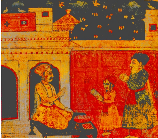
ਪਿਤਾ ਜੀ ਬਾਬਾ ਨਾਨਕ ਨੂੰ ਸਕੂਲ ਦਾਖਲ ਕਰਾਉਣ ਸਮੇਂ- ਬੀ:40

3. ਫਾਰਸੀ ਦੀ ਪੜ੍ਹਾਈ- ਇਸ ਵਿੱਚ ਸ਼ਾਹਮੁਖੀ (ਅੱਜ ਕਲ੍ਹ ਦੇ ਉੜਦੂ ਦੀ ਲਿਪੀ) ਸਿਖਾਈ ਜਾਂਦੀ ਸੀ। ਮਾਧਿਅਮ ਫਾਰਸੀ ਹੁੰਦਾ ਸੀ। ਕੁਰਾਨਖਾਨੀ, ਭੂਗੋਲ, ਇਤਹਾਸ, ਹਿਸਾਬ ਆਦਿ ਪੜ੍ਹਾਇਆ ਜਾਂਦਾ ਸੀ। ਧਿਆਨ ਰਹੇ ਪੰਜਾਬ ਦੇ ਗੁਆਂਢ ਵਿੱਚ ਇਕ ਪਾਸੇ ਫਾਰਸੀ ਤੇ ਦੂਸਰੇ ਪਾਸੇ ਸੰਸਕ੍ਰਿਤ ਸੀ।