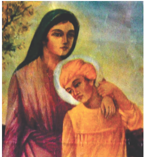
ਬੇਬੇ ਨਾਨਕੀ ਅਤੇ ਬਾਬਾ। ਅੱਜ ਕਲ ਬਣੀ ਤਸਵੀਰ। ਕਲਾਕਾਰ ਦਾ ਨਾਂ ਪਤਾ ਨਹੀਂ। ਇੰਟਰਨੈਟ ਤੋਂ ਡਾਊਨਲੋਡ

ਰਾਇ ਬੁਲਾਰ ਨੇ ਜੈ ਰਾਮ ਕੋਲੋਂ ਪੁੱਛਿਆ ਕਿ ਕੀ ਉਹ ਵਿਆਹਿਆ ਹੋਇਆ ਹੈ ਕਿ ਕੁਵਾਰਾ ਹੈ। ਜੈ ਰਾਮ ਨੇ ਸਾਰੀ ਗੱਲ ਦੱਸੀ ਕਿ ਉਹ ਕੁਵਾਰਾ ਹੈ ਤੇ ਜਾਤ ਦਾ ਖੱਤਰੀ ਹੈ। ਰਾਇ ਬੁਲਾਰ ਨੇ ਹੀ ਫਿਰ ਮਹਿਤਾ ਕਾਲੂ ਨੂੰ ਆਪਣੇ ਕੋਲ ਸੱਦ ਕੇ ਵਿਆਹ ਦੀ ਗੱਲ ਅੱਗੇ ਤੋਰੀ। ਜਨਮ ਸਾਖੀ ਵਿੱਚ ਬੜਾ ਵਿਸਥਾਰ ਨਾਲ ਦਿੱਤਾ ਹੈ ਕਿਵੇਂ ਮਹਿਤਾ ਕਾਲੂ ਬੇਦੀ (ਗੋਤ ਸਹਿਗਲ) ਨੇ ਸ਼ੁਰੂ 'ਚ ਇਸ ਰਿਸ਼ਤੇ ਦੀ ਮੁਖਾਲਫਤ ਕੀਤੀ ਅਖੇ "ਇਹ ਗੱਲ ਮੁੰਡੇ ਵਾਲਿਆਂ ਵਲੋਂ ਚਲਣੀ ਚਾਹੀਦੀ ਹੈ।" ਜਨਮ ਸਾਖੀ 'ਚ ਆਇਆ ਹੈ ਕਿ ਜੈ