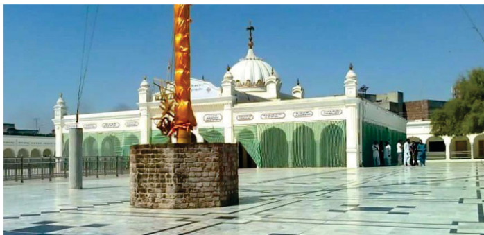
ਬ੍ਰਹਿਮੰਡ ਦੇ ਰਹਿਬਰ ਦਾ ਘਰ ਤਾਂ ਬਹੁਤ ਪਹਿਲਾਂ ਹੀ ਸਮਾਰਕ ਬਣਾ ਦਿੱਤਾ ਗਇਆ ਸੀ। ਕਿਤੇ ਦੁਨੀਆ ਇਹ ਨਾਂ ਕਹੇ ਕਿ ਸਿੱਖ ਵੀ ਮੂਰਤੀ ਪੂਜਕ ਬਣ ਗਏ ਨੇ। ਇਥੇ ਸਿੱਖਾਂ ਨੇ ਗੁਰੂ ਸਾਹਿਬ ਦੀ ਕੋਈ ਵੀ ਨਿਸ਼ਾਨੀ ਨਾਂ ਸਾਂਭੀ। ਜਰੂਰਤ ਸੀ ਇਤਹਾਸ ਸਾਂਭਣ ਦੀ। ਉਹਨਾਂ ਵੇਲਿਆਂ ਦੀ ਸਿਰਫ ਖੂਹੀ ਹੀ ਬਚੀ ਹੈ। ਧਿਆਨ ਰਹੇ, ਇਤਹਾਸ ਤੇ ਫਿਲਾਸਫੀ ਦੇ ਵੱਖਰੇ ਪਹਿਲੂ ਹੁੰਦੇ ਨੇ। ਮੁਸਲਮਾਨਾਂ ਨੇ ਮੁਹੰਮਦ ਸਾਬ ਦੇ 1400 ਸਾਲ ਪੁਰਾਣੇ ਘਰ ਦੀਆਂ ਨੀਹਾਂ ਅੱਜ ਤਕ ਸਾਂਭੀਆਂ ਹੋਈਆਂ ਨੇ

ਅਜਿਹੇ ਚੜ੍ਹਦੀ ਕਲ੍ਹਾਂ ਵਿਚ ਚਲਣ ਵਾਲੇ ਮਨੁੱਖ ਜਿਸ ਦੀ ਸਿਰਜਣਾ ਗੁਰੂ ਨਾਨਕ ਨੇ ਕੀਤੀ ਉਸ ਨੂੰ ਨਾਨਕ ਨੇ 'ਸਿੱਖ' ਦਾ ਨਾਮ ਦਿਤਾ। ਗੁਰੂ ਨਾਨਕ ਦੇ ਨਾਮ ਦਾ ਸਿਧਾਂਤ ਝੱਟ ਇਕ ਲਹਿਰ ਬਣ ਗਇਆ। ਦੋ ਸਦੀਆਂ ਦੇ ਵਿਚ ਹੀ ਉੱਤਰੀ ਭਾਰਤ ਵਿਚ ਗੁਰੂ ਨਾਨਕ ਦੇ ਨਾਮ ਦਾ ਸਿੱਕਾ ਵੀ ਢਲ ਗਇਆ। ਅੱਜ ਭਾਵੇ