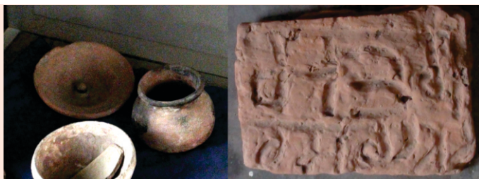
ਸੁਲਤਾਨਪੁਰ ਵਿਖੇ ਜਿਥੇ ਗੁਰੂ ਸਾਹਿਬ ਦੀ ਰਹਾਇਸ਼ ਹੋਇਆ ਕਰਦੀ ਸੀ ਭਾਵ ਗੁਰਦੁਆਰਾ ਗੁਰੂ ਕਾ ਬਾਗ ਉਥੇ ਹੁਣੇ ਹੁਣੇ ਚੰਗਾ ਭਲਾ ਗੁਰਦੁਆਰਾ ਢਾਹ ਕੇ ਦੁਬਾਰਾ ਬਣਾਇਆ ਜਾ ਰਿਹਾ ਹੈ। ਇਥੇ ਨੀਹਾਂ ਦੀ ਖੁਦਾਈ ਦੌਰਾਨ ਕੁਝ ਭਾਂਡੇ ਅਤੇ ਪੱਕੀ ਇੱਟ ਉਤੇ ਸਿਲਲੇਖ ਮਿਲਿਆ ਹੈ ਜਿਸ ਵਿੱਚ ਲਿਖਿਆ ਹੈ, "ਸਤਗੁਰੁ ਸਹਾਇ"। ਲਿਖਤ ਦੀ ਲਿਪੀ ਸਾਫ ਤੌਰ ਤੇ 4-5 ਸੌ ਸਾਲ ਪੁਰਾਣੀ ਲਗਦੀ ਹੈ। ਕੁਦਰਤੀ ਹੈ ਕਿ ਇਹ ਇੱਟ ਨਿਵਾਸ ਅਸਥਾਨ ਦੀ ਕੰਧ ਤੇ ਬਾਹਰਲੇ ਪਾਸੇ ਹੁੰਦੀ ਹੋਵੇਗੀ।

ਦੌਲਤ ਖਾ ਲੋਧੀ ●- ਮੋਟੇ ਤੌਰ ਤੇ ਹਿੰਦੁਸਤਾਨ ਤੇ ਸੰਨ 1526 ਤੋਂ 1857 ਤਕ ਮੁਗਲ ਖਾਨਦਾਨ ਦੀ ਹਕੂਮਤ ਰਹੀ ਹੈ। ਇਸ ਹਕੂਮਤ ਦਾ ਬੀ ਬੀਜਣ ਵਾਲਾ ਹੋਰ ਕੋਈ ਨਹੀਂ ਸਗੋਂ ਸੁਲਤਾਨਪੁਰ ਦਾ ਦੌਲਤ ਖਾਨ ਲੋਧੀ ਸੀ ਜਿਸ ਨੇ ਬਾਬਰ ਨੂੰ ਨਿਓਤਾ ਭੇਜਿਆ ਕਿ ਹਿੰਦੁਸਤਾਨ ਤੇ ਹਮਲਾ ਕਰ ਮੈਂ ਤੇਰੀ ਮਦਦ ਕਰਾਂਗਾ। ਸਿੱਖ ਇਤਹਾਸ ਦਾ ਦਾਵਾ ਹੈ ਕਿ ਦੌਲਤ ਖਾਂ ਦਾ ਧਰਮ ਗੁਰੂ, ਬਾਬਾ ਨਾਨਕ ਸੀ। ਸਿੱਖ ਇਤਹਾਸ ਆਉਂਦਾ ਹੈ ਕਿ