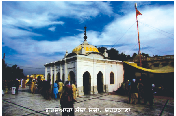
ਗੁਰਦੁਆਰਾ ਸੱਚਾ ਸੌਦਾ, ਚੂਹੜਕਾਣਾ

ਇਤਹਾਸ ਵਿੱਚ ਆਉਦਾ ਹੈ ਕਿ ਨਾਲ ਕੋਈ ਨਫਰ (ਨੌਕਰ) ਭੇਜਿਆ ਗਿਆ। ਸਾਫ ਅੰਦਾਜ਼ਾ ਹੈ ਕਿ ਭਾਈ ਮਰਦਾਨਾ ਗੁਰੂ ਸਾਹਿਬ ਦੇ ਨਾਲ ਗਇਆ। ਚੂਹੜਕਾਣੇ ਜਦੋਂ ਦੋਵੇ ਪਹੁੰਚੇ ਤਾਂ ਓਰੇ ਬਾਗ ਵਿੱਚ ਸਾਧੂਆਂ ਦਾ ਟੋਲਾ ਨਜ਼ਰ ਆਇਆ। ਰੱਬ ਦੀ