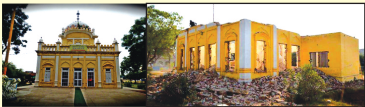
ਤੰਬੂ ਸਾਹਿਬ ਜਿਥੇ ਗੁਰੂ ਸਾਹਿਬ ਸੱਚਾ ਸੌਦਾ ਕਰਨ ਉਪਰੰਤ ਪਿਤਾ ਤੋਂ ਡਰਦੇ ਲੁਕੇ ਸਨ। ਉਹਦੀ ਕਾਰ ਸੇਵਾ ਹੋ ਰਹੀ ਹੈ ਤੇ ਖੂਬਸੂਰਤ ਬਾਲ ਲੀਲਾ ਅਸਥਾਨ ਵੀ ਢਾਹ ਦਿੱਤਾ ਗਇਆ ਹੈ।

ਮਿਸਾਲ ਦੇ ਤੌਰ ਤੇ ਸੁਲਤਾਨਪੁਰ ਲੋਧੀ ਦੀ ਉਹ ਮਸੀਤ ਢਾਹ ਕੇ ਗੁਰਦੁਆਰਾ ਬਣਾ ਦਿਤਾ ਜਿਥੇ ਬਾਬੇ ਨਾਨਕ ਨੇ ਨਮਾਜ਼ ਪੜੀ ਸੀ। ਚਮਕੌਰ ਦੀ ਕੱਚੀ ਗੜੀ, ਸਰਹੰਦ ਦਾ ਠੰਡਾ ਬੁਰਜ, ਅੰਮ੍ਰਿਤਸਰ ਵਿਚ ਗੁਰੂ ਸਾਹਿਬ ਦੇ ਨਿਵਾਸ ਅਸਥਾਨ ਗੁਰੂ ਦੇ ਮਹਿਲ ਜਿਥੇ