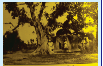
ਗੁਰਦੁਆਰਾ ਨਾਨਕ ਮੜ੍ਹ ਸਾਹਿਬ

100 ਕਰਮਾਂ ਦੇ ਫਾਸਲੇ ਤੇ ਛੱਪੜ ਹੈ ਜਿੱਥੇ ਲੋਕ ਅਸ਼ਨਾਨ ਕਰਦੇ ਹਨ ਤੇ ਮੰਨਦੇ ਹਨ ਕਿ ਗੁਰੂ ਸਾਹਿਬ ਦੀ ਜਦੋਂ ਜੰਵ ਆਈ ਹੋਈ ਸੀ ਤਾਂ ਇਥੇ ਹੀ ਪੜਾਅ ਕੀਤਾ ਤੇ ਹੱਥ ਮੂੰਹ ਧੋਤੇ ਸਨ। ਬਾਦ ਵਿੱਚ ਬਟਾਲੇ ਦੀ ਮਾਈ ਪੰਚਾਇਤ ਜੰਵ ਨੂੰ ਸੱਦਣ ਆਈ ਤੇ ਬਟਾਲੇ ਦੁਕਾਅ ਹੋਇਆ ਸੀ। ਪਰ ਇਸ ਨਾਂ ਦਾ ਗੁਰਦੁਆਰਾ ਬਟਾਲਾ ਇਲਾਕੇ ਵਿੱਚ ਅੱਜ ਮੌਜੂਦ ਨਹੀ ਹੈ। ਅਸੀਂ ਪੁੱਛ ਪੜਤਾਲ ਕੀਤੀ ਤੇ ਪਤਾ ਲੱਗਾ ਹੈ ਕਿ ਹੋ ਸਕਦਾ ਸਾਈਕਲ ਯਾਤਰੀ ਗੁਰਦੁਆਰਾ ਫਲਾਹੀ ਸਾਹਿਬ ਦੀ ਹੀ ਗਲ ਕਰ ਰਿਹਾ ਹੋਵੇ ਜੋ ਦੀਵਾਨੀਵਾਲ ਅਤੇ ਵਡਾਲਾ ਗੁੰਬੀਆਂ ਦਰਮਿਆਨ ਮੌਜੂਦ ਹੈ ਪਰ ਫਲਾਹੀ ਸਾਹਿਬ ਤਾਂ ਕੰਧ ਸਾਹਿਬ ਬਟਾਲਾ ਤੋਂ ਸਾਢੇ ਛੇ ਕਿ. ਮੀ ਹੱਟਵਾਂ ਤੇ ਉਹ ਵੀ ਪੂਰਬ ਵਿੱਚ ਹੈ। ਹੋਰ ਖੋਜ ਦੀ ਜਰੂਰਤ ਹੈ।