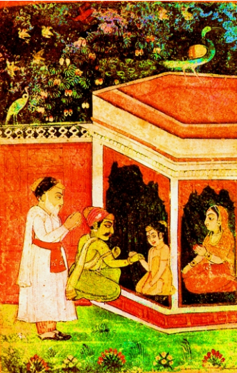
ਅਗਿਆਨੀ ਵੈਦ ਨੂੰ ਕੀ ਪਤਾ ਕਿ ਪੀੜ ਕਿੱਥੇ ਹੈ?

ਗੱਲ ਕਰਦੇ, ਜਾਂ ਇਕ ਦਿਨ ਚਲੇ ਜਾਣ ਦੀ ਗੱਲ ਕਰਦੇ ਤਾਂ ਪਿਤਾ ਜੀ ਨੇ ਕਹਿ ਦੇਣਾ, "ਇਹੋ ਜਿਹੀ ਕੋਈ ਗੱਲ ਨਹੀਂ ਇਹ ਤਾਂ ਛੋਟਾ ਹੁੰਦਾ ਵੀ ਮਰਨ ਦੀਆਂ ਗੱਲਾਂ ਕਰਿਆ ਕਰਦਾ ਸੀ।" ਜਦੋਂ ਕਿਸੇ ਨੇ ਹਮਦਰਦੀ ਜਿਤਾਉਂਦੇ ਤਰੀਕੇ ਤਰੀਕੇ ਕਹਿਣਾ ਕਿ ਮਹਿਤਾ ਜੀ ਤੇਰਾ ਮੁੰਡਾ ਸ਼ੁਦਾਈ ਹੈ। ਉਸ ਵੇਲੇ ਪਿਤਾ ਨੇ ਕਹਿਣਾ "ਨਹੀ ਭਰਾਵਾ! ਇੰਨੇ ਤਾਂ ਪਾਠਸ਼ਾਲਾ ਤੇ ਮਦਰੱਸੇ ਵਿੱਚ ਧੂਮ ਮਚਾ