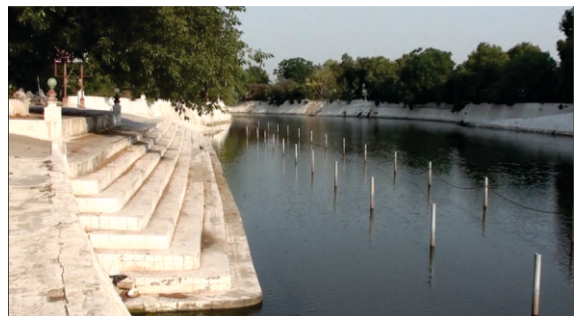
ਜਿਥੋਂ ਕੁ ਜਿਹੇ ਵੇਖੀ ਵਿਚੋਂ ਤੀਸਰੇ ਦਿਨ ਗੁਰੂ ਸਾਹਿਬ ਪ੍ਰਗਟ ਹੋਏ। ਕੰਢੇ ਤੇ ਅੱਜ ਗੁਰਦੁਆਰਾ ਸੰਤ ਘਾਟ ਮੌਜੂਦ ਹੈ

ਆਪੋ ਖਸਮਿ ਨਿਵਾਜਿਆ ॥ ਜੀਉ ਪਿੰਡੂ ਦੇ ਸਾਜਿਆ ॥ ਆਪਣੇ ਸੇਵਕ ਕੀ ਪੇਸ਼ ਰਖੀਆ ਦੁਇ ਕਰ ਮਸਤਕਿ ਧਾਰਿ ਜੀਉ ॥੧੬॥ ਸਭਿ ਸੰਜਮ ਰਹੇ ਸਿਆਣਪਾ ॥ ਮੇਰਾ ਪ੍ਰਭੁ ਸਭੁ ਕਿਛੁ ਜਾਣਦਾ ॥ ਪ੍ਰਗਟ ਪ੍ਰਤਾਪੁ ਵਰਤਾਇਓ ਸਭੁ ਲੋਕੁ ਕਰੈ ਜੈਕਾਰੁ ਜੀਉ ॥੧੭॥ ਮੇਰੇ ਗੁਣ ਅਵਗਨ ਨ ਬੀਚਾਰਿਆ ॥ ਪ੍ਰਭਿ ਅਪਣਾ ਬਿਰਦੁ ਸਮਾਰਿਆ ॥ ਕੰਠਿ ਲਾਇ ਕੈ ਰਖਿਓਨੁ ਲਗੈ ਨ ਤਤੀ ਵਾਉ ਜੀਉ ॥੧੮॥ (ਪੁਰਾ ਸ਼ਬਦ ਵੇਖੋ ਸ੍ਰੀ ਰਾਗ ਅੰਗ-੭੧ ਸਗਗਸ)