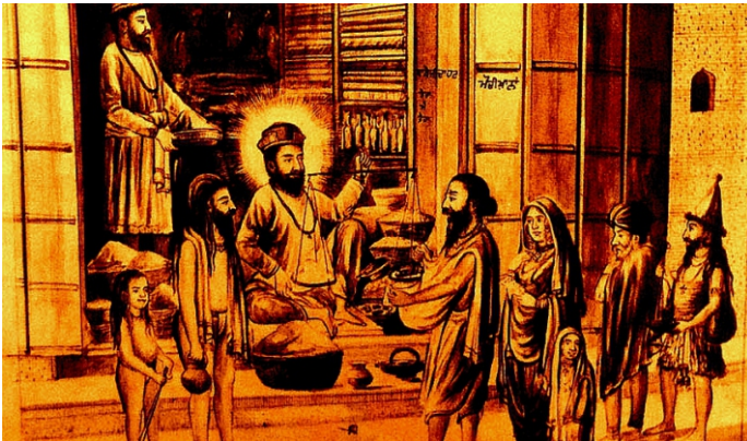
ਤੇਰਾ ਤੇਰਾ ਵਾਲਾ ਮੋਦੀ

ਸਨ। ਬਾਬੇ ਨਾਨਕ ਨੇ ਫਿਰ ਅਰਬੀ ਘੋੜਾ ਪੂਰਾ ਸਜਾ ਸਵਾਰ, ਕਾਠੀ ਪਾ ਨਵਾਬ ਦੇ ਭੇਟ ਕੀਤਾ ਤੇ ਨਾਲ ਕੁਝ ਨਕਦੀ ਵੀ। ਨਵਾਬ ਨਾਨਕ ਨੂੰ ਵੇਖ ਅਤੇ ਗਲਬਾਤ ਕਰਨ ਉਪਰੰਤ ਬੜਾ ਪ੍ਰਸੰਨ ਹੋਇਆ। ਗੁਰੂ ਸਾਹਿਬ ਦੀ ਸ਼ਖਸੀਅਤ ਬਾਰੇ ਜਦੋਂ ਭਾਈਆਂ ਜੀ