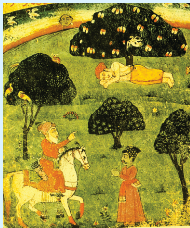
ਰਾਇ ਬੁਲਾਰ ਨੇ ਜਦੋਂ ਮੁੱੜ ਵੇਖਿਆ ਕਿ ਬਾਬਾ ਨਾਨਕ ਨੂੰ ਛਾਂ ਦੇਣ ਲਈ ਤਾਂ ਮਾਲ ਭਾਵ ਸਾਲ ਰੁੱਖ ਦੀ ਛਾਂ ਵੀ ਖਲੋ ਹੈ ਤਾਂ ਉਸ ਦੁਹਾਈ ਦੇ ਦਿੱਤੀ ਕਿ ਇਹ ਨਾਨਕ ਕੋਈ ਰੱਬੀ ਰੂਹ ਹੈ। (ਉਤੇ ਪੁਰਾਣੀ ਪੋਇੰਗ ਬੀ-40 ਤੋਂ। ਹੇਠਾਂ ਜਿੱਥੇ ਛਾਂ ਖਲੋ ਗਈ ਸੀ ਉਥੇ ਗੁਰਦੁਆਰਾ ਮਾਲ ਜੀ ਸਾਹਿਬ। (ਇਸ ਇਲਾਕੇ ਵਿਚ ਸਾਲ ਨੂੰ ਮਾਲ ਕਹਿੰਦੇ ਹਨ)

ਰਾਇ ਨੇ ਕਹਿ ਕੇ ਨਾਨਕ ਨੂੰ ਜਗਾਇਆ। ਜਫੀ 'ਚ ਲਿਆ। ਇਕ ਵਖਰਾ ਹੀ ਸਰੂਰ ਮਹਿਸੂਸ ਕੀਤਾ। ਮੂੰਹੋਂ ਸਹਿਜ ਸੁਭਾਅ ਨਿਕਲਿਆ "ਸੁਬਹਾਨ ਅੱਲਾ। ਨਾਨਕ ਤੂੰ ਤਾਂ ਕੋਈ ਵਲੀ ਆਂ।