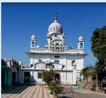
ਗੁਰ. ਫਲਾਹੀ ਸਾਹਿਬ ਵਡਾਲਾ ਗੁੰਬੀਆਂ

ਜਨੇਤ ਕੋ ਬਸਤਰ ਮੂਲੇ ਪਹਿਰਾਏ, ਐਸਾ ਧਰਮ ਕਾ ਬੀਆਹੁ ਹੂਆ। ਦਾਜ ਦਖਣਾ ਦੇ ਕਰ ਬਿਦਾ ਕੀਏ। ਬੀਆਹੁ ਕਰਿ ਕੈ ਤਲਵੰਡੀ ਆਏ। ਘਰਿ ਆਇ ਵੜੇ। ਦਾਜ ਬਿਸਤਾਰਿ ਕਰਿ ਕੁੜਮਾਂ ਪੰਚਾ ਨੇ ਦਿਖਾਇਆ। ਜਿਨ ਕੋ ਬਸਤਰ ਦੇਣੇ ਸੇ ਤਿਨ ਤਿਨ ਕਉ ਤੇਵਰ ਬੇਵਰ ਬਾਇ ਦੀਏ। ਲਾਗੀਅਹੁ ਲਾਗ ਲੀਏ, ਭਟਾਂ ਬ੍ਰਹਮਣਹੁ ਕਉ ਪਟੰਬਰ ਪਾਏ। ਸਰਬ ਲੋਕ ਖੁਸੀ ਹੋਏ।