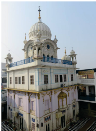
ਅੰਦਰ ਸੀਸੇ ਵਿਚ ਮੜੀ ਪਵਿਤ੍ਰ ਕੰਧ ਅਤੇ ਗੁਰਦੁਆਰਾ ਕੰਧ ਸਾਹਿਬ

ਤਬ ਗੁਰੂ ਬਾਬੇ ਨਾਨਕ ਜੀ ਕਉ ਨਵਾਲਣੈ ਲਾਗੈ। ਚਉਕੁ ਪੂਰਾਇ ਕਰ ਗੁਰੂ ਬਾਬਾ ਨਾਨਕ ਖਾਰੇ ਉਪਰਿ ਬੈਠਾਇਆ, ਨਵਾਲਿਆ, ਉਪਰ ਲਾਲ ਪਛੇਵੜਾ (ਕਪੜਾ ਜਿਹੜਾ ਤਾਣਦੇ ਨੇ, ਚੰਦੋਆ) ਤਾਣਿਆ ਅਰ ਇਸਤ੍ਰੀਅਹੁ ਸੋਹਿਲੇ ਗਾਏ। ਚਿਕਿ ਮਲ ਕਰ ਪੁਰਖਹੁ ਨਵਾਲਿਆ। ਤੇਲੁ, ਫੁਲੇਲੁ ਲਗਾਇਆ। ਜਲਿ ਇਸਨਾਨ ਕੀਆ। ਤਬ ਗੁਰੂ ਬਾਬੇ ਜੀ ਕਉ ਨਵਾਲਿ ਕਰਿ ਜਨੇਉ ਧੋਤੀ ਬ੍ਰਹਮਣ ਪਹਰਾਏ। ਭੀਨੀ ਧੋਤੀ ਉਤਾਰ ਰਾਖੀ। ਖਾਰੀ ਤੇ ਉਠਿ ਕਰ ਜੁਤੀ ਪਹਿਰਿ ਕਰ ਚਪਣੀਆਂ ਫੋਰੀਆਂ। ਫੋੜਿ ਕਰ ਜਹਾਂ ਵਿਛਾਵਣੇ ਬਾਹੇ ਥੇ ਉਹਾ ਹੀ ਗੁਰੂ ਬਾਬਾ ਨਾਨਕ ਜੀ ਆਇ ਬੈਠਾ। ਜੋੜਾ ਪਹਿਰਾਇਆ। ਤਿਲਕੁ ਲਗਾਇਆ। ਮੁਕਟੁ ਸਿਰਿ ਬਾਂਧਿਆ। ਮੇਹਰੇ ਸਿਰਿ ਬ੍ਰਹਮਣ ਚਾੜ੍ਹੇ। ਗਣੇਸ ਪੂਜਾ ਕਰੀ। ਕੁਲ ਪ੍ਰਵਾਰ ਜਿਤਨਾ ਥਾ ਤਥਾ ਮਹਾਜਨੁ ਸਭਨਾਹੁ ਤੰਬੋਲੁ ਪਾਇਆ। ਤਬ ਗੁਰੂ ਬਾਬੇ ਨਾਨਕ ਜੀ ਕਪੜੇ ਪਹਿਰੇ।