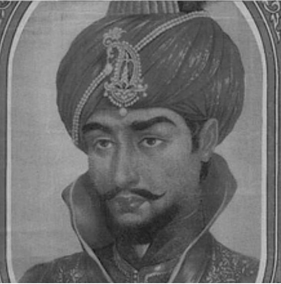
ਤਸਵੀਰ ਨੈਟ ਤੋਂ ਲਈ ਹੈ। ਤਸਵੀਰ ਹੇਠਾਂ ਦੌਲਤ ਖਾਂ ਲੋਧੀ ਲਿਖਿਆ ਹੈ। ਉਮੀਦ ਹੈ ਇਹ ਸੁਲਤਾਨ ਪੁਰ ਦੇ ਨਵਾਬ ਦੀ ਹੀ ਜਵਾਨੀ ਵੇਲੇ ਦੀ ਹੀ ਤਸਵੀਰ ਹੈ। ਜਵਾਨੀ ਵੇਲੇ ਵੀ ਦੌਲਤ ਦੀ ਚੰਗੀ ਚੜ੍ਹਤ ਹੋਵੇਗੀ ਕਿਉਂਕਿ ਇਸ ਦਾ ਪਿਤਾ ਸੂਬੇ ਦਾ ਗਵਰਨਰ ਸੀ। ਬਾਬਰ ਦੇ ਹਮਲੇ ਵੇਲੇ ਦੌਲਤ ਦੀ ਵੱਡੀ ਉਮਰ ਸੀ: ਅੰਦਾਜ਼ਨ 75-80 ਸਾਲ।

ਦਿੱਲੀ ਦੇ ਤਖਤ ਤੇ ਬਿਠਾਉਣ ਵਾਲਾ ਤਾਤਾਰ ਖਾਂ ਹੀ ਸੀ। ਇਸ ਤੋਂ ਪਹਿਲਾਂ ਤਾਤਾਰ ਨੇ 1470 ਦੇ ਨੇੜੇ ਜਦੋਂ ਮੁਲਤਾਨ ਦੇ ਰਾਜੇ ਸ਼ਾਹ ਹੁਸੈਨ (ਪੁੱਤਰ ਕੁਤੁਬੁਦੀਨ ਲੰਗਾਹ) ਨੇ ਗਾਜ਼ੀ ਖਾਂ ਕੋਲੋਂ ਸ਼ੇਰਕੋਟ ਦੀ ਰਿਆਸਤ ਖੋਹ ਲਈ ਤਾਂ ਦਿੱਲੀ ਸੁਲਤਾਨ (ਬਹਿਲੋਲ) ਲੋਧੀ ਨੇ ਆਪਣੇ ਪੁੱਤਰ ਬਰਬਕ ਖਾਂ ਨੂੰ ਸ਼ੇਰਕੋਟ ਭੇਜਿਆ ਤੇ ਤਾਤਾਰ ਖਾਂ ਨੂੰ ਹੁਕਮ ਕੀਤਾ ਕਿ ਉਹ ਆਪਣੀ ਪੰਜਾਬ ਦੀ ਸੈਨਾ ਨਾਲ ਬਰਬਕ ਦੀ ਮਦਦ ਕਰੇ ਤੇ ਸ਼ਾਹ ਹੁਸੈਨ ਦਾ ਕੰਮ ਤਮਾਮ ਕਰ ਦੇਣ। ਪਰ ਬਰਬਕ ਤੇ ਤਾਤਾਰ ਨਾਕਾਮ ਰਹੇ ਸਨ ਤੇ ਦਿੱਲੀ ਸੁਲਤਾਨ ਨੂੰ ਸਬਰ ਦਾ ਘੁੱਟ ਪੀਣਾ ਪਿਆ ਸੀ। ਤਾਰੀਖ ਤੋਂ ਹੋਰ ਪਤਾ ਲੱਗਦਾ ਹੈ ਕਿ ਤਾਤਾਰ ਖਾਂ ਨੇ ਇਕ ਵਾਰੀ ਬਹਿਲੋਲ ਦੇ ਅੰਬਾਲੇ ਲਾਗਲੇ ਖਾਲਸਾ ਇਲਾਕੇ ਤੇ ਕਬਜ਼ਾ ਕਰ ਲਿਆ। ਬਹਿਲੋਲ ਨੇ ਆਪਣੇ ਪੁੱਤਰ ਸਿਕੰਦਰ ਦੀ ਕਮਾਂਡ ਹੇਠ 1485ਈ 'ਚ ਫੌਜ ਘੱਲੀ। ਤਾਤਾਰ ਖਾਂ ਅੰਬਾਲੇ ਲਾਗੇ ਮਾਰਿਆ ਗਿਆ।