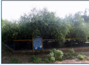
ਗੁਰਦੁਆਰਾ ਤੰਬੂ ਸਾਹਿਬ ਲਾਗੇ ਅੱਜ ਤਕ ਮੌਜੂਦ ਵਣਾਂ (ਪੀਲੂ) ਦੇ ਉਹ ਵਿਸ਼ਾਲ ਰੁੱਖ ਜਿਨ੍ਹਾਂ ਵਿਚ ਬਾਬਾ ਨਾਨਕ ਪਿਤਾ ਤੋਂ ਡਰਦਾ ਲੁੱਕਿਆ ਸੀ, ਸੱਚਾ ਸੌਦਾ ਕਰਨ ਉਪਰੰਤ (ਖੱਬ) ਬਾਹਰੀ ਫੋਟੋ ਅਤੇ (ਸੱਜੇ) ਰੁੱਖਾਂ ਅੰਦਰ ਵੜ੍ਹ ਕੇ ਲਈ ਫੋਟੋ। ਰੁੱਖਾਂ ਥੱਲੇ ਜਾ ਕੇ ਪਤਾ ਲਗਦਾ ਹੈ ਕਿ ਕਿਵੇਂ ਰੁੱਖਾਂ ਨੇ ਤੰਬੂ ਤਾਣਿਆ ਹੋਇਆ ਹੈ। (ਵਾਹਿਗੁਰੂ ਰੁੱਖਾਂ ਨੂੰ ਕਾਰ ਸੇਵਾ ਵਾਲਿਆਂ ਤੋਂ ਬਚਾ ਕੇ ਰੱਖੋ)

ਗੁਰੂ ਸਾਹਿਬ ਕੋਲ ਜਿਹੜੀ ਮਾਇਆ 20 ਰੁਪਏ ਸੀ, ਉਹ ਓਨਾਂ ਨੇ ਮਹੰਤ ਦੇ ਚਰਨਾਂ ਤੇ ਰੱਖ ਦਿੱਤੀ ਕਿ ਇਸ ਨਾਲ ਆਪਣੇ ਲਈ ਆਟਾ ਲੂਣ ਲੈ ਆਓ। ਮਹੰਤ ਨੇ ਕਿਹਾ ਕਿ ਅਸੀਂ ਮਾਇਆ ਨੂੰ ਹੱਥ ਨਹੀਂ ਲਾਉਂਦੇ ਜੇ ਤੁਹਾਡੇ 'ਚ ਸ਼ਰਧਾ ਹੈ ਤਾਂ ਸਾਨੂੰ ਰੋਟੀ ਖੁਆ ਦਿਓ।