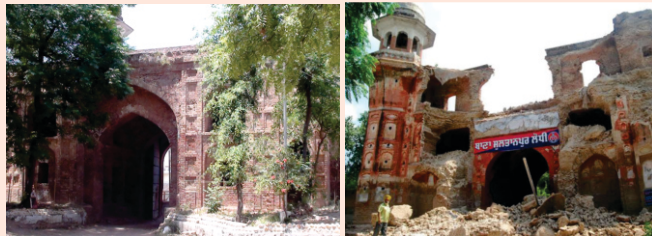
ਸਤੰਬਰ 2014 ਵਿਚ ਸੁਲਤਾਨਪੁਰ ਦਾ 700 ਸਾਲ ਪੁਰਾਣਾ ਦਰਵਾਜ਼ਾ ਅਕਾਲੀ ਸਰਕਾਰ ਦੀ ਨਲਾਇਕੀ ਕਰਕੇ ਡਿੱਗ ਪਿਆ। ਇਸ ਦਰਵਾਜ਼ੇ ਥਾਂਣੀ ਗੁਰੂ ਸਾਹਿਬ ਹਜ਼ਾਰਾਂ ਵਾਰੀ ਨਿਕਲੇ ਹੋਣਗੇ। 1. ਉੱਤੇ ਬਾਹਰ ਗਲੀ ਪਾਸਿਓ ਗੇਟ ਦੀ ਫੋਟੋ। 2. ਕਿਲੇ ਦੇ ਅੰਦਰ ਪਾਸਿਓ। 3. ਹੇਠਾਂ ਡਿੱਗਾ ਗੇਟ।