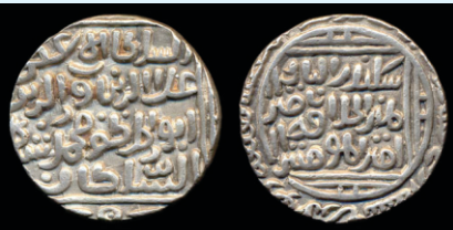
ਸਿਕੰਦਰ ਲੋਧੀ ਦਾ ਚਾਂਦੀ ਦਾ ਰੁਪਿਆ। ਇਹ 20 ਰੁਪਏ ਗੁਰੂ ਸਾਹਿਬ ਨੇ, ਖਰਚੇ ਸਨ, ਸੱਚਾ ਸੌਦਾ ਵੇਲੇ।

ਸਿਕੰਦਰ ਲੋਧੀ ਦਾ ਚਾਂਦੀ ਦਾ ਸਿੱਕਾ 9.5 ਗ੍ਰਾਮ (ਸਾਢੇ ਨੌਂ) ਦਾ ਹੁੰਦਾ ਸੀ। ਇਸ ਪ੍ਰਕਾਰ ਗੁਰੂ ਸਾਹਿਬ ਦੇ 20 ਸਿਕਿਆਂ ਦਾ ਵਜਨ ਹੋ ਗਇਆ ਕੋਈ 190 ਗ੍ਰਾਮ। ਅੱਜ ਚਾਂਦੀ ਦਾ ਭਾਅ ਕੋਈ 40000 ਰੁਪਏ ਕਿਲੋ ਹੈ। ਸੋ ਅੱਜ ਦੇ