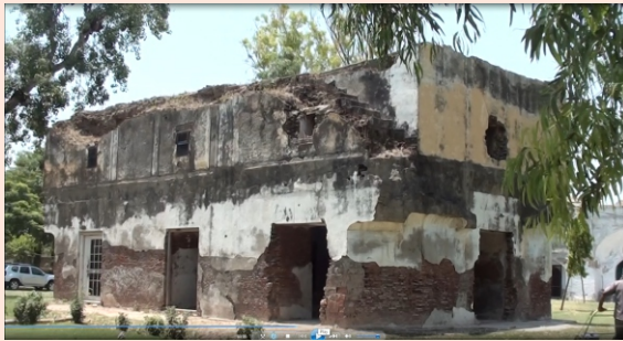
ਸੁਲਤਾਨਪੁਰ ਲੋਧੀ ਦੇ ਕਿਲੇ ਅੰਦਰ ਮੌਜੂਦ ਦੌਲਤ ਖਾਂ ਲੋਧੀ ਦਾ ਦਰਬਾਰ (ਮਹੱਲ) ਜਿਥੇ ਗੁਰੂ ਸਾਹਿਬ ਦੀ ਇੰਟਰਵਿਊ ਹੋਈ ਤੇ ਬਾਦ ਵਿਚ ਵੀ ਕਈ ਵਾਰ ਨਵਾਬ ਨਾਲ ਇਥੇ ਗੁਫਤਗੂ ਹੁੰਦੀ ਰਹੀ। ਦਰਬਾਰ ਦਾ ਗੁੰਬਦ ਅੰਗਰੇਜ਼ਾਂ ਵੇਲੇ ਡਿੱਗ ਪਇਆ ਸੀ ਪਰ ਸਿਆਣੇ ਹੁਕਮਰਾਨ ਨੇ ਨਵੀਂ ਛੱਤ ਪਾ ਕੇ ਇਮਾਰਤ ਸਾਂਭ ਲਈ ਸੀ।

ਗੁਰੂ ਸਾਹਿਬ ਨੇ ਚੋਣੀ ਨੂੰ ਕਿਹਾ ਭਲੀਏ ਲੋਕੇ ਪਹਿਲਾਂ ਮੈਨੂੰ ਜਾਣ ਦੇ। ਮੈਂ ਜਾ ਕੇ ਕੋਈ ਕਾਰੋਬਾਰ ਨੌਕਰੀ ਲਭਦਾ ਵਾਂ। ਘਰ ਲੈ ਕੇ ਫਿਰ ਤੈਨੂੰ ਆਪ ਆ ਕੇ ਲੈ ਜਾਵਾਂਗਾ। ਸੁਲਤਾਨ ਪੁਰ ਲੋਧੀ ਕਿਹੜਾ ਪ੍ਰਦੇਸ ਆ। ਰੋਜ਼ ਲੋਕੀ ਆਉਂਦੇ ਜਾਂਦੇ ਰਹਿੰਦੇ ਨੇ। ਪਰ ਮਾਤਾ ਨਹੀ ਸੀ ਮੰਨੀ।