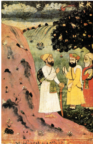
ਸੱਜਣ ਠੱਗ ਦਾ ਸਮੱਰਪਣ -ਬੀ.40

ਜਵਾਨੀ ਤਾਂ ਛੱਡੋ ਗੁਰੂ ਸਾਹਿਬ ਅਲੜ ਉਮਰੇ ਵੀ ਨੇੜੇ ਤੇੜੇ ਦਾ ਕੋਈ ਧਾਰਮਿਕ ਮੇਲਾ ਇਕੱਠ ਨਹੀਂ ਸਨ ਛੱਡਦੇ। ਮੁਲਤਾਨ ਵਿਚ ਤਿੰਨ ਚਾਰ ਸਾਲਾਨਾ ਮੇਲੇ ਲੱਗਦੇ ਆਏ ਨੇ। ਇਥੋਂ ਦੇ ਤਿੰਨ ਤਾਂ ਉਰਸ ਹੀ ਮਸ਼ਹੂਰ ਨੇ ਜਿਸ ਵਿਚ ਲੱਖਾਂ ਲੋਕ ਸ਼ਿਰਕਤ ਕਰਦੇ ਹਨ। ਹੋ ਸਕਦਾ 15ਵੀਂ ਸਦੀ ਤਕ ਓਥੇ ਕੋਈ ਹਿੰਦੂ ਜਾਂ ਸਭਿਆਚਾਰਕ ਮੇਲਾ ਵੀ ਮੁਲਤਾਨ ਦਾ ਮਸ਼ਹੂਰ ਹੋਏ ਜੋ ਬਾਦ ਵਿਚ ਇਸਲਾਮੀ ਅਸਰ ਵੱਧਣ ਕਾਰਨ ਹੌਲੀ ਹੌਲੀ ਖਤਮ ਹੀ ਹੋ ਗਇਆ ਹੋਵੇ। ਸਾਨੂੰ ਭੁਲਣਾ ਨਹੀਂ ਚਾਹੀਦਾ ਕਿ ਮੁਲਤਾਨ ਦਾ ਮਜ਼੍ਹਬੀ ਇਤਹਾਸ ਪੂਰੇ ਉੱਤਰੀ ਭਾਰਤ ਵਿਚ ਭਰਪੂਰ ਰਿਹਾ ਹੈ। ਗਲ ਅੰਦਾਜ਼ਨ 1492/93 ਈ ਦੀ ਹੋਵੇਗੀ ਗੁਰੂ ਸਾਹਿਬ ਵੀ ਭਾਈ ਮਰਦਾਨੇ ਨਾਲ ਮੁਲਤਾਨ ਕਿਸੇ ਮੇਲੇ ਤੇ ਚਲੇ ਗਏ।