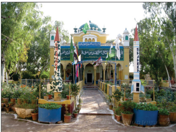
ਤੁਲੰਭੇ ਲਾਘੇ ਮਖਦੂਮਪੁਰ ਪਹੋੜਾਂ ਵਿਖੇ ਸੱਜਣ ਠੱਗ ਵਾਲਾ ਗੁਰਦੁਆਰਾ ਅੱਜ ਵਿਦਿਆ ਦਾ ਚਾਨਣ ਦੇ ਰਿਹਾ ਹੈ। ਅੱਜ ਹਾਈ ਸਕੂਲ ਚੱਲ ਰਿਹਾ ਹੈ।

ਸ਼ਾਮੀ ਲੰਗਰ ਪਾਣੀ ਖੁਆ ਕੇ ਮਰਦਾਨੇ ਨੂੰ ਤਾਂ ਉਹਦਾ ਨੌਕਰ ਆਪਣੇ ਨਾਲ ਖੱਬੇ ਸੱਜੇ ਕਿਤੇ ਲੈ ਗਇਆ ਅਤੇ ਗੱਲਾਂ ਬਾਤਾਂ ਮਾਰਨ ਲੱਗ ਪਿਆ ਅਤੇ ਮਰਦਾਨੇ ਕੋਲੋਂ ਸੂਹਾ ਲੈਣ ਲੱਗ ਪਿਆ ਕਿ ਦੱਸ ਤੇਰੇ ਅਤੇ ਤੇਰੇ ਸਾਥੀ ਕੋਲ ਕੀ ਪੈਸਾ ਪੈਲਾ ਹੈ?