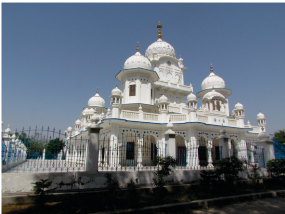
ਮੋਦੀਖਾਨੇ ਵਾਲੀ ਥਾਂ ਤੇ ਅੱਜ ਬਣਿਆ ਗੁਰਦੁਆਰਾ ਹੱਟ ਸਾਹਿਬ