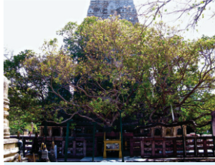
ਬੋਧ ਗਇਆ ਦਾ ਮਹਾਂ ਬੋਧੀ ਬੋੜ ਜਿਹਦੇ ਥੱਲੇ ਬੈਠ ਮਹਾਤਮਾ ਬੁੱਧ ਨੂੰ ਗਿਆਨ ਦੀ ਪ੍ਰਾਪਤੀ ਹੋਈ ਸੀ।

ਕਿਉਂਕਿ ਬੋਧੀ ਨਿਰੰਕਾਰ ਦੀ ਹੋਂਦ ਤੋਂ ਆਕੀ ਹਨ ਲੱਗਦੇ ਹੈ ਕਿ ਗੁਰੂ ਸਾਹਿਬ ਨੇ ਇਥੇ ਵੀ ਚੌਖਾ ਸਮਾਂ ਬਿਤਾਇਆ ਹੋਵੇਗਾ ਉਨਾਂ ਨੂੰ ਸਮਝਾਉਣ ਤੇ। ਫਿਰ ਬੁੱਧਮਤ ਵੀ ਬੰਦੇ ਨੂੰ ਸੰਨਿਆਸ ਵਲ ਧਕਦਾ ਹੈ ਇਸ ਮਸਲੇ ਤੇ ਗੱਲਾਂ ਬਾਤਾਂ ਹੋਈਆਂ ਹੋਣਗੀਆਂ। ਇਸ ਸਬੰਧ ਵਿੱਚ ਬਹੁਤ ਸਾਰੀ ਬਾਣੀ ਮਿਲਦੀ ਹੈ ਪਰ ਸਾਫ ਤੌਰ ਤੇ ਇਹ ਕਹਿਣਾ ਕਿ ਕਿਹੜਾ ਸ਼ਬਦ ਇਥੇ ਰਚਿਆ ਕਹਿਣਾ ਮੁਸ਼ਕਲ ਹੈ। ਪਰ ਜੈਨੀ ਹਿੰਸਾ ਅਹਿੰਸਾ ਦੀ ਬੜੀ