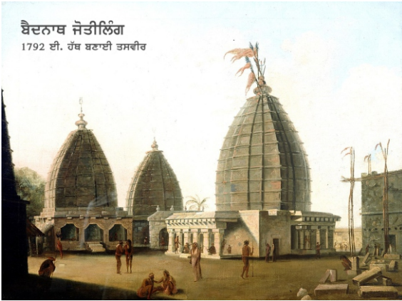
ਬੈਦਨਾਥ ਜੋਤੀਲਿੰਗ 1792 ਈ. ਹੱਥ ਬਣਾਈ ਤਸਵੀਰ

ਬਣਦਾ ਹੈ। ਨਹੀਂ ਤਾਂ ਸਾਡੇ ਮੰਨ ਤੇ ਬੋਝ ਰਹਿੰਦਾ ਹੈ। ਬੇਸ਼ੱਕ ਨਾਂ ਖਾਓ ਪਰ ਥੋੜਾ ਬਹੁਤ ਤਾਂ ਮੂੰਹ ਮਾਰ ਹੀ ਲੈਂਦੇ। ਫਿਰ ਅਸੀਂ ਤੁਹਾਡੀ ਖੂਬ ਚਰਚਾ ਸੁਣੀ ਹੈ ਪਰ ਇਥੇ ਤੁਸੀਂ ਬੋਲੇ ਵੀ ਨਹੀਂ। ਸਾਡੇ ਮਨਾਂ ਵਿੱਚ ਇਹ ਗੱਲ ਆ ਰਹੀ ਸੀ ਕਿ ਸ਼ਾਇਦ ਅਸੀਂ ਪਾਪੀ ਬੰਦੇ ਹਾਂ ਕਿ ਭਗਵਾਨ ਦਾ ਪਿਆਰਾ ਸਾਡੇ ਵਿੱਚ ਆ ਕੇ ਚੁੱਪ ਹੋ ਗਇਆ ਵਾ।