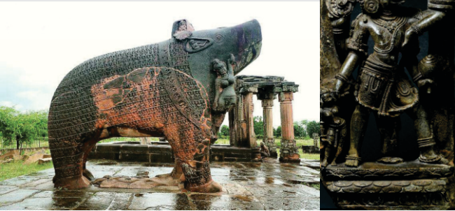
ਵਿਸ਼ਨੂੰ ਭਗਵਾਨ ਦਾ ਵਰਾਹ ਅਰਥਾਤ ਸੂਰ ਅਵਤਾਰ। ਪਰ ਇਹ ਵਿਸ਼ਾਲ ਮੂਰਤੀਆਂ ਸਾਗਰ ਐਮ ਪੀ (ਖੱਬੇ) ਅਤੇ ਉੜੀਸਾ (ਸੱਜੀ) ਤੋਂ।

ਇਥੋਂ ਭਾਵ ਜਨਕਪੁਰ ਦੇ ਇਲਾਕੇ ਤੋਂ ਫਿਰ ਸਾਹਿਬ ਪੂਰਬ ਵਲ ਨੂੰ ਹੁੰਦੇ ਹਨ।