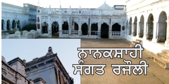
ਨਾਨਕਸ਼ਾਹੀ ਸੰਗਤ ਰਜੌਲੀ

ਗਇਆ ਤੇ ਸਿੱਖੀ ਧਾਰਨ ਕੀਤੀ। ਉਹਦੇ ਅਸਥਾਨ ਤੇ ਜੋ ਇਮਾਰਤ ਹੈ ਛੋਟੀ ਸੰਗਤ ਧਰਮਸਾਲ ਕਹਾਉਂਦੀ ਹੈ। ਇਥੋਂ ਦਾ ਮਹੰਤ ਅਮੂਮਨ ਮੁਸਲਮਾਨ ਹੋਇਆ ਕਰਦੇ ਹਨ। ਜਿੱਥੇ ਗੁਰੂ ਸਾਹਿਬ ਸ਼ੁਰੂ 'ਚ ਪਧਾਰੇ ਸਨ ਉਹ ਬੜੀ ਸੰਗਤ ਕਹਾਉਂਦੀ ਹੈ। ਇਥੇ ਗੁਰੂ ਗ੍ਰੰਥ ਸਾਹਿਬ ਪ੍ਰਕਾਸ਼ਮਾਨ ਹਨ ਤੇ ਵੱਡੀ ਇਮਾਰਤ