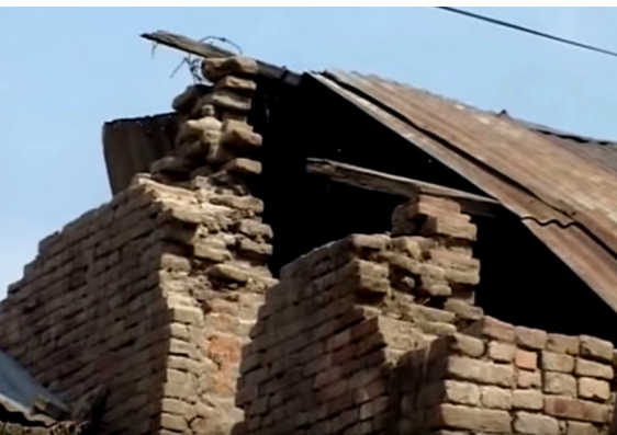
ਗੁਰੂ ਨਾਨਕ ਮੱਠ, ਨੇੜੇ ਪਸ਼ੁਪਤੀ ਮੰਦਰ ਦੀ ਖਸਤਾ ਹਾਲ ਇਮਾਰਤ

ਨਾਨਕ ਮੱਠ ਨੂੰ ਅਲਾਟ ਕਰ ਦਿਤੀ। ਅਖੇ ਮੱਠ ਦੇ ਗੁਰਸਿੱਖ ਜੋਗੀਆਂ ਨੇ ਉਹ ਸ਼ਾਹੀ ਫਰਮਾਨ ਅੱਜ ਤਕ ਸਾਂਭਿਆ ਹੋਇਆ ਹੈ। ਜਦੋਂ ਕਿ ਸੱਚ ਇਹ ਹੈ ਕਿ ਜ਼ਮੀਨ ਦਾ ਪੱਟਾ 1800 ਈ. 'ਚ ਜਾਰੀ ਹੋਇਆ ਸੀ। ਉਹ ਵੀ ਉਸ ਵੇਲੇ ਜਦੋਂ ਪੰਜਾਬ ਦੇ ਇਲਾਕਿਆਂ ਵਿਚ ਉਠੀਆਂ ਸਿੱਖ ਮਿਸਲਾਂ ਦੇ ਰਾਜ ਨੇ ਪੂਰੇ ਭਾਰਤੀ ਉਪਮਹਾਂਦੀਪ ਵਿਚ ਮੁਗਲਾਂ ਦੇ ਦੰਦ ਖੱਟ ਕਰਕੇ ਤੇ ਨਿਆਂ ਦੇ ਰਾਜ ਕਰਕੇ ਨਾਮਣਾ ਖੱਟਿਆ ਸੀ ਅਤੇ ਲਹੌਰ ਵਿਚ ਮਹਾਰਾਜਾ ਰਣਜੀਤ ਸਿੰਘ ਨੇ ਇਨਸਾਨੀਅਤ ਪੱਖੀ ਹਕੂਮਤ ਖੜੀ ਕਰ ਦਿਤੀ ਸੀ। ਭਾਵ ਕਿ ਇਹ ਗੁਰੂ ਨਾਨਕ ਦੇ ਚਮਤਕਾਰ ਸਦਕਾ ਖੜੀ ਹੋਈ ਰਾਜ ਦੀ ਹੋਂਦ ਦਾ ਹੀ ਕਮਾਲ ਸੀ। ਕਹਿਣ ਤੋਂ ਮਤਲਬ ਜਦੋਂ ਕਿਸੇ ਕੌਮ ਦੀ ਰਾਜਨੀਤਕ ਹਾਲਤ ਸੁਖਾਵੀਂ ਹੁੰਦੀ ਹੈ ਤਾਂ ਗਵਾਂਢੀ ਜਾਂ ਦੂਸਰੇ ਵੀ ਕਦਰ ਕਰਦੇ ਨੇ। ਲਹੌਰ ਵਿਚ ਰਾਜ ਹੋਣ ਕਰਕੇ ਨੇਪਾਲੀ ਰਾਜੇ ਨੇ ਸਿੱਖੀ ਦੀ ਵੱਧ ਕਦਰ ਕੀਤੀ ਸੀ।