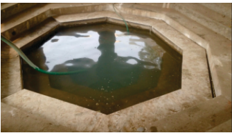
ਗੁਰਦੁਆਰਾ ਸੀਤਲ ਜਲ ਚਸ਼ਮਾ, ਰਾਜਗੀਰ

ਨੇ ਰਾਜਧਾਨੀ ਪਾਟਲੀਪੁਤ੍ਰ ਬਣਾ ਲਈ ਸੀ। ਜੈਨ ਧਰਮ ਦੇ ਭਗਵਾਨ ਮਹਾਂਵੀਰ ਨੇ ਇਥੇ 14 ਸਾਲ ਬਿਤਾਏ।