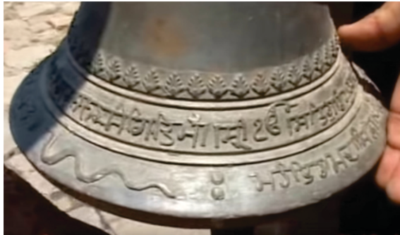
ਨਾਨਕ ਮੱਠ, ਮੰਦਰ ਸੋਭਾ ਭਾਗਵਤੀ, ਕਾਠਮੰਡੂ ਦੇ ਲਾਗੇ ਮੌਜੂਦ ਸਿੰਧ ਵਾਟਿਕਾ ਤੇ ਲਮਕਦਾ 1884 ਈ. ਦਾ ਟੱਲ ਜਿਸ ਤੇ ਗੁਰਮੁਖੀ ਦੇ ਅੱਖਰ ਢਲੇ ਹੋਏ ਹਨ।

ਭਾਵ ਜਨਕਪੁਰ ਰਾਜਬਿਰਾਜ ਅਤੇ ਬਿਰਾਟਨਗਰ ਦਾ ਪਹਾੜ ਪਾਸਾ ਗਾਹਿਆ। ਜਨਕਪੁਰ ਜਿਆਦਾ ਪੁਰਾਣਾ ਸ਼ਹਿਰ ਤਾਂ ਨਹੀਂ ਹੈ। ■ ਰਾਜੇ ਜਨਕ ਦੇ ਮੂਲ ਸ਼ਹਿਰ ਦਾ ਤਾਂ ਕੋਈ ਅਤਾ ਪਤਾ ਨਹੀਂ ਲਗਦਾ। ਉੱਜ ਵੀ ਇਹ ਸਭ ਮਿਥਿਹਾਸ ਹੀ ਗਿਣਿਆ ਜਾਂਦਾ ਹੈ। ਯਾਦ ਰਹੇ ਹਿੰਦੂ ਮਿਥਹਾਸ ਦੀ ਸੀਤਾ ਇਥੇ ਹੀ ਰਾਜਾ ਜਨਕ ਨੂੰ ਹਲ ਵਾਹੁਦਿਆਂ ਸਿਆੜ ਵਿਚੋਂ ਮਿਲੀ ਸੀ। ਰਾਜੇ ਨੇ ਉਹਨੂੰ ਆਪਣੀ ਧੀ ਵਾਗੂ ਪਾਲਿਆ ਅਤੇ ਉਹਦੇ ਜਵਾਨ ਹੋਣ ਤੇ ਸ਼ਰਤ ਰੱਖ ਦਿਤੀ ਸੀ ਕਿ ਸੀਤਾ ਦਾ ਵਿਆਹ ਉਹਦੇ ਨਾਲ ਹੋਵੇਗਾ ਜੇ ਸੀਤਾ ਦਾ ਧਣੁ ਚੁੱਕ ਸਕੇਗਾ। ਓਦੋਂ ਫਿਰ ਅਯੁਧਿਆ ਨਗਰੀ ਦੇ ਰਾਜਕੁਮਾਰ ਰਾਮ ਨੇ ਉਹ ਧਣੁ ਬਾਣ ਚੁੱਕਿਆ ਸੀ। ਮਿਥਿਲਾ ਦੇ ਰਾਜਿਆਂ ਨੂੰ ਜਨਕ ਰਾਜੇ ਕਿਹਾ ਜਾਂਦਾ ਸੀ। ਅੱਜ ਮਿਥਿਲਾ ਦਾ ਕੁਝ ਇਲਾਕਾ ਨੇਪਾਲ ਵਿਚ ਤੇ ਬਾਕੀ ਬਿਹਾਰ ਅਤੇ ਯੂ ਪੀ ਵਿਚ ਪੈਂਦਾ ਹੈ। ਹਾਲਾਂ ਪੂਰਨੀਆ ਅਤੇ ਸੀਤਾਮੜੀ ਪੁਰਾਣੇ ਸ਼ਹਿਰ ਨੇ ਜਨਕਪੁਰ ਸ਼ਹਿਰ ਦੀ ਨੀਂਹ 200 ਸਾਲ ਪਹਿਲਾਂ ਹੀ ਰੱਖੀ ਗਈ ਸੀ ਕਿਉਂਕਿ ਇਥੋਂ ਸੋਨੇ ਦੀ ਜਨਾਨਾ ਮੂਰਤੀ ਨਿਕਲੀ ਸੀ ਜਿਸ ਨੂੰ