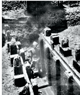
ਮੌਰੀਆ ਕਾਲ ਦਾ ਲੱਕੜੀ ਤੇ ਮਿੱਟੀ ਦਾ ਪਾਟਲੀਪੁਤਰ ਕਿਲਾ ਜਿਸ ਦੇ ਆਸਾਰ ਖੁਦਾਈ ਦੌਰਾਨ ਨਿਕਲਦੇ ਹਨ

ਪਟਨਾ ਪੁਰਾਣੇ ਜਮਾਨੇ ਦੇ ਪਾਟਲੀਪੁਤਰ ਸ਼ਹਿਰ ਦਾ ਹੀ ਨਵਾਂ ਰੂਪ