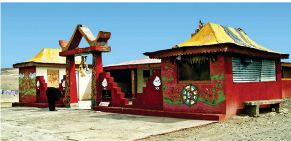
ਕਿਸੇ ਵੇਲੇ ਗੁਰਦੁਆਰਾ ਗੁਰੂ ਡਾਂਗਮਾਰ ਸਾਹਿਬ। ਫਿਰ ਇਸਨੂੰ ਸਰਬ ਧਰਮ ਅਸਥਾਨ ਬਣਾਇਆ ਤੇ ਅੱਜ ਨਿਰੋਲ ਬੋਧੀ ਮੱਠ ਬਣ ਚੁੱਕਾ ਹੈ। ਗੁਰੂ ਗ੍ਰੰਥ ਸਾਹਿਬ ਨੂੰ ਅਗਲਿਆਂ ਕੱਢ ਕੇ ਚੁੰਗਾਥਾਂਗ ਵਿਖੇ ਸੜਕ ਤੇ ਰੱਖ ਦਿੱਤਾ ਸੀ।

ਭੂਤਨ - ਇਹ ਸਥਾਨ ਤਿੱਬਤ-ਭੂਟਾਨ ਸਰਹੱਦ ਤੇ 18223 ਫੁੱਟ