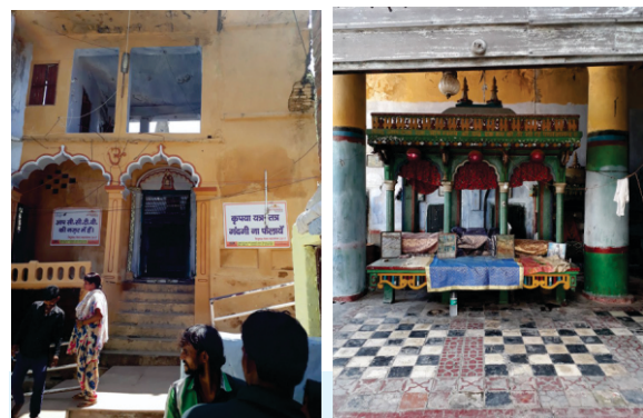
ਵਿਸ਼ਨੂਪਦ ਮੰਦਰ ਦੇ ਨਾਲ ਹੀ ਮੌਜੂਦ ਹੈ ਗੁਰਦੁਆਰਾ ਦਿਓ ਘਾਟ ਸਾਹਿਬ ਜਿਥੇ ਗੁਰੂ ਸਾਹਿਬ ਨੇ ਡੇਰਾ ਕੀਤਾ ਸੀ। ਇਹ ਅੱਜ ਕਲ ਬੰਦ ਹੈ ਕਿਉਂਕਿ ਇਸ ਦੀ ਮਲਕੀਅਤ ਨੂੰ ਲੈ ਕੇ ਅੰਦਾਲਤ ਵਿਚ ਕੇਸ ਚਲ ਰਿਹਾ ਹੈ। ਯਾਦ ਰਹੇ ਬਾਬਾ ਸ੍ਰੀ ਚੰਦ ਦੇ ਉਦਾਸੀ ਅੱਜ ਵਾਪਸ ਹਿੰਦੂ ਧਰਮ ਵਲ ਪਰਤ ਰਹੇ ਨੇ।

ਇਨਾਂ ਕਹਿਣਾਂ ਸੀ ਕਿ ਹਿਰਦੇ ਤੋਂ ਦੁੱਖੀ ਆਪ ਵੀ ਪੰਡਾ ਰੋ ਪਿਆ ਕਿ ਬਾਬਾ ਮੇਰਾ ਵੀ ਦੀਵਾ ਵੱਟੀ ਕਰ ਦੇ। ਸੋ ਬਾਬੇ ਨੇ ਪਾਂਡਿਆਂ ਨੂੰ ਵੀ ਨਿਰੰਕਾਰ ਦੀ ਸਿਫਤ ਸਲਾਹ ਵਿੱਚ ਲਾਇਆ ਤੇ ਅੱਗੇ ਤੋਂ ਵਾਇਦਾ ਲਿਆ ਕਿ ਗਰੀਬ ਜਨਤਾ ਦਾ ਸ਼ੋਸ਼ਣ ਨਹੀਂ ਕਰਨਗੇ, ਜਾਤ ਦੇ ਨਾਂ ਕਿਸੇ ਨੂੰ ਨਫਰਤ ਨਹੀਂ ਕਰਨੀ, ਧਰਮ ਦੀ ਕਿਰਤ ਕਰਨੀ, ਵਾਧੂ ਦੀਆਂ ਰਸਮਾਂ ਨਹੀਂ ਪਾਲਣੀਆ ਕਿ ਰੋਟੀ ਵੇਲੇ ਚੌਕਾਕਾਰ ਕੱਢਣਾ, ਵਰਤ ਰੱਖਣ ਵਾਸਤੇ ਲੋਕਾਂ ਨੂੰ ਪ੍ਰੇਰਨਾ ਦੇਣੀਆਂ, ਸਬਰ ਸੰਤੋਖ ਨਾਲ ਜੀਵਨ ਬਤੀਤ ਕਰਨਾਂ, ਰੱਬ ਦੀ ਰਜਾ ਵਿੱਚ ਰਾਜੀ ਰਹਿਣਾ। ਮਹੰਤ ਨੇ ਮੁੱਖ ਮੰਦਰ ਭਾਵ ਵਿਸ਼ਨੂੰ