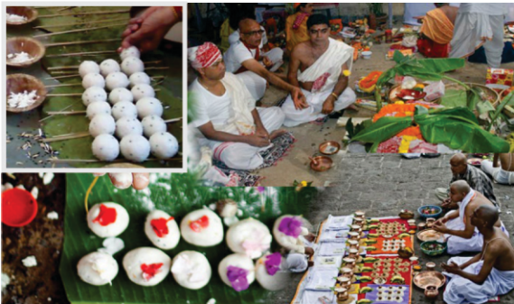
ਗਇਆ ਦਾ ਪਿੰਡ ਦਾਨ- ਬਾਬੇ ਨੇ ਕਿਹਾ ਤੁਹਾਡੀਆਂ ਇਹ ਗਰੇਲੀਆਂ ਬਜ਼ਰਗਾਂ ਤਕ ਨਹੀਂ ਪਹੁੰਚਦੀਆਂ। ਕਿਉਂ ਲੋਕਾਈ ਨੂੰ ਮੁਰਖ ਬਣਾਉਂਦੇ ਹੋ।

ਵਿਸ਼ਨੂੰ ਪਦ ਮੰਦਰ ਇਸ ਕਰਕੇ ਮਸ਼ਹੂਰ ਹੈ ਕਿਉਂਕਿ ਇਥੇ ਪੱਥਰ ਤੇ 16 ਇੰਚ ਲੰਮੇ ਇੱਕ ਪੈਰ ਦਾ ਨਿਸ਼ਾਨ ਹੈ। ਹਿੰਦੂਆਂ ਦਾ ਮੰਨਣਾ ਹੈ ਕਿ ਇਹ ਭਗਵਾਨ ਵਿਸ਼ਨੂੰ ਦਾ ਪੈਰ ਹੈ।