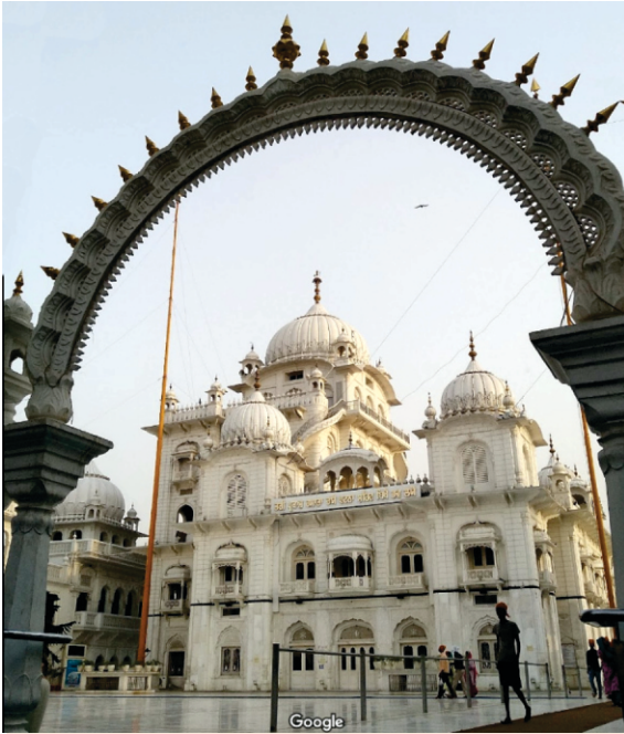
ਹਰਿਮੰਦਰ ਸਾਹਿਬ ਪਟਨਾ

ਪਟਨੇ ਦੀ ਬਸਤੀ ਬਿਸ਼ੰਭਰ ਪੁਰ ਦੇ ਲਾਗੇ ਜਦੋਂ ਗੁਰੂ ਸਾਹਿਬ ਪਹੁੰਚੇ ਤਾਂ ਵਿਚਾਰਾ ਮਰਦਾਨਾ ਭੁੱਖ ਨਾਲ ਬੇਹਾਲ ਸੀ। ਗੁਰੂ ਸਾਹਿਬ ਨੇ ਮਰਦਾਨੇ ਨੂੰ ਕਿਹਾ ਕਿ ਪਤਾ ਇਸ ਥਾਂ ਦਾ ਨਾਂ ਕੀ ਹੈ?