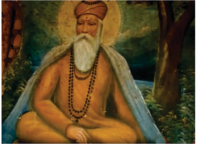
ਗੁਰਦੁਆਰਾ (ਮੱਠ) ਥਾਪਾਥਲੀ, ਕਾਠਮੰਡੂ ਦੀ ਕੰਧ ਤੇ ਗੁਰੂ ਸਾਹਿਬ ਦਾ ਪੁਰਾਣਾ ਬਣਿਆ ਹੋਇਆ ਚਿੱਤ੍ਰ। ਪਤਾ ਨਹੀਂ ਲੱਗਾ 2015 ਦੇ ਭੂਚਾਲ ਦੌਰਾਨ ਕੰਧ ਬਚੀ ਹੈ ਜਾਂ ਨਹੀਂ।

ਦਾਖਲਾ- ਗੁਰੂ ਸਾਹਿਬ ਬਨਾਰਸ ਤੋਂ ਚਲ ਕੇ ਹਾਜ਼ੀਪੁਰ (ਪਟਨਾ) ਪਹੁੰਚਦੇ ਨੇ। ਇਥੇ ਕੁਝ ਦਿਨ ਨਾਮ ਦਾ ਪ੍ਰਚਾਰ ਕੀਤਾ ਅਤੇ ਇਲਾਕੇ (ਬਿਹਾਰ, ਬੰਗਾਲ, ਨੇਪਾਲ, ਅਸਾਮ, ਨਾਗਾਲੈਂਡ) ਦੇ ਰਾਜਨੀਤਕ ਅਤੇ ਧਾਰਮਿਕ ਹਾਲਾਤਾਂ ਨੂੰ ਸਮਝਿਆ। ਯਾਦ ਰਹੇ ਬੰਗਾਲ, ਬਿਹਾਰ ਦੀਆਂ ਕਈ ਰਿਆਸਤਾਂ ਖਿੱਚ ਦਾ ਕੇਂਦਰ ਬਣੀਆਂ ਹੋਈਆਂ ਸਨ। ਹਾਜ਼ੀਪੁਰ ਵਿਚ ਫਿਰ ਕਾਠਮੰਡੂ ਦੀ ਧਾਰਮਿਕ ਅਤੇ ਸਭਿਆਚਾਰਕ ਅਮੀਰੀ ਦੀ ਗਲ ਵੀ ਚਲ ਰਹੀ ਸੀ। ਪਟਨੇ ਤੋਂ 1510 ਈ ਦੇ ਸ਼ੁਰੂ ਵਿਚ ਗੁਰੂ ਸਾਹਿਬ ਜਨਕ ਰਾਜਿਆਂ ਦੀ ਧਰਤੀ ਮਿਥਿਲਾ ਦੇਸ ਭਾਵ ਬਿਹਾਰ ਦੇ ਉਤਰੀ ਭਾਗ ਬਾਣੀ ਭਾਵ ਪਟਨੇ ਤੋਂ ਵੈਸ਼ਾਲੀ, ਕੇਸਰੀਆ, ਅੱਜ ਦਾ ਮੋਤੀਹਾਰੀ, ਗਾਹਵਾ (ਅੱਜ ਦਾ ਬੀਰਗੰਜ), 310 ਕਿ. ਮੀ ਦਾ ਪੈਂਡਾ ਕਰਦੇ ਹੋਏ ਕਾਠਮੰਡੂ ਪਹੁੰਚੇ ਸਨ। ◯