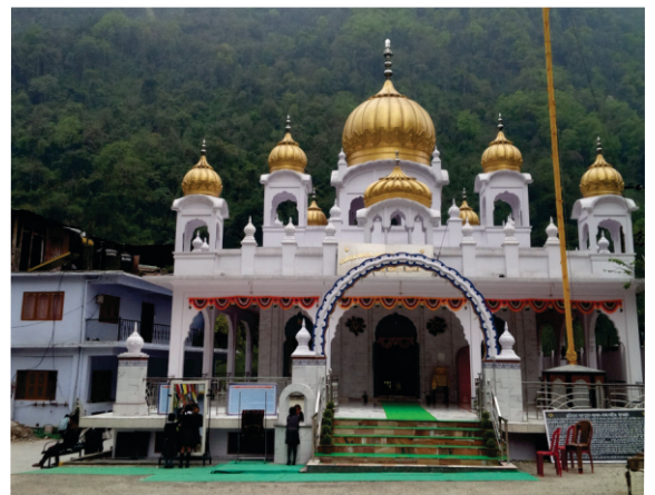
ਚੁੰਗਥਾਂਗ - ਅੱਜ ਕਾਰਸੇਵਾ ਵਾਲਿਆਂ ਨੇ ਹੋਰ ਵੀ ਸ਼ਾਨਦਾਰ ਗੁਰਦੁਆਰਾ ਬਣਾ ਕੇ ਬੋਧੀਆਂ ਨੂੰ ਹੋਰ ਵੀ ਚਿੜਾ ਦਿੱਤਾ ਹੈ।