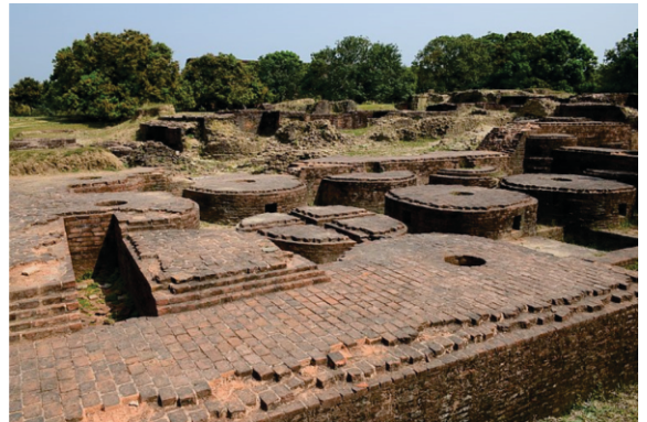
ਕਈ ਕਿਲੋਮੀਟਰਾਂ 'ਚ ਫੈਲੇ ਗੌੜ ਦੇ ਖੰਡਰ ਕਹਾਣੀ ਦੱਸ ਰਹੇ ਨੇ ਕਿ ਇਸ ਨਾਸ਼ਵਾਨ ਸੰਸਾਰ ਵਿਚ ਕੁਝ ਵੀ ਸਥਾਈ ਨਹੀਂ।

ਮਨੁੱਖਤਾ ਦੇ ਪੈਰੀਬਰ ਗੁਰੂ ਨਾਨਕ ਨੂੰ ਸੁਲਤਾਨ ਦੀ ਇਹ ਸੋਚ