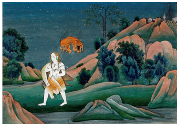
ਪਾਰਬਤੀ ਦੀ ਲਾਸ਼ ਚੁੱਕੀ ਸ਼ਿਵ ਜੀ ਜਾ ਰਹੇ ਨੇ। ਅਖੇ ਅੰਗ ਡਿੱਗਦੇ ਜਾ ਰਹੇ ਨੇ।

ਸਲੋਕੁ ਮਃ ੧ ॥ ਸੁਇਨੇ ਕੈ ਪਰਬਤਿ ਗੁਫਾ ਕਰੀ ਕੈ ਪਾਣੀ ਪਇਆਲਿ ॥ ਕੈ ਵਿਚਿ ਧਰਤੀ ਕੈ ਆਕਾਸੀ ਉਰਧਿ ਰਹਾ ਸਿਰਿ ਭਾਰਿ ॥ ਪੁਰੁ ਕਰਿ ਕਾਇਆ ਕਪਤੁ ਪਹਿਰਾ ਧੋਵਾ ਸਦਾ ਕਾਰਿ ॥ ਬਗਾ ਰਤਾ ਪੀਅਲਾ ਕਾਲਾ ਬੇਦਾ ਕਰੀ ਪੁਕਾਰ ॥ ਹੋਇ ਕੁਚੀਲ ਰਹਾ ਮਲੁ ਧਾਰੀ ਦੁਰਮਤਿ ਮਤਿ ਵਿਕਾਰ ॥ ਨਾ ਹਉ ਨਾ ਮੈ ਨਾ ਹਉ ਹੋਵਾ ਨਾਨਕ ਸਬਦੁ ਵੀਚਾਰਿ ॥੧॥ ਮਃ ੧ ॥ ਵਸਤੁ ਪਖਾਲਿ ਪਖਾਲੇ ਕਾਇਆ ਆਪੇ ਸੰਜਮਿ ਹੋਵੈ ॥ ਅੰਤਰਿ ਮੈਲੁ ਲਗੀ ਨਹੀ ਜਾਣੈ ਬਾਹਰਹੁ ਮਲਿ ਮਲਿ ਧੋਵੈ ॥ ਅੰਧਾ ਭੁਲਿ ਪਇਆ ਜਮ ਜਾਲੇ ॥ ਵਸਤੁ ਪਰਾਈ ਅਪੁਨੀ ਕਰਿ ਜਾਨੈ ਹਉਮੈ ਵਿਚਿ ਦੁਖੁ ਘਾਲੇ ॥ ਨਾਨਕ ਗੁਰਮੁਖਿ ਹਉਮੈ ਤੁਟੈ ਤਾ ਹਰਿ ਹਰਿ ਨਾਮੁ ਧਿਆਵੈ ॥ ਨਾਮੁ ਜਪੇ ਨਾਮੇ ਆਰਾਧੇ ਨਾਮੇ ਸੁਖਿ ਸਮਾਵੈ ॥੨॥ ਪਵਤੀ ॥ ਕਾਇਆ ਹੰਸਿ ਸੰਜੋਗੁ ਮੇਲਿ ਮਿਲਾਇਆ ॥ ਤਿਨ ਹੀ ਕੀਆ ਵਿਜੋਗੁ ਜਿਨਿ ਉਪਾਇਆ ॥ ਮੂਰਖੁ ਭੋਗੇ ਭੋਗੁ ਦੁਖ