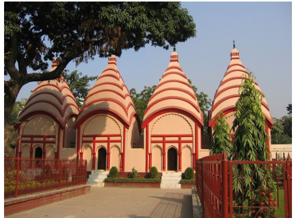
ਢਾਕੋਸ਼ਵਰੀ ਮੰਦਰ, ਢਾਕਾ