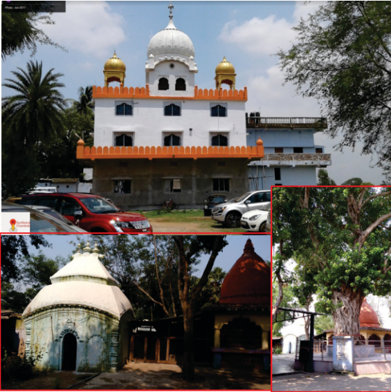
ਚੰਦਰਕੋਨਾ ਦਾ ਇਤਿਹਾਸਿਕ ਅਸਥਾਨ। ਇਹ ਉਦਾਸੀ ਸਾਧੂਆਂ ਦੀ ਬਦੌਲਤ ਬਚਿਆ ਰਿਹਾ ਹੈ। ਹੇਠਾਂ ਉਦਾਸੀ ਸਾਧੂਆਂ ਦੀਆਂ ਸਮਾਧਾਂ ਅਤੇ ਬੋਲ ਦਾ ਪੁਰਾਣਾ ਰੁੱਖ ਜਿਸ ਖੱਲੇ ਗੁਰੂ ਸਾਹਿਬ ਬਿਰਾਜੇ ਸਨ।

ਜਦੋਂ ਕੁਝ ਦਿਨ ਇਥੇ ਰਹੇ ਤਾਂ ਇਕ ਦਿਨ ਸ਼ਹਿਰ ਦੀ ਰਾਣੀ ਚੁੱਪ ਚੁਪੀਤੀ ਆਪਣੀ ਵਿਸ਼ਵਾਸ ਪਾਤਰ ਗੋਲੀ ਨਾਲ ਗੁਰੂ ਸਾਹਿਬ ਦੇ ਚਰਨਾਂ ਵਿਚ ਆ ਕੇ ਗਿੜਗਿੜਾਈ ਕਿ ਬਾਬਾ ਜੀ ਮੇਰੀ ਇੱਜਤ ਰੱਖ ਲਓ। ਰਾਣੀ ਨੇ ਕਹਾਣੀ ਦੱਸੀ ਕਿ: