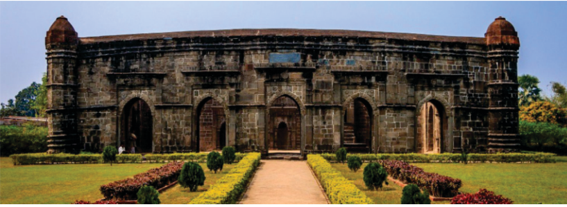
ਪਾਂਡੂਆ। ਫਿਰ ਕੀ ਹੋਇਆ ਸਿਰ ਤੇ ਛੱਤ ਨਹੀ ਬਚੀ। ਮਸੀਤ ਹੈ ਤਾਂ 600 ਸਾਲ ਪੁਰਾਣੀ।

ਹਮਾਯੂ ਨੇ ਨਾਂ ਜੱਨਤਬਾਗ ਰੱਖਿਆ। ਉਹਨੀ ਦਿਨੀ ਇਕ ਫਰੀਆ ਸੂਸਾ ਨਾਂ ਦੇ ਪੁਰਤਗਾਲੀ ਯਾਤਰੀ ਨੇ ਜਦੋਂ ਇਹ ਨਗਰ ਵੇਖਿਆ ਤਾਂ ਬੜੀਆਂ ਤਾਰੀਫਾਂ ਕੀਤੀਆਂ। ਉਹਨੀ ਦਿਨੀ ਇਸ ਸ਼ਹਿਰ ਦੀ ਅਬਾਦੀ 12 ਲੱਖ ਸੀ। ● ਗੁਰਬਾਣੀ ਵਿਚ ਜਿਹੜਾ ਰਾਗ ਗਾਉੜੀ ਆਉਦਾ ਹੈ ਉਹਦਾ ਨਾਂ ਵੀ ਏਸੇ ਸ਼ਹਿਰ ਕਰਕੇ ਹੀ ਹੈ। ਉਦੋਂ ਬੰਗਾਲ ਨੂੰ ਗੌੜ ਦੇਸ ਵੀ ਕਹਿ ਦਿਤਾ ਜਾਂਦਾ ਸੀ। ਪੁਰਾਣੇ ਸਮਿਆਂ ਵਿਚ ਰਾਜਧਾਨੀ ਦੇ ਨਾਂ ਤੇ ਹੀ ਦੇਸ ਦਾ ਨਾਂ ਚਲਦਾ ਹੁੰਦਾ ਸੀ। ਜਿਵੇਂ ਲਹੌਰ ਸੂਬਾ, ਮੁਲਤਾਨ ਦੇਸ ਆਦਿ ਆਦਿ।