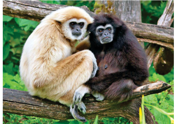
ਜਿੰਨਾਂ ਨੂੰ ਵੇਖ ਮਰਦਾਨਾ ਡਰ ਗਿਆ ਸੀ। ਉੱਤਰ ਪੂਰਬ ਦੇ ਬਣਮਾਣੂ (ਗਿੱਬਨ) ਜੋ ਇਨਸਾਨਾਂ ਨੂੰ ਵੇਖ ਕੇ ਬਹੁਤ ਚੀਕ ਚਿਹਾੜਾ ਪਾਉਂਦੇ ਹਨ।

ਸਿਬਸਾਗਰ ਤੋਂ ਜਦੋਂ ਬਾਬਾ ਜੀ ਸਿਲਹੱਟ ਵਲ ਜਾ ਰਹੇ ਸਨ ਤਾਂ ਇੱਕ ਥਾਂ ਤੇ ਬਣਮਾਣੂਆਂ ਦੀ ਵੱਡੀ ਹੋੜ ਵੇਖੀ। ਸੈਕੜਿਆਂ ਬਣਮਾਣੂਆਂ ਜਦੋਂ ਪ੍ਰਦੇਸੀ ਜਿਹੇ ਬੰਦੇ ਵੇਖੇ ਤਾਂ ਉਨਾਂ ਨੇ ਚੀਕਾਂ ਮਾਰ ਮਾਰ ਕੇ ਅਸਮਾਨ ਸਿਰ ਦੇ ਚੁੱਕ ਲਿਆ। ਹਾਲਾਂ ਬਣਮਾਣੂ ਭਾਰਤ ਦੇ ਬਾਕੀ ਜੰਗਲਾਂ 'ਚੋਂ ਸੈਕੜੇ ਸਾਲ ਪਹਿਲਾਂ ਹੀ ਖਤਮ (Extinct) ਹੋ ਚੁੱਕੇ ਹਨ ਪਰ ਭਾਰਤ ਦੇ ਉਤਰ ਪੂਰਬ ਦੇ