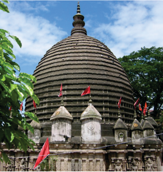
ਗੁਹਾਟੀ ਦਾ ਕਾਮੱਖਿਆ ਮੰਦਰ। 52 ਸ਼ਕਤੀ ਪੀਠਾਂ ਵਿੱਚੋਂ ਇਹ ਪ੍ਰਮੁੱਖ ਹੈ। ਇਹਦਾ ਧਾਰੀਦਾਰ ਸਿੱਖਰ ਵੀ ਅਲੌਕਿਕ ਹੈ ਪਰ ਅਸਾਮ ਦੀ ਇਮਾਰਤ ਸਾਜੀ ਵਿਚ ਇਹ ਆਮ ਹੈ।

ਬਲੀ ਦਾ ਪ੍ਰੇਰਣਾਸਰੋਤ ਖੁੱਦ ਦੁਰਗਾ ਦੀ ਕਹਾਣੀ ਹੈ। ਕਿਉਂਕਿ ਜਦੋਂ ਦੁਰਗਾ ਛਿਨਮਸਤਾ ਦਾ ਰੂਪ ਧਾਰਨ ਕਰਦੀ ਹੈ ਤਾਂ ਖੁੱਦ ਦੀ ਧੌਣ ਵੀ ਲਾਹ ਦਿੰਦੀ ਹੈ। ਧੌਣ ਵਿੱਚੋਂ ਲਹੂ ਦੀਆਂ ਤਿੰਨ ਤਤੀਰੀਆਂ ਨਿਕਲਦੀਆਂ ਹਨ ਜਿੰਨਾਂ ਵਿੱਚੋਂ ਦੋ ਤਾਂ ਦੇਵੀ ਦੀਆਂ ਭੈਣਾਂ ਪੀਦੀਆਂ ਹਨ ਤੇ ਇੱਕ ਧਾਰ ਖੁਦ ਦੇਵੀ ਦਾ ਕੱਟਿਆ ਹੋਇਆ ਸਿਰ ਪੀਂਦਾ ਹੈ। ਕਹਾਣੀ ਵਿਚ ਹਾਲਾਤ ਕਾਮਾਕ ਦੱਸੇ ਗਏ ਹਨ ਜਿਹਨਾਂ ਦਾ ਵਰਨਣ ਕਰਨਾਂ ਇਥੇ ਸੋਭਾ ਨਹੀਂ ਦਿੰਦਾ।