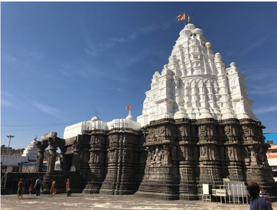
ਨਾਗੋਸ਼ਵਰ ਜਾਂ ਔਢਾ ਨਾਗਨਾਥ

ਇਥੇ 30 ਕਿ.ਮੀ ਤੇ ਪਿੰਡ ਨਰਸੀ ਬਾਮਣੀ (ਅਜ ਕਲ ਨਾਂ ਨਰਸੀ ਨਾਮਦੇਵ) ਹੈ ਜਿੱਥੇ ਭਗਤ ਨਾਮਦੇਵ ਦਾ ਜਨਮ ਹੋਇਆ ਸੀ। ਇਸੇ ਹੀ ਮੰਦਰ ਦੇ ਸਾਹਮਣੇ ਬਹਿ ਭਗਤ ਜੀ ਭਜਨ ਬੰਦਗੀ ਕਰ ਰਹੇ ਸਨ। ਪੰਡਿਆਂ ਨੇ ਉਨਾਂ ਨੂੰ ਫੋਟੀ ਜਾਤ ਦਾ ਹੋਣ ਕਰਕੇ ਓਥੋਂ ਭਜਾ ਦਿੱਤਾ। ਭਗਤ ਮੰਦਰ ਦੇ ਪਿੱਛਵਾੜੇ ਜਾ ਬੈਠੇ।