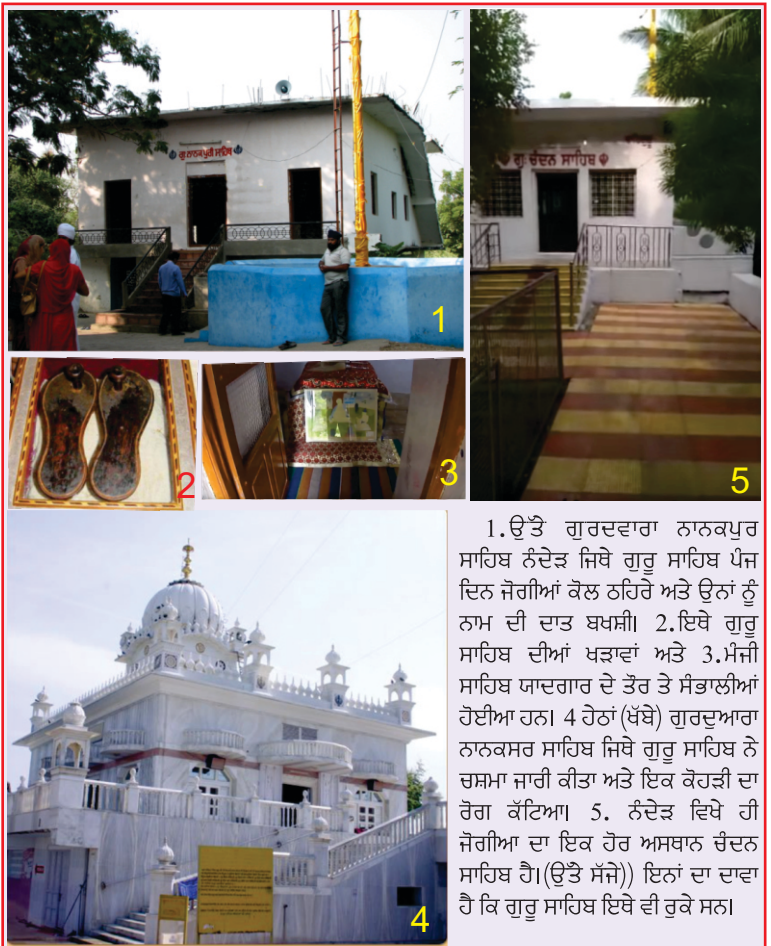
1. ਉੱਤੇ ਗੁਰਦਵਾਰਾ ਨਾਨਕਪੁਰ ਸਾਹਿਬ ਨੰਦੇੜ ਜਿਥੇ ਗੁਰੂ ਸਾਹਿਬ ਪੰਜ ਦਿਨ ਜੋਗੀਆਂ ਕੋਲ ਠਹਿਰੇ ਅਤੇ ਉਨਾਂ ਨੂੰ ਨਾਮ ਦੀ ਦਾਤ ਬਖਸ਼ੀ। 2. ਇਥੇ ਗੁਰੂ ਸਾਹਿਬ ਦੀਆਂ ਖੜਵਾਂ ਅਤੇ 3. ਮੰਜੀ ਸਾਹਿਬ ਯਾਦਗਾਰ ਦੇ ਤੌਰ ਤੇ ਸੰਭਾਲੀਆਂ ਹੋਈਆਂ ਹਨ। 4 ਹੇਠਾਂ (ਖੱਬੇ) ਗੁਰਦੁਆਰਾ ਨਾਨਕਸਰ ਸਾਹਿਬ ਜਿਥੇ ਗੁਰੂ ਸਾਹਿਬ ਨੇ ਚਸ਼ਮਾ ਜਾਰੀ ਕੀਤਾ ਅਤੇ ਇਕ ਕੋਹੜੀ ਦਾ ਰੋਗ ਕੱਟਿਆ। 5. ਨੰਦੇੜ ਵਿਖੇ ਹੀ ਜੋਗੀਆ ਦਾ ਇਕ ਹੋਰ ਅਸਥਾਨ ਚੰਦਨ ਸਾਹਿਬ ਹੈ। (ਉੱਤੇ ਸੱਜੇ) ਇਨਾਂ ਦਾ ਦਾਵਾ ਹੈ ਕਿ ਗੁਰੂ ਸਾਹਿਬ ਇਥੇ ਵੀ ਰੁਕੇ ਸਨ।

ਬਿਦਰ ਤੋਂ 140 ਕਿ.ਮੀ. ਦਾ ਪੈਂਡਾ ਕਰਕੇ ਸਾਹਿਬ ਨੰਦੇੜ