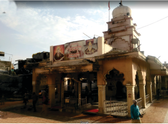
ਅਕੋਲਾ ਦਾ ਰਾਜ ਰਾਜੇਸ਼ਵਰ ਮੰਦਰ

ਗਏ ਸਨ। ਗੁਰੂ ਸਾਹਿਬ ਦੀ ਆਮਦ ਵੇਲੇ ਕੁਝ ਪਰਤ ਵੀ ਰਹੇ ਸਨ। ਅਮਰਾਵਤੀ ਓਨੀ ਦਿਨੀ ਰਿਆਸਤੀ ਰਾਜਧਾਨੀ ਤੇ ਹਿੰਦੂ ਤੇ ਜੈਨ ਮੰਦਰ (1097 ਈ. ਬਣਤਰ) ਲਈ ਪ੍ਰਸਿਧ ਸੀ। ਗੁਰੂ ਸਾਹਿਬ ਨੇ ਇਨ੍ਹਾਂ ਮੰਦਰਾਂ ਦੇ ਦਰਸ਼ਨ ਕੀਤੇ ਖਾਸ ਕਰਕੇ ਅੰਬਾਦੇਵੀ ਮੰਦਰ ਦੇ। ਇਹ ਉਹ ਅਸਥਾਨ ਹੈ ਜਿਥੋਂ ਭਗਵਾਨ