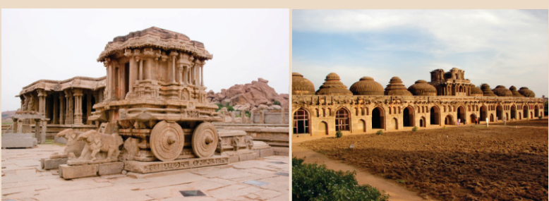
ਇਤਹਾਸਕ ਦਸਤਾਵੇਜ਼ਾਂ ਨੂੰ ਪਰੇ ਰੱਖ ਕੇ, ਜਰਾ ਵਿਜੈਨਗਰ ਦੇ ਖੰਡਰਾਂ ਨੂੰ ਵੇਖੋ ਤਾਂ ਪਤਾ ਲੱਗਦਾ ਹੈ ਕਿ ਸ਼ਹਿਰ ਦੀ ਕੀ ਸ਼ਾਨ ਰਹੀ ਹੋਵੇਗੀ। ਭਾਰਤ ਵਿਚ ਹੋਰ ਕਿਤੇ ਵੀ ਇੰਨੇ ਵਿਸ਼ਾਲ ਖੇਤਰ ਵਿਚ ਖੰਡਰਾਤ ਨਹੀਂ ਹਨ।

1565 ਈ ਵਿੱਚ ਮੁਗਲ ਸੁਲਤਾਨਾਂ ਨੇ ਰਲ ਮਿਲ ਕੇ ਵਿਜੈਨਗਰ ਤੇ ਹਮਲਾ ਕੀਤਾ। ਸ਼ਹਿਰ ਨੂੰ ਚੰਗੀ ਤਰਾਂ ਲੁੱਟਿਆ ਪੁੱਟਿਆ ਤੇ ਤਹਿਸ ਨਹਿਸ ਕਰ ਦਿੱਤਾ। ਬਰਬਾਦ ਹੋ ਜਾਣ ਦੇ ਬਾਵਜੂਦ 1570 ਦੇ ਨੇੜੇ ਤੇੜੇ ਇੱਕ ਇਤਾਲਵੀ ਸੌਦਾਗਰ ਵਿਜੈਨਗਰ ਆ ਗਇਆ ਤੇ ਸ਼ਹਿਰ ਦੇ ਖੰਡਰਾਤ ਵੇਖ ਕੇ ਹੈਰਾਨ ਰਹਿ ਗਿਆ। ਉਸ ਨੇ ਇਸ ਬਾਬਤ ਵਿਸਥਾਰ ਨਾਲ ਲਿਖਿਆ ਹੈ