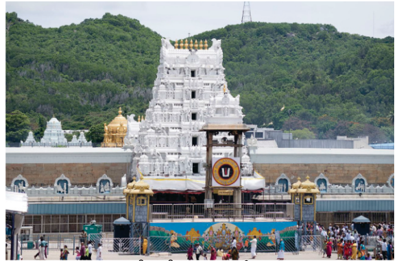
ਤੀਰੂਪਤੀ ਦਾ ਮਸ਼ਹੂਰ ਮੰਦਰ

ਤੀਰੂਪਤੀ - ਸੋ ਵੈਲੋਰ ਤੋਂ 85 ਕਿ.ਮੀ. ਦਾ ਸਫਰ ਕਰਕੇ ਸਾਹਿਬ ਤੀਰੂਪਤੀ (ਆਂਧਰਾ ਪ੍ਰਦੇਸ) ਪਹੁੰਚ ਗਏ। ਇਹ ਦੱਖਣੀ ਭਾਰਤ ਦਾ ਸਭ ਤੋਂ ਵੱਧ ਲੋਕ-ਪਿਆਰਾ ਮੰਦਰ ਹੈ। ਤੀਰੂ ਮਾਇਨੇ ਲਕਸ਼ਮੀ ਤੇ ਪਤੀ ਮਾਇਨੇ ਘਰਵਾਲਾ। ਹਿੰਦੂਆਂ ਦੇ ਵਰਾਹ ਪੁਰਾਣ ਮੁਤਾਬਿਕ ਭਗਵਾਨ ਰਾਮਚੰਦ੍ਰ ਜਦੋਂ ਸੀਤਾ ਨੂੰ ਲੰਕਾ ਤੋਂ ਛੁਡਾ ਕੇ ਲਿਆਏ ਸਨ ਤਾਂ ਕੁਝ ਦਿਨ ਏਥੇ ਰਹੇ ਸਨ। ਇਥੋਂ ਦੇ ਪੰਡੇ ਦਾਵਾ ਕਰਦੇ ਹਨ ਕਿ ਇਸ ਮੰਦਰ ਨੂੰ ਮੁਸਲਮਾਨ ਹਮਲਾਵਰ ਨਹੀਂ ਸਨ ਲੁੱਟ ਪਾਏ। ਓਨਾਂ ਦਾ ਕਹਿਣਾ ਹੈ ਕਿ ਇਥੋਂ ਤੱਕ ਕਿ ਸ੍ਰੀਰੰਗਮ ਦੇ ਰੰਗਾਨਾਥਸਵਾਮੀ ਮੰਦਰ ਦੀ ਮੂਰਤੀ