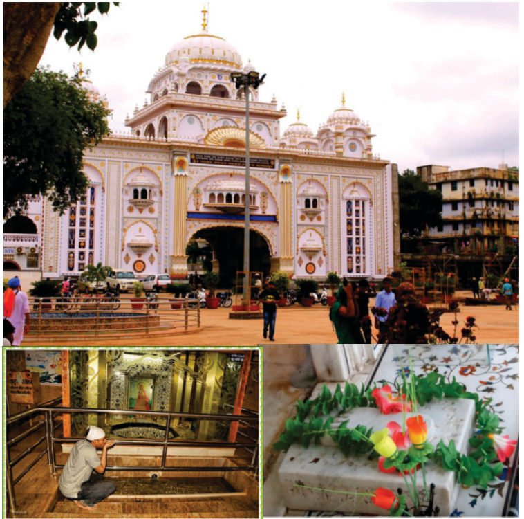
ਗੁਰਦੁਆਰਾ ਨਾਨਕ ਝੀਰਾ ਬਿਦਰ। ਗੁਰੂ ਸਾਹਿਬ ਨੇ ਜੋ ਝੀਰਾ (ਚਸ਼ਮਾ) ਜਾਰੀ ਕੀਤਾ ਅਤੇ ਪੱਥਰ ਤੇ ਚਰਨਾਂ ਦਾ ਨਿਸ਼ਾਨ।

ਗੁਰੂ ਸਾਹਿਬ ਦਾ ਬਿਦਰ ਜਾਣਾ ਸਾਬਤ ਕਰਦਾ ਹੈ ਕਿ ਉਹ 1518 ਤੋਂ ਪਹਿਲਾਂ ਪਹਿਲਾਂ ਹੀ ਦੱਖਣ ਦੀ ਯਾਤਰਾ ਕਰ ਚੁੱਕੇ ਸਨ। ਜਦੋਂ ਗੁਰੂ ਸਾਹਿਬ ਬਿਦਰ ਗਏ ਉਦੋਂ ਬਾਦਸ਼ਾਹ ਵੀਰਾ-ਸ਼ਾਹ ਉਰਫ ਮਹਿਮੂਦ ਸ਼ਾਹ ਬਾਹਮਣੀ ਦੂਜਾ ਤਖਤ ਤੇ ਸੀ। ਕਿਉਂਕਿ ਇਹ ਯਾਤਰਾ ਸ੍ਰੀਸੈਲਮ ਦੇ ਮੇਲੇ (ਸ਼ਿਵਰਾਤਰੀ) ਤੇ ਪੰਚਰਪੁਰ ਦੇ ਮੇਲੇ ਬਾਦ ਹੋਈ ਇਸ ਪ੍ਰਕਾਰ ਇਹ ਅਕਤੂਬਰ 1514 ਬਣਦੀ ਹੈ। ਇਹ ਕੋਈ ਇਸ਼ਾਰਾ ਨਹੀਂ ਮਿਲਦਾ ਕਿ ਰਾਜੇ ਨੇ ਗੁਰੂ ਸਾਹਿਬ ਨੂੰ ਮਿਲਣ ਲਈ ਵਕਤ ਕੱਢਿਆ ਕਿ ਨਹੀਂ। ਪਰ ਇਤਹਾਸ ਤੋਂ ਇਹੋ ਅੰਦਾਜ਼ਾ ਲੱਗਦਾ ਕਿ ਐਸੇ ਆਰਾਮ ਤੋਂ ਇਲਾਵਾ ਰਾਜੇ ਕੋਲ ਅਜਿਹੇ ਰੂਹਾਨੀਅਤ ਦੇ ਕੰਮਾਂ ਲਈ ਵਕਤ ਕਿਥੇ ਸੀ।