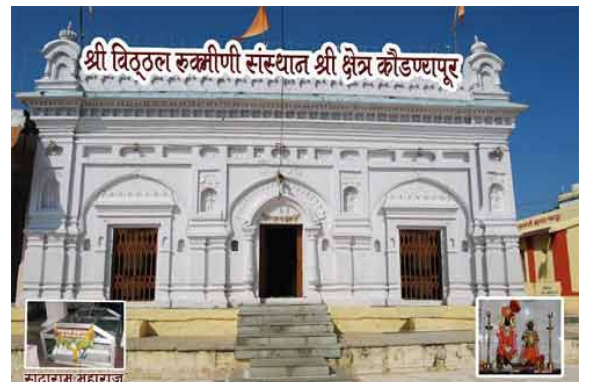
ਵਿੱਠਲੁ ਰੁਕਮਣੀ ਮੰਦਰ ਕੋਂਡਨਿਆਪੁਰ

ਤੇ ਲਓ ਇਥੇ ਪੰਡਤਾਂ ਨੇ ਲੋਕਾਂ ਦੇ ਗਲੀਂ ਫਾਹ ਪਾਏ ਹੋਏ ਸਨ। ਹਰ ਕੋਈ 5-5 ਮੇਰ ਦੀਆਂ ਪੱਥਰ ਦੀ ਸਿਲ ਗਲ ਵਿੱਚ ਪਾਈ ਫਿਰਦਾ ਸੀ ਜਿਸ ਤੇ ਪੈਰਾਂ ਦੇ ਨਿਸ਼ਾਨ ਵਗੇ ਹੁੰਦੇ ਸਨ। ਪੁੱਛਣ ਤੇ ਪਤਾ ਲੱਗਾ ਕਿ ਇਹ ਭਗਵਾਨ ਰਾਮ ਦੀ ਚਰਨ ਪਾਦੁਕਾ ਹੈ। ਇਨ੍ਹਾਂ ਗਲ ਵਿੱਚ ਪਾਇਆਂ ਜਮਦੂਤ ਨੇੜੇ ਨਹੀ ਆਉਂਦਾ। ਸਿਰਫ ਏਨਾ ਹੀ ਨਹੀ: ਹਰ ਕੋਈ ਮੱਥੇ, ਡੋਲਿਆਂ ਤੇ ਛਾਤੀ ਤੇ ਵੀ ਚੰਦਨ ਨਾਲ ਚਰਨ ਪਾਦੁਕਾ ਵਾਹੀ ਫਿਰਦਾ ਸੀ। ਮਰਦਾਨਾ ਵੇਖ ਤਾਂ ਖਿੜ ਖਿੜ ਕੇ ਹੱਸੇ। ਬਾਬੇ ਕਿਹਾ ਮਰਦਾਨਿਆਂ ਇਹ ਪਾਉਣ ਵਾਲੇ ਦਾ