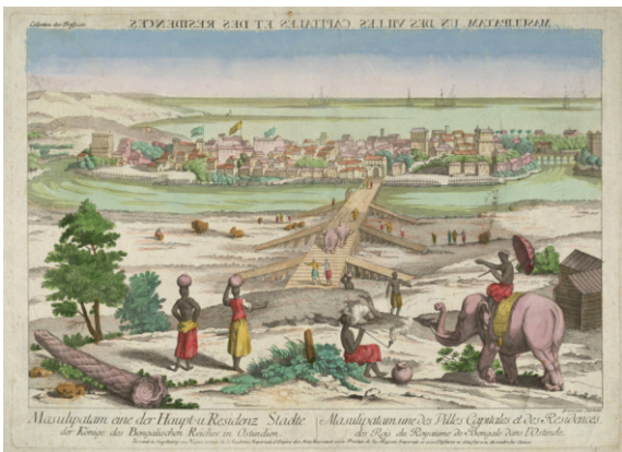
ਮੱਛਲੀਪਟਨਮ- 1776 ਈ ਦੀ ਤਸਵੀਰ

ਮੱਛਲੀਪਟਨਮ ਮਸ਼ਹੂਰ ਬੰਦਰਗਾਹ ਰਹੀ ਹੈ। ਇਨ੍ਹਾਂ 'ਮਸੂਲੀਪਟਨਮ' ਜਾਂ ਨਿਰਾ 'ਬੰਦਰ' ਵੀ ਕਹਿ ਦਿੱਤਾ ਜਾਂਦਾ ਰਿਹਾ ਹੈ। ਇਥੋਂ ਹੀ ਯੂਨਾਨ ਤੇ ਯੂਰਪੀਨ ਮੁਲਕਾਂ ਦੇ ਵਪਾਰੀ ਮਲਮਲ ਚੁੱਕਦੇ ਸਨ। ਇਸ ਵਪਾਰ ਦਾ ਇਤਹਾਸ ਕੋਈ 2000 ਸਾਲ ਪੁਰਾਣਾ ਹੈ। ਇਸ ਪੁਰਾਣੇ ਬੋਧੀ ਸ਼ਹਿਰ ਵਿੱਚ ਬਹੁਤ ਹੀ ਪੁਰਾਣੇ ਮੰਦਰ ਵੀ ਮੌਜੂਦ ਹਨ। ਅਗਸਤ ਰਿਸ਼ੀ ਦਾ ਮੰਦਰ ਅੱਜ ਵੀ ਮੌਜੂਦ ਹੈ। ਏਕ-ਰਾਤਰੀ-ਮਲਿਕਾਰਜੁਨ ਸਵਾਮੀ ਮੰਦਰ ਵੀ ਇਥੇ