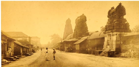
ਬੰਜਾਵੂਰ ਦੀ 1867 ਈ ਦੀ ਫੋਟੋ

ਬੰਜਾਵੂਰ (ਤੰਜੌਰ) - ਕੁੰਡਕੋਨਮ ਤੋਂ 35 ਕਿ.ਮੀ. ਪੱਛਮ ਵਿੱਚ ਪ੍ਰਸਿਧ ਨਗਰ ਬੰਜਾਵੂਰ ਹੈ ਜਿੱਥੇ ਸਾਹਿਬ ਪਧਾਰੇ। ਬੰਨਜਾਓਰ ਤਮਿਲ ਲੋਕਾਂ ਦੀ ਧਾਰਮਿਕ ਤੇ ਸਭਿਆਚਾਰ ਰਾਜਧਾਨੀ ਹੈ ਭਾਵ ਕੇਂਦਰ ਹੈ। ਸ਼ਹਿਰ 1200 ਸਾਲ ਪੁਰਾਣਾ ਹੈ। ਇਥੇ ਅਨੇਕਾਂ ਪੁਰਾਣੇ ਮੰਦਰ ਹਨ ਜੋ ਪੁਰਾਤਤਵ ਤੇ ਹੁਨਰ ਦੇ ਤੌਰ ਤੇ ਖਾਸ ਅਹਿਮੀਅਤ ਰੱਖਦੇ ਹਨ। ਯੂਨੈਸਕੋ ਨੇ ਕੁਝ ਮੰਦਰ ਤਾਂ ਗੋਦ ਹੀ