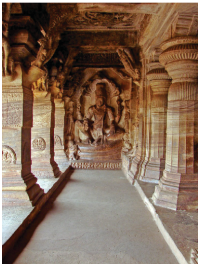
ਬਦਾਮੀ ਦੀ ਇਕ ਗੁਫਾ

ਬਾਗਲਕੋਟ ਸਾਧੂਆਂ ਨੇ ਦੱਸਿਆ ਕਿ ਅੱਗੇ ਉਹ ਪੰਢਰਪੁਰ (ਮਹਾਰਾਸ਼ਟਰ) ਪਹੁੰਚ ਰਹੇ ਨੇ। ਹਾੜ ਦੀ ਇਕਾਦਸ਼ੀ ਤੇ ਵੱਡਾ ਮੇਲਾ ਲੱਗ ਰਿਹਾ ਹੈ। ਪੂਰਾ ਮਹਾਰਾਸ਼ਟਰ ਹੀ ਇੱਕ ਤਰਾਂ ਨਾਲ ਇਥੇ ਢੁਕਦਾ ਹੈ। ਉਥੇ ਭੀਮਾ (ਚੰਦਰਭਾਗਾ ਨਦੀ) ਕਿਨਾਰੇ