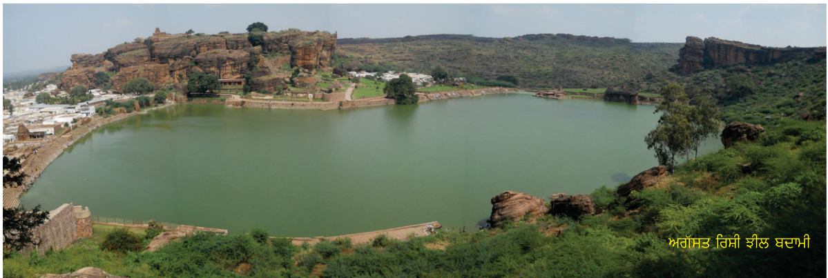
ਅਗੱਸਤ ਰਿਸ਼ੀ ਝੀਲ ਬਦਾਮੀ