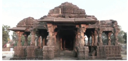
ਸਤਗਾਓਂ ਦਾ ਵਿਸ਼ਨੂ ਮੰਦਰ

ਅਮਰਾਵਤੀ - ਅਕੋਲਾ ਤੋਂ 100 ਕਿ. ਮੀ. ਦਾ ਪੈਂਡਾ ਤਹਿ ਕਰਕੇ ਸਾਹਿਬ ਹਿੰਦੂਮਤ ਦੇ ਪ੍ਰਸਿੱਧ ਤੀਰਥ ਅਸਥਾਨ ਅਮਰਾਵਤੀ ਪਹੁੰਚੇ। ਇੱਕ ਸਦੀ ਪਹਿਲਾਂ ਇਥੇ ਬੜਾ ਭਿਅੰਕਰ ਕਾਲ ਪਿਆ ਸੀ। ਲੋਕੀ ਇਥੋਂ ਉਠ ਕੇ ਮਾਲਵਾ (ਮੱਧ ਪ੍ਰਦੇਸ਼) ਤੇ ਗੁਜਰਾਤ ਵਲ ਹਿਜਰਤ ਕਰ