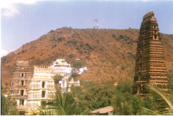
ਪਾਨਕਲਾ ਮੰਦਰ ਜਿਥੇ ਸਵਾਮੀ ਸਿਰਫ ਗੁੜ ਦਾ ਸ਼ਰਬਤ ਹੀ ਪੀਂਦਾ ਹੈ। ਚੈਤੰਨਿਆ ਪ੍ਰਭੂ ਵੀ ਇਥੇ ਆਏ ਸਨ

ਗਉੜੀ ਮਹਲਾ ੧ ॥ ਐਸੇ ਦਾਸੁ ਮਿਲੈ ਸੁਖੁ ਹੋਈ ॥ ਦੁਖੁ ਵਿਸਰੈ ਪਾਵੈ ਸਚੁ ਸੋਈ ॥੧॥ ਦਰਸਨੁ ਦੇਖਿ ਭਈ ਮਤਿ ਪੂਰੀ ॥ ਅਨਸਨਿ ਮਜਨੁ ਚਰਨਹੁ ਧੂਰੀ ॥੧॥ ਰਹਾਉ ॥ ਨੇੜੁ ਸੰਤੋਖੇ ਏਕ ਲਿਵ ਤਾਰਾ ॥ ਜਿਹਵਾ ਸੂਚੀ ਹਰਿ ਰਸ ਸਾਰਾ ॥੨॥ ਸਚੁ ਕਰਣੀ ਅਭ ਅੰਤਰਿ ਸੇਵਾ ॥ ਮਨੁ ਤ੍ਰਿਪਤਾਸਿਆ ਅਲਖ ਅਭੇਵਾ ॥੩॥ ਜਹ ਜਹ