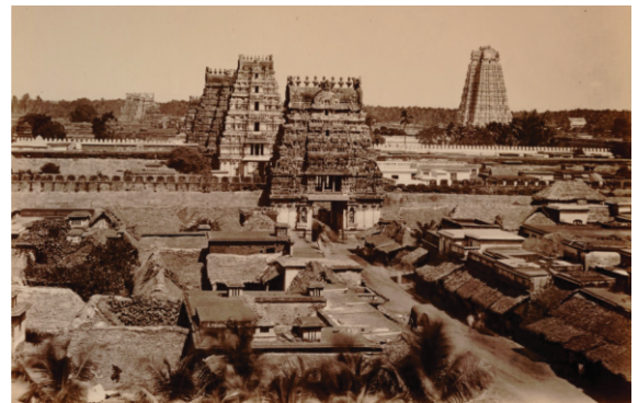
ਸ੍ਰੀਰੰਗਮ ਦੇ ਮੰਦਰ ਸੰਨ 1870 ਈ.

ਸ੍ਰੀਰੰਗਮ - ਬੰਜਾਵੂਰ ਤੋਂ 50 ਕਿ.ਮੀ. ਦੂਰ ਪੱਛਮ ਵਿੱਚ ਗੁਰੂ ਸਾਹਿਬ ਤ੍ਰਿਚਨਾਪਲੀ ਦੇ ਮੰਦਰ ਸ੍ਰੀਰੰਗਮ ਗਏ। ਸ੍ਰੀਰੰਗਮ ਨੂੰ ਦੱਖਣੀ ਪੰਡੇ ਪ੍ਰਯਾਗ ਬਰਾਬਰ ਮੰਨਦੇ ਹਨ। ਅਖੇ ਇਥੇ ਵੀ ਤਿੰਨ ਦਰਿਆਵਾਂ ਦਾ ਮੇਲ ਹੈ। ਅਸਲ ਵਿੱਚ ਸਿਰਫ ਕਾਵੇਰੀ ਦਰਿਆ ਹੀ ਹੈ ਜਿਹਦੀ ਦੂਸਰਾ ਸ਼ਰਾ ਮੁੱਖ ਧਾਰਾ ਵਿੱਚ ਮਿਲਦਾ ਹੈ। ਅਸਥਾਨ ਬਹੁਤ ਰਮਣੀਕ ਹੈ।