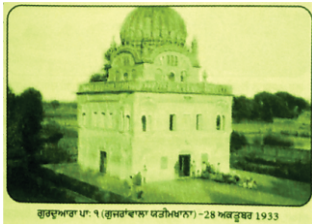
ਗੁਰਦੁਆਰਾ ਪਾਤਸ਼ਾਹੀ ਪਹਿਲੀ, ਯਤੀਮ-ਖਾਨਾ, ਗੁਜਰਾਂਵਾਲਾ (ਸਾਈਕਲ ਯਾਤਰੀ)

ਗੁਜਰਾਂਵਾਲਾ- ਸੈਦਪੁਰ ਤੋਂ ਚਲ ਲਗਪਗ 20 ਕਿ. ਮੀ ਪਹਾੜ ਪਾਸੇ ਸਾਹਿਬ ਉਸ ਇਲਾਕੇ ਵਿਚ ਪਹੁੰਚੇ ਜਿਥੇ ਅੱਜ ਕਲ੍ਹ ਗੁਜਰਾਂਵਾਲਾ ਸ਼ਹਿਰ ਹੈ। ਇਥੋਂ ਨਾਲ ਹੀ ਪੱਛਮ ਪਾਸੇ ਇੱਕ ਬਸਤੀ ਦੇ ਲਾਗੇ ਹੀ ਗੁਰੂ ਸਾਹਿਬ ਨੇ ਡੇਰਾ ਕੀਤਾ ਸੀ। ਉਦੋਂ ਇਥੇ