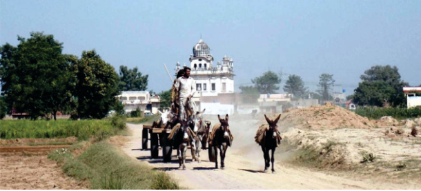
ਜਿਵੇਂ ਕਰਤਾਰਪੁਰ ਸਾਹਿਬ ਦੂਰੋਂ ਨਜ਼ਰ ਆਉਂਦਾ ਹੈ ਏਸੇ ਤਰਾਂ ਕੇਰ ਭਾਗ ਦੀ 4-5 ਕਿ.ਮੀ ਤੋਂ ਨਜ਼ਰ ਆ ਰਿਹਾ ਹੁੰਦਾ ਹੈ। ਇਮਾਰਤ ਦੀ ਹਾਲਤ ਖਸਤਾ ਹੈ।

ਪੈਰ ਵਿੰਗੇ ਸਨ। ਪਿੰਡ ਵਾਸੀ ਜੋ ਪਾਣੀ ਦੀ ਵੱਡੀ ਕਿੱਲਤ ਦਾ ਸਾਹਮਣਾ ਕਰ ਰਹੇ ਸਨ ਉਸ ਥਾਂ ਨੂੰ ਹੋਰ ਖੋਦਿਆ ਤੇ ਪਾਣੀ ਹੋਰ ਨਿਕਲਣ ਤੇ ਉਥੇ ਛੱਪੜ ਬਣਾ ਦਿੱਤਾ। ਲਾਗੇ ਹੀ ਕੇਰ ਉਸਾਰ ਦਿੱਤੀ ਗਈ ਜਿਸ ਦਾ ਨਾਂ 'ਕੇਰ ਬਾਵਾ ਨਾਨਕ' ਪ੍ਰਸਿੱਧ ਹੋਇਆ। ਛੱਪੜ ਫਿਰ ਸਰੋਵਰ ਪਵਿਤ੍ਰ ਯਾਦਗਾਰੀ ਸਰੋਵਰ ਹੋ ਨਿਬੜਿਆ।**