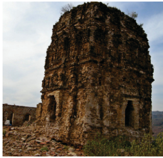
1000 ਸਾਲ ਪੁਰਾਣਾ ਕਿਲਾ ਨੰਦਨਾ ਦਾ ਮੰਦਰ। ਹੋ ਸਕਦੇ ਗੁਰੂ ਸਾਹਿਬ ਵੀ ਆਏ ਹੋਣ।

ਕਟਾਸਰਾਜ ਕੁੰਡ ਦੇ ਚੜ੍ਹਦੇ ਪਾਸੇ ਕੰਢੇ ਤੇ ਟਾਹਲੀ ਦੇ ਰੁੱਖ ਹੇਠ। "ਗੁਰੂ ਗ੍ਰੰਥ ਸਾਹਿਬ ਤਾਂ ਮੌਜੂਦ ਹੈ ਪਰ ਪ੍ਰਕਾਸ਼ ਕਦੀ ਕਦਾਈਂ ਹੀ ਹੁੰਦਾ ਹੈ। ਇਹ ਗੁਰਦੁਆਰਾ ਭਾਈ ਪਰਾਗਾ ਭਾਈ ਮਤੀ ਦਾਸ ਦੀ ਓਲਾਦ ਭਾਵ ਕੜਿਆਲੇ ਵਾਲੇ ਪੰਡਤਾਂ ਦੇ ਕਬਜ਼ੇ ਹੇਠ ਹੈ।"