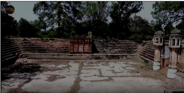
ਮਹਾਰਾਜਾ ਰਣਜੀਤ ਸਿੰਘ ਨੇ ਇਥੇ ਟਿੱਲੇ ਤੇ ਜੋਗੀਆਂ ਦਾ ਸਤਿਕਾਰ ਕਰਦੇ ਹੋਏ ਸਰੋਵਰ ਬਣਵਾ ਦਿੱਤਾ।

ਜੋਗੀ ਸ਼ਰਮਿੰਦਾ ਹੋਇਆ ਗੁਰੂ ਸਾਹਿਬ ਨੂੰ ਭੰਡਾਰੇ (ਸਟੋਰ ਰੂਮ)