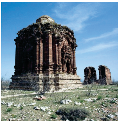
ਰੋਹਤਾਸ ਦੇ ਨਾਲ ਹੀ (ਮਸਾਂ 3 ਕਿ.ਮੀ) ਇਕ ਹਿੰਦੂ ਮੰਦਰ ਦੇ ਖੰਡਰਾਤ ਮੌਜੂਦ ਨੇ ਜਿਸ ਦੀ ਅਮੀਰ ਬਣਤਰ ਦੱਸਦੀ ਹੈ ਕਿ ਕਿਵੇਂ ਇਥੇ ਵੀ ਹਿੰਦੂਮਤ ਦੀ ਕਦੀ ਵੱਡੀ ਚੜ੍ਹਤ ਸੀ। ਸਾਹਿਬ ਇਥੇ ਵੀ ਆਏ ਹੀ ਹੋਣਗੇ।