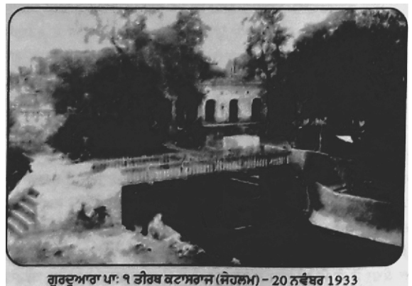
ਗੁਰਦੁਆਰਾ ਪਾ: ੧ ਤੀਰਥ ਕਟਾਸਰਾਜ (ਜੇਹਲਮ) - 20 ਨਵੰਬਰ 1933

ਇਸ ਅਸਥਾਨ ਤੇ ਗੁਰੂ ਸਾਹਿਬ ਦੇ ਪਹੁੰਚਣ ਤੇ ਪਾਂਡਿਆਂ ਨੇ ਉਨ੍ਹਾਂ ਦਾ ਸਵਾਗਤ ਕੀਤਾ ਤੇ ਜਿਵੇਂ ਹਰ ਥਾਂ ਹੁੰਦਾ ਸੀ ਜਗਰਾਤਾ