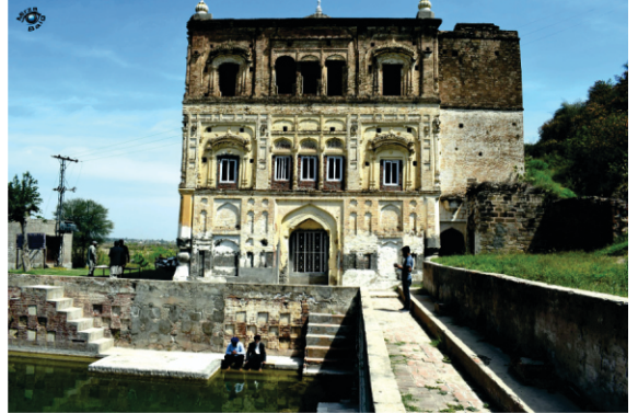
ਚੋਆ ਸਾਹਿਬ ਰੋਹਤਾਸ। ਗੁਰੂ ਸਾਹਿਬ ਦੇ ਜਾਰੀ ਕੀਤੇ ਚਸ਼ਮੇ ਤੋਂ ਬਣਾਇਆ ਸਰੋਵਰ।

ਭਿੰਬਰ- ਰੋਹਤਾਸ ਤੋਂ ਕੋਈ 50 ਕਿ. ਮੀ ਪੂਰਬ ਚਲ ਕੇ ਗੁਰੂ ਸਾਹਿਬ ਭਿੰਬਰ ਗਏ। ਕਿਉਂਕਿ ਗੁਰੂ ਸਾਹਿਬ ਨੂੰ ਪਤਾ ਲੱਗਾ ਸੀ