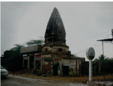
ਪਿੰਡ ਦਾਦਨ ਖਾਂ ਦਾ ਇੱਕ ਮੰਦਰ

✚ ਸਾਈਕਲ ਯਾਤਰੀ ਅਨੁਸਾਰ (1933 ਈ) ਗੁਰੂ ਸਾਹਿਬ ਦਾ ਯਾਦਗਾਰੀ ਸਥਾਨ ਬਾਰਾਦਰੀ ਕਰਕੇ ਮਸ਼ਹੂਰ ਹੈ ਜੋ ਜਲ-ਕੁੰਡ ਦੇ ਸੱਜੇ ਹੱਥ ਹੈ ਮਤਲਬ