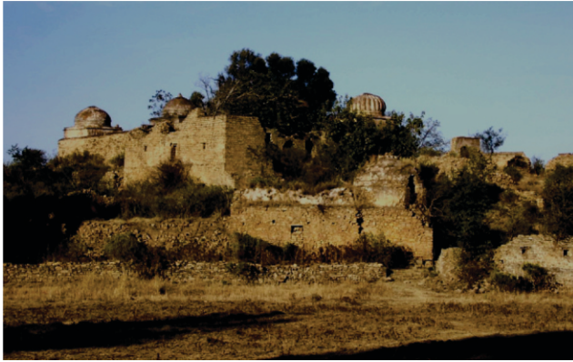
ਟਿੱਲੇ ਦਾ ਕੇਂਦਰੀ ਬਿੰਦੂ ਜਿਥੇ ਕਈ ਮੱਠ ਹਨ

ਯਾਦ ਰਹੇ ਇਸ ਇਲਾਕੇ ਵਿਚ ਮੁੜਾਲ ਬ੍ਰਾਹਮਣਾਂ ਦਾ ਵੱਡਾ ਦਬਦਬਾ ਰਿਹਾ ਹੈ। ਇਹ ਲੋਕ ਸਿੱਖੀ ਦੇ ਵੱਡੇ ਪ੍ਰਚਾਰਕ ਬਣੇ ਸਨ। ਭਾਈ ਮਤੀ ਦਾਸ ਸਤੀ ਦਾਸ ਪਿੰਡ ਕੜਿਆਲਾ ਦੇ ਹੀ ਸਨ ਜੋ ਜੇਹਲਮ ਤੋਂ 10 ਕਿ. ਮੀ ਦੱਖਣ ਪੂਰਬ ਹੈ। ਕਟਾਸਰਾਜ ਦੇ ਗੁਰੂ ਨਾਨਕ ਗੁਰਦੁਆਰੇ ਦੇ ਮਹੀਤ ਵੀ ਇਹੋ ਛਿੱਬੜ ਬ੍ਰਾਹਮਣ ਹੀ ਸਨ।