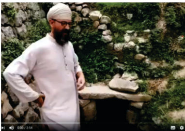
ਚਸਮਾ ਗੁਰੂ ਨਾਨਕ ਹੰਗੂ। ਇਕ ਪਠਾਣ ਗੁਰਸਿੱਖ ਚਸਮੇ ਦੇ ਦਰਸ਼ਨ ਕਰਾਉਂਦਾ ਹੋਇਆ

ਫਿਰ ਨਰਿਆਬ ਵਿਖੇ ਚੋਖੀ ਸਿੱਖੀ ਸੇਵਕੀ ਹੋ ਗਈ ਸੀ। ਇਥੇ ਇਕ ਜੋਗੀ ਕੋਲ ਗੁਰੂ ਸਾਹਿਬ ਠਹਿਰੇ ਸਨ ਜਿਸ ਨੇ ਸਿੱਖੀ ਧਾਰਨ ਕੀਤੀ। ਇਸ ਸੰਤ ਨੇ ਸਿੱਖੀ ਦਾ ਚੋਖਾ ਪ੍ਰਚਾਰ ਇਲਾਕੇ