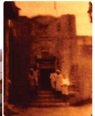
ਗੁਰਦੁਆਰਾ ਚੱਕੀ ਸਾਹਿਬ। 1914 ਵਿਚ ਬਣੀ ਇਮਾਰਤ ਦੀਆਂ ਤਸਵੀਰਾਂ। ਖੋਬੇ 2016 ਵਿਚ ਅਤੇ ਸੰਨੇ 1932 ਵਿਚ ਧਿਆਨ ਵੇਖੋ ਇਮਾਰਤ ਓਹੋ ਹੀ ਹੈ। ਇੰਟ ਵੀ ਮੌਜੂਦਾ ਭਾਵ ਵੱਡੀ ਲੱਗੀ ਹੈ।

ਕਿ ਹਰ ਉਹ ਕੰਮ ਜਿਸ ਕਰਕੇ ਲੋਕ ਨਾਮ ਨਾਲ ਜੁੜਨ ਉਹ ਪਵਿਤ੍ਰ ਹੀ ਹੈ। ਪੁਰਾਣੇ ਰਹਾਇਸ਼ੀ ਇਲਾਕਿਆਂ ਦੀ ਖੁਦਾਈ ਮੌਕੇ ਚੱਕੀਆਂ ਅਕਸਰ ਨਿਕਲ ਆਉਂਦੀਆਂ ਹਨ।