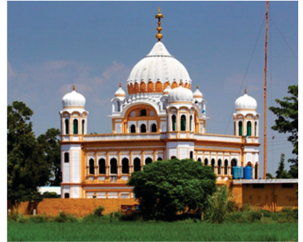
ਕਰਤਾਰਪੁਰ (ਸੰਨ 2004)

ਇਸ ਮਰਹਲੇ ਵਿਚ ਉਹ ਘਟਨਾਵਾਂ ਆ ਰਹੀਆਂ ਹਨ ਜੋ ਉਹਨਾਂ ਦੇ ਕਰਤਾਰਪੁਰ ਸਾਹਿਬ ਬਿਰਾਜਨ ਦੌਰਾਨ ਵਾਪਰੀਆਂ। (ਸਰੋਤ: ਜ਼ਿਆਦਾਤਰ ਸੋਢੀ ਮਿਹਰਬਾਨ)