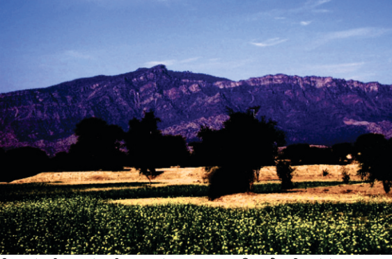
ਟਿੱਲਾ ਜੋਗੀਆਂ ਸਮੁੰਦਰੀ ਸਤਹ ਤੋਂ 3200 ਫੁੱਟ ਉੱਚਾ ਹੈ। ਇਹ ਫੋਟੋ ਜਲਾਲਪੁਰ ਸ਼ਰੀਫ ਤੋਂ ਲਈ ਗਈ ਹੈ ਜੋ ਟਿੱਲੇ ਤੋਂ 22 ਕਿ. ਮੀ ਹਟਵਾ ਹੈ।

ਹਨ ਕਿ ਸੂਰੀ ਨੇ ਓਥੇ ਕਿਲ੍ਹਾ ਬਣਵਾਇਆ। ਦਰ ਅਸਲ ਸੂਰੀ ਤੋਂ ਪਹਿਲਾਂ ਵੀ ਇਥੇ ਕੋਈ ਛੋਟਾ ਮੋਟਾ ਹੁਕਮਰਾਨ ਸੀ। ਅੰਦਾਜ਼ਾ ਹੈ ਕਿ ਭਿੰਬਰ ਦੇ ਰਾਜਪੂਤ ਰਾਜਿਆਂ ਦਾ ਹੀ ਇਥੇ ਕੋਈ ਛੋਟਾ ਮੋਟਾ ਕਿਲ੍ਹਾ ਆਦਿ ਹੋਵੇਗਾ।