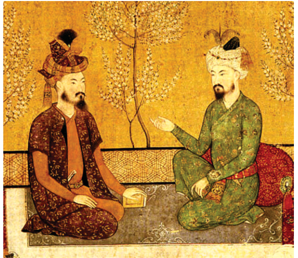
ਬਾਬਰ (ਸੱਜੇ) ਆਪਣੇ ਪੁੱਤਰ ਸ਼ਹਿਜ਼ਾਦਾ ਹਮਾਯੂ ਨਾਲ

ਸੱਦਾ, ਨਰਯਾਬ ਅਤੇ ਹੰਗੂ ਆਦਿ ਵਿਚ ਜਿਹੜਾ ਗੁਰੂ ਸਾਹਿਬ ਦਾ ਆਉਣਾ ਸਾਬਤ ਹੁੰਦਾ ਹੈ ਉਸ ਤੋਂ ਲਗਦਾ ਹੈ ਕਿ ਸਾਹਿਬ ਕਾਬੁਲ ਤੋਂ ਦੱਖਣ ਨੂੰ ਹੋ ਤੁਰੇ ਸਨ। ਕਾਬੁਲ ਤੋਂ 127 ਕਿ.ਮੀ. ਦਾ ਪਹਾੜੀ ਪੈਂਡਾ ਕਰਕੇ ਇਤਹਾਸਿਕ ਸ਼ਹਿਰ ਗਰਦੇਜ਼ ਪਹੁੰਚੇ। ਸਾਹਿਬ ਦੀ ਗਰਦੇਜ਼ ਆਮਦ ਬਾਰੇ ਇਤਹਾਸ ਚੁੱਪ ਹੈ। ਇਸ ਤੋਂ ਇਹੋ ਅੰਦਾਜ਼ਾ ਲਗਦਾ ਹੈ ਕਿ ਸਾਹਿਬ ਸਿਰਫ ਇਸ ਪਾਸਿਓਂ ਦੀ ਨਿਕਲ ਰਹੇ ਸਨ। ਹੋ ਵੀ ਸਕਦਾ ਕਿ ਸਥਾਨਕ ਪੀਰਾਂ ਫਕੀਰਾਂ ਨਾਲ ਗੋਸਟਾਂ ਹੋਈਆਂ ਹੋਣ। ਗਰਦੇਜ਼ ਤੋਂ 105 ਕਿ. ਮੀ. ਸਫਰ ਕਰਕੇ ਖੋਸਤ ਸ਼ਹਿਰ ਪਹੁੰਚੇ। ਉਂਜ ਉਹ ਉਪਰਲੇ ਰਾਹ ਵੀ ਜਾ ਸਕਦੇ ਸਨ। ਪਰ ਸਾਨੂੰ ਇਹੋ ਅੰਦਾਜ਼ਾ ਲਗਦਾ ਹੈ ਕਿ ਉਨ੍ਹਾਂ ਪਰਚਿਨਾਰ ਵਾਲੇ ਪਾਸਿਓਂ ਜਾਣ ਦੇ ਬਿਜਾਏ ਖੋਸਤ ਨੂੰ ਤਰਜੀਹ ਦਿੱਤੀ ਹੋਵੇਗੀ।