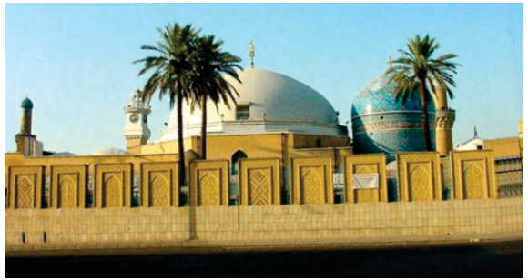
ਕਾਦਰੀਆ ਸੂਫੀ ਮਤ ਦੇ ਬਾਨੀ ਅਬਦੁਲ ਕਾਦਰ ਗਿਲਾਨੀ ਦਾ ਮਕਬਰਾ- ਬਗਦਾਦ

ਇਸ ਕਰਕੇ ਗੁਰੂ ਸਾਹਿਬ ਦਾ ਬਗਦਾਦ ਤਾਂ ਜਾਣਾ ਬਣਦਾ ਹੀ ਸੀ ਪਰ ਕਈ ਲਿਖਾਰੀ ਬਿਨਾਂ ਸੋਚੇ ਸਮਝੇ ਗੁਰੂ ਸਾਹਿਬ ਦਾ ਕਾਇਰੋ, ਦਮਿਸ਼ਕ (ਸਾਮ-ਸੀਰੀਆ) ਅਤੇ ਰੋਮ ਤਬਰੇਜ, ਤਹਿਰਾਨ, ਮਸ਼ਹਦ, ਸਮਰਕੰਦ, ਤਾਸ਼ਕੰਦ ਆਦਿ ਜਾਣਾ ਵੀ ਲਿਖ ਗਏ ਹਨ। (ਫਿਰ ਅੱਜ ਕਲ ਦੇ ਲਿਖਾਰੀ ਤਾਂ ਗੁਰੂ ਸਾਹਿਬ ਨੂੰ ਸਿੰਘਪੁਰ, ਅਤੇ ਕੁਝ ਇੰਸਤਨਬੁਲ, ਰੋਮ ਅਤੇ ਇਥੋਂ ਤਕ