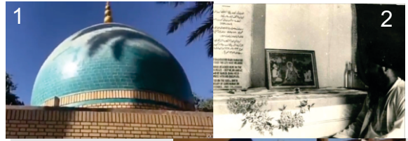
1. ਇਰਾਕੀਆਂ ਪੀਰ ਬਹਿਲੋਲ ਦਾਨਾ ਦਾ ਮਕਬਰਾ ਤਾਂ ਵਧੀਆ ਬਣਾ ਲਿਆ ਹੈ। ਜਿਹੜੀ ਕੰਧ ਨਜ਼ਰ ਆ ਰਹੀ ਹੈ ਇਹ ਗੁਰਦੁਆਰਾ ਸਾਹਿਬ ਨਾਲ ਸਾਂਝੀ ਹੈ। 2. ਉਹ ਥੜਾ ਸਾਹਿਬ ਮਿਟਾ ਦਿਤਾ ਗਇਆ ਹੈ। ਜਿਥੇ ਕਿਸੇ ਵੇਲੇ ਗਿਆਨੀ ਸੰਤ ਸਿੰਘ ਮਸਕੀਨ ਨੇ ਥੜਾ ਸਾਹਿਬ ਦੇ ਦਰਸ਼ਨ ਕੀਤੇ ਸਨ। 3. ਨਵੰਬਰ 2017 ਵਿਚ ਇਕ ਸਿੱਖ ਨੇ ਇਸ ਸਥਾਨ ਬਾਰੇ ਵੀਡੀਓ ਯੂਟਿਊਬ ਤੇ ਪਾਈ ਹੈ ਉਸ ਮੁਤਾਬਿਕ ਉਸ ਦੀ ਫੋਟੋ ਤੋਂ ਪਿਛੇ ਜੋ ਕੰਧ ਦਿਖਾਈ ਦੇ ਰਹੀ ਹੈ ਇਥੇ ਥੜਾ ਤੇ ਸਿਲਲੇਖ ਹੁੰਦਾ ਸੀ।

ਤਾਜਾ ਰਪਟਾਂ ਅਨੁਸਾਰ ਗੁਰੂ ਸਾਹਿਬ ਦੀ ਯਾਦਗਾਰ ਤੇ ਆਈ ਐਸ ਐਸ ਐਸ ਦੇ ਬਗਦਾਦ ਦੇ ਕਬਜ਼ੇ ਦੌਰਾਨ ਜਾਣ ਬੁੱਝ ਕੇ