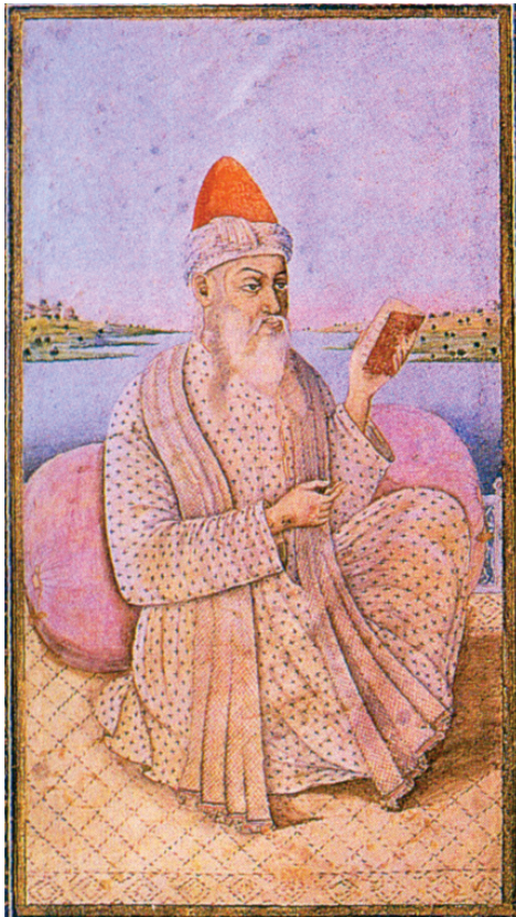
ਮੁਸਲਮਾਨ ਲਹਿਜੇ ਵਿਚ ਗੁਰੂ ਸਾਹਿਬ ਦੀ ਹੱਥ ਬਣੀ ਤਸਵੀਰ। ਇਹ ਲਖਨਊ ਘਰਾਣੇ ਕੋਲ ਹੁੰਦੀ ਸੀ