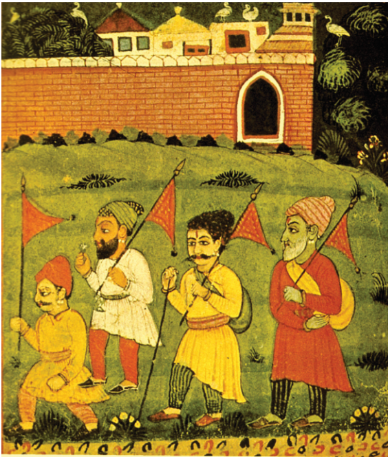
ਦੇਵੀ ਭਗਤ ਭਾਈ ਲਹਿਣਾ ਭਵਨੀ (ਵੈਸ਼ਨੋ ਦੇਵੀ) ਜਾਂਦਾ ਹੋਇਆ। (ਬੀ:40)

ਸ਼ਰਮਸਾਰ ਹੋਇਆ ਲਹਿਣਾ ਗੁਰੂ ਸਾਹਿਬ ਦੇ ਚਰਨ ਛੂਹਦਾ ਹੈ। "ਗੁਰੂ ਜੀ ਮੈਨੂੰ ਮਾਫ ਕਰ ਦੋ। ਮੈਂ ਤੁਹਾਨੂੰ ਪਛਾਣਿਆ ਨਹੀਂ ਸੀ। ਮੈਂ ਗੁਨਾਹਗਾਰ ਹਾਂ ਤੁਹਾਨੂੰ ਲੱਗਾਮ ਫੜਾਈ ਮੈਂ ਖੁੱਦ ਘੋੜੇ ਤੇ ਚੜਿਆ ਆਇਆ।" ਗੁਰੂ ਸਾਹਿਬ ਨੇ ਦਿਲਾਸਾ ਦਿੱਤਾ, "ਪੁੱਤਰਾ