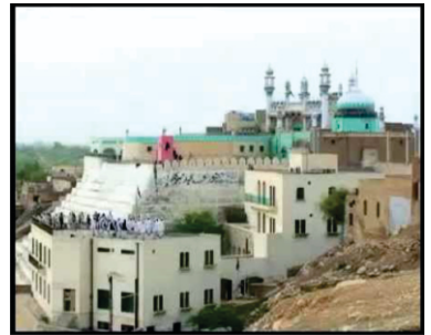
ਸਖੀ ਸਰਵਰ, ਡੇਰਾ ਗਾਜ਼ੀ ਖਾਨ

ਕਲਾਤ ਤੋਂ ਡਾਂਡੇ ਮੀਂਢੇ ਕਠਿਨ ਪਹਾੜੀ ਰਸਤੇ 400 ਕਿ. ਮੀ. ਦਾ ਸਫਰ ਕਰਕੇ ਸਾਹਿਬ ਸਖੀ ਸਰਵਰ ਪਹੁੰਚੇ। ਸਖੀ ਸਰਵਰ ਪਾਕਿਸਤਾਨੀ ਪੰਜਾਬ ਦੇ ਜਿਲਾ ਡੇਰਾ ਗਾਜ਼ੀ ਖਾਨ ਵਿਚ ਸੁਲੇਮਾਨ ਪਹਾੜੀਆਂ ਦੀ ਘਾਟੀ ਵਿਚ ਮੌਜੂਦ ਹੈ। ਸਖੀ ਸਰਵਰ ਸਾਂਝੇ ਪੰਜਾਬ ਦੇ ਵੱਡੇ ਪੰਥਾਂ ਵਿਚੋਂ ਹੈ। ਇਸ ਦੇ ਮੰਨਣ ਵਾਲੇ ਮੁਸਲਮਾਨ, ਸਿੱਖ ਤੇ ਹਿੰਦੂ ਤਿੰਨੋਂ ਤਬਕਿਆਂ ਵਿਚੋਂ ਹੀ ਹਨ। ਇਨ੍ਹਾਂ ਨਿਰਾ ਪੰਜਾਬੀ ਲੋਕ ਹੀ ਨਹੀਂ ਮੰਨਦੇ ਇਹ ਸਿੱਧੀ, ਬਲੋਚੀ ਤੇ ਕੁਝ ਹੱਦ ਤੱਕ ਰਾਜਸਥਾਨੀ ਲੋਕਾਂ ਵਿਚ ਵੀ ਮੰਨਿਆ ਜਾਂਦਾ ਹੈ। ਆਪਣੇ ਸੰਗ ਵਿਚ ਇਹ ਲੋਕ ਗਾਉਂਦੇ ਵਜਾਉਂਦੇ ਢੋਲ ਨਾਲ ਨੱਚਦੇ ਸਖੀ ਸਰਵਰ ਦੇ ਸਥਾਨ ਤੇ ਪਹੁੰਚਦੇ ਹਨ। ਇਥੇ ਅਪ੍ਰੈਲ ਦੇ ਮਹੀਨੇ ਮੇਲਾ ਲਗਦਾ ਹੈ। ਪਿੱਛੇ 4 ਅਪ੍ਰੈਲ 2011 ਨੂੰ ਇਥੇ ਕੱਟੜਵਾਦੀ ਮੁਸਲਮਾਨਾਂ ਨੇ ਬੰਬ ਨਾਲ ਕੋਈ 40-45 ਸ਼ਰਧਾਲੂ ਮਾਰ ਦਿੱਤੇ ਸਨ।