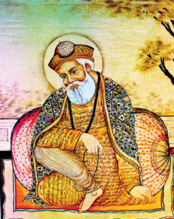
ਬਗਦਾਦ ਵਾਲਾ ਚੋਲੇ ਪਹਿਨੇ ਗੁਰੂ ਸਾਹਿਬ ਦੀ ਹੱਥ ਬਣੀ ਤਸਵੀਰ। ਇਸ ਚੋਲੇ ਤੇ ਕੁਰਾਨ ਦੀਆਂ ਆਇਤਾਂ ਦਰਜ ਹਨ।

ਬਖਸ਼ਿਸ਼ ਸਦਕਾ ਸ਼ਾਹ ਸ਼ਰਫ ਵੀ ਅਮਰ ਹੋ ਗਿਆ।***