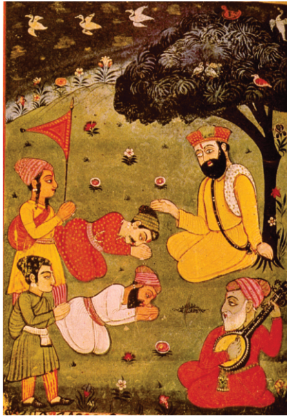
ਭਾਈ ਲਹਿਣਾ ਤੇ ਹੋਰ ਮਾਤਾ ਦੇ ਭਗਤ ਗੁਰੂ ਸਾਹਿਬ ਦੇ ਚਰਨਾਂ ਤੇ।(ਬੀ:40 ਤਸਵੀਰ। ਇਥੇ ਭਾਈ ਮਰਦਾਨੇ ਨੂੰ ਵੀ ਦਿਖਾਇਆ ਗਇਆ ਹੈ ਜੋ ਇਤਹਾਸਿਕ ਤੌਰ ਤੇ ਗਲਤ ਹੈ।)

ਦੁੱਧ ਛੱਕਣ ਤੋਂ ਬਾਦ ਲਹਿਣਾ ਦੀਵਾਨ ਵਿਚ ਜਿਵੇਂ ਜਾਂਦਾ ਹੈ ਗੁਰੂ ਸਾਹਿਬ ਇਸ਼ਾਰਾ ਕਰਕੇ ਆਪਣੇ ਕੋਲ ਬਹਿਣ ਲਈ ਕਹਿੰਦੇ ਨੇ।