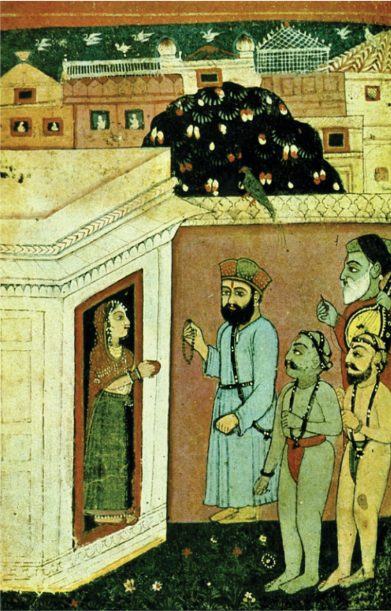
ਮੂਲੇ ਰਾਣੀ ਬੋਲੀ, “ਬਾਬਾ ਜੀ ਉਹ ਤਾਂ ਘਰ ਹੈਨੀਗੇ। ਤੁਸੀਂ ਫਿਰ ਕਿਸੇ ਵੇਲੇ ਆ ਜਾਇਓ”। (ਬੀ:40 ਤਸਵੀਰ। ਇਥੇ ਫਿਰ ਭਾਈ ਮਰਦਾਨੇ ਨੂੰ ਗਲਤੀ ਨਾਲ ਦਿਖਾਇਆ ਗਇਆ ਹੈ।

ਉਡਾਇਆ ਕਿ ਇਹਨੂੰ ਵਹੁਟੀ ਦੀ ਯਾਦ ਆ ਰਹੀ ਹੈ। ਪਰ ਗੁਰੂ ਸਾਹਿਬ ਨੇ ਮੂਲੇ ਨੂੰ ਥਾਪੀ ਦਿੱਤੀ ਤੇ ਲਹੌਰ ਵਲ ਜਾ ਰਹੇ ਕਾਫਲੇ ਨਾਲ ਮੂਲੇ ਨੂੰ ਵਾਪਸ ਭੇਜ ਦਿੱਤਾ।