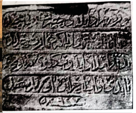
ਪੀਰ ਬਹਿਲੋਲ ਦਾਨਾ ਦੇ ਮਕਬਰੇ ਲਾਗੇ ਬਣੇ ਮੰਜੀ ਸਾਹਿਬ ਦੀ ਪੁਰਾਣੀ ਤਸਵੀਰ। 2003 ਵਿਚ ਇਰਾਕ ਦੀ ਖਾਨਾਜ਼ਰੀ ਮੌਕੇ ਇਸ ਗੁਰਦੁਆਰੇ ਤੇ ਵੀ ਬੰਬ ਸੁੱਟੇ ਗਏ ਸਨ। ਥੜਾ ਸਾਹਿਬ ਦਾ ਨੁਕਸਾਨ ਹੋਇਆ ਹੈ ਪਰ ਗੁਰਦੁਆਰਾ ਸਾਹਿਬ ਮੌਜੂਦ ਹੈ। ਇਥੇ ਹੀ ਸਿਲਲੇਖ (ਸੋਜੇ) ਹੁੰਦਾ ਸੀ।

ਕੁੱਕੜ ਬਿਰਾਜਮਾਨ ਹੈ। ਰਜਾ ਮੰਨ ਹੀ ਮੰਨ ਵਿਚ ਮੁਸਕਰਾ ਪਿਆ। ਸੋਚਿਆ ਇਹਦੇ ਕੋਲੋਂ ਰੋਟੀ ਲੈ ਲਵੋ। ਫਿਰ ਖਿਆਲ ਆਇਆ ਬਾਬਾ ਜੀ ਨੇ ਤਾਂ ਕਿਹਾ ਸੀ ਕਿ ਕਿਸੇ ਇਨਸਾਨ ਕੋਲੋਂ ਰੋਟੀ ਲਿਆਈ।