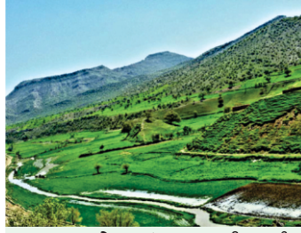
ਬਾਲਾ ਦਾ ਦਰਬੇਲਾ ਜਾਂ ਦਰਬ ਏ ਰਿਕਾ ਦੀਆਂ ਪਹਾੜੀਆਂ ਜਿਥੇ ਗੁਰੂ ਸਾਹਿਬ ਨੇ ਮਰਦਾਨੇ ਨੂੰ ਕਿਹਾ ਕਿ ਤੇਰੇ ਚਲਾਣੇ ਦਾ ਵੇਲਾ ਆ ਗਇਆ ਹੈ।

ਬਗਦਾਦ ਰਹਿੰਦਿਆਂ ਹੀ ਮਰਦਾਨੇ ਦੀ ਸਿਹਤ ਕੁਝ ਵਿਗੜ ਚੁੱਕੀ ਸੀ। ਥੋੜਾ ਠੀਕ ਹੋਣ ਤੇ ਮਰਦਾਨੇ ਨੇ ਛੇਤੀ ਘਰ ਪਰਤਣ ਦੀ ਜਿੱਦ ਕੀਤੀ। ਗੁਰੂ ਸਾਹਿਬ ਫਿਰ ਬਗਦਾਦ ਤੋਂ ਖੁਰਮਾਬਾਦ, ਅਲੀ ਗੁਦਾਰ, ਦਰਬਸਾਹ ਪਹਾੜ ਦੇ ਉਤਰ ਦੀ, ਇਸਫਾਹਾਨ, ਕਾਬੁਲ, ਪੇਸ਼ਾਵਰ ਹੁੰਦੇ ਹੋਏ ਕੋਈ 3500 ਕਿ. ਮੀ ਦਾ ਪੈਂਡਾ ਤਹਿ ਕਰਕੇ ਕਰਤਾਰਪੁਰ ਪਹੁੰਚਣ ਲਈ ਰਵਾਨਾ ਹੋ ਗਏ। ਬਹੁਤਾ ਕਠਨ ਪਹਾੜੀ ਰਸਤਾ ਸੀ। ਅਨੇਕਾਂ ਦਰਿਆ ਨਾਲੇ ਪਰਬਤ ਪਹਾੜ।