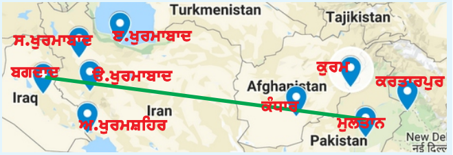
ਭਾਈ ਮਰਦਾਨੇ ਦੇ ਚਲਾਣੇ ਦੇ ਪਤੇ ਟਿਕਾਣੇ ਬਾਰੇ ਕੋਈ ਸ਼ੱਕ ਰਹਿ ਹੀ ਨਹੀ ਜਾਂਦਾ। ਬਾਲਾ ਜਨਮ ਸਾਖੀ ਨੇ ਜੋ ਇਸ਼ਾਰੇ ਦਿੱਤੇ ਹਨ ਉਹ ਨਕਸ਼ੇ ਤੇ ਪੂਰੇ ਉਤਰਦੇ ਹਨ। ਖੁਰਮਾਬਾਦ ਹੋਰ ਵੀ ਹੈਨ ਪਰ ਲੋਰੇਸਤਾਨ ਵਾਲਾ ਖੁਰਮਾਬਾਦ ਹੀ ਪੁਰਾਣਾ ਸ਼ਹਿਰ ਹੈ ਅਤੇ ਬਗਦਾਦ ਤੋਂ ਮੁਲਤਾਨ ਦੇ ਐਨ ਰਾਹ ਵਿਚ ਪੈਂਦਾ ਹੈ।

ਮਰਦਾਨੇ ਦੇ ਚਲਾਣੇ ਬਾਰੇ ਸਾਨੂੰ ਖਬਰ ਬਾਲੇ ਵਾਲੀ ਜਨਮ ਸਾਖੀ (ਪੰ. 252 ਅਤੇ 261), ਵਿਚੋਂ ਮਿਲਦੀ ਹੈ। ਬਦਕਿਸਮਤੀ ਨਾਲ ਮਰਦਾਨੇ ਦੇ ਅੰਤਮ ਅਸਥਾਨ ਬਾਰੇ ਵੀ ਵਿਵਾਦ ਹੈ। ਭਾਈ ਮਨੀ ਸਿੰਘ ਵਾਲੀ ਸਾਖੀ ਚਲਾਣਾ ਕਰਤਾਰਪੁਰ ਦਾ ਦਸਦੀ ਹੈ। ਨਾਲੇ ਗਿਆਨੀ (297) ਸਮੇਤ ਅਨੇਕਾਂ ਹੋਰ ਲਿਖਾਰੀਆਂ ਨੇ ਪੇਸ਼ਵਾਰ ਦੇ ਨੇੜੇ ਕੁਰਮ ਇਲਾਕੇ ਵਿਚ ਚਲਾਣਾ ਹੋਣਾ ਲਿਖਿਆ ਹੈ। ਨਾਲੇ ਸਾਲ 1524 ਈ. ਲਿਖਿਆ ਹੋਇਆ ਹੈ ਜੋ ਕਿਸੇ ਤਰਾਂ ਵੀ ਦਰੁਸਤ ਨਹੀ।