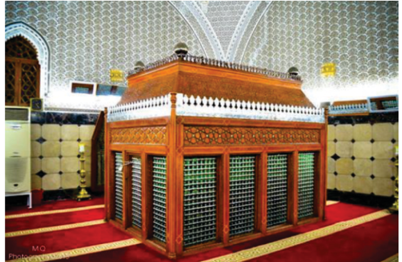
ਕੀ ਇਸ ਨੂੰ ਅਬੂ ਹਨੀਫਾ ਦੀ ਕਬਰ ਕਹਿਓ? 1508 ਈ ਵਿਚ ਪ੍ਰਸਿੱਧ ਸੁੰਨੀ ਕਠੂਨ ਸਾਜ ਅਬੂ ਹਨੀਫਾ ਦੀ ਕਬਰ ਦੀ ਸ਼ਹਿਨਸ਼ਾਹ ਇਸਮਾਈਲ ਨੇ ਰੱਜ ਕੇ ਬੇਅਬਦੀ ਕਰਵਾਈ। ਕਬਰ ਪੁੱਟੀ। ਹਨੀਫਾ ਦੀਆਂ ਅਸਤੀਆਂ ਨੂੰ ਸਾੜਿਆ ਤੇ ਉਹਦੀ ਕਬਰ ਵਾਲੀ ਥਾਂ ਤੇ ਇਕ ਕੁੱਤੇ ਨੂੰ ਦਫਨਾ ਦਿੱਤਾ। ਫਿਰ ਕਬਰ ਵਾਲੀ ਥਾਂ ਨੇ ਟੱਟੀਆਂ ਬਣਵਾ ਦਿੱਤੀਆਂ ਤੇ ਨਾਲ ਹੀ 25 ਦਿਨਾਰ ਦਾ ਇਨਾਮ ਉਸ ਬੰਦੇ ਲਈ ਰੱਖ ਦਿੱਤਾ ਕਿ ਜਿਹੜਾ ਵੀ ਇਥੇ ਟੱਟੀ ਪਿਸ਼ਾਬ ਜਾਵੇ। 1534 ਵਿਚ ਬਗਦਾਦ ਫਿਰ ਉਸਮਾਨੀਆ ਹਕੂਮਤ ਨੇ ਜਿੱਤ ਲਿਆ। ਉਹਨਾਂ ਕਬਰ ਦੁਬਾਰਾ ਬਣਵਾ ਦਿੱਤੀ। ਨਾਲੇ ਅਬੂ ਹਨੀਫਾ ਦੇ ਨਾਂ ਤੇ ਜਿਹੜੀ ਮਸੀਤ ਬਣਾਈ ਉਹ ਦੁਨੀਆਂ ਦੀਆਂ ਖੂਬਸੂਰਤ ਮਸੀਤਾਂ ਵਿੱਚੋਂ ਇਕ ਹੈ।

ਸੋ ਮੱਕੇ ਮਦੀਨੇ ਦੇ ਧਾਰਮਿਕ ਵਿਦਵਾਨਾਂ ਵਲੋਂ ਗੁਰੂ ਸਾਹਿਬ ਨੂੰ ਬਗਦਾਦ ਜਾਣ ਦੀ ਸਿਫਾਰਿਸ਼ ਕਰਨ ਪਿੱਛੇ ਉਨਾਂ ਦਾ ਆਪਣਾ ਮਤਲਬ ਵੀ ਸੀ। ਕਿਉਂਕਿ ਬਗਦਾਦ ਵਿਖੇ ਸਫਵੀ (ਸਾਫੀ) ਸਲਤਨਤ ਦਾ ਰਾਜ ਹੋ ਚੁੱਕਾ ਸੀ ਜੋ ਸੁੰਨੀ ਮੁਸਲਮਾਨ ਪ੍ਰਚਾਰਕਾਂ