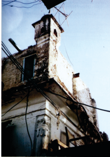
ਗੁਰਦੁਆਰਾ ਚੁਬੱਚਾ ਸਾਹਿਬ ਧਰਮਪੁਰਾ ਲਾਹੌਰ। ਇਸ ਅਸਥਾਨ ਤੇ ਵੀ ਗੁਰੂ ਸਾਹਿਬ ਇਕ ਵੇਰਾਂ ਠਹਿਰੇ ਸਨ। ਅੱਜ ਇਥੇ ਯੂ. ਪੀ ਤੋਂ ਗਏ ਪਨਾਹਗੀਰ ਵਸ ਰਹੇ ਨੇ। -ਤਸਵੀਰ ਕੈਸਰ।

ਹਰ ਪਾਸੇ ਧੰਨ ਬਾਬਾ ਨਾਨਕ, ਧੰਨ ਗੁਰੂ ਨਾਨਕ ਹੋ ਰਹੀ ਸੀ।