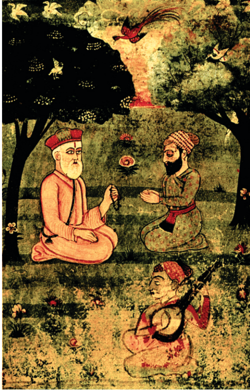
ਚੰਗੀ ਤਰਾਂ ਸਿੱਖਾਂ ਨੂੰ ਠੋਕ ਵਜਾ ਕੇ ਪ੍ਰੀਖਿਆ ਅਤੇ ਫਿਰ ਜਾ ਕੇ ਭਾਈ ਲਹਿਣੇ ਨੂੰ ਗੁਰਿਆਈ ਦਾ ਟਿੱਕਾ ਦਿੱਤਾ। “ਜਾਂ ਸੁਧੋਸ ਤਾਂ ਲਹਣਾ ਟਿਕਿਓਨ” ਖ਼ੈ:40 ਤਸਵੀਰ। ਇਥੇ ਫਿਰ ਭਾਈ ਮਰਦਾਨੇ ਨੂੰ ਵੀ ਦਿਖਾ ਦਿੱਤਾ ਹੈ ਜੋ ਕਿ ਇਤਹਾਸਿਕ ਤੌਰ ਤੇ ਗਲਤ ਹੈ। ਭਾਈ ਜੀ ਦਾ ਚਲਾਣਾ ਹੋ ਚੁੱਕਾ ਸੀ।

ਸਿੱਖੀ ਦੀ ਲਹਿਰ ਨੂੰ ਪ੍ਰਚੰਡ ਰੱਖਣ ਲਈ ਗੁਰੂ ਸਾਹਿਬ ਨੇ ਮਹਿਸੂਸ ਕਰ ਲਿਆ ਸੀ ਕਿ ਉਹਨਾਂ ਲਈ ਕਾਬਲ ਉਤਰਾਧਿਕਾਰੀ ਜਰੂਰੀ ਹੈ। ਉਹਨਾਂ ਦੇ ਪੁੱਤਰਾਂ ਨੇ ਲਗਾਤਾਰ ਗੁਰੂ ਸਾਹਿਬ ਦੀ ਵਿਰੋਧਤਾ ਹੀ ਸੁਣੀ ਹੋਈ ਸੀ, ਜਿਸ ਕਾਰਨ ਉਹ ਪੂਰੀ ਤਰਾਂ ਆਗਿਆਕਾਰ ਨਹੀਂ ਸਨ। ਭਾਈ ਲਹਿਣੇ ਨੂੰ ਗੁਰੂ ਸਾਹਿਬ ਨੇ ਪਹਿਲੀ ਨਜ਼ਰੇ ਹੀ ਪਛਾਣ ਲਿਆ ਸੀ। ਪਰ ਜਿਵੇਂ ਗੁਰੂ ਸਾਹਿਬ ਭਾਈ ਲਹਿਣੇ ਨੂੰ ਸੰਗਤ ਵਿਚ ਵੱਡੀ ਜ਼ਿੰਮੇਵਾਰੀ ਸੌਂਪਦੇ ਸਨ ਤਾਂ ਕਈ ਗੁਰਸਿੱਖ ਭਾਈ ਜੀ ਨਾਲ ਈਰਖਾ ਕਰਦੇ ਸਨ। ਗੁਰੂ ਸਾਹਿਬ ਨੇ ਫਿਰ ਗੁਰਿਆਈ ਲਈ ਅਣਐਲਾਨੀ ਪ੍ਰੀਖਿਆ ਸ਼ੁਰੂ ਕਰ ਦਿੱਤੀ। ਉਸ ਵੇਲੇ ਉਹਨਾਂ ਨੇ ਅਜਿਹੇ ਕੌਤਕ ਕੀਤੇ ਕਿ ਜਿੰਨਾਂ ਸਿੱਖਾਂ ਦਾ ਗੁਰੂ ਵਿਚ ਭਰੋਸਾ ਪੂਰਨ ਨਹੀਂ ਸੀ ਉਹ ਆਪਣੇ ਆਪ ਹੌਲੀ ਹੌਲੀ ਪਰਾਂ ਹੱਟਦੇ ਗਏ। ਇਹ ਕਾਰਜ ਗੁਰੂ ਸਾਹਿਬ ਨੇ ਆਪਣੇ ਚਲਾਣੇ ਤੋਂ ਚੋਖਾ ਸਮਾਂ ਪਹਿਲਾਂ ਹੀ ਪੂਰਾ ਕਰ ਲਿਆ ਸੀ। ਕੁਝ ਇਤਹਾਸਕਾਰਾਂ ਨੇ ਲਿਖਿਆ ਹੈ ਕਿ ਲੱਗ ਪੱਗ ਦੋ ਸਾਲ ਪਹਿਲਾਂ ਹੀ ਜਾਨਸ਼ੀਨ ਦੀ ਚੋਣ ਕਰ ਲਈ ਸੀ।