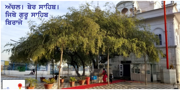
ਅੱਚਲ। ਬੇਰ ਸਾਹਿਬ। ਜਿਥੇ ਗੁਰੂ ਸਾਹਿਬ ਬਿਚਾਰਜੇ

ਗੁਰੂ ਸਾਹਿਬ ਨੇ ਐਲਾਨ ਕੀਤਾ ਕਿ ਭਾਈ ਹੁਣ ਹੋਰ ਜਿਆਦਾ ਨਹੀਂ ਜਿਸ ਕਿਸੇ ਨੇ ਰਬਾਬ ਲੁਕਾਈ ਹੈ ਉਹ ਪ੍ਰਗਟ ਕਰੇ ਨਹੀਂ