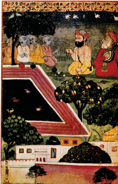
ਬੀ:40 ਨੇ ਅੱਚਲ ਵਟਾਲੇ ਦੀ ਸਾਖੀ ਨੂੰ ਕੁਝ ਇਸ ਤਰਾਂ ਚਿਤ੍ਰਿਆ ਵਾ। ਇਥੇ ਫਿਰ ਕਲਾਕਾਰ ਭਾਈ ਮਰਦਾਨੇ ਨੂੰ ਵਿਖਾ ਰਿਹਾ ਹੈ ਜੋ ਗਲਤ ਹੈ।

ਫਰਵਰੀ/ਮਾਰਚ 1534 ਈ. ਦੀ ਗਲ ਹੈ। ਜੋਗੀਆਂ ਨੇ ਐਤਕਾਂ ਸ਼ਿਵਰਾਤ੍ਰੀ ਮੇਲੇ ਬਾਰੇ ਵਾਧੂ ਪ੍ਰਚਾਰ ਕੀਤਾ। ਉਂਜ ਵੀ ਅੱਚਲ ਦਾ ਮੇਲਾ ਖੂਬ ਪ੍ਰਸਿੱਧ ਹੁੰਦਾ ਸੀ। ਗੁਰੂ ਸਾਹਿਬ ਇਸ ਵੇਲੇ ਕਰਤਾਰਪੁਰ ਹੀ ਬਰਾਜੇ ਹੋਏ ਸਨ। ਭਾਈ ਲਹਿਣਾ ਤੇ ਹੋਰ ਗੁਰਸਿੱਖਾਂ ਨੂੰ ਨਾਲ ਲੈ ਕੇ ਸਾਹਿਬ ਵੀ ਅੱਚਲ ਦੇ ਮੇਲੇ ਵਿੱਚ ਪਹੁੰਚ ਗਏ। ਮੰਦਰ ਦੁਆਲੇ ਸੈਕੜੇ ਹੋਰ ਵੀ ਹੱਟੀਆਂ ਲੱਗੀਆਂ ਹੋਈਆਂ ਸਨ। ਫਿਰ ਸਭਿਆਚਾਰਕ ਪ੍ਰੋਗਰਾਮ ਕਰਨ ਵਾਲਾ ਹਰ ਕਲਾਕਾਰ ਅਜਿਹੇ ਮੇਲਿਆਂ ਵਿੱਚ ਪਹੁੰਚਿਆ ਕਰਦਾ ਸੀ। ਗੁਰੂ ਸਾਹਿਬ ਦਾ ਤੰਬੂ ਮੰਦਰ ਦੇ ਦੱਖਣ ਪਾਸੇ ਲੱਗਾ। ਕਿਉਂਕਿ 1534 ਈ. ਤੱਕ ਗੁਰੂ ਨਾਨਕ ਦੀ ਸ਼ੋਹਰਤ ਚੁਫੇਰੇ ਫੈਲ ਚੁੱਕੀ ਸੀ। ਬਚਨ ਸੁਣਨਾਂ ਜਾਂ ਹੁਹਾਨੀਅਤ ਦਾ ਗਿਆਨ ਲੈਣਾ ਵੱਖਰੀ ਗਲ, ਬਹੁਤੇ ਲੋਕ ਗੁਰੂ ਸਾਹਿਬ ਨੂੰ ਵੇਖਣ ਜਾਂ ਦਰਸਨ ਕਰਨ ਲਈ ਉਲਟ ਪਏ। ਗੁਰੂ ਸਾਹਿਬ ਬਾਬਤ ਲੋਕਾਂ ਦੀ ਖਿੱਚ