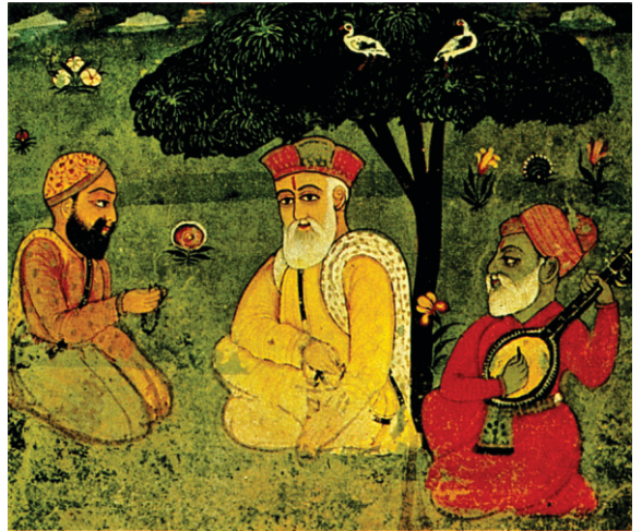
ਫੈਲਸੂਫ ਜਾਂ ਫਿਲਾਸਫਰ ਸ਼ੇਖ ਮਾਲੂ ਗੁਰੂ ਸਾਹਿਬ ਨਾਲ ਗੁਰੂਗੁ ਕਰਦਾ ਹੋਇਆ। ਬੀ:40 ਤਸਵੀਰ (ਇਥੇ ਫਿਰ ਭਾਈ ਮਰਦਾਨੇ ਨੂੰ ਨਾਲ ਵਿਖਾ ਦਿਤਾ ਹੈ ਜਦੋਂ ਕਿ ਉਸ ਦਾ ਚਲਾਣਾ ਹੋ ਚੁੱਕਾ ਸੀ।)

ਬਸੰਤੁ ਹਿੰਡੋਲੁ ਮਹਲਾ ੧ ਘਰੁ ੨ ੧੯ ਸਤਿਗੁਰ ਪ੍ਰਸਾਦਿ ॥ ਨਉ ਸਤ ਚਉਦਹ ਤੀਨਿ ਚਾਰਿ ਕਰਿ ਮਹਲਤਿ ਚਾਰਿ ਬਹਾਲੀ ॥ ਚਾਰੇ ਦੀਵੇ ਚਹੁ ਹਥਿ ਦੀਏ ਏਕਾ ਏਕਾ ਵਾਰੀ ॥੧॥ ਮਿਹਰਵਾਨ ਮਧੁਸੂਦਨ ਮਾਧੋ ਐਸੀ ਸਕਤਿ ਤੁਮਾਰੀ ॥੧॥ ਰਹਾਉ ॥ ਘਰਿ ਘਰਿ ਲਸਕਰੁ ਪਾਵਕੁ ਤੇਰਾ ਧਰਮੁ ਕਰੇ ਸਿਕਦਾਰੀ ॥ ਧਰਤੀ ਦੇਗ ਮਿਲੈ ਇਕ ਵੇਰਾ ਭਾਗੁ ਤੇਰਾ ਭੰਡਾਰੀ ॥੨॥ ਨਾ ਸਾਬੁਰੁ ਹੋਵੈ ਫਿਰਿ ਮੰਗੈ ਨਾਰਦੁ ਕਰੇ ਖੁਆਰੀ ॥ ਲਬੁ ਅਧੇਰਾ ਬੰਦੀਖਾਨਾ ਅਉਗੁਣ ਪੈਰਿ ਲਹਾਰੀ ॥੩॥ ਪੁੰਜੀ ਮਾਰ ਪਵੈ ਨਿਤ ਮੁਦਗਰ ਪਾਪੁ ਕਰੇ ਕੁੰਟਵਾਰੀ ॥ ਭਾਵੈ ਚੰਗਾ ਭਾਵੈ ਮੰਦਾ ਜੈਸੀ ਨਦਰਿ ਤੁਮਾਰੀ ॥੪॥ ਆਦਿ ਪੁਰਖ ਕਉ ਅਲਹੁ ਕਹੀਐ ਸੇਖਾਂ ਆਈ ਵਾਰੀ ॥ ਦੇਵਲ ਦੇਵਤਿਆ ਕਰੁ ਲਾਗਾ ਐਸੀ ਕੀਰਤਿ ਚਾਲੀ ॥੫॥ ਕੁਜਾ ਬਾਂਗ ਨਿਵਾਜ ਮੁਸਲਾ ਨੀਲ ਰੂਪ ਬਨਵਾਰੀ ॥ ਘਰਿ ਘਰਿ ਮੀਆ ਸਭਨਾਂ ਜੀਆਂ ਬੋਲੀ ਅਵਰ ਤੁਮਾਰੀ ॥੬॥ ਜੋ ਤੂ ਮੀਰ ਮਹੀਪਤਿ ਸਾਹਿਬੁ ਕੁਦਰਤਿ ਕਉਣੁ ਹਮਾਰੀ ॥ ਚਾਰੇ ਕੁੰਟ ਸਲਾਮੁ ਕਰਹਿਗੈ ਘਰਿ ਘਰਿ ਸਿਫਤਿ ਤੁਮਾਰੀ ॥੭॥ ਤੀਰਥ ਸਿੰਮ੍ਰਿਤਿ ਪੁੰਨ ਦਾਨ ਕਿਛੁ ਲਾਹਾ ਮਿਲੈ