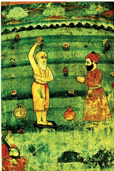
ਬੀ:40 ਤਸਵੀਰ। ਇਸ ਵਿੱਚ ਕਲਾਕਾਰ (ਆਲਮ ਚੰਦ ਰਾਜ-ਮਿਸਤ੍ਰੀ) ਨੇ ਗੁਰੂ ਸਾਹਿਬ ਨੂੰ ਇਸ਼ਨਾਨ ਕਰਦੇ ਹੋਏ ਚਿੱਤ੍ਰਿਆ ਹੈ। ਲਾਗੇ ਭਾਈ ਲਹਿਣਾ ਖੜੇ ਹਨ ਤੇ ਹੇਠਾਂ ਭਾਈ ਮਰਦਾਨਾ। ਇਤਹਾਸਿਕ ਪੱਖਾਂ ਤੋਂ ਇਸ ਤਸਵੀਰ ਵਿੱਚ ਕਈ ਤਰੱਟੀਆਂ ਹਨ। ਭਾਈ ਮਰਦਾਨੇ ਦਾ ਚਲਾਣਾ ਚਿਰੋਕਣਾ ਪਹਿਲਾ ਹੋ ਚੁੱਕਾ ਹੈ। ਸਾਹਿਬ ਨੂੰ ਤਿਲਕ ਵਿੱਚ ਪਰ ਕੇਸਾਂ ਤੋਂ ਬੰਨ੍ਹੀ ਦਿਖਾਇਆ ਗਇਆ ਹੈ। ਧਿਆਨ ਰਹੇ ਬੀ:40 ਦਾ ਰਚਨਾ ਕਾਲ 1790 ਬਿਕ੍ਰਮੀ ਹੈ ਭਾਵ ਗੁਰੂ ਸਾਹਿਬ ਦੇ ਚਲਾਣੇ ਤੋਂ 194 ਸਾਲ ਬਾਦ।