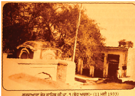
ਅੱਚਲ ਸਾਹਿਬ ਸੰਨ 1933ਈ. (ਸਾਈਕਲ ਯਾਤਰੀ)

ਕਿਲਕਾਰੀਆਂ ਪਏ ਮਾਰਨ। ਗੁਰੂ ਸਾਹਿਬ ਨੂੰ ਕਹਿਣ ਲੱਗੇ 'ਗ੍ਰਿਸਤੀ ਨਾਨਕ ਵਿਖਾ ਕੋਈ ਚਮਤਕਾਰ ਜੇ ਤੇਰੇ ਪੱਲੇ ਕੁੱਝ ਹੈ ਈ ਤਾਂ? ਇੱਕ ਗੜ੍ਹਵੀ ਲੱਭ ਕੇ ਇਹ ਹੰਕਾਰ ਵਿੱਚ ਆ ਗਏ। ਗੁਰੂ ਸਾਹਿਬ ਨੂੰ ਲਲਕਾਰਿਆ ਕਿ ਇਹ ਤਾਂ ਵੰਨਗੀ ਸੀ। ਅਸਲ ਖੇਡ ਤਾਂ ਹੁਣ ਸ਼ੁਰੂ