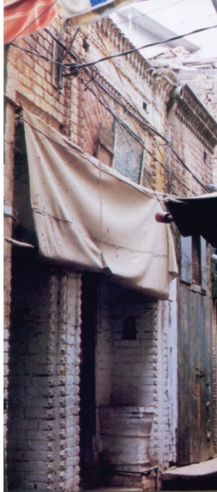
ਧਰਮਸਾਲ ਪਹਿਲੀ ਪਾਤਸ਼ਾਹੀ ਚੁਹੱਟਾ ਮੁਫਤੀ ਬਾਕਰ, ਲਾਹੌਰ।

ਇਕ ਘੜੀ ਮੰਨ ਲਓ ਕੋਈ ਬੰਦਾ ਚੋਰੀ ਚਕਾਰੀ ਕਰਕੇ ਆਪਣੇ ਬਜ਼ੁਰਗਾਂ (ਪਿਤਰਾਂ) ਦੇ ਨਮਿਤ ਸਰਾਧ ਕਰਾਵੇ ਤਾਂ ਭਾਈ ਪਰਲੋਕ ਵਿਚ ਤਾਂ ਉਹ ਪਦਾਰਥ ਪਛਾਣੇ ਜਾਣੇ ਨੇ। ਇਸ ਤਰ੍ਹਾਂ ਕਰਕੇ ਉਹ ਬੰਦਾ ਖੁਦ ਹੀ ਆਪਣੇ ਪਿਤਰਾਂ ਨੂੰ ਭੀ ਚੋਰ ਬਣਾਂਦਾ ਹੈ ਕਿਉਂਕਿ ਜਾਣੀ ਜਾਣ ਪ੍ਰਭੂ ਸਾਹਮਣੇ ਉਹਨਾਂ ਪਾਸੋਂ ਚੋਰੀ ਦਾ