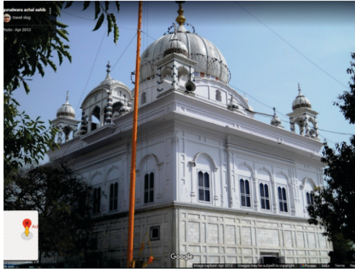
ਗੁਰਦੁਆਰਾ ਬੇਰ ਸਾਹਿਬ ਅੱਚਲ ਬਟਾਲਾ

ਅੱਗੇ ਬੇਨਤੀਆਂ ਕਰਨ ਕਿ "ਬਾਬਾ ਜੀ ਸਾਡੇ ਤੇ ਵੀ ਕਿਰਪਾ ਕਰੋ। ਸਾਨੂੰ ਵੀ ਉਹ ਗੁਰ ਬਖਸ਼ੋ ਜਿਸ ਰਾਂਹੀ ਤੁਸੀ ਅਜਿਹੀ ਅਲੌਕਿਕ ਸਿੱਧੀ ਹਾਸਲ ਕੀਤੀ ਹੈ। ਉਹ ਕੀ ਰਾਜ ਹੈ ਸਾਡੇ ਨਾਲ ਵੀ ਸਾਂਝਾ ਕਰੋ। ਅਸੀ ਤਾਂ ਰੱਬ ਦੀ ਦੌੜ ਵਿਚ ਜਿੰਦਗੀ ਗਾਲ ਲਈ ਹੈ। ਸਾਡੇ ਤੇ ਤਰਸ ਕਰੋ।"