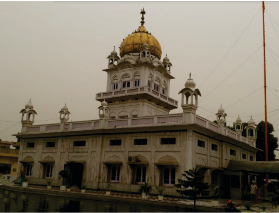
ਨਾਨਕਸਰ ਵੇਰਕਾ

ਦਰਗਹਿ ਮੈਂ ਖਰਾ। ਏਕ ਕੀ ਸਿਫਤ ਦੂਜੇ ਤੇ ਡਰਾ। ਨਾਨਕ ਕਹੈ ਸੁਣ ਪੀਰ ਅਦ੍ ਮਾਨ। ਏਕ ਖੁਦਾਇ ਦੂਜਾ ਸੈਤਾਨ।