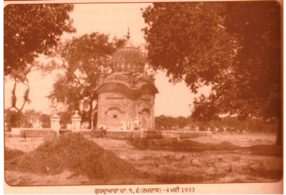
ਗੁਰਦੁਆਰਾ ਪਾਤਸ਼ਾਹੀ ਪਹਿਲੀ, ਨੇੜੇ ਸਮਾਧ ਬਾਬਾ ਬੁੱਢਾ ਜੀ। ਰਮਦਾਸ ਦੇ ਉੱਤਰ ਵਿੱਚ। (ਸਾਈਕਲ ਯਾਤਰੀ 4 ਮਈ, 1933)

* ਬਾਲੇ ਨੇ ਲਿਖਿਆ ਕਿ ਇਸ ਯਾਤਰਾ 'ਚ ਬਾਲਾ, ਅਜਿਤਾ ਰੰਧਾਵਾ ਅਤੇ ਬਾਬਾ ਬੁੱਢਾ ਗੁਰੂ ਸਾਹਿਬ ਦੇ ਨਾਲ ਸਨ। ਉੱਜ ਬਾਬਾ ਬੁੱਢਾ ਜੀ ਦੀ ਜੀਵਨੀ ਦੇਖਣ ਤੋਂ ਪਤਾ ਲਗਦਾ ਹੈ ਕਿ ਉਹ ਪਹਿਲੀ ਵਾਰ ਗੁਰੂ ਸਾਹਿਬ ਨੂੰ 1518 ਈ. ਨੂੰ ਮਿਲੇ ਸਨ। ਪਰ ਏਸੇ ਜੀਵਨੀ ਵਿੱਚ ਦਰਜ ਹੈ ਕਿ ਬੁੱਢਾ ਗੁਰੂ ਸਾਹਿਬ ਨਾਲ ਬਾਬਰ ਦੇ ਹਮਲੇ ਦੌਰਾਨ ਹੋਈ ਬਰਬਾਦੀ ਦੀ ਵੀ ਗਲ ਕਰਦਾ ਹੈ। ਸੰਭਾਵਨਾ ਇਹੋ ਹੈ ਕਿ ਬਾਬਾ ਬੁੱਢੇ ਦੀ ਗੁਰੂ ਸਾਹਿਬ ਨਾਲ ਪਹਿਲੀ ਮਿਲਣੀ ਚੌਥੀ ਉਦਾਸੀ ਤੋਂ ਬਾਦ ਹੀ ਹੋਈ।