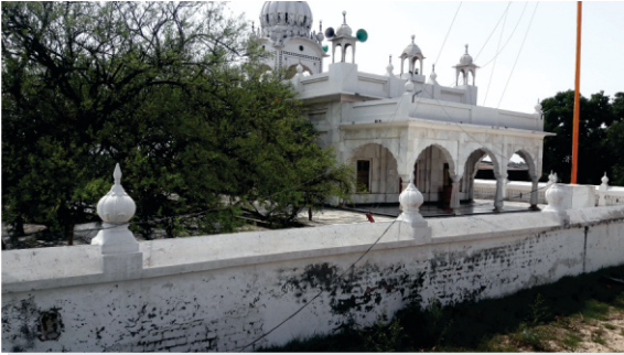
ਧਰਮਕੋਟ (ਨੇੜੇ ਪਿੰਡ ਸੌੜੀਆਂ ਅਤੇ ਕੜਿਆਲ) ਵਿਖੇ ਮੌਜੂਦ ਯਾਦਗਾਰੀ ਅਸਥਾਨ ਅਤੇ ਬੇਰੀ ਦਾ ਵਿਸ਼ਾਲ ਰੁੱਖ।

ਅਸਲ ਗੁਰੂ ਸਾਹਿਬ ਖਿਲਾਫ ਇਹ ਸ਼ਕਾਇਤ ਹਰ ਗੁਰੂ ਘਰ ਵਿਰੋਧੀ ਝੰਡੇ ਤੇ ਚਾੜ ਰਿਹਾ ਸੀ। ਕਿਉਂਕਿ ਜਦੋਂ ਕੋਈ ਸਾਧੂ ਬਣਿਆ ਜਵਾਨ ਸੰਨਿਆਸ ਤਿਆਗ ਵਾਪਸ ਘਰ ਆ ਜਾਂਦਾ ਸੀ ਤਾਂ ਲੋਕ ਉਹਨੂੰ ਬੁਰਾ ਸਮਝਦੇ ਸਨ। ਇਹ ਮੰਨਿਆ ਜਾਂਦਾ ਸੀ ਕਿ ਸੰਨਿਆਸ ਦੇ ਕਠਨ ਰਸਤੇ ਨੂੰ ਬੰਦਾ ਤਿਆਗ ਆਇਆ ਹੈ। ■ ਇਸ ਤੇ ਮਾਲੇ ਨੇ ਵੀ ਸਵਾਲ ਉਠਾਇਆ ਕਿ ਬਾਬਾ ਜੀ ਤੁਹਾਡੀ ਇਹ ਗਲ ਸਾਨੂੰ ਨਹੀਂ ਜਚੀ। ਕਦੀ ਤੁਸੀਂ ਸਾਧੂਆਂ ਵਾਲਾ ਲਿਬਾਸ ਵੀ ਕਰ ਲੈਂਦੇ ਹੋ? ਮੁਕਦੀ ਗਲ ਫੈਲਸੂਫ ਨੇ ਸਿੱਧਾ ਗੁਰੂ ਸਾਹਿਬ ਨੂੰ ਸਵਾਲ ਕਰਾ ਕਿ ਤੁਸੀਂ ਫਕੀਰੀ ਜਾਂ ਸੰਨਿਆਸ ਨੂੰ ਕਿਉਂ ਤਿਆਗਿਆ?