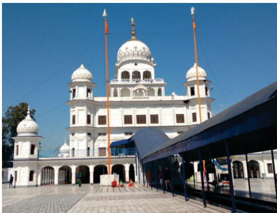
ਗੁਰਦੁਆਰਾ ਸਮਾਧ ਬਾਬਾ ਬੁੱਢਾ ਜੀ ਰਮਦਾਸ। 1933 ਵਿੱਚ ਇਹ ਅਸਥਾਨ ਗੁਰੂ ਨਾਨਕ ਪਾਤਸ਼ਾਹ ਦੀ ਚਰਨ ਛੋਹ ਕਰਕੇ ਪ੍ਰਸਿੱਧ ਸੀ। ਅੱਜ ਗੁਰੂ ਨਾਨਕ ਦਾ ਨਾਂ ਇਸ ਅਸਥਾਨ ਤੋਂ ਮਿੱਟ ਬੁੱਢਾ ਹੈ ਤੇ ਸਿਰਫ ਸਮਾਧ ਬਾਬਾ ਬੁੱਢਾ ਜੀ ਕਰਕੇ ਹੀ ਜਾਣਿਆ ਜਾਂਦਾ। ਸ਼੍ਰੋਮਣੀ ਕਮੇਟੀ ਦੇ ਰੰਗ ਢੰਗ ਨਿਆਰੇ।

ਗੁਰੂ ਸਾਹਿਬ ਇਸ ਜਵਾਨ ਦੀ ਸੇਵਾ ਭਾਵਨਾ ਤੋਂ ਬੜੇ ਪ੍ਰਭਾਵਤ ਹੋਏ ਤੇ ਉਸ ਨਾਲ ਗੱਲਾਂ ਬਾਤਾਂ ਸ਼ੁਰੂ ਕਰੀਆਂ। ਗੁਰੂ ਸਾਹਿਬ ਨੇ ਮਹਿਸੂਸ ਕੀਤਾ ਕਿ ਇਸ ਜਵਾਨ ਨੂੰ ਰੂਹਾਨੀਅਤ ਦੀ ਕਾਫੀ ਸੋਝੀ ਹੈ।