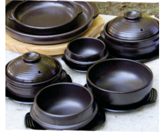
ਕੋਰੀਆ ਵਿਚ ਅੱਜ ਵੀ ਪੱਥਰ ਦੇ ਭਾਂਡੇ ਬਣਦੇ