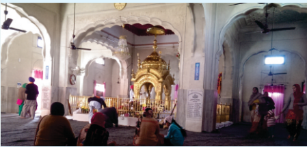
ਦਰਬਾਰ ਸਾਹਿਬ ਡੇਰਾ ਬ. ਨ. ਵਿਖੇ ਗੁਰੂ ਸਾਹਿਬ ਦੀ ਤੀਸਰੀ ਸਮਾਧ ਤੇ ਮਹਾਰਾਜਾ ਰਣਜੀਤ ਸਿੰਘ ਦੀ ਚੜ੍ਹਾਈ ਹੋਈ ਸੋਨੇ ਦੀ ਪਾਲਕੀ

ਲੱਭ ਕੇ ਦੱਬੀ ਹੋਈ ਗੜ੍ਹਵੀਂ ਪੁੱਟ ਕੇ ਬਾਬਾ ਸ੍ਰੀ ਚੰਦ ਜੀ, ਪੱਖੋਂ ਲੈ ਆਏ। ਪਰ ਪ੍ਰੰਪਰਾ ਅਨੁਸਾਰ ਫੁੱਲ (ਅਸਥੀਆਂ) ਨੂੰ ਰਹਾਇਸ਼ ਵਾਲੇ ਕਮਰਿਆਂ ਵਿੱਚ ਰੱਖਣਾ ਵੀ ਲੋਕੀ ਸੁਭ ਨਹੀਂ ਸਨ ਮੰਨਦੇ ਇਸ ਕਰਕੇ ਸਵਾਲ ਉਠਿਆ ਕਿ ਬਿਭੂਤੀ ਵਾਲੀ ਗੜ੍ਹਵੀਂ ਕਿਥੇ ਰੱਖੀ ਜਾਏ। ਧੈਰ ਕੁਝ ਸਮਾਂ ਗੜ੍ਹਵੀਂ ਕਿਸੇ ਧਾਰਮਿਕ ਅਸਥਾਨ ਤੇ ਸੰਭਾਲੀ ਗਈ।