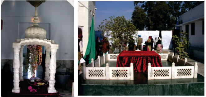
ਕਰਤਾਰਪੁਰ ਵਿਖੇ ਬਾਬੇ ਦੀ ਹਿੰਦੂਆਂ ਸਮਾਧ (ਮੜੀ) ਬਣਾਈ ਅਤੇ ਮੁਸਲਮਾਨਾਂ ਨੇ ਕਬਰ। ਗੁਰੂ ਸਾਹਿਬ ਦੇ ਜੋਤੀ ਜੋਤ ਉਪਰੰਤ ਸਮਾਧ ਨੂੰ ਮੁੱਖ ਇਮਾਰਤ ਦੇ ਅੰਦਰ ਲਿਆ ਗਇਆ ਸੀ ਅਤੇ ਕਬਰ ਬਾਹਰ ਬਿਨਾਂ ਛੱਤ ਦੇ ਹੀ ਚਲੀ ਆਉਂਦੀ ਰਹੀ ਹੈ। 1947 ਤਕ ਕਬਰ ਤੇ ਮੁਸਲਮਾਨ ਮਜ਼ੋਰ ਬੈਠਦਾ ਹੁੰਦਾ ਸੀ। ਕਰਤਾਰਪੁਰ ਦੇ ਲਾਗੇ ਹੀ ਸਯਦ ਮੱਦੀ ਸ਼ਾਹ ਦਾ ਮਕਬਰਾ ਹੈ। ਓਥੋਂ ਦਾ ਪੀਰ ਦਿਨ ਦਿਹਾੜੇ ਤੇ ਆ ਕੇ ਕਬਰ ਤੇ ਬਹਿੰਦਾ ਹੁੰਦਾ ਸੀ ਅਤੇ ਸ਼ਰਧਾਲੂ ਨੂੰ ਪ੍ਰਸ਼ਾਦਿ ਦਿਆ ਕਰਦਾ ਸੀ।

ਕੁਝ ਚਿਰ ਬਾਦ ਜਦੋਂ ਧਮਾਕੇ ਵਾਲੀ ਅਵਾਜ਼ ਬੰਦ ਹੋਈ, ਰੋਸ਼ਨੀ