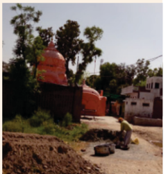
ਚੰਦੂ ਨੰਗਲ ਟਾਹਲੀ ਸਾਹਿਬ