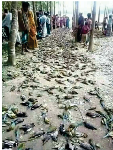
ਹਜ਼ਾਰਾਂ ਸ਼ਾਹਰੁਕਾਂ (ਗੱਟਾਰਾਂ) ਅਤੇ ਹੋਰ ਪੰਛੀਆਂ ਦਾ ਇਕੱਠਿਆਂ ਇਕ ਪਲ ਵਿਚ ਜਮੀਨ ਤੇ ਆ ਡਿੱਗਣਾ।

● ਤੇ ਹੋਰ ਲਓ! ਪੀਰੂ (ਦੱਖਣੀ ਅਮਰੀਕਾ) ਦੇ ਇੱਕਾ ਸਭਿਅਤਾ ਦੇ ਕਾਰਨਾਮਿਆਂ ਦਾ ਤਾਂ ਕਹਿਣਾ ਹੀ। 60,000 ਟਨ ਤੱਕ ਭਾਰੇ ਪੱਥਰ ਨੂੰ ਦੂਰ ਸਮੁੰਦਰ ਕਿਨਾਰੇ ਤੱਕ ਲੈ ਜਾਂਦੇ ਨੇ। ਬੋਲੀਵੀਆ ਦੇ ਇੱਕੇ ਪੱਥਰ ਨੂੰ ਇਸ ਤਰਾਂ ਵਰਤਦੇ ਸਨ ਜਿਵੇਂ ਰੁੱ ਨੂੰ। ਸੈਕੜੇ ਟੰਨ ਭਾਰੇ ਪੱਥਰ ਨੂੰ ਜਿੱਥੇ ਮਰਜੀ ਚੁੱਕੀ ਫਿਰਦੇ ਸਨ। ਫਿਰ ਇਨਾਂ ਦੀ ਕਟਾਈ ਵੀ ਇਸ ਤਰਾਂ ਕੀਤੀ ਹੋਈ ਹੈ ਜਿਵੇਂ ਮੱਖਣ ਥਾਂਣੀ ਵਾਲ ਕੱਚੀਦਾ। ਕਿ ਉਹ