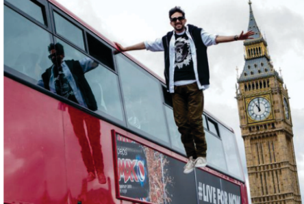
ਲੰਡਨ- ਹਜ਼ਾਰਾਂ ਲੱਖਾਂ ਲੋਕਾਂ ਦੇ ਸਾਹਮਣੇ ਜਦੋਂ ਜਾਦੂਗਰ ਡਾਇਨੋਸੌਰ ਹਵਾ ਵਿਚ ਉੱਪਰ ਉੱਠ ਗਇਆ।