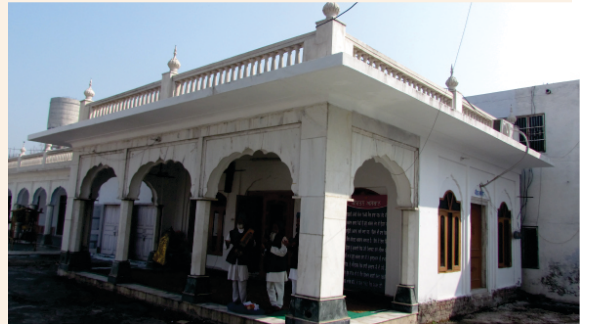
ਮੁੱਢ ਸਗਗਸ -ਕੀਰਤਨ ਅਸਥਾਨ ਗੁਰੂ ਅਰਜਨ ਦੇਵ ਜੀ।