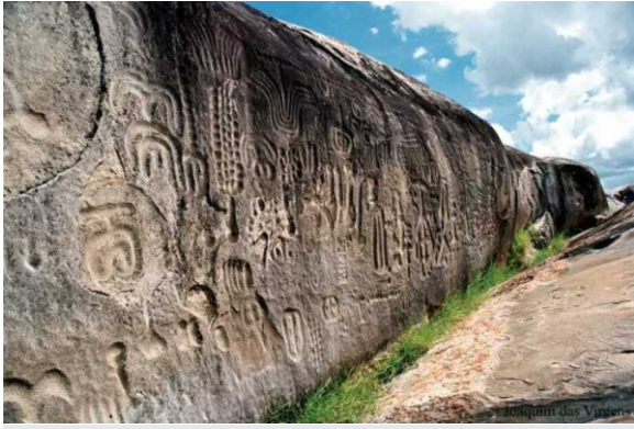
ਦੇਸ ਬਰਾਜੀਲ। ਇੰਗਾ ਦਰਿਆ ਦਾ ਕੰਢਾ। ਅਗਲਿਆਂ ਪਹਿਲਾਂ 46 ਮੀਟਰ ਲੰਮੇ ਅਤੇ 4 ਮੀਟਰ ਪਹਾੜ ਨੂੰ ਇਉਂ ਵੱਢ ਕੇ ਸਿੱਧਾ ਕੀਤਾ ਜਿਵੇਂ ਮੱਖਣ ਦੇ ਟੁਕੜੇ ਕਰ ਦਈਦੇ ਨੇ। ਫਿਰ ਉਸ ਤੇ ਕੁਝ ਤਰਾਸ਼ਿਆ ਜਿੰਨੂੰ ਅਜ ਤਕ ਵਿਦਵਾਨ ਸਮਝਣ ਦੀ ਕੋਸ਼ਿਸ਼ ਕਰ ਰਹੇ

ਮੁੱਕਦੀ ਗਲ ਕਿ ਕੀ ਵਜਾ ਸੀ ਬਾਬਾ ਨਾਨਕ ਹਰ ਵਾਰੀ ਹਰ ਥਾਂ ਪੁੱਜ ਕੇ ਸੱਪਾਂ ਦੀ ਰੂੰਡ ਵਿਚ ਜਾ ਹੱਥ ਪਾਉਂਦਾ ਸੀ? ਉਹ ਕਿਹੜੀ ਤਾਕਤ ਸੀ ਜੋ ਉਨੂੰ ਬਚਾਉਂਦੀ ਸੀ? ਫਕੀਰਾਂ ਵਿਚ, ਕਦੀ ਵਜੀਰਾਂ ਵਿਚ। ਕਦੀ ਬਾਦਸ਼ਾਹ ਦੇ ਮੂੰਹ ਤੇ ਕਹਿ ਦਿੰਦਾ ਕਿ ਤੂੰ ਜੁਲਮ ਕਰ ਰਿਹਾ ਵਾਂ। ਕਦੀ ਠੱਗਾਂ ਦੇ ਘੇਰੇ ਵਿਚ, ਕਦੀ ਨਾਂਗੇ ਸਾਧਾਂ ਵਿਚ, ਕਦੀ ਜੋਗੀਆਂ ਵਿਚ, ਕਦੀ ਬਨਾਰਸ, ਕਦੀ ਹਰਦੁਆਰ, ਕਦੀ ਕੁਲਸ਼ੇਤਰ, ਕਦੀ ਜਗਨਾਥਪੁਰੀ, ਕਦੀ ਮੱਕੇ ਕਦੀ ਮਦੀਨੇ, ਉਹ ਬਰਫੀਲੇ ਪਰਬਤਾਂ ਦੀ ਪ੍ਰਵਾਹ ਨਹੀਂ ਕਰਦਾ ਤੇ ਨਾਂ ਹੀ ਮਾਰੂ ਥਲਾਂ ਦੀ। ਉਹ ਸਮੁੰਦਰੋਂ ਟੱਪ ਜਾਂਦਾ। ਨਦੀਆਂ ਉਨੂੰ ਰਾਹ ਦਿੰਦੀਆਂ। ਖਤਰਨਾਕ ਜਾਨਵਰਾਂ ਨਾਲ ਭਰੇ ਜੰਗਲ ਉਹਦਾ ਰਸਤਾ ਨਾਂ ਰੋਕਦੇ।