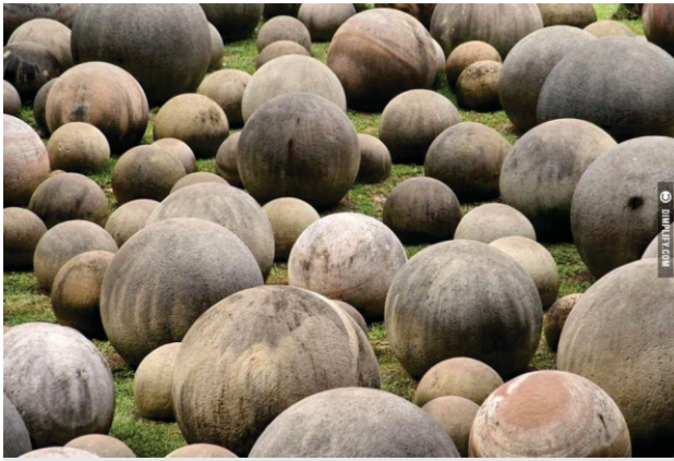
ਕੋਸਟਾ ਰੀਕਾ ਦੇ ਉਹ ਕੋਣ ਲੋਕ ਸਨ ਜੋ ਦੋ ਦੋ ਮੀਟਰ ਵਿਆਸ ਅਤੇ 15-15 ਟਨ ਭਾਰੇ ਪੱਥਰਾਂ ਦੇ ਗੋਲੇ ਬਣਾਇਆ ਕਰਦੇ ਸਨ। ਉਹਨਾਂ ਕੋਲ ਕਿਹੜੀ ਸਾਇੰਸ ਸੀ ਜਿਸ ਨਾਲ ਉਹ ਪੱਥਰ ਨੂੰ ਇਉਂ ਚੁੱਕੀ ਫਿਰਦੇ ਸਨ ਜਿਵੇਂ ਰੂੰ? ਉਹ ਸਭਿਅਤਾ ਕਿਥੇ ਗਈ?

ਇਨਸਾਨ ਦੀ ਸਭ ਤੋਂ ਵੱਡੀ ਦਿੱਕਤ ਹੈ ਕਿ ਉਹ ਸਮਝਦਾ ਹੈ ਕਿ ਜਿੰਨੀ ਕੁ ਉਸ ਦੀ ਸਮਰੱਥਾ ਹੈ ਬਾਕੀ ਬੰਦਿਆਂ ਦੀ ਵੀ ਓਨੀ ਹੀ ਹੈ। ਉਹਨੂੰ ਨਹੀਂ ਪਤਾ ਕਿ ਕਈ ਇਹੋ ਜਿਹੇ ਬੰਦੇ ਵੀ ਹੈਗੇ ਨੇ ਜਿਹੜੇ 400 ਵੋਲਟ ਬਿਜਲੀ ਦਾ ਕਰੰਟ ਵੀ ਬਰਦਾਸ਼ਤ ਕਰ ਲੈਂਦੇ ਨੇ। ਫਿਰ ਕੁਝ ਅਜਿਹੇ ਵੀ ਨੇ ਜਿਹੜੇ ਅੱਧਾ ਅੱਧਾ ਘੰਟਾ ਬਰਫ ਵਿਚ ਰਹਿ ਕੇ ਵੀ ਨੇ ਬਰ ਨੇ ਰਹਿੰਦੇ ਨੇ।