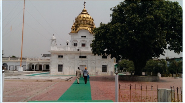
(ਸੱਜੇ) 1973 ਈ 'ਚ ਬਣਾਈ ਇਮਾਰਤ ਜਿਸ ਨੂੰ ਹੁਣੇ ਹੁਣੇ (2019) ਵਿਚ ਢਾਹ ਦਿਤਾ ਗਿਆ ਹੈ।