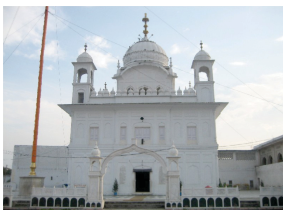
ਤਪਿਆਣਾ ਸਾਹਿਬ- ਖਡੂਰ ਵਿਖੇ ਜਿਥੇ ਗੁਰੂ ਸਾਹਿਬ ਆ ਡੇਰਾ ਲਾਇਆ ਸੀ।

ਬਿਲਾਵਲੁ ਮਹਲਾ ੧ ॥ ਮਨ ਕਾ ਕਹਿਆ ਮਨਸਾ ਕਰੈ ॥ ਇਹੁ ਮਨੁ ਪੁੰਨੁ ਪਾਪੁ