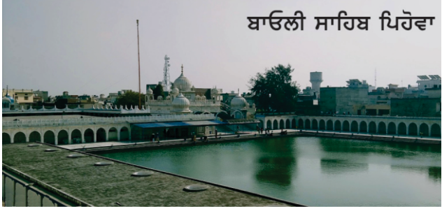
ਬਾਓਲੀ ਸਾਹਿਬ ਪਿਰੋਵਾ

ਜਿਥੋਂ ਤਕ ਕੁਰਖੇਤਰ ਜਾਣ ਦਾ ਸਬੰਧ ਹੈ, ਅਸੀਂ ਸਮਝਦੇ ਹਾਂ ਗੁਰੂ ਸਾਹਿਬ ਸੂਰਜ ਗ੍ਰਿਹਣ ਮੌਕੇ ਇਥੇ ਦੋ ਵਾਰੀ ਗਏ ਸਨ. ਪਹਿਲਾਂ 1507 ਵਿਚ ਤੇ ਦੁਬਾਰਾ 1518 ਈ ਨੂੰ।