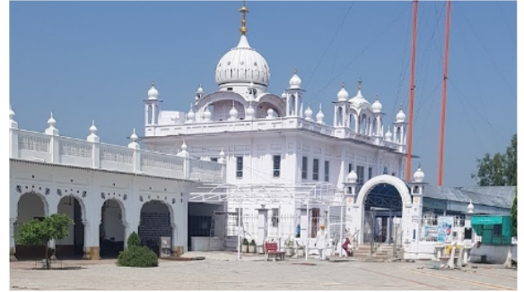
ਗੁਰਦੁਆਰਾ ਭੇਰਾ ਸਾਹਿਬ ਪੱਠੇਵਿੰਡ

ਪਿੰਡ ਪੱਠੇਵਿੰਡ ਜੋ ਅੱਜ ਕਲ ਪੂਰੀ ਤਰਾਂ ਬੇਚਰਾਗ ਹੋ ਚੁੱਕਾ ਹੈ, ਕਿਸੇ ਵੇਲੇ ਬੇਦੀਆਂ ਦਾ ਗੜ੍ਹ ਸੀ। ਇਸ ਸਥਾਨ ਬਾਰੇ ਗੁਰੂ ਹਰਗੋਬਿੰਦ ਸਾਹਿਬ ਨੇ ਸੰਗਤਾਂ ਨੂੰ ਜਾਣੂ ਕਰਵਾਇਆ ਸੀ। ਗੁਰੂ ਸਾਹਿਬ ਦੇ ਵਡੇਰੇ ਵੀ ਇਸੇ ਪਿੰਡ ਦੇ ਸਨ। ਨਾਲ ਹੀ ਭੋਇ ਰਾਜਪੂਤਾਂ ਦਾ ਪਿੰਡ ਜ਼ਾਮਾਰਾਇ ਹੈ। ਭੋਇ ਜ਼ਾਮਾ ਰਾਇ ਦੀ ਓਲਾਦ ਵਿੱਚੋਂ ਹੀ ਰਾਇ ਬੁਲਾਰ ਹੋਇਆ ਹੈ। ਇਹ ਵੀ ਕਿਹਾ ਜਾਂਦਾ ਹੈ ਕਿ ਰਾਇ ਬੁਲਾਰ ਰਾਇ ਜ਼ਾਮਾ ਦਾ ਹੀ ਪੁੱਤਰ ਸੀ। ਕਿਹਾ ਜਾਂਦਾ ਹੈ ਕਿ ਭੋਇ ਜ਼ਾਮਾ ਰਾਇ ਨੂੰ ਤਲਵੰਡੀ ਦਾ ਇਲਾਕਾ ਜਗੀਰ ਵਜੋਂ ਮਿਲਿਆ ਸੀ। ਜ਼ਾਮਾ ਜਦੋਂ ਪ੍ਰਵਾਰ ਸਮੇਤ ਫਿਰ ਤਲਵੰਡੀ ਹਿਜਰਤ ਕਰ ਗਇਆ ਤਾਂ ਨਾਲ ਪਟਵਾਰੀ ਮਹਿਤਾ ਕਾਲੂ ਨੂੰ ਵੀ ਲੈ ਗਿਆ।