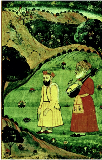
ਜਦੋਂ ਪਹਿਲੀ ਉਦਾਸੀ ਮੌਕੇ ਸੁਲਤਾਨਪੁਰ ਤੋਂ ਨਿਕਲੇ (ਬੀ:40 ਤਸਵੀਰ)

ਰੇ ਮਨ ਡੀਗਿ ਨ ਡੋਲੀਐ ਸੀਥੈ ਮਾਰਗਿ ਯਾਉ ॥ ਪਾਛੈ ਬਾਘੁ ਡਰਾਵਣੈ ਆਗੈ ਅਗਨਿ ਤਲਾਉ ॥ ਸਹਸੈ ਜੀਅਰਾ ਪਰਿ ਰਹਿਓ ਮਾ ਕਉ ਅਵਰੁ ਨ ਢੰਗੁ ॥ ਨਾਨਕ ਗੁਰਮੁਖਿ ਛੁਟੀਐ ਹਰਿ ਪ੍ਰੀਤਮ ਸਿਉ ਸੰਗੁ ॥੧॥ ਬਾਘੁ ਮਰੈ ਮਨੁ ਮਾਰੀਐ ਜਿਸੁ ਸਤਿਗੁਰ ਦੀਖਿਆ ਹੋਇ ॥ ਆਪੁ ਪਛਾਣੈ ਹਰਿ ਮਿਲੈ ਬਹੁਤਿ ਨ ਮਰਣਾ ਹੋਇ ॥ ਕੀਚਤਿ ਹਾਥੁ ਨ ਬੂਝਈ ਏਕਾ ਨਦਰਿ ਨਿਹਾਲਿ ॥ ਨਾਨਕ ਗੁਰਮੁਖਿ ਉਬਰੇ ਗੁਰੁ ਸਰਵਰੁ ਸਚੀ ਪਾਲਿ ॥੨॥ ਅਗਨਿ ਮਰੈ ਜਲੁ ਲੋਤਿ ਲਹੁ ਵਿਣੁ ਗੁਰੁ ਨਿਧਿ ਜਲੁ ਨਾਹਿ ॥