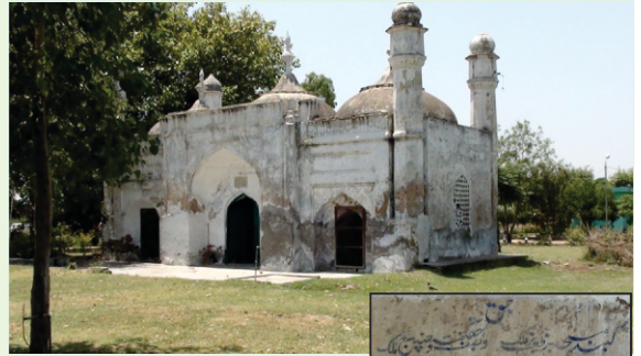
ਨਵਾਬ ਦੇ ਦਰਬਾਰ ਦੇ ਲਾਗੇ ਹੀ 550 ਸਾਲ ਪੁਰਾਣੀ ਮਸੀਤ ਹੈ। ਇਸ ਵਿਚ ਲੱਗੇ ਸਿਲਲੇਖ 'ਤੇ ਫਾਰਸੀ ਦੀ ਸ਼ਾਇਰੀ ਵਿਚ ਮਸੀਤ ਦੀ ਤਾਰੀਫ ਹੈ। ਪਰ ਯਾਦ ਰਹੇ ਗੁਰੂ ਸਾਹਿਬ ਦੀ ਜਿਹੜੀ ਨਮਾਜ ਵਾਲੀ ਸਾਖੀ ਹੈ ਉਹ ਇਸ ਮਸੀਤ ਦੀ ਨਹੀਂ। ਉਹ ਈਦਗਾਹ ਕਿਲੇ ਤੋਂ ਬਾਹਰ ਸੀ।