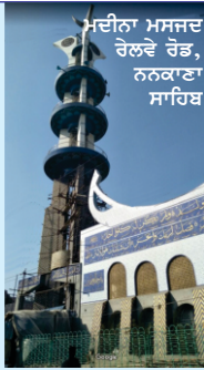
ਮਦੀਨਾ ਮਸਜਦ ਰੇਲਵੇ ਰੋਡ, ਨਨਕਾਣਾ ਸਾਹਿਬ