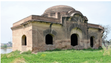
ਅੰਮਨਾਬਾਦ ਦੇ ਚੜ੍ਹਦੇ ਪਾਸੇ ਅੱਜ ਵੀ ਲੱਭੀ ਪਠਾਣਾਂ ਦੀ ਬਣਾਈ ਹੋਈ ਮਸੀਤ ਖੜੀ ਹੈ। ਹੋ ਸਕਦੇ ਉਸੇ ਪਠਾਣ ਨੇ ਬਣਾਈ ਹੋਵੇ ਜਿਹਦਾ ਮੁੰਡਾ ਬੀਮਾਰ ਸੀ।