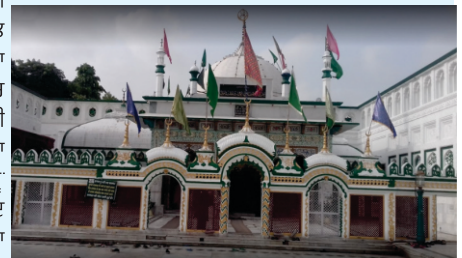
ਬੋ ਅਲੀ ਦਾ ਮਕਬਰਾ - ਪਾਣੀਪਤ

ਕਰਨਾਲ ਤੋਂ ਗੁਰੂ ਸਾਹਿਬ ਫਿਰ ਪਾਣੀਪਤ ਆਏ ਤੇ ਸੰਭਾਵਨਾ ਹੈ ਕਿ ਉਹ ਬੋ ਅਲੀ ਦੀ ਦਰਗਾਹ ਤੇ ਵੀ ਪਧਾਰੇ। ਪਾਣੀਪਤ ਦਾ ਗੁਰਦੁਆਰਾ ਮੌਜੂਦਾ ਦੌਰ ਵਿੱਚ ਹੀ ਕਿਸੇ ਨੇ ਜੀ ਟੀ ਰੋਡ ਤੇ ਬਣਾਇਆ ਹੈ ਅਤੇ ਗੁਰੂ ਸਾਹਿਬ ਦੀ ਆਮਦ ਨਾਲ ਜੋੜ ਦਿੱਤਾ ਹੈ।