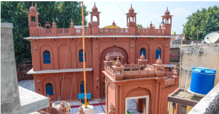
ਕਾਰਸੇਵਾ ਵਾਲਿਆਂ ਬਣਾ ਦਿਤਾ ਬੇਬੇ ਜੀ ਦਾ ਨਵਾ ਘਰ

ਬੈਰ ਬਾਬਾ ਜੀ ਨੂੰ ਯਾਦ ਆ ਗਇਆ ਕਿ ਇਕ ਵੇਰਾਂ ਜਦੋਂ ਉਹ ਮੋਦੀਖਾਨਾ ਸਾਂਭਦੇ ਸਨ ਤਾਂ ਇਕ ਫੇਰੂ ਉਰਫ ਫਿਰੰਦਾ ਨਾਂ ਦਾ ਬੰਦਾ ਆ ਕੇ ਮਿਲਿਆ ਸੀ। ਉਹਦੇ ਕੋਲ ਰਬਾਬ ਸੀ ਜੋ ਕੁਦਰਤੀ