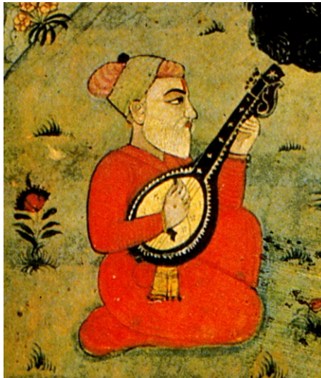
ਭਾਈ ਮਰਦਾਨਾ (ਬੀ:40 ਤਸਵੀਰ)

ਮਰਦਾਨੇ ਨੇ ਜਾ ਕੇ ਬਾਬੇ ਨੂੰ ਬੇਬੇ ਜੀ ਦਾ ਸੁਨੇਹਾ ਦਿੱਤਾ। ਬਾਬਾ ਕਹਿਣ ਲੱਗਾ "ਚੰਗਾ ਮਰਦਾਨਿਆ ਆ ਚਲੀਏ ਬੇਬੇ ਨੂੰ ਮਿਲਣ। ਇਹ ਮੇਰੇ ਨਾਲ ਬਹੁਤ ਮੋਹ ਕਰਦੀ ਹੈ।"