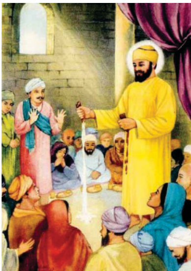
“ਸੰਤਨ ਕਾ ਦਾਨਾ ਰੁਖਾ ਸੋ ਸਰਬ ਨਿਧਾਨ॥ ਗ੍ਰਿਹਿ ਸਾਕਤ ਛਤੀਹ ਪੁਕਾਰ ਤੇ ਬਿਖੁ ਸਮਾਨ॥” ਭਾਈ ਲਾਲੇ ਦੇ ਕੋਧਰੇ ਦੀ ਰੋਟੀ ਵਿੱਚੋਂ ਦੁੱਧ ਅਤੇ ਮਲਿਕ ਭਾਗੋ ਦੇ ਪੂੜਿਆਂ ਵਿੱਚੋਂ ਲਹੂ ਸਿੱਮਦਾ ਹੋਇਆ।

ਪਹੁੰਚ ਕੇ ਗੁਰੂ ਸਾਹਿਬ ਨੇ ਮਲਿਕ ਭਾਗੋ ਨੂੰ ਨਮਸਕਾਰ ਕੀਤੀ। ਮਲਿਕ ਗੁੱਸੇ ਨਾਲ ਭਰਿਆ ਪੀਤਾ ਸੀ। ਕਹਿਣ ਲੱਗਾ ਤੁਹਾਨੂੰ ਸੁਨੇਹਾ ਭੇਜਿਆ ਸੀ ਤੁਸੀਂ ਭੋਜਨ ਤੇ ਆਏ ਨਹੀਂ ਇਹ ਪੁਰਾਣੀ ਆਕੜ ਤੁਸਾਂ ਅਜੇ ਵੀ ਨਹੀਂ ਛੱਡੀ। ਮੈਨੂੰ ਪਤਾ ਲਗਾ ਕਿ ਤੁਸੀਂ