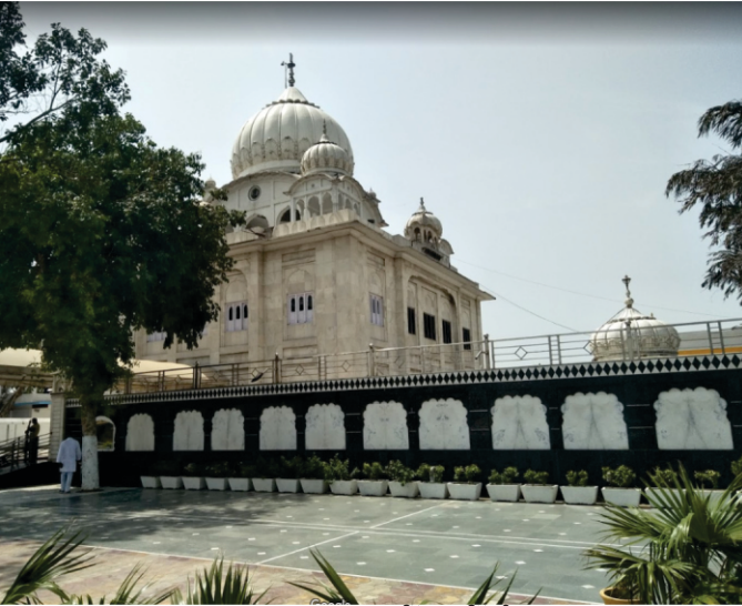
ਗੁਰਦੁਆਰਾ ਮਸਨੂ ਕਾ ਟਿੱਲਾ, ਦਿੱਲੀ

ਨਾਂ ਤਾਂ ਇਤਹਾਸ ਸਾਂਭ ਨਹੀਂ ਸਕਿਆ ਪਰ ਉਸ ਦਾ ਖੂਹ ਉਸ ਅਨਾਮ ਬਾਗ ਮਾਲਕ ਨੂੰ ਅਮਰ ਕਰ ਗਿਆ। ਜੀਟੀ ਕਰਨਾਲ ਰੋਡ ਤੇ ਉਸ ਖੂਹ ਤੇ ਹੀ ਗੁਰਦੁਆਰਾ ਨਾਨਕ ਪਿਆਉ ਮੌਜੂਦ ਹੈ।