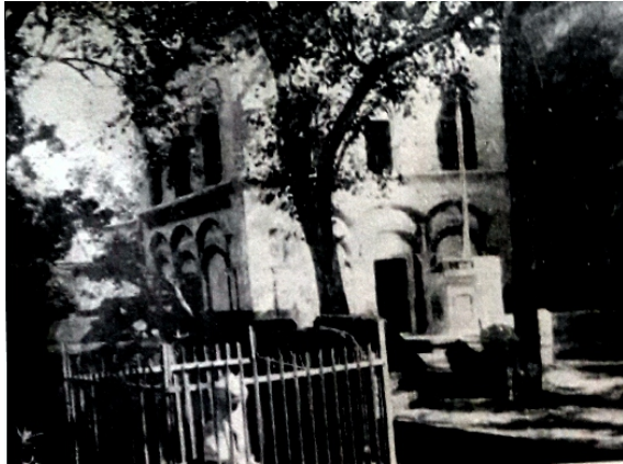
ਗੁਰਦੁਆਰਾ ਗੁਰੂ ਕਾ ਬਾਗ- ਪੁਰਾਣੀ ਇਮਾਰਤ। ਇਥੇ ਇਕ ਕਮਰਾ ਗੁਰੂ ਸਾਹਿਬ ਦੇ ਵੇਲਿਆਂ ਦਾ ਵੀ ਹੁੰਦਾ ਸੀ। - (ਸੁਲਤਾਨਪੁਰ ਸਰਵੇ 1969)

ਬਾਬਾ ਜੀ ਨੂੰ ਘਰ ਜਾਣ ਵਾਸਤੇ ਮਜਬੂਰ ਕੀਤਾ ਗਿਆ। ਪਰ ਬਾਬੇ ਨੇ ਨਾਂਹ ਕਰ ਦਿੱਤੀ। ਬਾਬਾ ਜੀ ਦਾ ਸਹੁਰਾ ਬਹੁਤ ਤਾਹਨੇ ਮਿਹਣੇ ਮਾਰ ਰਿਹਾ ਸੀ, "ਕਿ ਜੇ ਤੂੰ ਸਾਧ ਬਣਨਾ ਸੀ ਤਾਂ ਮੇਰੀ ਕੁੜੀ ਦੀ ਜ਼ਿੰਦਗੀ ਕਿਓਂ ਖਰਾਬ ਕੀਤੀ?" ਆਦਿ ਆਦਿ। ਬਾਬਾ