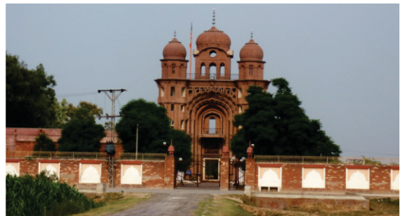
ਗੁਰਦੁਆਰਾ ਰੋੜੀ ਸਾਹਿਬ ਏਮਨਾਬਾਦ ਦਾ ਸ਼ਾਨਦਾਰ ਦਰਵਾਜ਼ਾ