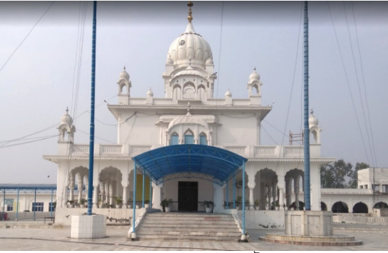
ਗੁਰਦੁਆਰਾ ਰਬਾਬਸਰ ਭਰੋਆਣਾ