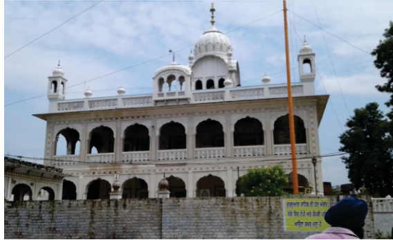
ਅੱਜ ਗੁਰਦੁਆਰਾ ਬਣ ਚੁੱਕਾ ਹੈ -ਬੀਬੀ ਭਿਰਾਈ ਦਾ ਘਰ

ਤਿਲੰਗ ਮਃ ੧ ॥ ਇਆਨੜੀਏ ਮਾਨੜਾ ਕਾਇ ਕਰੇਹਿ ॥ ਆਪਨੜੈ ਘਰਿ ਹਰਿ ਰੰਗੇ ਕੀ ਨ ਮਾਣੇਹਿ ॥ ਸਹੁ ਨੋੜੈ ਧਨ ਕੰਮਲੀਏ ਬਾਹਰੁ ਕਿਆ ਢੂਢੇਹਿ ॥ ਭੈ ਕੀਆ ਦੋਹਿ ਸਲਾਈਆ ਨੈਣੀ ਭਾਵ ਕਾ ਕਰਿ ਸੀਗਾਰੇ ॥ ਤਾ ਸੋਹਗਣਿ ਜਾਣੀਐ ਲਾਗੀ ਜਾ ਸਹੁ ਧਰੇ ਪਿਆਰੇ ॥੧॥ ਇਆਣੀ ਬਾਲੀ ਕਿਆ ਕਰੇ ਜਾ ਧਨ ਕੰਤ ਨ ਭਾਵੈ ॥ ਕਰਣ ਪਲਾਹ ਕਰੇ ਬਹੁਤੇਰੇ ਸਾ ਧਨ ਮਹਲੁ ਨ ਪਾਵੈ ॥ ਵਿਣੁ ਕਰਮਾ ਕਿਛੁ ਪਾਈਐ ਨਾਹੀ ਜੇ ਬਹੁਤੇਰਾ ਧਾਵੈ ॥ ਲਬ ਲੋਭ ਅਰੰਕਾਰ ਕੀ ਮਾਤੀ ਮਾਇਆ ਮਾਹਿ ਸਮਾਣੀ ॥ ਇਨੀ ਬਾਤੀ ਸਹੁ ਪਾਈਐ ਨਾਹੀ ਭਈ ਕਾਮਣਿ ਇਆਣੀ ॥੨॥ ਜਾਇ ਪੁਛਹੁ