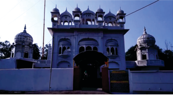
ਗੁਰਦੁਆਰਾ ਸਾਹਿਬ ਪਹਿਲੀ ਪਾਤਸ਼ਾਹੀ ਸਿੱਖ ਵੱਟੀ ਕੁਲਸ਼ੇਤਰ

ਮੱਚ ਜਾਂਦੀ ਸੀ। ਕਿ ਫਲਾਣੇ ਦਿਨ ਗ੍ਰਹਿਣ ਲੱਗਣ ਜਾ ਰਿਹਾ ਹੈ। ਇਹ ਘਟਨਾ ਇੰਨੀ ਮਹੱਤਵਪੂਰਨ ਮੰਨੀ ਜਾਂਦੀ ਸੀ ਕਿ ਬਾਬਰ ਨੇ ਵੀ ਆਪਣੀ ਜੀਵਨੀ ਵਿੱਚ ਗ੍ਰਹਿਣ ਲੱਗਣ ਦਾ ਜਿਕਰ ਕੀਤਾ ਹੈ। ਜਦੋਂ ਗੁਰੂ ਸਾਹਿਬ ਨੂੰ ਪਤਾ ਲਗਾ ਕਿ ਬੜਾ ਵੱਡਾ ਗ੍ਰਹਿਣ ਲੱਗਣ ਜਾ ਰਿਹਾ ਹੈ ਤੇ ਲੋਕੀ ਧੜਾ ਧੜ ਕੁਲਸ਼ੇਤਰ ਪਹੁੰਚ ਰਹੇ ਹਨ ਤਾਂ ਗੁਰੂ ਸਾਹਿਬ ਵੀ ਸੰਗ ਨਾਲ ਹੋ ਤੁਰੇ। ਉਤਸ਼ਾਹ ਤੇ ਡਰ ਅਥਾਹ ਸੀ ਕਿਉਂਕਿ ਮਸਲਾ ਸੂਰਜ ਦੀ ਅਜਾਦੀ ਦਾ ਸੀ। “ਜੇ ਕਿਤੇ ਸੂਰਜ ਅਜਾਦ ਨਾਂ ਹੋ ਪਾਇਆ ਤਾਂ ਦੁਨੀਆ ਖਤਮ ਹੋ ਜਾਵੇਗੀ। ਸੋ ਹੁੰਮ ਹੁੰਮਾ ਕੇ ਪਹੁੰਚੋ।”