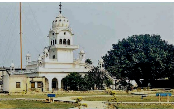
ਗੁਰਦੁਆਰਾ ਨਾਨਕ ਪੜਾਓ ਫਤਿਹਾਬਾਦ

ਇਲਾਕੇ ਦਾ ਮਹੌਲ ਇਥੇ ਵੀ ਮਰਦਾਨੇ ਲਈ ਡਰਾਉਣਾ ਸੀ। ਉੱਚੇ ਉੱਚੇ ਟਿੱਲੇ, ਸੰਛਣਾ ਜੰਗਲ ਬੋਲਾ। ਗੁਰੂ ਸਾਹਿਬ ਸ਼ਹਿਰ ਦੇ ਬਾਹਰਵਾਰ ਹੀ ਕਿਸੇ ਤਕੀਏ ਕਿਸੇ ਡੇਰੇ ਤੇ ਜਾ ਬਿਰਾਜੇ। ਮਰਦਾਨੇ ਨੇ ਜਾ ਸ਼ਹਿਰ ਵਿੱਚ ਖਬਰ ਦਿੱਤੀ ਕਿ ਨਵਾਬ ਦਾ ਮੋਦੀ ਸ਼ਹਿਰ ਵਿੱਚ ਆ ਗਇਆ ਹੈ। ਲੋਕਾਂ ਨੇ ਆਦਰ ਸਤਿਕਾਰ ਕੀਤਾ। ਬਦਕਿਸਮਤੀ ਨਾਲ ਇਤਹਾਸ ਇਸ ਬਾਰੇ ਚੁੱਪ ਹੈ ਕਿ ਇਥੋਂ ਦਾ ਕਿਹੜਾ ਮੁੱਖੀ ਸਿੱਖ ਹੋਇਆ ਹੈ। ਉਂਜ ਤੀਸਰੇ ਗੁਰੂ ਸਾਹਿਬ ਨੇ ਜਿਹੜੀਆਂ ਮੰਜੀਆਂ ਥਾਪੀਆਂ ਸਨ ਉਨਾਂ ਵਿੱਚੋਂ ਮਹਿਰਾ (ਝੀਵਰ) ਜਾਤ ਦਾ ਮਾਣਕ ਚੰਦ ਸੀ। ਸੋ ਹੋ ਸਕਦਾ ਹੈ ਕਿ ਉਹਦਾ ਪਿਤਾ ਹੀ ਨਾਨਕ ਪਾਤਸ਼ਾਹ ਦਾ ਮੁੱਖ ਸ਼ਰਧਾਲੂ ਹੋਵੇ।