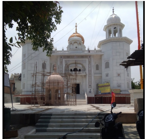
ਗੁਰਦੁਆਰਾ ਗੁਰੂ ਕਾ ਬਾਗ- ਨਵੀਂ ਇਮਾਰਤ