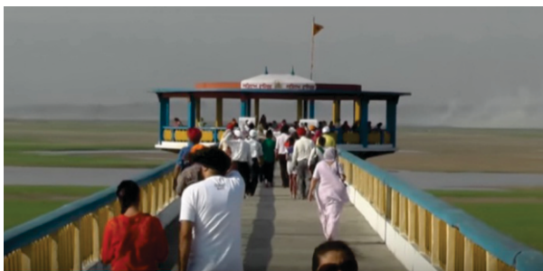
ਬਾਉਲੀ ਸਾਹਿਬ - ਗੁਰੂ ਸਾਹਿਬ ਨੇ ਲੋਕਾਈ ਦੀ ਪਿਆਸ ਬੁਝਾਈ

ਮੱਠ ਤੋਂ ਅਜੇ ਕੁਝ ਹਟਵੇਂ ਹੀ ਸਨ ਕਿ ਮਰਦਾਨਾ ਵਗਦੇ ਰਾਹ ਕੰਢੇ ਇੱਕ ਸੁੱਕੇ ਹੋਏ ਪਿੱਪਲ ਦੇ ਥੱਲੇ ਬਹਿ ਗਇਆ ਕਿ ਬਾਬਾ ਹੁਣ ਨਹੀਂ ਹੋਰ ਤੁਰਿਆ ਜਾਂਦਾ। ਬਾਬੇ ਨੇ ਓਥੇ ਹੀ ਰਾਹ ਵਿੱਚ ਕੀਰਤਨ ਸ਼ੁਰੂ ਕਰ ਦਿੱਤਾ। ਸਥਾਨਕ ਵਸਨੀਕਾਂ ਜਦੋਂ ਵੇਖਿਆ ਕਿ ਇਹ ਪਿੱਪਲ ਤਾਂ ਸਾਲਾਂ ਦਾ ਸੁੱਕ ਚੁੱਕਾ ਸੀ, ਇਹ ਕਿਵੇਂ ਹਰਿਆ ਹੋ ਉਠਿਐ? ਗੱਲ ਮੱਠ ਦੇ ਜੋਗੀਆਂ ਤੱਕ ਵੀ ਪਹੁੰਚ ਗਈ।