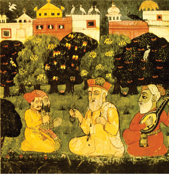
ਬੀ:40-133 ਵਿਚ ਸਾਖੀਕਾਰ ਨੇ ਚੌਅ ਦੀ ਥਾਂ ਸਮੁੰਦਰ ਲਿਖਿਐ

ਐਨ ਪਹਾੜਾਂ ਦੇ ਪੈਰਾਂ ਵਿਚ ਵਾਕਿਆ ਹੈ। ਦੁਆਲੇ ਦੋ ਚੌਅ ਜਾਂ ਪਹਾੜੀ ਬਰਸਾਤੀ ਦਰਿਆ ਹਨ। ਜਿਹੜੇ ਲੋਕ ਚੌਅਾਂ ਦੇ ਆਸ ਪਾਸ ਰਹਿੰਦੇ ਹਨ ਉਨਾਂ ਨੂੰ ਪਤਾ ਹੈ ਕਿ ਕਿਸੇ ਵੇਲੇ ਇਹ ਕਿੰਨੇ ਖਤਰਨਾਕ ਹੋ ਸਕਦੇ ਹਨ ਕਿਉਂਕਿ ਪਹਾੜਾਂ ਤੋਂ ਪਾਣੀ ਬੜੀ ਗਤੀ ਨਾਲ ਹੇਠਾਂ ਆਉਂਦਾ ਹੈ।