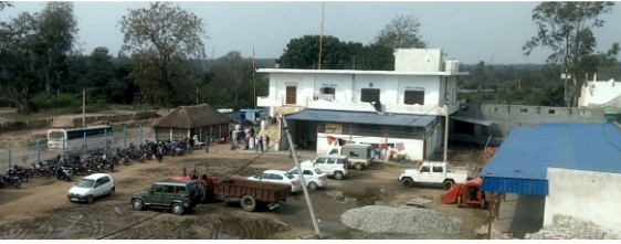
ਗੁਰਦੁਆਰਾ ਬਾਉਲੀ ਸਾਹਿਬ, ਗੋਂਦੀਖਾਤਾ

ਤੇ ਹੈ। ਅੱਜ ਓਥੇ ਗੁਰਦੁਆਰਾ ਬਾਉਲੀ ਸਾਹਿਬ ਅਤੇ ਨੇੜੇ ਇਕ ਜੋਗੀ ਸਿੱਧ ਮੰਦਰ ਵੀ ਹੈ।