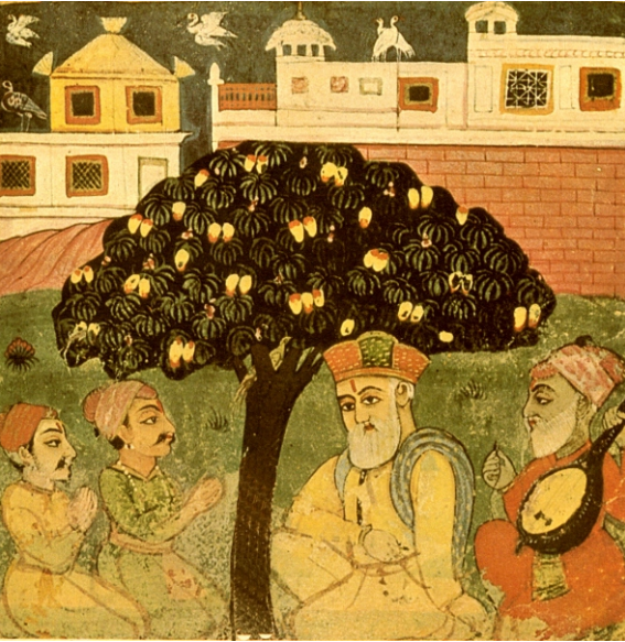
ਬੀ:40 ਤਸਵੀਰ। ਠੱਗ ਗੁਰੂ ਸਾਹਿਬ ਅੱਗੇ ਹੱਥ ਬੰਨੀ ਬੈਠੇ ਹਨ।

ਮਰੇਸੁ ਸਰੇਸਟ ਨਾਮਿ ਰਤੇ ਵੀਚਾਰੀ ॥ ਖਾਣੀ ਬਾਣੀ ਗਗਨ ਪਤਾਲੀ ਜੰਤਾ ਜੋਤਿ ਤੁਮਾਰੀ ॥ ਸਭਿ ਸੁਖ ਮੁਕਤਿ ਨਾਮ ਧੁਨਿ ਬਾਣੀ ਸਚੁ ਨਾਮੁ ਉਰ ਧਾਰੀ ॥ ਨਾਮ ਬਿਨਾ ਨਹੀ ਛੁਟਸਿ ਨਾਨਕ ਸਾਚੀ ਤਰੁ ਤੂ ਤਾਰੀ ॥੯੯॥