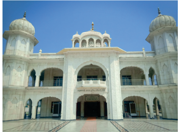
ਗੁਰਦੁਆਰਾ ਨਨਕਾਣਾ ਸਾਹਿਬ ਕਾਂਸ਼ੀਪੁਰ