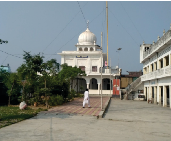
ਗੁਰਦੁਆਰਾ ਗੁਰੂ ਨਾਨਕ ਬਾਗ ਹਲਦੌਰ

ਯਾਦ ਰਹੇ ਚੰਪਾਵਤ ਨਗਰੀ ਅਲਮੋੜੇ ਤੋਂ ਨੱਕ ਦੀ ਸੇਧ 52 ਕਿ. ਮੀ. ਪੂਰਬ ਵਿਚ ਪਹਾੜਾਂ ਵਿਚ ਪੈਂਦੀ ਹੈ। —◆—