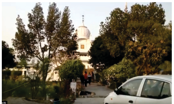
ਗੁਰਦੁਆਰਾ ਚੱਕੀ ਸਾਹਿਬ ਜਿੱਥੇ ਬਾਲਕ ਰੂਪ ਗੁਰੂ ਨਾਨਕ ਨੂੰ ਚੱਕੀ ਪੀਹਣ ਲਗਾਇਆ ਗਇਆ ਸੀ।

ਫਿਰ ਘਰ ਦੀ ਸਵਾਣੀ ਨੇ ਵੇਖਿਆ ਕਿ ਬਾਲਕ ਚੱਕੀ ਨੂੰ ਵਾਹਵਾ