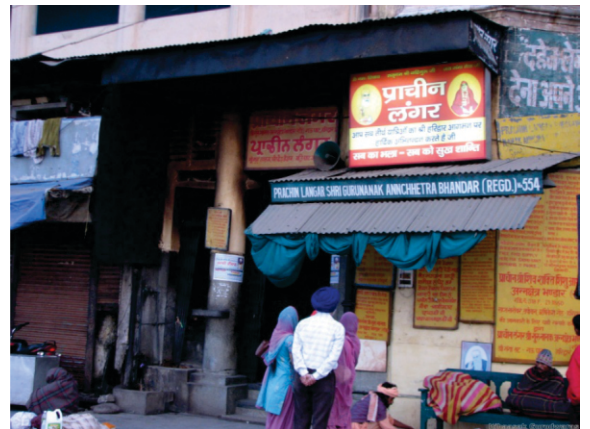
ਨਾਨਕ ਅਖਾੜਾ ਜਾਂ ਨਾਨਕਵਾੜਾ ਅੱਜ ਕਲ੍ਹ ਪ੍ਰਾਚੀਨ ਲੰਗਰ ਬਣ ਗਇਆ ਹੈ।

1. ਨਾਨਕ ਅਖਾੜਾ : ਗੁਰਦੁਆਰਾ ਪਹਿਲੀ ਪਾਤਸ਼ਾਹੀ। ਕੁਸਾਂ ਵਰਤ ਘਾਟ ਦੇ ਕੋਲ ਰੀਗਾ ਕੰਢੇ ਤੇ ਹੈ। ਬਸ ਅੱਡਾ ਲਾਗੇ