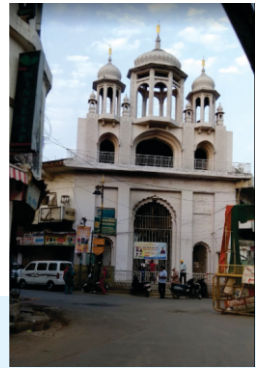
(ਹੇਠਾਂ) ਗੁਰਦੁਆਰਾ ਗੁਰੂ ਨਾਨਕ ਬਾਗ ਬਨਾਰਸ। (ਸੱਜੇ ਉੱਤੇ) ਗੁਰਦੁਆਰਾ ਸਾਹਿਬ ਦਾ ਦਰਵਾਜ਼ਾ

ਭੈਰਉ ਮਹਲਾ ੧ ॥ ਨੈਨੀ ਦ੍ਰਿਸਟਿ ਨਹੀ ਤਨੁ ਹੀਨਾ ਜਰਿ ਜੀਤਿਆ ਸਿਰਿ ਕਾਲੇ ॥ ਰੂਪੁ ਰੰਗੁ ਰਸੁ ਨਹੀ ਸਾਚਾ ਕਿਉ ਛੋਡੈ ਜਮ ਜਾਲੇ ॥੧॥ ਪ੍ਰਾਣੀ ਹਰਿ ਜਪਿ ਜਨਮੁ ਗਇਓ ॥ ਸਾਚ ਸਬਦ ਬਿਨੁ ਕਬਹੁ ਨ ਛੂਟਸਿ ਬਿਰਥਾ ਜਨਮੁ ਭਇਓ ॥੧॥ ਰਹਾਉ ॥ ਤਨ ਮਹਿ ਕਾਮੁ ਕ੍ਰੋਧੁ ਹਉ ਮਮਤਾ ਕਠਿਨ ਪੀਰ ਅਤਿ ਭਾਰੀ ॥ ਗੁਰਮੁਖਿ ਰਾਮ ਜਪਹੁ ਰਸੁ ਰਸਨਾ ਇਨ ਬਿਧਿ ਤਰੁ ਤੁ ਭਾਰੀ ॥੨॥ ਬਹਰੇ ਕਰਨ ਅਕਲਿ ਭਈ ਹੋਛੀ ਸਬਦ ਸਹਜੁ ਨਹੀ ਬੁਝਿਆ ॥ ਜਨਮੁ ਪਦਾਰਥੁ ਮਨਮੁਖਿ ਹਾਰਿਆ ਬਿਨੁ ਗੁਰ ਅੰਧੁ ਨ ਸੁਝਿਆ ॥੩॥ ਰਹੈ ਉਦਾਸੁ ਆਸ ਨਿਰਾਸਾ ਸਹਜ ਧਿਆਨਿ ਬੈਰਾਗੀ ॥ ਪ੍ਰਣਵਤਿ ਨਾਨਕ ਗੁਰਮੁਖਿ ਛੂਟਸਿ ਰਾਮ ਨਾਮਿ ਲਿਵ ਲਾਗੀ ॥੪॥੨॥੩॥