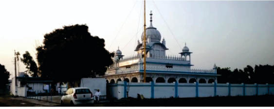
ਜਿੱਥੇ ਬਾਗ ਹਰਿਆ ਕੀਤਾ ਓਥੇ ਅੱਜ ਮੌਜੂਦ ਹੈ ਗੁਰਦੁਆਰਾ ਗੁਰੂ ਕਾ ਬਾਗ।

ਰੁਹੇਲਾ ਪਠਾਣ ਸੀ। ਪਠਾਣ ਨਵੇਂ ਨਵੇਂ ਆ ਕੇ ਇਥੇ ਵਸੇ ਸਨ। ਪਰ ਇਨ੍ਹਾਂ ਵਿੱਚੋਂ ਕੁਝ ਇਕ ਨੇ ਨਵਾਂ ਹੀ ਕਸਬ ਅਖਤਿਆਰ ਕੀਤਾ ਹੋਇਆ ਸੀ। ਜਿਵੇਂ ਅਰਬ ਤੇ ਉਤਰੀ ਅਫਰੀਕਾ ਵਿੱਚ ਹੁੰਦਾ ਸੀ ਕਿ ਲੋਕ ਗੁਲਾਮਾਂ ਦਾ ਵਪਾਰ ਕਰਦੇ ਸਨ। ਇਥੋਂ ਦੇ ਰੁਹੇਲੇ ਪਠਾਣ ਗਰੀਬ ਗੁਰਬੇ ਲੋਕਾਂ ਦੇ ਬੱਚੇ ਚੁੱਕ ਲੈ ਜਾਂਦੇ ਤੇ ਓਨਾਂ ਨੂੰ ਅੱਗੇ ਵੇਚ ਦਿੰਦੇ ਸਨ। ਇਲਾਕੇ ਦੇ ਲੋਕ ਇਨ੍ਹਾਂ ਤੋਂ ਡਾਢੇ ਪ੍ਰੇਸ਼ਾਨ ਸਨ।