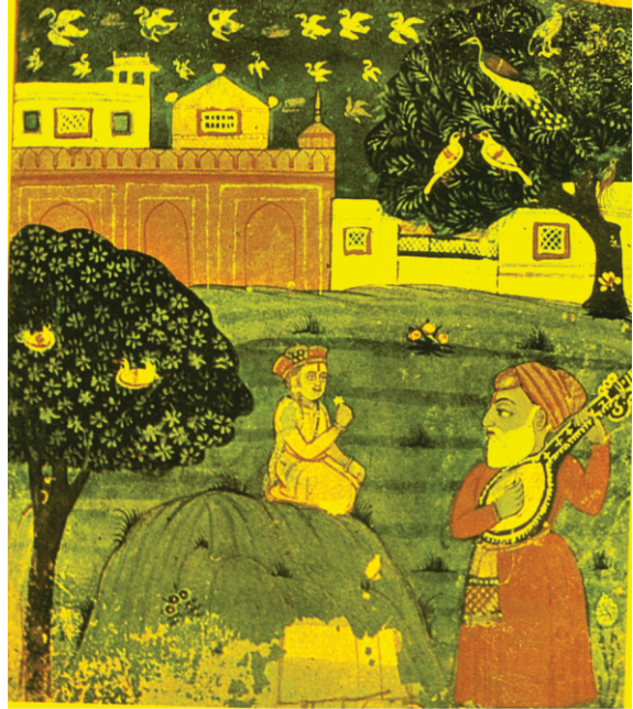
ਬਾਲਕ ਬਣਿਆ ਬਾਬਾ (ਬੀ-40 ਤਸਵੀਰ)

ਉਦਾਸੀ ਸੰਤਾਂ ਨੇ ਗੁਰਦੁਆਰਾ ਵੀ ਬਣਾਇਆ ਹੋਇਆ ਹੈ।