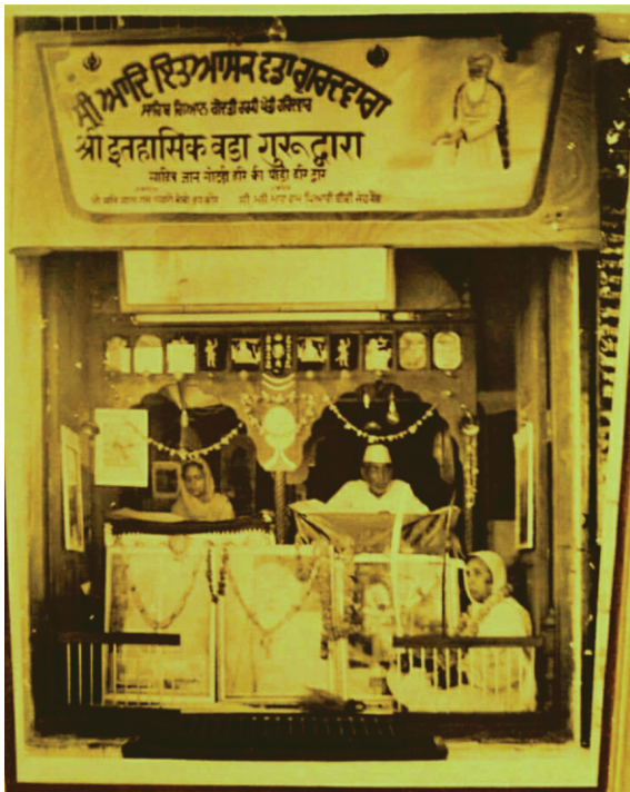
ਗਿਆਨ ਗੋਦੜੀ ਦੀ ਦੁਰਲੱਭ ਤਸਵੀਰ