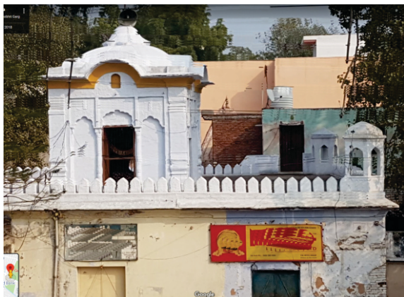
ਉਦਾਸੀਨ ਗੁਰਦੁਆਰਾ, ਸੂਰਜ ਕੁੰਡ, ਮੇਰਠ

ਗੁਰੂ ਸਾਹਿਬ ਦਿੱਲੀ ਤੋਂ ਚਲਕੇ ਇਥੇ ਆਏ ਸਨ। ਇਥੇ ਇੱਕ ਅੜੀਅਲ ਜੋਗੀ ਕਹਿ ਰਿਹਾ ਸੀ ਮੈਂ ਮੇਰਠ ਸ਼ਹਿਰ ਨੂੰ ਤਬਾਹ ਕਰ ਦਿਆਂਗਾ ਕਿਉਂਕਿ ਇੱਕ ਮਾਈ ਨੇ ਭਿਖਿਆ ਮੰਗਣ ਮੌਕੇ ਉਹਦੀ ਬੇਇਜ਼ਤੀ ਕਰ ਦਿੱਤੀ ਸੀ। ਗੁਰੂ ਸਾਹਿਬ ਨੇ ਉਸ ਜੋਗੀ ਨੂੰ ਸਮਝਾਇਆ ਕਿ ਸੰਨਿਆਸੀ ਹੋ ਕੇ ਵੀ ਹਦੂਮੈ ਚੁੱਕੀ ਫਿਰਦਾ ਇਹ ਤੇਰੀ ਕਿਥੋਂ ਦੀ ਅਕਲ। ਇਹ ਖੱਫਣੀ ਕਾਹਨੂੰ ਓੜੀ ਹੋਈ ਈ।