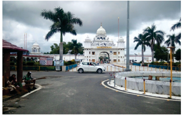
ਗੁਰਦੁਆਰਾ ਨਾਨਕਮੱਤਾ ਸਾਹਿਬ ਜਿੱਥੇ ਜੋਗੀਆਂ ਨੂੰ ਰਾਹੇ ਪਾਇਆ ਸੀ। ਪਿਛੇ ਇਤਿਹਾਸਿਕ ਪਿੱਪਲ ਵੀ ਨਜ਼ਰ ਆ ਰਿਹਾ ਹੈ।

ਦੋ ਬਜ਼ੁਰਗ ਜੋਗੀ ਆ ਬਾਬੇ ਨਾਨਕ ਦੇ ਦੁਆਲੇ ਹੋਏ। ਭਈ ਪੁਰਖਾ ਕੌਣ ਹੈ ਤੂੰ ? ਕਿਹੜੀ ਸੰਪਰਦਾ ਦਾ ਸਾਧੂ ਏ? ਕੀ ਤੂੰ ਮੁਸਲਮਾਨ ਫਕੀਰ ਏ ਕਿ ਹਿੰਦੂ? ਓਥੇ ਫਿਰ ਗੁਰੂ ਸਾਹਿਬ ਨੇ ਓਨਾਂ ਨੂੰ ਸਮਝਾਇਆ ਕਿ ਮੈਂ ਤਾਂ ਨਿਰੰਕਾਰ ਦਾ ਬੰਦਾ ਹਾਂ, ਨਾਂ ਮੁਸਲਮਾਨ, ਨਾਂ ਹਿੰਦੂ ਹਾਂ। ਮੇਰੇ ਵਾਸਤੇ ਤਾਂ ਦੋਨੇ ਪਿਆਰੇ ਨੇ। ਜਦੋਂ ਜੋਗੀਆਂ ਦੀ ਨਿਸ਼ਾ ਹੋ ਗਈ ਤਾਂ ਬਾਬੇ ਨੇ ਮਰਦਾਨੇ ਨੂੰ ਕਿਹਾ ਕਿ ਜਰਾ ਕੱਸ ਦੇ ਤਾਰਾਂ ਤਾਂ ਸ਼ੁਰੂ ਹੋ ਗਇਆ ਬਾਬਾ: