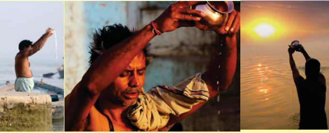
“ਸੂਰਜਾ ਸਾਂਤੀ ਰੱਖੀ!” ਚੜ੍ਹਦੇ ਸੂਰਜ ਨੂੰ ਪਾਣੀ ਦਿੰਦੇ ਹੋਏ ਬ੍ਰਾਹਮਣ। ਓਦੋਂ ਬਾਬੇ ਨਾਨਕ ਨੇ ਪੁੱਠੇ ਪਾਸੇ ਭਾਵ ਪੱਛਮ ਵਲ ਪਾਣੀ ਝੱਟਣਾ ਸ਼ੁਰੂ ਕਰ ਦਿੱਤਾ।

ਸੰਗ ਵਿੱਚ ਜਿੰਨੇ ਸਿਆਣੇ ਸਿਆਣੇ ਬੈਠੇ ਸਨ ਸਾਰਿਆਂ ਨੇ ਇਹ ਗੱਲ ਸੁਣ ਕੇ ਥੱਲੇ ਉੱਦੀਆਂ ਪਾ ਲਈਆਂ। ਬਾਬਾ ਜੀ ਨੇ ਫਿਰ ਸਮਝਾਇਆ ਕਿ ਭਾਈਓ ਇਸ ਅਖੌਤੀ ਤੀਰਥ ਯਾਤਰਾ ਦਾ ਤੁਹਾਨੂੰ ਧਾਰਮਿਕ ਲਾਭ ਕੋਈ ਨਹੀਂ। ਸਗੋਂ ਤੁਸੀਂ ਤਾਂ ਹੋਰ ਵੀ ਗੁਨਾਹਗਾਰ ਬਣੀ ਜਾ ਰਹੇ। ਤੁਹਾਡੇ ਤੇ ਤਾਂ ਹੋਰ ਪਾਪ ਵੀ ਚੜ੍ਹਦੇ ਜਾ ਰਹੇ ਨੇ। ਕੀ ਫਾਇਦਾ ਇਸ ਤਰਾਂ ਤੁਰ ਤੁਰ ਕੇ ਲੱਤਾਂ ਤੁੜਾਉਣ ਦਾ। ਬਾਬੇ ਦੀਆਂ ਗੱਲਾਂ ਸੁਣ ਕੇ ਸੱਭ ਨੂੰ ਕੰਨ ਹੋ ਗਏ। ਸੰਗ ਬਾਬੇ ਦੇ ਚਰਨੀ ਆ ਲੱਗਾ। ਅੱਗੇ ਤੋਂ ਸਾਰਿਆਂ ਤੋਂ ਬਾ ਕੀਤੀ ਕਿ ਕਿਸੇ ਕਿਸਾਨ ਦਾ ਉਜਾੜਾ ਨਹੀਂ ਕਰਨਾਂ ਭਾਵੇਂ ਕਿੰਨੀ ਭੁੱਖ ਕਿਓਂ ਨਾਂ ਲੱਗੀ ਹੋਵੇ।