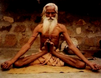
ਸਿੱਖ ਗੁਰਮਤ ਅਨੁਸਾਰ ਸਮਾਧੀਆਂ ਲਾਉਣ ਨਾਲ ਵੀ ਸੁਰਤ ਨਹੀਂ ਬੱਝ ਸਕਦੀ। ਸਿੱਖੀ ਵਿਚ ਸ਼ਬਦ ਦੀ ਅਹਿਮੀਅਤ ਹੈ। ਸ਼ਬਦ ਵੀ ਫਿਰ ਬੋਲਣਾ ਜਾਂ ਗਾਉਣਾ ਹੈ। ਆਹ ਵੇਖੋ ਸਮਾਧੀਆਂ ਲਾ ਲਾ ਕੇ ਪੈਰ ਹੀ ਪੁੱਠੇ ਹੋ ਗਏ ਨੇ।

ਲੱਗੇ। ਕਹਿਣ ਲੱਗੇ ਐ ਨਾਨਕ ਤੂੰ ਸਚਮੁੱਚ ਨਿਰੰਕਾਰ ਦੇ ਨੇੜੇ ਹੈਂ। ਸਰੀਰ ਨੂੰ ਕੋਹ ਕੇ ਨਿਰੰਕਾਰ ਦੀ ਪ੍ਰਾਪਤੀ ਦੇ ਸਿਧਾਂਤ ਦਾ ਖੰਡਣ ਕਰਦਿਆਂ ਗੁਰੂ ਸਾਹਿਬ ਨੇ ਹੋਰ ਵੀ ਕਈ ਥਾਂਈ ਉਪਦੇਸ਼ ਦਿਤੇ। ਕੁਝ ਇਕ ਹੋਰ ਸਬੰਧਤ ਸ਼ਬਦ ਵੀ ਨੋਟ ਕੀਤੇ