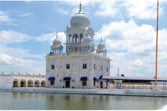
ਗੁਰਦੁਆਰਾ ਨਾਨਕਪੁਰੀ -ਜਿਥੇ ਖੂਹ ਸੁਕਾ ਦਿਤਾ ਸੀ। ਇਲਾਕੇ ਵਿਚ ਵੱਡੀ ਗਿਣਤੀ ਪੰਜਾਬੀ ਜ਼ਿੰਮੀਦਾਰਾਂ ਦੀ ਹੈ। ਜਿਸ ਕਾਰਨ ਯਾਦਗਾਰਾਂ ਬਹੁਤ ਸ਼ਾਨਦਾਰ ਬਣੀਆਂ ਹਨ।

ਗੋੜੀ ਦਈ ਜਾ ਰਿਹਾ ਹੈ, ਕਣਕ ਦਾ ਬੋਹਲ ਵੀ ਮੁੱਕਣ ਵਾਲਾ ਹੈ ਪਰ ਗੱਲਾ ਖਾਲੀ ਹੈ। ਉਸ ਨੇ ਦੁਹਾਈ ਦੇ ਦਿੱਤੀ ਕਿ ਹਨੇਰ ਸਾਈਂ ਦਾ ਆਟਾ ਸਾਰਾ ਗਾਇਬ ਹੈ। ਇਹ ਬਾਲਕ ਹੈ ਕਿ ਕੋਈ ਦੇਅ ਹੈ ਜੋ ਸਾਰਾ ਆਟਾ ਹੀ ਖਾ ਗਿਆ। ਦੁਹਾਈ ਮੱਚ ਗਈ। ਬਾਲਕ ਨੇ ਫਿਰ ਘਰ ਵਾਲਿਆਂ ਨੂੰ ਸਮਝਾਇਆ ਕਿ ਮੈਨੂੰ ਅਜ਼ਾਦ ਕਰੋ ਤੁਹਾਡੀ ਕਣਕ ਦਾ ਬੋਹਲ ਸਹੀ ਸਲਾਮਤ ਨਿਕਲੇਗਾ। ਓਨਾਂ ਭਰੋਸਾ ਦਿਵਾਇਆ ਤਾਂ ਕੀ ਵੇਖਦੇ ਹਨ ਸਾਰੀ ਕਣਕ ਓਥੇ ਮੌਜੂਦ ਹੈ।