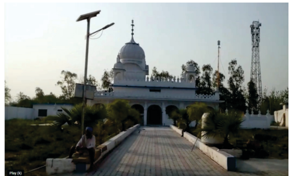
ਜਿੱਥੇ ਪਾਣੀ ਲੈਣ ਗਏ ਸੀ ਓਥੇ ਗੁਰਦੁਆਰਾ ਗੁਰੂ ਘਾਟ,

ਅਗਲੇ ਸਵੇਰੇ ਬਾਲਕ ਫਿਰ ਜਾ ਓਸੇ ਥੜੇ ਤੇ ਬੈਠਾ। ਚਲਾਕ