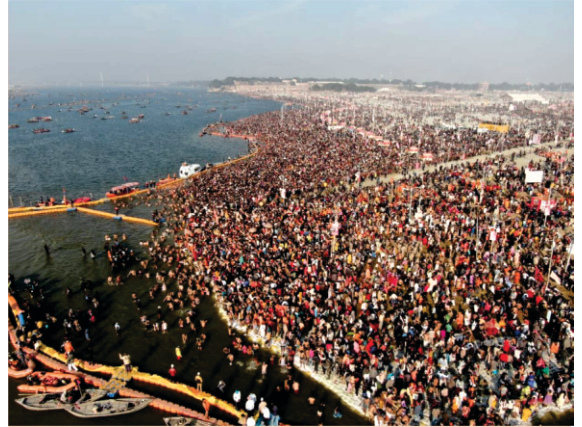
ਅਲਾਹਾਬਾਦ ਦਾ ਕੁੰਭ ਮੇਲਾ ਦੁਨੀਆ ਦੇ ਵੱਡੇ ਮੇਲਿਆਂ ਵਿਚੋਂ ਇਕ। ਗੁਰੂ ਨਾਨਕ ਵਾਸਤੇ ਇਹ ਸੁਨਿਹਰੀ ਮੌਕਾ ਸੀ ਪ੍ਰਚਾਰ ਕਰਨ ਲਈ

ਫਿਰ ਸਾਈਕਲ ਯਾਤਰੀ- 141 ਅਨੁਸਾਰ ਕਾਨਪੁਰ ਦੇ ਇਲਾਕਾ ਸਰਸੰਈਆ ਘਾਟ ਵਿਖੇ ਇਤਹਾਸਿਕ ਗੁਰਦੁਆਰਾ ਹੈ ਜਿੱਥੇ