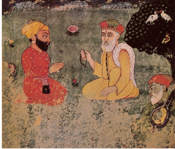
बी:40 जनम साखी दा भूमिया चोर गुरू साहब अगो हत्य बन्नी बैठा है।

किले अन्दर जदों वडहन लग्गा तां पहरेदारां पुच्छ्या कि श्रीमान जी कौन हो?