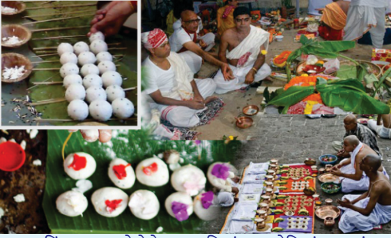
गया दा पंड दान- बाबे ने केहा तुहाडियां इह गरोलियां बजुरगां तक नही पहुंचदियां। क्यो लोकायी नूं मूरख बणाउदे हो।

दूसरे पासे कथा मशहूर है कि इह शहर गयासुर राखश दा सी जिन्ने विशनूं कोलो वर लै रख्या सी कि जैहड़ा मेरा दरशन करे उहदी मुकती हो जावे। इस वजा करके गया हिन्दूआं दे वड्डे तीरथ सथानां विच्चों इक्क है। जिवे हरदुआर हुन्दा है। इथे वी लोक आपने बजुरगां दी मुकती लई आउदे हन ते पंड दान करदे हन। इथों दे पंडे दाअवा करदे हन कि भगवान राम ने आपने बजुरगां दा पंड दान इथे ही करवायआ सी। इस शहर दा जिकर मुख् हिन्दू शासतरां जिवे रमायन महां भारत ते होर पुराना विच्च है।