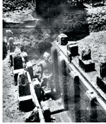
मौरिया काल दा लक्कड़ी ते मिट्टी दा पाटलीपुत्र किला जिस दे आसार खुदायी दौरान निकलदे हन

पटना पुराने जमाने दे पाटलीपुत्र शहर दा ही नवां रूप है। पाटलीपुत्र राजे अजातशतरू ने अज्ज तों 2500 वरे पहलां वसायआ सी। इस शहर ने इनी तरक्की कीती कि महाराजा असोक दे समें तक्क इह दुनिया दे वड्डे शहरां विच्च हो गया जिस दी अबादी ओनी दिनी डेढ