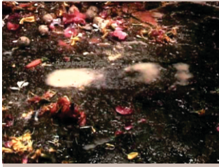
(उपर) विशनू चरन पादुका मन्दर गया। (खब्बे) पत्थर ते कुदरती तौर ते बने पैर दे निशान नू हिन्दू लोक विशनू भगवान दे पैर दा निशान मन्नदे हन। निशान 40 सै. मी. लंमा है।

वी इथे रह रेहा सी। क्युकि पटना साहब दी सिक्ख रवायत अनुसार गुरू साहब इथे कबीर साहब नू मिले सन। पर इतहास तौर ते कबीर साहब अते गुरू साहब दा मेल साबत नहीं हुन्दा।