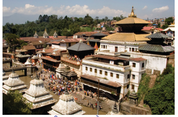
पशूपतीनाथ मन्दर अते आला दुआला

शहर नूं ओदों किते कांतीपुर ते किते कासटमंडप महानगर केहा जांदा सी। नेपाल हर पासे तरक्की कर रेहा सी। इस युग विच बने खूबसूरत मन्दर, मठ अते मूरतियां इस गल दी गवाही भरदियां हन।