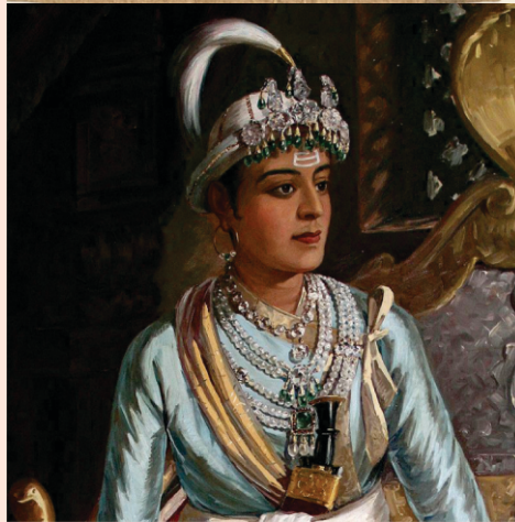
“राज बिनां नां धरम चले है। धरम बिनां सभ दलै मलै है” जदों पंजाब विच सिक्खां दा आपना राज सी पंजाबों बाहर वी सिक्खी दी कदर कीती जांदी सी। नेपाल दे राजे गिरवान युद्ध बिक्रम शाह ने सत्र 1800 ई विच गुरू नानक मट्ट नूं सैकड़े एकड़ जमीन अलाट कीती सी। (उत्ते) उह शाही फरमान महंतां ने अज्ज तक सांभ्या होया