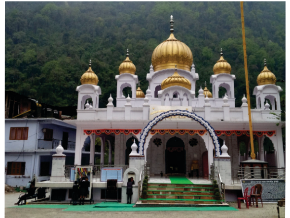
चुंगथांग - अज्ज कारसेवा वाल्यां ने होर वी शानदार गुरुदुआरा बना के बोधियां नूं होर वी चिड़ा दिता है।

https://www.sikhphilosophy.net/threads/guru-nanak-in-sikkim.50894/