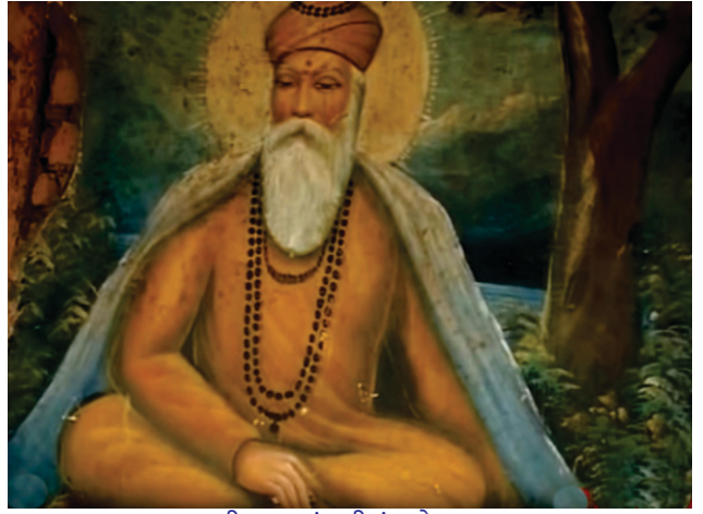
गुरुदुआरा (मठ) थापाथली, काठमंडू दी कंध ते गुरू साहब दा पुराना बणया होया चित्र। पता नही लग्गा 2015 दे भुवाल दौरान कंध बची है जां नही।

दाखला- गुरू साहब बनारस तों चल के हाजीपुर (पटना) पहुंचदे ने। इथे कुछ दिन नाम दा प्रचार कीता अते इलाके (बेहार, बंगाल, नेपाल, असाम, नागालैंड) दे राजनीतक अते धारमिक हालातां नूं समझ्या। याद रहे बंगाल, बेहार दियां कई यासतां खिच्च दा केंदर बणियां होईआं सन। हाजीपुर विच फिर काठमंडू दी धारमिक अते सभ्याचारक अमीरी दी गल वी चल रही सी। पटने तों 1510 ई दे शुरू विच गुरू साहब जनक राज्यां दी धरती मिथिला देस भाव बेहार दे उतरी भाग थानी भाव पटने तों वैशाली, केसरिया, अज्ज दा मोतीहारी, गहावा (अज्ज दा बीरगंज), 310 कि. मी दा पैडा करदे होए काठमंडू पहुंचे सन। ♦