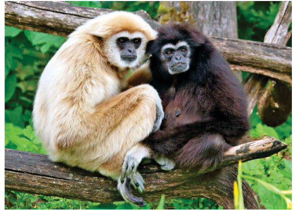
जिजां नूं वेख मरदाना डर गया सी। उत्तर पूरब दे बणमानू (गिब्बन) जो इनसानां नूं वेख के बहुत चीक चेहाड़ा पाउडे हन।

फिर उस इलाके दा जदों शहर आया तां गुरू साहब दी शरन विच्च ओथों दा राजा वी आया। ओथों दे फल फरूट मरदाने नूं बहुत पसन्द आए। ओथे वी कुझ