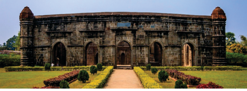
पांडूआ। फिर की होया सिर ते छत नही बची। मसीत है तां 600 साल पुराणी।

इस शहर दी अबादी 12 लक्ख सी। ♦ गुरबानी विच जेहड़ा राग गाउडी आउदा है उहदा नां वी ऐसे शहर करके ही है। उदों बंगाल नूं गौड़ देस वी कह दिता जांदा सी। पुराने सम्यां विच राजधानी दे नां ते ही देस दा नां चलदा हुन्दा सी। जिवे लहौर सूबा, मुलतान देस आदि आदि।