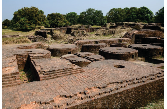
कयी किलोमीटरां च फैले गौड़ दे खंडर कहानी दस्स रहे ने कि इस नासवान संसार विच कुझ वी सथायी नहीं।

मनुक्खता दे पैगम्बर गुरू नानक नूं सुलतान दी इह सोच बहुत चुभदी सी। साहब ने बादशाह नूं समझाउन बुझाउन दी कोशिश कीती पर कट्टड़ मौलाण्यां गुरू