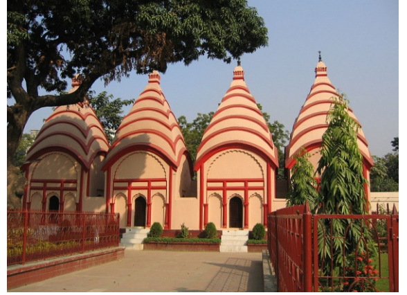
ਠਾਕੇਸ਼ਵਰੀ ਮੰਦਰ, ਠਾਕਾ

ਦੇਯੀ ॥2॥ ਨੀਲ ਅਨੀਲ ਅਗਨਿ ਇਕ ਠਾਯੀ ॥ ਜਲਿ ਨਿਕਰੀ ਗੁਰਿ ਬੁੜ੍ਹ ਬੁੜ੍ਹਾਯੀ ॥ ਮਨੁ ਦੇ ਲਿਆ ਰਹਸਿ ਗੁਨ ਗਾਯੀ ॥3॥ ਜੈਸਾ ਘਰਿ ਬਾਹਰਿ ਸੋ ਤੈਸਾ ॥ ਬੈਸਿ ਗੁਫਾ ਮਹ ਆਖੁ ਕੈਸਾ ॥ ਸਾਗਰਿ ਝਗਰਿ ਨਿਰਭਉ ਏਸਾ ॥4॥ ਮੂਏ ਕਉ ਕਹੁ ਮਾਰੇ ਕਉਨੁ ॥ ਨਿਡਰੇ ਕਉ ਕੈਸਾ ਡੁ ਕਵਨੁ ॥ ਸਬਦਿ ਪਛਾਨੈ ਤੀਨੇ ਭਉਨ ॥5॥ ਜਿਨਿ ਕਹੁਆ ਤਿਨਿ ਕਹਨੁ ਵਖਾਨ੍ਯਾ ॥ ਜਿਨਿ ਬੁੜ੍ਹਾਯਾ ਤਿਨਿ ਸਹਜਿ ਪਛਾਨ੍ਯਾ ॥ ਦੇਖਿ ਬੀਚਾਰਿ ਮੇਰਾ ਮਨੁ ਮਾਨ੍ਯਾ ॥6॥ ਕੀਰਤਿ ਸੂਰਤਿ ਮੁਕਤਿ ਇਕ ਨਾਯੀ ॥ ਤਹੀ ਨਿਰੰਜਨੁ ਰਹਆ ਸਮਾਯੀ ॥ ਨਿਜ ਘਰਿ ਬ੍ਯਾਪਿ ਰਹਆ ਨਿਜ ਠਾਯੀ ॥7॥ ਉਸਤਤਿ ਕਰਹ ਕੇਤੇ ਮੁਨਿ ਪ੍ਰੀਤਿ ॥ ਤਨਿ ਮਨਿ ਸੂਚੈ ਸਾਚੁ ਸੁ ਚੀਤਿ ॥ ਨਾਨਕ ਹਰਿ ਭਜੁ ਨੀਤਾ