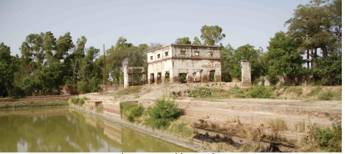
छोटा ननकाना छांगा

जान बाबा नानक आया है जिस ने नवाब दी नौकरी न ठोकर मार के फकीरी लै लई है तां की हिन्दू ते की मुसलमान सभ दौड़े आए।