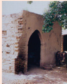
छोटा ननकाना- हुजरा शाह मुकीम दा अज्ज इहो कुझ बच्चा है।