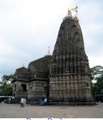
नासिक दा त्रिम्बकेशवर मन्दर

पंच अग्नि क्यु धीरजु धीजै ॥ अंतरि चोरु क्यु सादु लहीजै ॥ गुरुमुखि होइ कायआ गड लीजै ॥4॥ अंतरि मैलु तीरथ भरमीजै ॥ मनु नही सूचा क्या सोच करीजै ॥ किरतु पया दोसु का कउ दीजै