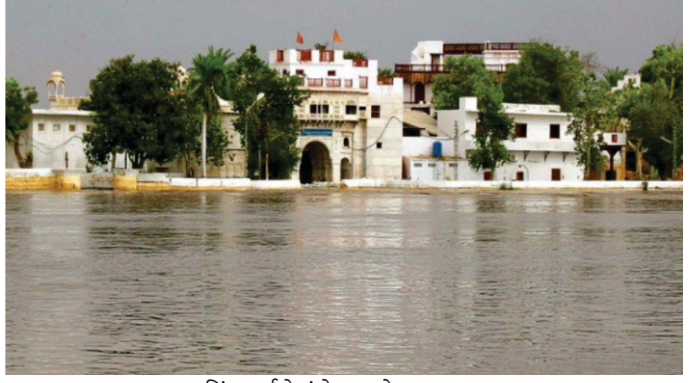
सिंध दर्या दे कंठे साधू बेला सक्खर।

देवत्या दरसन कै तायी दूख भूख तीरथ कीए ॥ जोगी जती जुगति मह रहते करि करि भगवे भेख भए ॥1॥ तउ कारनि साहबा रंगि रते ॥ तेरे नाम अनेका रूप अनंता कहनु न जाही तेरे गुन केते ॥1॥ रहाउ ॥ दर घर महला हसती घोड़े छोडि विलायति देस गए ॥ पीर पेकांबर सालिक सादिक छोडी दुनिया थाय पए ॥2॥ साद सहज सुख रस कस तजियले कापड़ छोडे चमड़ लीए ॥ दुखीए दरदवन्द दरि तेरे नामि रते दरवेस भए ॥3॥ खलड़ी खपरी लकड़ी चमड़ी सिखा सूत धोती कीनी ॥ तूं साहबु हउ सांगी तेरा प्रणवे नानकु जाति कैसी ॥