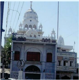
गुरुद्वारा नानकवाडी। वड़ोदरा जां बड़ोदा शहर विच गुरू साहब दे आउन बारे साडी तसल्ली नही होई। क्युकि सानूं नही लगदा कि गुरू साहब दे वेले इह शहर मौजूद सी। गुरसिक्खां ने इथे उज यादगारी गुरुद्वारा बना ल्या है। इह तसवीर इंटरनेट तों लई है। किसे जिमेवार निवासी नाल सम्परक नही हो सक्या जिस तों गुरू साहब दी आमद बारे तसल्ली हो सके।

अजेहे ही कुकरम गुरू साहब दे वेले वी सोमनाथ दे मन्दर विच चल रहे सन। हालां बार बार मुसलमानां ने इह मन्दर लुट्टे पर पुजारी लुट्टे दे कुझ साल बाद ही सभ भुल भुल्ला के आपणिया माडियां हरकतां फिर शुरू कर दिन्दे सन। गुरू साहब ने पुजारियां नूं सुचेत कीता कि सरब व्यापक निरंकार कोलां डो। तां ही गुरू साहब ने इनां नूं उपदेस दित्ता कि रंग रंग दे देवी देवत्यां नूं खुश करन वाले जो तुसी करम कांड करदे हो उह सभ विअर्थ हन ते जे तुसी सच्च मुच्च भगवान दी भगती करनां लोचदे हो तां उस निरंकार नूं ध्यायो जो सरब व्यापक है। सोमनाथ इलाके विच वड्डी अबादी मुसलमानां दी वी है जो साबत करदी है कि आम जनता पुजारियां दे पाखंड समझदी सी तां ही उह हमले वेले अन्दरो खुश हुन्दे सन ते बहुते मुसलमान वी बण गए।