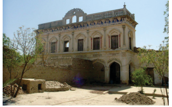
दीपालपुर शानदार गुरधाम दे खंडर

क्युकि गुरू साहब दी चार चुफेरे धुम पई होयी सी। हर दुखिया गुरू साहब कोल पहुंच रेहा सी। नौरंगा नां दा कोहड़ दा मरीज गुरू साहब दे दरबार लागे पहुंच के उच्ची उच्ची रोए। गुरू साहब ने केहा भायी तूं लागे आ के गल्ल कर तेनू की दुख है। कहन लग्गा बाबा मैनुं मौत दे दे। लागे बैठे लोकां ने गुरू साहब नूं दस्स्या कि इह