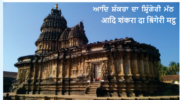
आदि शंकरा दा श्रिंगेरी मठ आदि शंकरा दा श्रिंगेरी मठ

इथों कोज़ीकोड तों फिर गुरू साहब 150 किलोमीटर दा समुन्दरी सफर करके कोचीन (कोची) पहुंचे। इह