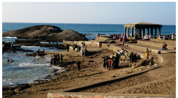
कन्या कुमारी मन्दर जिथे बंगाल दी खाड़ी अते अरब सागर दा मेल हुन्दा है। गुरू साहब दे वेले वी इह थां मशहूर सी।

https://www.newyorker.com/magazine/2012/04/30/the-secret-of-the-temple