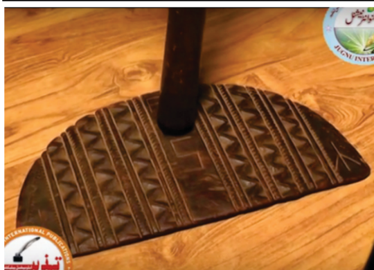
उच्च दा वड्डा पीर मखदूम सयद सुलतान जहानिया गुरू साहब दियां निशानिया गुरज अते बैरागन दिखाउदे होए। हेठां बैरागण।

इसनान करदे होए जपुजी साहब दा पाठ कर रहे सन। नाल ही कुझ मुसलमान सिंधी वी नहा रहे सन। उह गुरू साहब दे कलाम नूं बड़े ध्यान नाल सुन रहे सन। उनां अरज करके गुरू साहब दी बानी दुबारा सुनी ते हेठलियां तुकां ते शंका जिता दिती:-