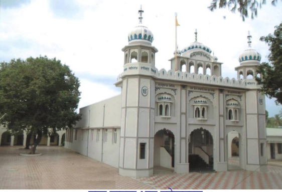
ਗੁਰੂ ਨਾਨਕ ਧਾਮ ਰਮੇਸ਼ਵਰਮ

ਭई ਹਾਂ। इह हिन्दू इह मुसलमान - राह दो हन जे अनेकां हो सकदे हन पर निशाना इक्क है।