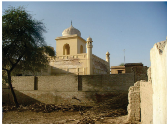
ਗੁਰ. ਪਹਲੀ ਪਾਤਸ਼ਾਹੀ, ਚਕਕ 317 ਈ.ਬੀ. ਬੂਰੇਵਾਲਾ ਜਿਲਾ ਵੇਹਾੜੀ।

ਸਾਡਾ ਅਨੁਮਾਨ ਹੈ ਕਿ ਗੁਰੂ ਸਾਹਬ ਝਕ ਵਾਰੀ ਨਹੀਂ ਤਿੰਨ ਵਾਰੀ ਉੱਚ ਆਏ ਸਨ। ਭਾਈ ਮਨੀ ਸਿੰਘ ਨੇ ਲਿਖਿਆ ਹੈ ਕਿ ਗੁਰੂ ਸਾਹਬ ਬਹੁਤ ਛੋਟੀ ਉਮਰੇ ਭਾਈ ਮਰਦਾਨੇ (ਦਾਨਾ) ਨਾਲ ਪਾਕਪਤਨ ਗਏ ਸਨ। ਸਿਰਫ ਭਾਈ ਮਨੀ ਸਿੰਘ ਹੀ ਨਹੀਂ ਪੁਰਾਤਨ ਜਨਮ ਸਾਖੀ ਤੋਂ ਵੀ ਗੁਰੂ ਸਾਹਬ ਦੀ ਇਨ੍ਹਾਂ ਪੀਰਾਂ