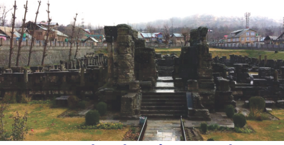
भगवान अवंती सवामी मन्दर दे खंडरात, अवंतीपुर।

कोलो मोटी रकम फिरौती दी लै के गया है। ❖ गुरू साहब ने महसूस कीता इह सुनेहरी मौका है कि बाबर नूं जा के मिल्या जाए ते दिल्ली नूं लोधी खानदान तों छुटकारा मिले। गुरू साहब ने महसूस कर ल्या सी बगाली तिल्लां विच तेल नही (बादशाह अलाउद्दीन हुसैन) उह संभावना गुरू साहब नूं बाबर विच नजर आई जेहड़ी उह पूरब विच ढूंढ रहे सन।