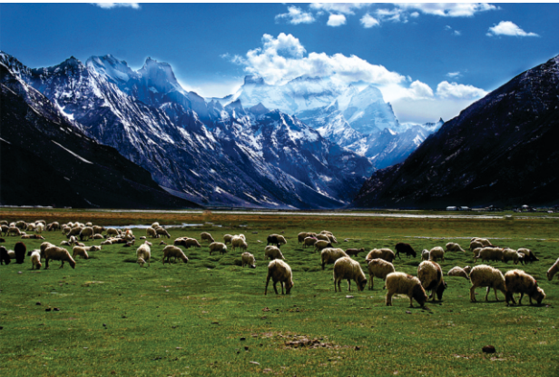
कशमीर दे तोसमैदान विच चरदियां भेडां

गुरू साहब ने आजड़ी नूं उपदेस दिता कि फिकर चिंतां ----- (बाकी अगली फाईल विच)