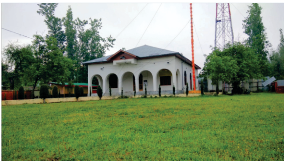
सी गुरू नानक चरन असथान बीरव्हा

पहलां ही पहुंच चुक्की सी। ब्राहमन लोक गुरू साहब नूं हिन्दू धरम रखिअक समझदे सन क्युकि साहब ने कई थांयी मुसलमान हुकमरानां नूं मज्हबी कट्टड़वाद अते पक्खपात तों वरज्या सी।