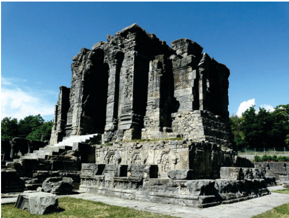
मट्टन विखे 8वी सदी ई दे मारतंड मन्दर दे खंडरात