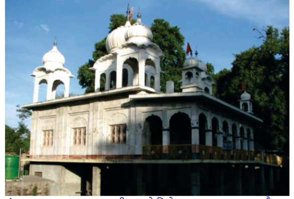
पंडत ब्रहम दास दा घर अज्ज बीजब्याड़े विखे गुरअसथान बण चुक्का है।