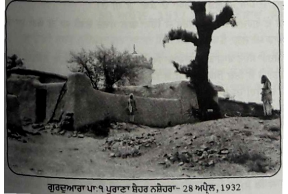
गुरदवारा पा: पहली नशहरा। फोटो 1932 ई.-साईकल यातरी

3-4 सदियां लोक इस पानी दा लाभ उठांदे रहे। मुकामी लोक इनुं नानक पीर दा चशमा कह के याद करदे आए सन। पिच्छे 1930 ई दे नेड़े चशमे दा पानी थोड़ा नीवां हो गया। जिस करके हुजरो शहर दे इक्क गुरसिक्ख ने इथे बाउली ही खुदवा दित्ती। फिर लोक इनुं खंडा खूह दे नां नाल सम्बोधन करदे आए ने। साईकल यातरी ने इस असथान दी तसवीर वी दित्ती