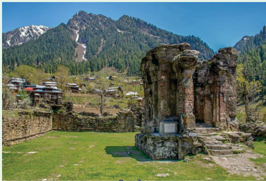
शारदा पीठ दे खंडरात

क्युकि बादशाह अकबर दे दौर विच्च लिखी गई पुसतक आइन इ अकबरी विच्च अबुल फज़ल ने इस मन्दर दी सोभा कीती है जिस तों साबत हुन्दा है कि गुरू नानक पातशाह दी कशमीर फेरी मोके इह मन्दर