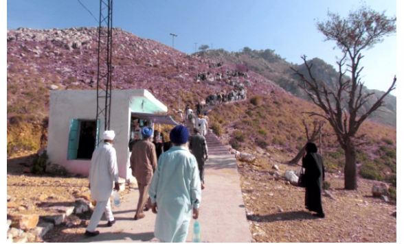
वली कंधारी दे सथान दे दरशनां लई पहाड़ी चड़हदियां संगतां। नवम्बर 2015 जदों असी गए सी, चिल्ला वली कंधारी दी कारसेवा चल रही सी

केहा जांदा है कि गुरू साहब ने मरदाने नूं तीसरी वारी वी भेज्या पर पीर ने पानी नां प्याया।