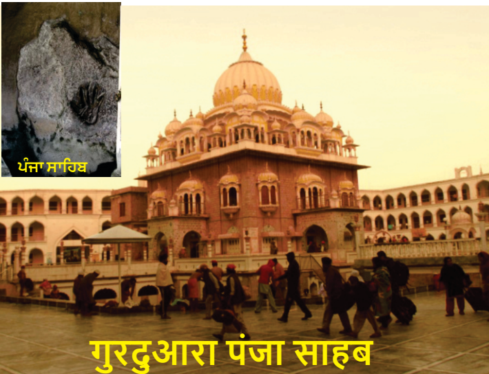
ਗੁਰਦੁਆਰਾ ਪੰਜਾ ਸਾਹਬ