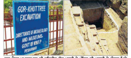
गुरू 'ग्रेहसत' पधुनलमबा' सी उरिमोल वीच-यजो दे मँचि वी पुदारी दे देरान भित्त मरानव उँ मरानि वेंडर।

दुआले हो गए। ग्रेहसत नू भंडन लग पए। कहन लगे ग्रेहसती बन्दा कदी रूहानियत दी उच्चायी नही छूह सकदा क्युकि उह प्रवारक