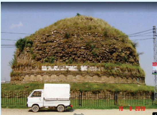
ਮਹਾਰਾਜਾ ਅਸ਼ੋਕ ਦੇ ਬਣਾਏ ਸਤੂਪ ਦਾ ਤਲਾ, ਮਾਨਕਪਾਲਾ, ਰਾਵਲਪਿੰਡੀ।