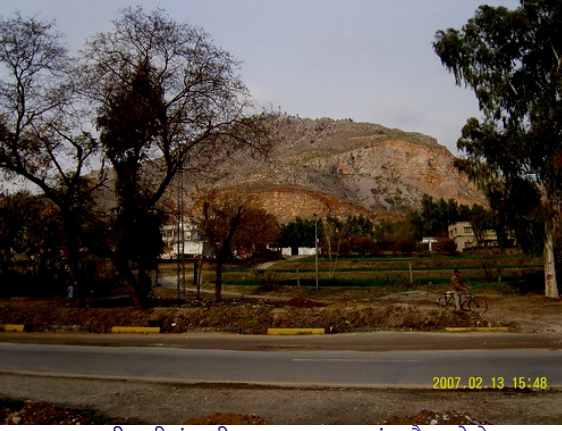
पहाड़ी वली कंधारी, हसन अबदाल

बहुत मानता है। सभ दुनिया कंधार तों पहुंचे होए फकीर दी मुरीद है। लोकी उनूं बाबा वली कंधारी करके जाणदे ने।