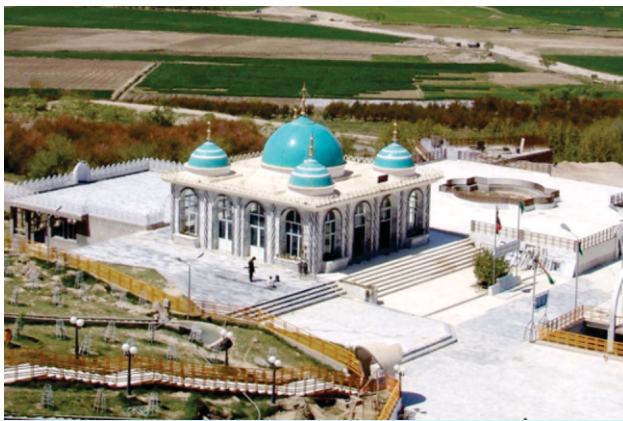
हजरत वलीउला बनाम वली कंधारी दा कंधार तों 42 कि. मी. हटवां मकबरा। गुरू साहब जदों बगदाद तों परत रहे सन तां गुरू साहब ने वली दे टिकाने बारे पता कीता। साहब नूं फिर खबर मिली कि उहनां दा यार तां फौत हो गया है।

केहा जांदा है कि गुरू नानक वी पहाड़ी दे पैरां च लागे ही बिराजमान सन। मरदाना गुरू साहब कोल आया ते सारी गल्ल दस्सी। गुरू साहब ने केहा मरदान्या