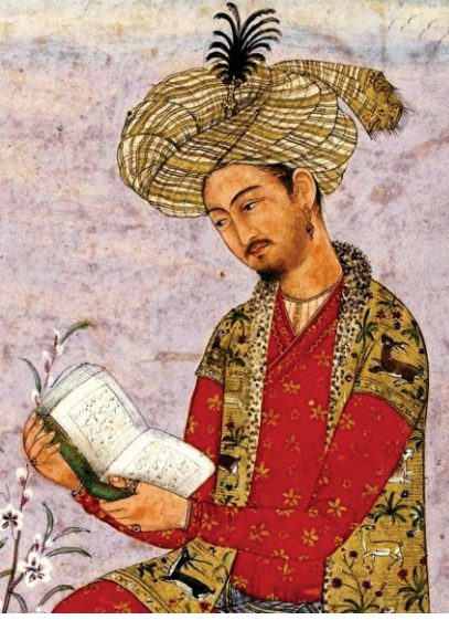
बादशाह बाबर दी असल इतहासिक तसवीर (हथ्य नाल बणी) याद रहे मुगल बादशाह, मूल विच मंगोलिया तों होन करके खोदे जेहे ही हुन्दे सन। सिरफ ठोडी ते माड़े जेहे वाल हुन्दे सन।

पीर दी सिंध विच्च बहुत मन्नता है) दा मकबरा बण्या होया है। इह ओही पुट्टी सोच वाला काफर फकीर सी जिस करके इस इलाके दे अनेकां लोकां दी सोच विगड़ गई है। मैनु लगा कि ऐहो जेही खूबसूरत थां ते किसे काफिर दा मजार नहीं होना चाहीदा। सो मै हुकम दे के उह दुहा दित्ता ते थां पन्द्ररा करवा दित्ता। इह एनी खूबसूरत थां सी कि मेरा ओथों जान नूं जी नां करे। इथे फिर मै नमाज वी पड़ी। इथे कुझ समां मैरेहा।"