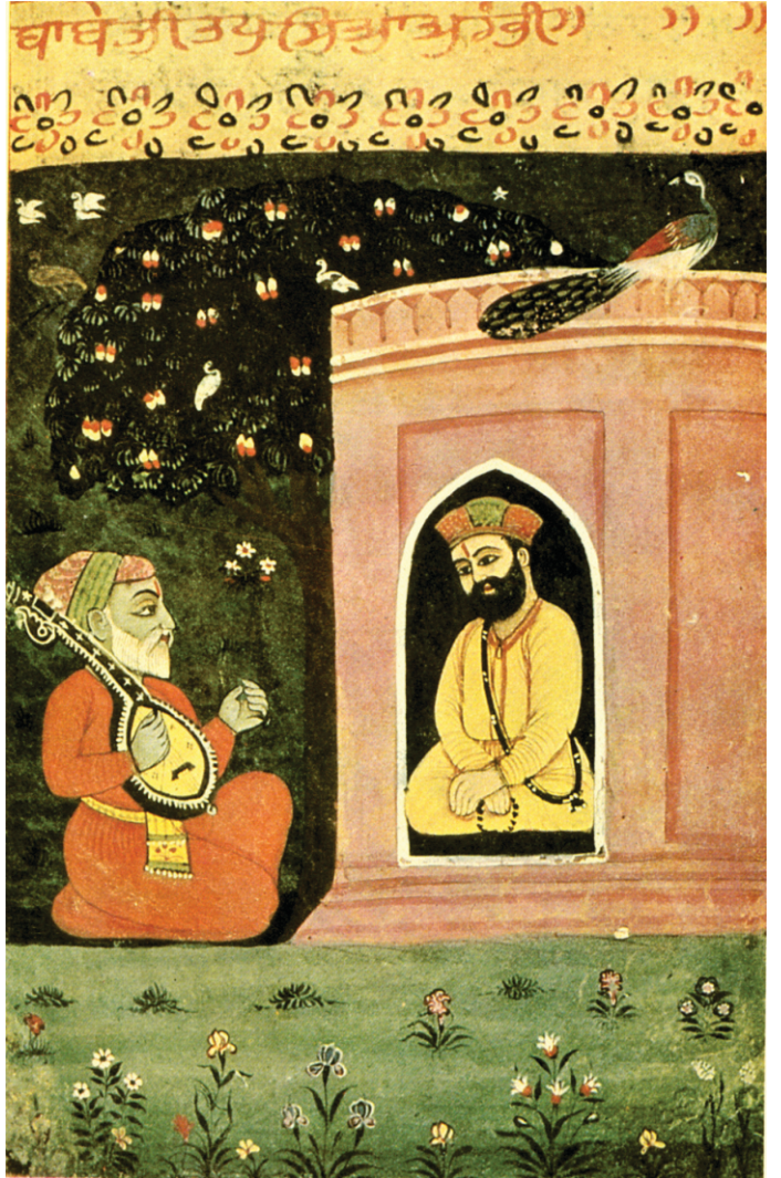
“ਬਾਬੇ ਨੇ ਖੁਡੂਡ ਬਠਿਆ ਦੀ ਖੁਡੂਈ ਉਸਾਰੀ” ਭਾਵ ਗਰੀਬ ਲੋਕਾਂ ਵਾਲਾ ਕਮਰਾ ਪਾਯਆ

ਉਂਜ ਹੈਰਾਨੀ ਹੁਨ੍ਦੀ ਹੈ ਜੇਹਡਾ ਇਤਹਾਸ ਵਿਚ ਆਉਦਾ ਹੈ ਕਿ ਗੁਰੂ ਸਾਹਬ ਨੇ ਮੋਡੀ ਗਡੂਨੀ। ਇਹ ਗਲ ਗੁਰੂ ਸਾਹਬ ਦੀ