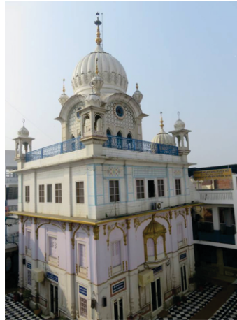
अन्दर शीशे विच मड्ही पवित्र कंध अते गुरुदुआरा कंध साहब

फोड़ि कर जहां विछावने बाहे थे ऊहा ही गुरू बाबा नानकु जी आइ बैठा। जोड़ा पहरायआ। तिलकु लगायआ। मुकटु सिरि बांध्या। सेहरे सिरि ब्रहमन चाइहै। गणेश पूजा करी। कुल प्रवार जितना था तथा महाजनु सभनाहु तम्बोलु पायआ। तब गुरू बाबे नानक जी कपड़े पहरे।