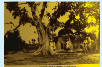
गुरदुआरा नानक मडूह साहब