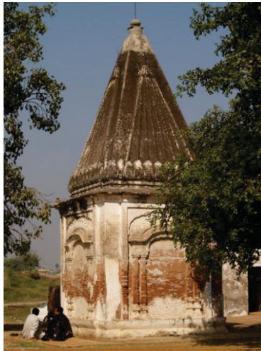
ਸ਼ਾਲਕੋਟ ਇਲਾਕੇ ਵਿੱਚ ਅੱਜ ਵੀ ਮਕਬੂਲ ਹੈ, ਪੂਰਨ ਭਗਤ ਦਾ ਖ਼ੂਹ।

ਜੰਮੂ ਦੇ ਰਾਹ ਤੋਂ ਠੋੜਾ ਜੇਹਾ ਪਾਸੇ ਜਾ ਕੇ ਮਤਲਬ ਚਪਰਾੜ ਰੋਡ ਤੇ ਪਿੰਡ ਤਿਲਕਪੁਰ ਤੇ ਕਾਨਪੁਰ ਹਨ। (ਸ਼ਾਲਕੋਟ ਤੋਂ 15 ਕਿ. ਮੀ. ਚੜ੍ਹਦਾ ਪਹਾੜ ਪਾਸੇ) ਇਥੇ ਤਿਲਕਪੁਰ ਵਿਖੇ ਗੁਰੂ ਸਾਹਬ ਦੇ ਬਿਰਾਜਨ ਦੀ ਯਾਦਗਾਰ ਵੱਜੋਂ ਗੁਰਦੁਆਰਾ ਨਾਨਕਸਰ ਸਾਹਬ ਮੌਜੂਦ ਹੈ। ਹਾਲਾਂ ਹੁਣ ਗੁਰਦੁਆਰਾ ਸਾਹਬ ਦੇ ਖੰਡਰਾਤ ਹੀ ਬਚੇ ਹਨ। ਪਤਾ ਲੱਗਾ ਹੈ ਕਿ ਅਸਥਾਨ ਦੀ ਜ਼ਮੀਨ ਤੇ ਲੋਕਾਂ ਨੇ ਕਬਜ਼ੇ ਕਰ ਲਏ ਨੇ ਤੇ ਆਪਸ ਵਿੱਚ ਓਨਾਂ ਦੇ ਮੁਕੱਦਮੇ ਵੀ ਚਲ ਰਹੇ ਨੇ।*** ਹੋ ਸਕਦੇ ਇਥੇ ਵੀ ਜੋਗਿਆਂ ਦਾ ਕੋਯੀ ਮਹੱਤਵਪੂਰਨ ਅਸਥਾਨ ਰੇਹਾ ਹੋਵੇਗਾ ਜੇਹੜਾ ਗੁਰੂ ਸਾਹਬ ਇਥੇ ਆਏ। ਜਾ ਕੋਯੀ ਵੱਡਾ ਮੰਦਰ ਆਦਿ ਹੋਵੇਗਾ। ਕਯੋਕਿ ਲਹੌਰ ਪਾਸੋਂ ਜਦੋਂ ਹਿੰਦੂ ਸ਼ਰਠਾਲੂ ਵੈਸ਼ਨੋਦੇਵੀ ਦੇ ਦਰਸ਼ਨਾਂ ਨੂੰ ਜਾਂਦੇ