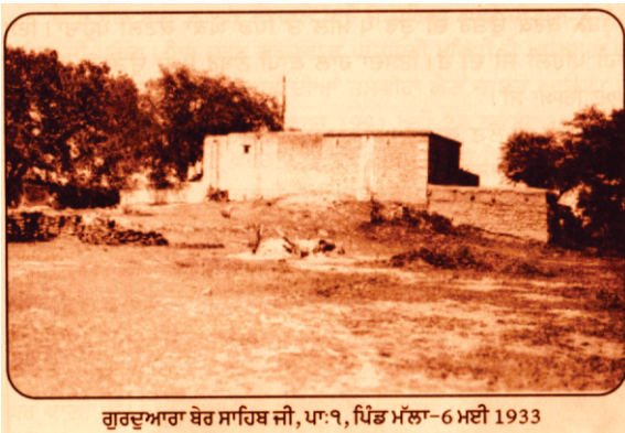
गुरदुआरा घेर प्रागिष नौ, पार्-१, पिंड मल्ला-6 मही 1933