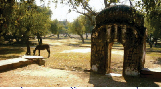
पसरूर दे गुरुदुआरा साहब द्योके दा बस इह कुझ बच्चा है। पसरूर भाव परसरामपुर। हिन्दू मिथहास दे ब्रहामन देवता परसराम दा शहर। उह परसराम जिस ने खतरियां नू खतम करन दी सौह खाधी सी।