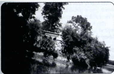
गुरुदुआरा नानकसर पा. १ डे ६ मेचारा (सिआलकोट), 20 सवेबर 1932

गुरुदुआरा नानकसर सीओकी दी पुरानी तसवीर (साइकल यातरी) असली नां: सीओकी।