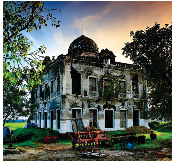
गुरू नानक चरन असथान फतह भिंडर।

पधारे उह वजीराबाद वाले पासे जा रहे सन। (स्यालकोट तों 13 कि. मी. पच्छम) ओहनी दिनी इस पिंड दा नां गुमटाला गिल्लां वाला हुन्दा सी। गुरू साहब दी आमद ते गिल्ल जट्ट हंकार विच्च ही आफरे रहे ते साहब दा प्रचार कत्र ते रक्खन नू त्यार नही सन। गुरू साहब दी दूर द्रिशटी इनां दा भविख वी देख रही सी। गुरू जी अग्रे चलदे बणे।