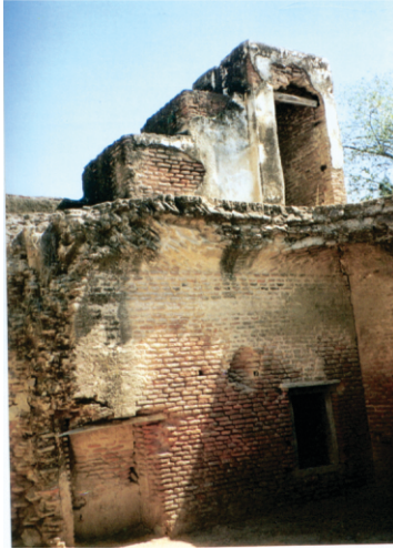
ਬਚੇ ਖੁੱਬੇ ਖੰਡਰ ਗੁਰਦੁਆਰਾ ਤਿਲਕ ਪੁਰ ਸ਼ਾਲਕੋਟ

ਪਰਿਵਾਰ ਵੀ ਸਿਕੱਖੀ ਲੈਂਦੇ ਸ਼ਰਧਾ ਰੱਖਦੇ ਸਨ। ਪਰ 1849 ਈ ਵਿਚ ਜਦੋਂ ਅੰਗਰੇਜ਼ਾਂ ਨੇ ਖਾਲਸਾ ਰਾਜ ਤੇ ਕਬਜ਼ਾ ਕਰ ਲਿਆ ਤਾਂ ਔਦੋਂ ਇਸ ਇਲਾਕੇ ਦੇ ਡੋਗਰੇ ਰਾਜਾ ਧਿਆਨ ਸਿੰਘ, ਹੀਰਾ ਸਿੰਘ, ਗੁਲਾਬ ਸਿੰਘ ਹੁਰੀ ਮਹਾਰਾਜਾ ਰਣਜੀਤ ਸਿੰਘ ਦੇ ਵਿਸ਼ਵਾਸ਼ਪਾਤਰ ਸਨ। ਧਿਆਨ ਸਿੰਘ ਤਾਂ ਪ੍ਰਧਾਨ ਮੰਤਰੀ ਸੀ। ਹੀਰਾ ਸਿੰਘ ਨੂੰ ਮਹਾਰਾਜਾ ਬਹੁਤ ਅਕਲਮੰਦ ਸਮਝਦਾ ਸੀ। ਬਾਦ ਵਿਚ ਸਾਬਤ ਹੋ ਗਿਆ ਡੋਗਰਿਆਂ ਦਾ ਇਹ ਟੱਬਰ ਅੰਦਰਕਾਤੇ ਅੰਗਰੇਜ਼ਾਂ ਨੂੰ ਸਿਕੱਖ ਦਰਬਾਰ ਬਾਰੇ ਸੂਹ ਵੀ ਦਾ ਕਰਦਾ ਸੀ। ਖਾਲਸਾ ਰਾਜ ਦਾ ਖਾਤਮਾ ਹੋ ਗਿਆ ਅਤੇ ਡੋਗਰਿਆਂ ਨੂੰ ਇਨਾਮ ਵਜੋਂ ਜੰਮੂ ਕਸ਼ਮੀਰ ਦਾ ਇਲਾਕਾ ਅੰਗਰੇਜ਼ਾਂ ਨੇ ਦੇ ਦਿੱਤਾ। ਰਾਜਾ ਗੁਲਾਬ ਸਿੰਘ ਫਿਰ ਕੁਝ ਈਰਖਾਲੂ ਬ੍ਰਾਹਮਣਾਂ ਦੇ ਕਹੇ ਖਾਲਸਾ ਰਾਜ ਦੀ ਮੁਖਾਲਫਤ ਕਰਦਿਆਂ ਕਰਦਿਆਂ ਸਿੱਖ ਧਰਮ ਦੀ ਵਿਰੋਧਤਾ ਤੇ ਹੀ ਆ ਗਿਆ। ਕਯੁਕਿ ਇਸ ਪਰਿਵਾਰ ਨੇ ਜੇਹੜਾ ਦੇਸ਼-ਧੋਹ ਕੀਤਾ ਸੀ ਉਹਦੀ