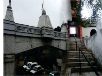
ਗੁਫਾ ਪੀਰ ਖੋ, ਜਾਮਵੰਤ। ਜੰਮੂ। ਇਥੇ ਗੁਰੂ ਸਾਹਬ ਦਾ ਆਉਣਾ ਤਸਦੀਕ ਹੁੰਦਾ ਹੈ।

ਵਕਾਲਤ ਕਰਦਿਆਂ ਉਸ ਨੇ ਇਹ ਸਾਬਤ ਕਰਨਾਂ ਸ਼ੁਰੂ ਕਰ ਦਿੱਤਾ ਕਿ ਉਹ ਸਿਕੱਖੀ ਦੇ ਖਿਲਾਫ ਸਨ ਜਿਸ ਕਰਕੇ ਉਹਨਾਂ ਇਹ ਕਰਤੂਤ ਕੀਤੀ। ਜਿਸ ਦਾ ਨਤੀਜਾ ਇਹ ਨਿਕਲਿਆ ਕਿ ਡੁਗਰ ਇਲਾਕੇ ਵਿਚ ਸਿਕੱਖੀ ਖਿਲਾਫ ਹੀ ਨਫਰਤ ਖੜੀ ਕਰ ਦਿੱਤੀ ਗਈ।