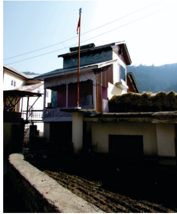
भायी करतार सिंघ सिंघ दा गुरुदुआरा भदरवाह

गूजरी महला 1 ॥ ऐ जी ना हम उतम नीच न मधिम हरि सरणागति हरि के लोग ॥ नाम रते केवल बैरागी सोग बिजोग बिसरजित रोग ॥ 1 ॥ भायी रे गुर किरपा ते भगति ठाकुर