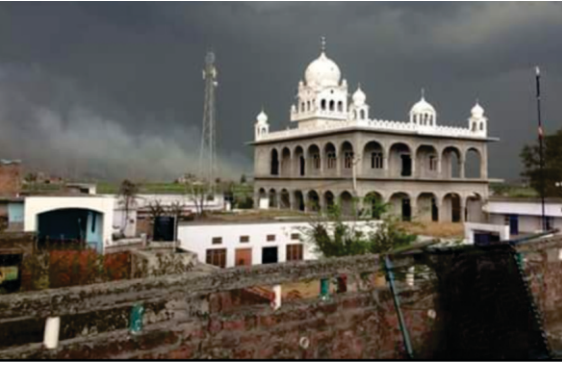
ਸਾਹਬ ਦੀ ਕੀੜੀ ਅਫਗਾਨਾਂ ਵਿਖੇ ਆਮਦ ਦੀ ਯਾਦਗਾਰ

ਖਰ ਵਾਕਰ ਲੈਟੇਗੀ ਮੇਰੀ ਬਲਾਯ। ਦੁਆਰਾ ਦੇਖ ਧੂੰੀ ਨ ਪਾਉਂ। ਸੰਘਾ ਦੇਖ ਸਿੰਡੀ ਨ ਬਜਾਉ। ਗ੍ਰੇਹ ਗ੍ਰੇਹ ਕੂਕਰ ਨ੍ਯਾਧੀ ਮਾਂਗਤ ਨਾ ਜਾਉ। ਖੇਖ ਕਾ ਜੋਗੀ ਕਦੇ ਨ ਕਹਾਉ।