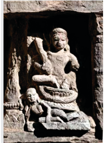
चरपट नाथ ही चम्बे दा देवता है। मुरती ध्यान नाल वेखो किवे जोगी दे पैरां थल्ले सुन्दरी दी मूरती है। दर असल मुगल हमलावरां दे आउन तों पहलां काम वाशना मन्दर दे गरभ ग्रेह तक पहुंच चुक्की सी।शायद इहो कारन होवे जेहड़ा गुरू साहब ने काम बाबत गुरसिख नूं बहुत सुचेत कीता है।

चम्बे तों गुरू साहब ने हेठां मैदान वल नूं चले अते 115 कि.मी. दा सफर करके प्रसिद्ध सिद्ध जोगी चरपट नाथ दे टिकाने चरपट वनी पहुंचे। चरपट वनी अज्ज दे पिंड कटारू चक्क विच्च पैदी है। इह झाखोलाडी तों 3 कि.मी पूरब, पठानकोट तों 12 कि.मी थल्ले, दीना नगर तों 15 कि.मी उत्तर-पूरब, नहर दे कंढे ते बगीची है।(नकशा सूचक :32.204429,75.572928) अज्ज इथे छोटा जेहा जंगल (बगीची) शिव मन्दर, धूनी ते तिन्न पानी दे चशमे हन। शरधालुआ दा कहना है कि चशमे सिद्ध जोगी चरपट नाथ ने चालू कीते सन। बगीची विच्च सप्प वी पाए जांदे हन।