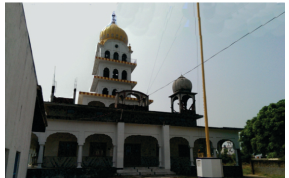
ਛਪੜੀ ਜੋ ਅੱਜ ਸਰੋਵਰ ਬਣ ਚੁਕੀ ਹੈ ਦੇ ਕੰਢੇ ਗੁਰਦੁਆਰਾ ਨਾਨਕਸਰ ਸਠਯਾਲਾ।

ਬੁੱਢਾ ਖੇਹ ਤੋਂ 7 ਕਿ.ਮੀ ਦੱਖਣ ਗੁਰੂ ਸਾਹਬ ਪਿੰਡ ਸਠਯਾਲਾ ਪਹੁੰਚੇ। ਸਠਯਾਲਾ ਬਾਬਾ ਬਕਾਲਾ ਤੋਂ ਪਹਾੜ ਪਾਸੇ ਸਾਢੇ ਚਾਰ ਕਿ.ਮੀ ਹੈ ਅਤੇ ਬਟਾਲਾ ਸੜਕ ਤੋਂ ਇੱਕ ਕਿ. ਮੀ. ਚੜ੍ਹਦੇ ਪਾਸੇ ਹੈ। ਜਿੰਨੀ ਦਿਨੀ ਗੁਰੂ ਸਾਹਬ ਇਥੇ ਆਏ ਓਦੋਂ ਇਸ ਪਿੰਡ ਦਾ ਨਾਂ ਮੁਗਲਾਨੀ ਹੋਇਆ ਸੀ ਅਤੇ ਬਹੁਤੀ ਮੁਸਲਮਾਨ ਅਬਾਦੀ ਹੀ ਸੀ। ਇੱਕ ਮੁਸਲਮਾਨ ਪੀਰ ਦੀ ਪਿੰਡ ਵਿੱਚ ਬੜੀ ਮਾਨਤਾ ਸੀ। ਗੁਰੂ ਸਾਹਬ ਪਿੰਡੋਂ ਬਾਹਰ ਵਾਰ ਹੀ ਬਹ ਗਏ ਤੇ ਕੀਰਤਨ ਸ਼ੁਰੂ ਕਰ ਦਿੱਤਾ। ਮਰਦਾਨਾ ਰਬਾਬੀ ਨਾਲ ਸੀ। ਗੁਰੂ ਸਾਹਬ ਦੀ ਆਮਦ ਦੀ ਖ਼ਬਰ ਪਿੰਡ ਵਾਸਿਆਂ ਨੂੰ ਲੱਗੀ। ਇੱਕ ਮਾਂ ਜਿਸ ਦਾ ਬੱਚਾ ਸੌਂਦੇ ਦਾ ਮਰੀਜ਼ ਸੀ ਉਹ ਥਾਂ ਥਾਂ ਇਲਾਜ ਕਰਾ ਕੇ ਹਾਰ ਚੁਕੀ ਮਹਸੂਸ ਕਰ ਰਹੀ ਸੀ।