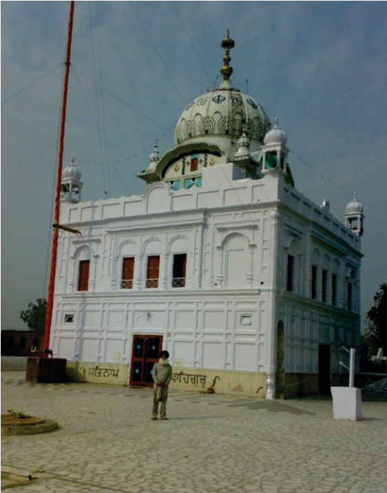
ਕੋਠਾ ਸਾਹਬ ਉਦੋਕੇ

ਈਸਰੀ ਸਵੇਰੇ ਸਵਾਦੀ ਭੋਜਨ ਠਰ ਕਰਕੇ ਸਹੁਰੇ ਨੂੰ ਗਠੁ ਤੇ ਪਾ, ਗੁਰੂ ਸਾਹਬ ਦੇ ਡੇਰੇ ਤੇ ਪਹੁੰਚਦੀ ਹੈ। ਮਰਦਾਨਾ ਗੁਰੂ ਸਾਹਬ ਨੂੰ ਬੇਨਤੀ ਕਰਦਾ ਹੈ ਕਿ ਬਾਬਾ ਜੀ ਈਸਰੀ ਆਈ ਹੈ। ਈਸਰੀ ਨੇ ਜਿਵੇ ਗੁਰੂ ਸਾਹਬ ਦੇ ਠਰਨ ਕੂਹੇ ਬਾਬਾ ਜੀ ਨੇ ਈਸਰੀ ਦੇ ਸਿਰ ਹਠ ਰਕਠਿਆ। ਈਸਰੀ ਦਾ ਠਰ ਵਾਲਾ ਬ੍ਰਿਜ ਤੇ ਦੇਵਰ ਚੌਧਰੀ ਨੂੰ ਵੀ ਗੁਰੂ ਸਾਹਬ ਦੇ ਠਰਨਾਂ ਤੇ ਲਿਜਾਏ ਨੇ।