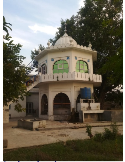
ਸਿਲ-ਲੇਖਾਂ ਵਾਲੇ ਖ਼ੂਹ ਤੇ ਗੁਰੂ ਗ੍ਰੰਥ ਸਾਹਬ ਦਾ ਪ੍ਰਕਾਸ਼ ਕਰ ਦਿੱਤਾ ਗਿਆ ਹੈ।

ਭੰਡਾਰੀ ਭਰ ਜਾਣਗੇ, ਬੇਰੀ ਫਲ ਜਾਣਗੇ, ਚੋਨੇ ਚੁੱਪੇ ਜਾਣਗੇ ਤੇ ਟੇਰੀ ਟੁਰ ਜਾਣਗੇ। ਉਹ ਵਾਕ ਅੱਛ 100% ਸੱਚ ਸਾਬਤ ਹੋਇਆ ਹੈ। ਟੇਰੀਆਂ ਦਾ ਨਾਮੋ ਨਿਸ਼ਾਨ ਖ਼ਤਮ ਹੋ ਚੁੱਕਾ ਹੈ। ਚੋਨੇ ਬਹੁਤ ਹੀ ਘਟੁ ਬੱਚੇ ਹਨ। ਬੇਰੀ ਤੇ ਭੰਡਾਰੀ ਵਾਧੂ ਗਿਣਤੀ ਵਿੱਚ ਹਨ।