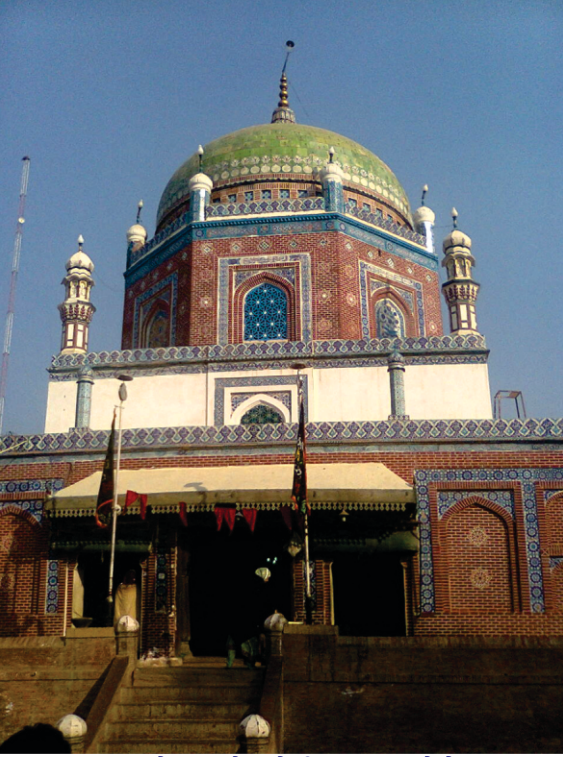
मकबरा शमस तबरेज इस दे लागे ही गुरू साहब ने डेरा जमायआ सी। सिक्ख राज वेले इस दे बरांडे विच ही थड़ा साहब ते गुरू ग्रंथ साहब दा प्रकाश हुन्दा सी। अंगरेजां ने 1850ई.विच इथो हुकम करके गुरू ग्रंथ साहब चुक्कवा दिता सी। (कैसर-114)

पानी छकाउन तों बाद मुलतान दे चोटी दे पीरां दी मजलस होई। उथे गुरू साहब नाल गोशटी शुरू होई। क्युकि गुरू साहब इक्क निरंकार अकाल पुरख दा प्रचार दुनिया भर विच्च कर रहे सन ते उह उमीद करदे सन कि मुलतान जेहे शहर दे मुसलमान मजहबी लोक उनां दा सतिकार करनगे। पर होया उलटा सी। इक्क तरां नाल ईरखा जितायी सी।