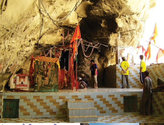
हंगलाज देवी मन्दर दी गुफा दा मूंह। हेठां उह घाटी जिस विच गुफा मौजूद है।