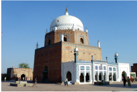
बहाउदीन जकरिया दी मज़ार, मुलतान

मारू काफी महला 1 घरु 2 ॥ आवउ वंजउ डुंमनी किती मित्र करेउ ॥ सा धन ढोयी न लहै वाढी क्यु धीरेउ ॥1॥ मैडा मनु रता आपनडे पिर नालि ॥ हउ घोलि घुमायी खत्रीए कीती हिक भोरी नदरि नेहालि ॥1॥ रहाउ ॥ पेईअडै डोहागनी साहुरडै क्यु जाउ ॥ मै गलि अउगन मुठड़ी बिनु पिर झूरि मराउ ॥2॥ पेईअडै पिरु संमला साहुरडै घरि वासु ॥ सुखि सवंधि सोहागनी पिरु पायआ गुणतासु ॥3॥ लेफु नेहाली पट की कापडु अंगि बणाय ॥ पिरु मुती डोहागनी तिन डुखी रैनि वेहाय