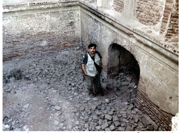
मुलतान दे सूरज मन्दर दी नीह। इहां दे नाप वल गौर कीता जावे। हेंठां साफ तौर ते उह वड्डी इट्ट (12ण9ण3") नजर आ रही है जो 1500-2000 साल पहलां जां कुशन काल विच वरती जांदी सी।

जदों गुरू साहब मुलतान पहुंचे तद तक्क आप जी दी प्रसिधी पूरे भारती महां दीप विच्च फैल चुक्की सी।