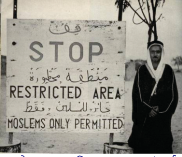
।रुको। 'दाखला सिरफ मुसलमानां लई।'। अज्ज वी मक्के शहर दे बाहर लग्गा बोरड।