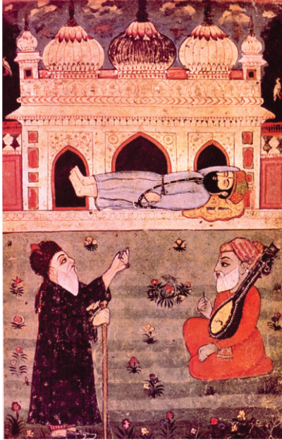
जदों काबा गुरू साहब दे चरनां वल घुंम गया। बी.40 तसवीर