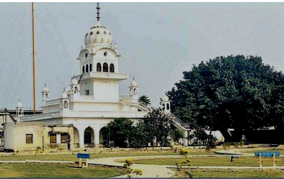
गुरदुआरा नानक पड़ायो फतेहाबाद

वैरोवाल तों चल्ल गुरू साहब जदों खडूर दे लागे आए तां मरदाने दी भुक्ख दा मसला खड़ा हो गया। गुरू साहब ने पिंडों बाहर कीरतन अरंभ दिता। लोकायी इकट्टी होई। मरदाने तों लोकायी नूं पता लग्गा कि इह गुरू नानक जो मोदीखाना त्याग दुन्यावी दे उधार लई निकले ने। गुरू साहब दे उपदेश ते इलाका अश्श अश्श कर उठ्या। जिवे उनीं दिनी रिवाज हुन्दा सी हर