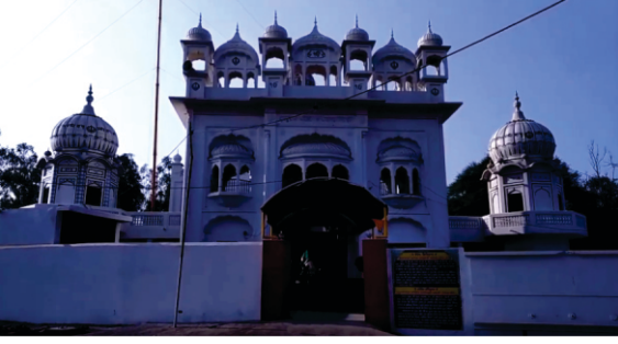
गुरदुआरल सलहल पहली पलतशलही सलदुध वट्टी कुलशेतुर

अथलह सी क्युकल मसलल सूरज दी अजलदी दल सी। “जे कलते सूरज अजलद नलं हो पलपलतल तलं दुनलतल खतम हो जलवेगी। सो हुंम हुंमल के पहुंचो।”