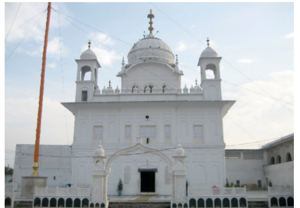
तप्याना साहब- खडूर विखे जित्थे गुरू साहब आ डेरा लायआ सी।

बिलावलु महला 1 ॥ मन का कहआ मनसा करै ॥ इहु मनु पुत्रु पापु उचरै ॥ मायआ मदि माते त्रिपति न आवै ॥ त्रिपति मुकति मनि साचा भावै ॥1॥ तनु धनु कलतु सभु देखु अभिमाना ॥ बिनु नावै किछु संगि न जाना ॥1॥ रहाउ ॥ कीचह रस भोग खुसिया मन केरी ॥ धनु