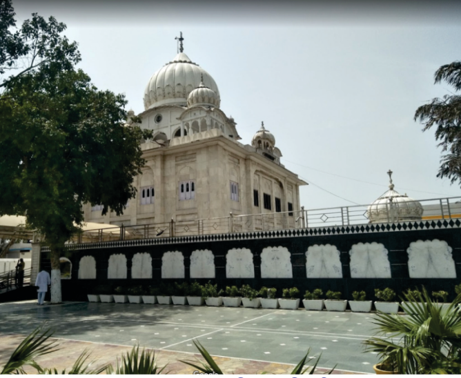
गुरदुआरु मजनू कुर टिल्लु, दिल्ली

जीवलन वललु तलु आडु खुदु हलु। डर 'दुआ' इ फकीरलु। रहम अल्लु।' बनुदु तलु सिरफ अरदुस कर सकदु हलु मन्ननु नलु मन्ननु रब्ब दी खुशी हलु। कलुजी कहनुदु चल फिर हुन दुआ करके इह हलुथी दुबलरु मलर दे। गुरु सलहब ने केहलु नही हजूर असी ऐहो जेहे करम नही करदे। असी तलु सरबत दलु भलु मंगदे हलु।