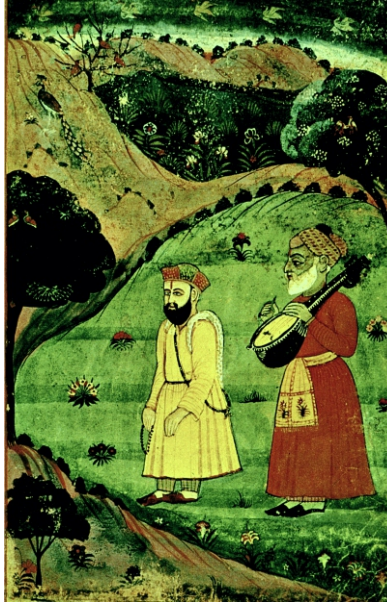
जदों पहली उदासी मौके सुलतानपुर तों निकले (बी:40 तसवीर)

तीसरे दिन फिर साहब गोइन्दवाल तों रवाने होए ते किसे चलदे काफले नाल जरनैली सड़क ते मौजूद कसबा फतेहाबाद आ ठहरे। ओथे पठाणां दी फौज दी वी वड्डी छाउनी सी। शहर तरक्की वल पुलांग पुट्ट रेहा सी। याद रहे छेती ही फतेहाबाद विच्च वड्डा सरोवर ते मसीत खुद बादशाह शेर शाह सूरी बणवाउंदा है। झट्ट शहर विच्च गल्ल धुम गई कि नवाब दौलत खां दा मोदी जो साध बण गया है शहर विच्च आया है। लोक नानक