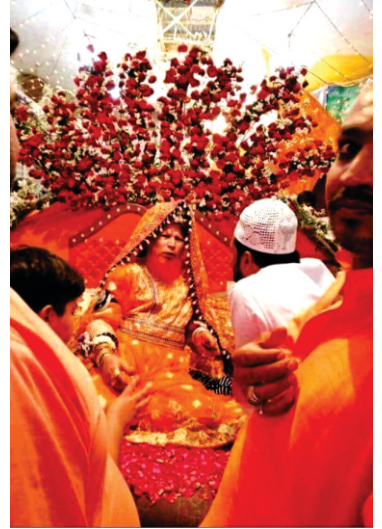
(ਖਛੇ) ਭੀ:40 ਪੇਂਟਿੰਗ ਜਨਾਨੀ ਬਠਾਯਾ ਪੀਰ ਟਟੀਰੀ। ਪੀਰਾਂ ਫਕੀਰਾਂ ਦਾ ਜਨਾਨੀ ਬਨਨ ਦਾ ਪਾਖੰਡ ਅੱਜ ਵੀ ਬਾਦਸ਼ਾਹੀ ਜਾਰੀ ਹੈ। ਆਹ ਵੇਖੋ ਪਾਕਿਸਤਾਨ ਦੇ ਇਕ ਪੀਰ ਦਾ ਹਾਲ।

ਬਾਗ ਤੋਂ ਇਲਾਵਾ ਗੁਰੂ ਸਾਹਬ ਸ਼ਹਰ ਵਿਚ ਸਰਾਫਾ ਬਜ਼ਾਰ ਵਿਚ ਜਿਥੇ ਬਿਰਾਜੇ ਸਨ ਓਥੇ ਉਹਨਾਂ ਦੀ ਫੇਰੀ ਦੀ ਯਾਦ ਵਿਚ ਮੰਜੀ ਸਾਹਬ (ਥੜਾ) ਉਸਾਰਿਆ ਗਯਾ। ਫਿਰ 1709/10 ਵਿਚ ਜਦੋਂ ਬੰਦਾ ਸਿੰਘ ਬਹਾਦਰ ਨੇ ਕਰਨਾਲ ਫਤਹ ਕੀਤਾ ਤਾਂ ਇਥੇ ਵੀ ਗੁਰਦੁਆਰਾ ਮੰਜੀ ਸਾਹਬ ਪਹਲੀ ਪਾਤਸ਼ਾਹੀ ਬਠਾਯਾ।