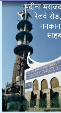
मदीना मसजद रेलवे रोड, ननकाना साहब

गुरुद्वारा मंजी साहब पातशाही पहली, हनुमान गली, मुहल्ला खतरियां, करनाल मन्दर ते मसीत