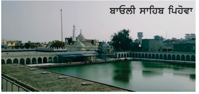
ਬਾਊਲੀ ਸਾਹਿਬ ਪਿਠੋਵਾ

ਖੈਰ ਗੁਰੂ ਸਾਹਬ ਇਥੇ ਕੁਝ ਦਿਨ ਟਿਕ ਗਏ। ਬ੍ਰਾਹਮਣਾਂ ਨੂੰ