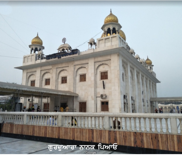
ਗੁਰਦੁਆਰਾ ਨਾਨਕ ਪਿਆਰੀ

ਦੇ ਲਾਗੇ ਲੰਗਰ ਲਾਉਣੀ ਸੀ। ਗੁਰੂ ਸਾਹਿਬ ਜਿਥੇ ਠਹੇਰੇ ਹੋਏ ਸਨ ਓਥੋਂ ਇਹ ਦਰਵਾਜ਼ਾ ਨੇੜੇ ਹੀ ਸੀ। (ਪੰਡਤ ਤਾਰਾ ਸਿੰਘ ਨਰੋਤਮ ਨੇ ਲਿਖਿਆ ਹੈ ਕਿ ਲਹੌਰੀ ਦਰਵਾਜ਼ੇ ਲਾਗੇ ਕੋਧੀ ਖੜਾ ਹੈ ਜਿਥੇ ਸਾਹਿਬ ਬਿਰਾਜੇ ਸਨ।) ਗੁਰੂ ਸਾਹਿਬ ਨੂੰ ਵੀ ਫਕੀਰਾਂ ਨੇ ਕੇਹਾ ਕਿ ਚਲੋ ਬਾਦਸ਼ਾਹ ਕੋਲੋ ਖੈਰਾਤ ਲੈ ਆਇਓ। ਉਸ ਵੇਲੇ ਗੁਰੂ ਸਾਹਿਬ ਨੇ ਬਾਦਸ਼ਾਹ ਦੀ ਇਸ ਨੀਤ ਦੀ ਰਜ਼ ਕੇ ਖੰਡਨਾ ਕੀਤੀ ਕਿ ਇਕ ਪਾਸੇ ਇਹ ਇਨਸਾਨੀਯਤ ਤੇ ਜੁਲਮ ਕਰਦਾ ਹੈ ਤੇ ਦੂਸਰੇ ਪਾਸੇ ਦਾਨੀ ਪੁੱਤੀ ਹੋਨ ਦਾ ਫੌਂਗ ਰਚਾਉਦਾ ਹੈ। ਬਾਬੇ ਨੇ ਕੇਹਾ ਕਿ ਅਜੇਹੇ ਪੁੱਤ ਕਰਨ ਦਾ ਕੋਧੀ ਫਾਯਦਾ ਨਹੀਂ ਜਿੰਨਾ ਚਿਰ ਬੰਦਾ ਆਪਨੇ ਪਾਪ ਤੋਂ ਚੋਰਾ ਨਾਂ ਕਰੇ। ਗੁਰੂ ਸਾਹਿਬ ਨੇ ਕੇਹਾ ਕਿ ਇਹੋ ਜੇਹੇ ਕੰਮ ਤਾਂ ਕੋਧੀ ਅਕਲੀ ਅੱਤਾ ਹੀ ਕਰੇਗਾ। ਸਾਹਿਬ ਨੇ ਓਥੇ ਫਿਰ ਸਬਦ ਬੋਲਿਆ: