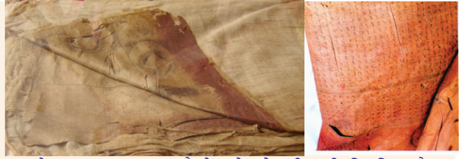
चोला साहब। अज्ज रंग उह है जो खब्बे पासे वाली तसवीर विच दिसदा है।

फिर 1570 ई विच ओसमानियां हकूमत दे हत्थों वोलगा दर्या दे सिरे ते सथित शहर असतराखान (यस तरखान) जांदा रेहा जिस करके पूरबी वपारियां लई यूरप दा सिद्धा ही राह खुल्ल गया। हौली हौली फिर