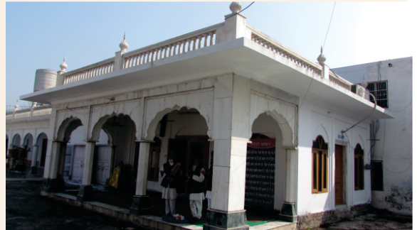
मुद्ध सगगस -कीरतन असथान गुरू अरजन देव जी।