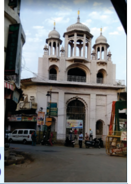
(بیٹھاں) گرو دوارہ گورو نانک باغ بنارس۔ (سجے آتے) گرو دوارہ صاحب دا دروازہ

بنارس اک طرحاں نال ہندومت دیاں مڑیاں ہن بہاؤ شمشان گھاٹ ہے۔ اتھے اج وی ہر ونگی دا دھارمک دھندھا چلدا ہے۔ شو جی دے اپاشک جوگی لوک تاڑی لائی بیٹھے رہندے، مورتی پوجا دے اپاشک زور شور نال ٹلّ و جا رہے ہندے، کوئی اتھے اگھوری سادھو بہاؤ تنتر و دیاں والے، اتھے تھانوں سنگیت سکھاؤن والے وی ملنگے، دھارمک و دیا دین والے وی پنڈت۔ گورو صاحب جدو اتھے گئے تاں جویں وکھ وکھ ونکیاں دے ڈیریاں دے ٹاؤٹ بندے نوں اگھیر دے ہن ایسے طرحاں گورو صاحب نوں وی اگھیریا سی۔ گورو صاحب نے ہر قسم دے بندے نال سنواناں رچایا اتناں دے سبندھت ڈیرے گئے تے جا کے ہر کسے دا ادھار کیتا تے برے کرم کرن توں ہٹا لوکاں نوں نام نال جوڑیاں۔