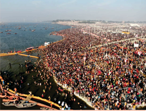
اللہ آباد دا کبھ میلہ دنیا دے وڈے میلیاں وچو اک۔ گورو نانک واسطے ایہہ سنہری موقع سی پرچار کرن لئی

پھر سائیکل یاتری - ۱۶ انوسار کانپور دے علاقہ سرسٹیا گھاٹ وکھے اتھاسک گرو دوارہ ہے جتھے گورو نانک تے بعد وچ گورو تیغ بہادر صاحب دے چرن پئے۔ گرو دوارہ اداسیاں دے قبجے پیٹھ ہے۔ لکھاری نوں لگدا ہے کہ مہنت اتھاس چھپا رہا ہے کیونکہ اونی دنی اتھاسک تھاواں تے اکالی قبجے کر رہے سن۔