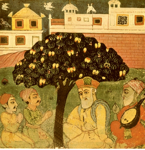
بی: ۴۰ تصویر۔ ٹھگ گورو صاحب اگے ہتھ بنی بیٹھے ہن۔