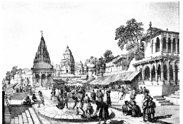
گورو صاحب دے ویلے بنارس کجھ ایہو جیہا سی۔ حالان ایہہ ہتھ-تصویر اوہناں دے اُون توں ۳۲۳ سال بعد دی ہے۔ جے ڈی بارڈنگ نے کھچی بنارس دی پتھرتے تصویر

سال گرام بپ پوج مناوہ سکرٹ تلسی مالا۔۔ رام نام جپ بیڑا باندھہ دتیا کرہ دیالا۔۔ ا کاپے کلرا سنجہ جنم گواوہ۔۔ کاجی ڈھک دوال کاپے گچ لاوہ۔۔ ا رہاؤ۔۔ کر ہرپٹ مال ٹنڈ پرووہ تس بھیتیر من جووہ۔۔ امرت سنجہ بھرہ کیارے تو مالی کے ہووہ۔۔ ۲ کام کرودھ دی کرہ بسولہ گوڈہ دھرتی بھائی۔۔ جیو