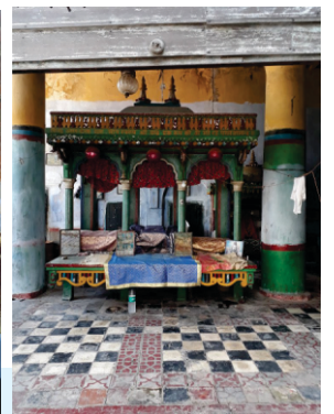
ਓਸ਼ਨੋਪ ਮਨਦਰ ਦੇ ਨਾਲ ਖੀ ਮੋਯੋਏ ਗੋਰੋਡਾਰੇ ਦੀਓ ਗੇਠਾ ਸਾਖ ਜੇਠੇ ਗੋਰੋ ਸਾਖ ਨੇ ਡੇਰੇ ਕੀਨਾ ਸੀ- ਐਹੇ ਆ ਕੇਲ ਖਨਦੇ ਏ ਕੀਨੋਕ- ਆਸ ਦੀ ਮਲਕੀਟ ਨੋਨੇ ਕੇ ਓਦਾਲ ਓਯ ਕੀਸ ਖਲ ਖਾ ਏ- ਯਾਦ ਰੇ ਖਾ ਸੇਰੀ ਖਨਦੇ ਡੇ ਓਦਾਸੀ ਆ ਓਪਸ ਖਨਦੋ ਡੇਰਮ ਓਲ ਪਰ ਟੇ-.