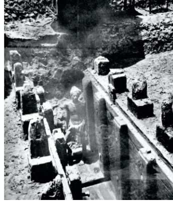
موریا کال دا لکڑی تے مٹی دا پاٹلیپتر قلعہ جس دے آثار خدائی دوران نکلدے ہن

گورو جی ایدھیا توں گھگھر دریا دے نال نال چلدے ہوئے آرا، بکسر، لالگنج دے دھارمک مکھیاں نوں ملدے ہوئے پٹنا پہنچے سن۔ صاحب دا مکھ نشانہ اس ویلے دا پوربی ہندو دھرم دا مرکز گیا سی۔ پیٹھ تے دو تڑ واری برباد ہون اپرنت پٹنا گورو صاحب دے