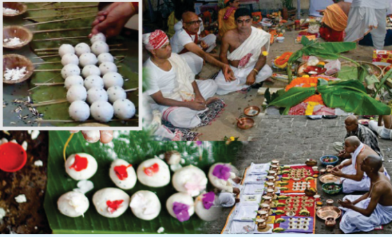
ਗਿਆ ਦਾ ਪੰਡ ਦਾਨ - ਬਾਬੇ ਨੇ ਕੀਆ ਤੇਹਾਡਿਆں ਐਹੇ ਗਰੋਲਿਆں ਭੜਗਾਨ ਟਕ ਨਹੀ ਪੇਂਚਦਿਆਂ- ਕੀਓ ਲੋਕਾਨੀ ਨੋ ਮੋਰ ਕੇ ਖਨਾਉਦੇ ਖੋ.

ਪੇਂਚੇ 16 ਆਂਚ ਲੇ ਆ ਪੀਰ ਦਾ ਨਸ਼ਾਨ ਏ- ਖਨਦਾਨ ਦਾ ਮਨਾ ਏ ਕੇ ਐਹੇ ਖੇਗਾਨ ਓਸ਼ਨੋਨ ਦਾ ਪੀਰ ਏ-