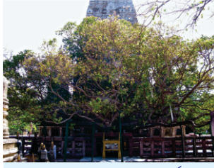
بودھ گیا دا مہاں بودھی بوڑ جہدے تھلے بیٹھ مہاتما بدھ نوں گیان دی پراپتی ہوئی سی۔

سريراگُ محلہ ۱ اکُ تلُ پيارا ويسرے روگُ وڈا من ماہ .. کيوُ درگہ پت پائے جا پر ن وسے من ماہ .. گر ملیئے سکھ پائے اگن مرے گن ماہ .. ۱ من رے ايہنيس پر گن سار .. جن کھنُ پل نامُ ن ويسرے تے جن ورلے سنسار .. ارباؤ .. جوتی جوت ملائے سرتی سرتی سنجوگُ .. ہنسا ہومے گت گئے ناہی سہسا سوگُ .. گرمکھ جس پر من وسے تسُ میلے گز سنجوگُ .. ۲ کایا کامن جے کری بھوگے بھوگنہار .. تسُ سيوُ نيہ ن کيجئی جو دیسے چلنہاڑ .. گرمکھ روہ سوباگنی سو پر بھہ سیج بھتاڑ .. ۳ چارے اگن نوار مڑ گرمکھ پر جل پائے .. انتر کملُ پر گاسیا امرت بھریا اگھائے .. نانک ستگورو میت کر سچ پاوہ درگہ جائ .. ۲۰ ۴