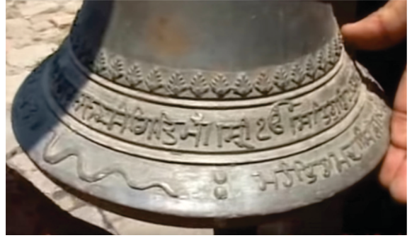
نانک مٹھ، مندر سوہیا بھاگوتی، کاٹھمنڈو دے لاگے موجود سدھ واٹکا تے لمکدا ۱۸۸۴ ای۔ داٹل جس نے گورمکھی دے اکھر ڈھلے ہوئے بن۔

بہاؤ جنکپر راجراج اتے برائنگر دا پہاڑ پاسہ گایا۔ جنکپر زیادہ پرانا شہر تاں نہیں ہے۔ ی راجے جنک دے مول شہر دا تاں کوئی عطا پتہ نہیں لگدا۔ انج وی ایہہ سبھ متھاس ہی گنیا جاندا ہے۔ یاد رہے ہندو متھاس دی سیٹا اتھے ہی راجا جنک نوں حل واہدیاں سیاڑ وچوں ملی سی۔ راجے نے اوہنوں اپنی دھی واگو پالیا اتے اوہدے جوان ہون تے شرط رکھ دتی سی کہ سیٹا دا ویاہ اوہدے نال ہووے گا جو سیٹا دا دھنکھ چک سکیکا۔ اودوں پھر ایڈھیا نگری دے راج کمار رام نے اوہ دھنکھ بان چکیا سی۔ متھلا دے راجیاں نوں جنک راجے کھیا جاندا سی۔ اج متھلا دا کجھ علاقہ نیپال وچ تے باقی بہار اتے یو پی وچ پیندا ہے۔ حالان پورنیا اتے سیٹامڑی پرانے شہر نے جنکپر سحر دی نیہہ ۲۰۰ سال پہلاں ہی رکھی گئی سی کیونکہ اتھوں سونے دی زنانہ