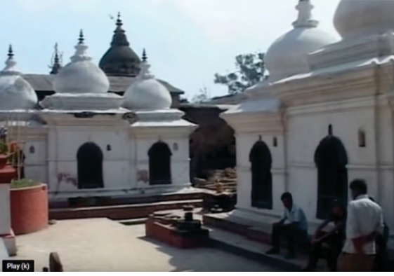
اداسين اکھاڑا، پشوپتي ناتھ مندر دے پچھے

گورو کھے سکھاں دے سن۔ اتھوں دے مٹھاں وچ گورو گرنّھ صاحب دیاں کئی بیڑاں موجود سن۔ اک اجیہی بیڑی وی پیگی سی۔ بہاؤ دسم پاتشاہ دے آگمن توں پہلاں دی سی۔ اتھے اک بہت پی خوبصورت ہتھ لکھت بیڑی سی جس وچ بانی دوآلے سنہری ویل بنی ہوئی سی۔ کوئی سمگلر اناں بھولے بھالے گورو کھے مہنتاں کولو اوہ چلاکی نال چکّ لے گیا ہے۔