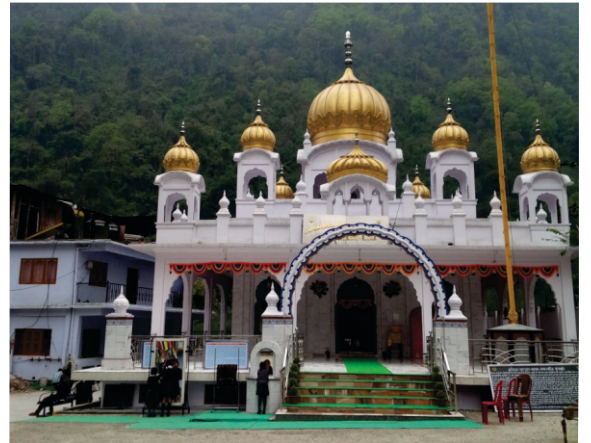
چنگتھانگ - آج کارسیوا والیاں نے ہور وی شاندار گرو دوارہ بنا کے بودھیاں نوں ہور وی چڑا دتا ہے۔

https://www.sikhphilosophy.net/threads/guru-nanak-in-sikkim.50894/