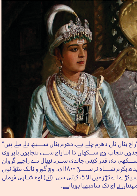
”راج بنان ناں دھرم چلے ہے۔ دھرم بنان سبھ دلے ملے ہیں“ جدوں پنجاب وچ سکھان دا اپناراج سئی پنجابوں باہر وی سکھی دی قدر کیتی جاندی سئی۔ نیپال دے راجے گروان پدھ بکرم شاہ نے سن ۱۸۰۰ء وچ گورو نانک مٹھ نوں سیڑھے اے کڑ زمین الاٹ کیتی سئی۔ (اے) اوہ شاہی فرمان مہنتانے اج تک سامبھیا ہویا ہے۔

مٹھاں نال زمیناں جائداداں لگیاں سن، کجھ اک مہنت تاں ضرور سکھی نال جڑے رہے۔ اج وی کاٹھ منڈو وچ پنج سکھ اتھاسک دھرم سالنے جتاں نوں مٹھ ہی سدیا جاندا ہے کیونکہ جوگی لوکاں دی دھرم سال مٹھ جاں آسن ہی کھاؤدی ہے۔