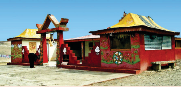
کسے ویلے گرو دوارہ گورو ڈانگمار صاحب۔ پھر اسنوں سرب دھرم استھان بنایا تے اج نرول بودھی مٹھ بن چکا ہے۔ گورو گرتھ صاحب نوں اگلیاں کڈھ کے چنگتھانک وکھے سڑک تے رکھ دتا سی۔

پچھلے ۸۰ وے دہاکے وچ جدوں سکھ فوجی جوان اتھے تعینات سن تاں مقامی لامیاں نے اوہناں نوں دسیا کہ جھیل دے اس پاسے دا ناں جمنا گورو نانک دے ور کر کے ہے۔ اوہناں دا مننا ہے کہ گورو صاحب اس علاقے وچ جدوں آئے تاں ستھانک لوکاں نے صاحب اگے بیٹتی کیتی کہ پین والے پانی دی وڈی قلت ہے۔ جھیل تان بہتا سماں جمی ہی رہندی ہے۔ کیہا جاندی ہے ادوں پھر گورو صاحب برف تے اپنے ہتھ وچ لٹی جتھوں ڈانگ ماری تان اوتھے پانی ہی پانی سی۔ کیہا جاندی ہے کہ ادوں توں لے کے پھر جھیل دا ایہہ حصہ کدی نہیں جمیا۔