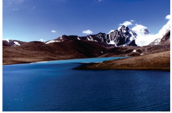
گورو ڈانگمار جھیل، سکم جس دا اک نفر دا پانی کدی نہیں جمدا۔

جدوں سکھ فوجیاں ایہہ گل سنی تان اتھے اک استھائی ڈھانچہ بنا، نشان صاحب گڈ دتا۔ ۱۹۹۰ دے دہاکے وچ پھر فوجیاں اتھے گرو دوارہ صاحب