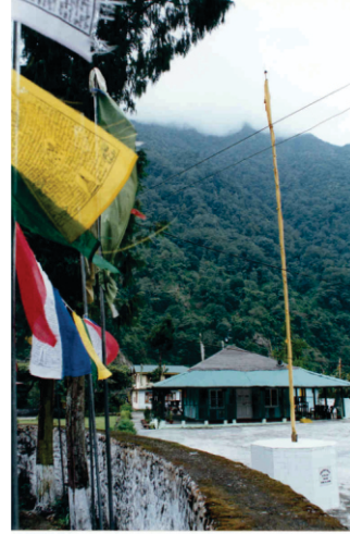
نگتھانگ - پھلاں فوجیاں نے ایہہ گرو دوارہ بنایا۔

کر دتا۔ اتھوں دے پہاڑی لوکاں نوں وی فصل بیجن دا چچ نہیں سی تے صرف جنگلی پھلاں آتے شکار تے ہی نربھر سن۔ ایہناں نوں کھیتی دا ول سکھایا۔ دھان بیجنا آتے کیلے دی کاشت کرنی سکھائی۔ اتھے اک اوہ درخت وی ہے جھدیاں ٹہنیاں ٹیڈھیاں میڈھیاں بندیاں ہن۔ ستھانک لوکاں دا کہنا ہے کہ ایہہ رکھ گورو صاحب دی کھونڈی دی یاد دواؤدا ہے۔