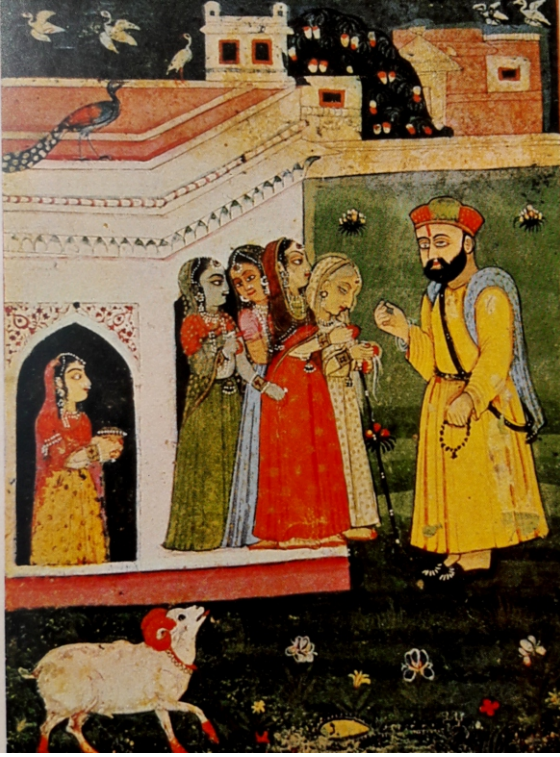
بابا، نور صاحب اے بور جادوگر نیاں اے بیٹھاں بھیدو بنیا بھانی مردانہ۔ (بی: ۴۰ تصویر)

اوہی مستانی تریاں نال بابے دا وی میل ہو گیا۔ مردانے بارے پچھیا۔ انان کھیا کہ اس میں تان نہی