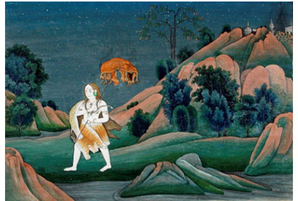
پاربتی دی لاش چکی شو جی جا رہے ہے۔ اکھے انگ ڈگ رہے جا رہے ہے۔

سلوگ م ۱ سوئے کے پربت گفا کری کے پانی پپال .. کے وچ دھرتی کے آکاسی اردھ رہا سر بہار .. پڑ کر کایا کپڑ پھرہ دھووا سدا کار .. بگارتا پیٹلا کالا بیدا کری پکار .. ہوئی کچیل رہا مل دھاری درمت مت وکار .. نہ بونہ سے نہ ہو ہوا نانک سبد وپچار .. ام ۱ وستر پکھال پکھالے کایا آپے سنجم ہووے .. انتر میل لگی نہی جانے باہرہ مل مل دھووے .. اندھا بھول پیا جم جالے .. وست پرائی اپنی کر جانے ہوئے وچ دکھ گھالے .. نانک گمرکھ ہوئے تے تاہر پر نام دھیاوے .. نام جیے نامو آرادھے نامے سکھ سماوے .. ۲ پوڑی .. کایا ہنیں سنجوگ میل ملایا .. تن ہی کیا وجوگ جن اپایا .. مورکھ بھوگے بھوگے دکھ سبایا .. سکھ اٹھے روگ پاپ کمایا .. برکھ سوگ وجوگ اپائی کھپایا .. مورکھ گنت گنائی جھگڑا پایا .. ستگور ہتھ نیبڑ جھگڑ