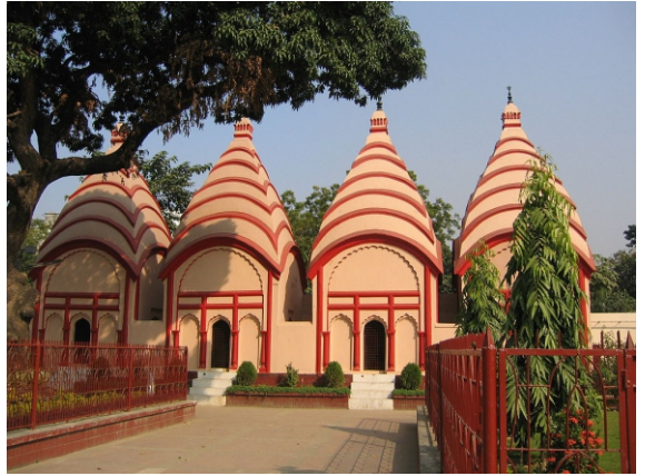
ڈھاکیشوری مندر، ڈھاکا

گُوڑی گواریری محلہ ۱ من کُنچڑ کایا ادیانے .. گُر انکس سچ سبڈ نیسانے .. راج دوارے سوبھ سو مانے .. اچترائی نہ چینیا جائ .. بن مارے کیو قیمت پائی .. ارباؤ .. گھر مہ امرت تسکڑ لینی .. نناکاژن کوئی کریئی .. راکھے آپ وڈیائی دیئی .. ۲ نیل انیل اگن اک ٹھائی .. جلی نوری گر بوجھ بجھائی .. من دے لیا رہیس گن گائی .. ۳ جیسا گھر باہر سو تیسا .. بیس گفا مہ آکھو کیسا .. ساگر ڈوگر نربھو ایسا .. ۴ موئے کوئے مارے کوئے .. نڈرے کوئے کیسا ڈر کوئے .. سبڈ پچھانے تینے بھون .. ۵ جن کہیا تین کہن وکھانیا