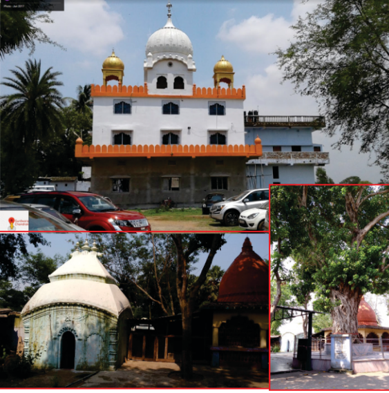
چندرکونا دا اتھاسک استھان۔ ایہہ اداسی سادھواں دی بدولت بچیا رہا ہے۔ بیٹھاں اداسی سادھواں دیا سمدھان اتے بیل دا پرانارکھ جس تھلے گورو صاحب براجے سن۔

سی۔ جدوں کجھ دن اتھے رہے تاں اک دن شہر دی رانی چپّ چپیتی اپنی وشواش پاتر گولی نال گورو صاحب دے چرناں وچ آکے گڑگڑائی کہ بابا جی میری عجت رکھ لو۔ رانی نے کہانی دسی کہ: