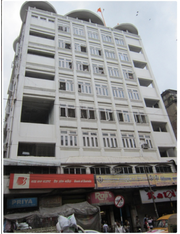
جتھے گورو صاحب نے بہڈ سنگھ راجے دا روگ دور کیتا: گردوارہ بڑا سنگت، کلکتہ

بسنت محلہ ۱ چنچل چیتن پاوے پارا۔۔ آوت جات ن لاگے بارا۔۔ دوکھ گھنو مریئے کرتارا۔۔ بن پریتم کو کرے ن سارا۔۔ اسبھ اوتھ قصو آکھو بینا۔۔ ہر بھگتی سچ نام پتینا۔۔ ا رہاؤ۔۔ اوکھدھ کر تھاکی بہتیرے۔۔ کیو دکھ چوکے بن گر میرے۔۔ بن ہر بھگتی دوکھ گھنیرے۔۔ دکھ سکھ دیتے تھاکر میرے۔۔ ۲ روگ وڈو کیو باندھو دھیرا۔۔ روگ بجھے سو کائے پیرا۔۔ ۳ اوگن من ماہ سریرا۔۔ ڈھوڈھت کھوجت گر میلے بیرا۔۔ ۳ گر کا سبڈ دارو ہر ناؤ۔۔ جیو تورا کھہ تھے رہاؤ۔۔ جگ روگی کہ دیکھ دکھاؤ۔۔ ہر نرمائل نرمل ناؤ۔۔ ۴ گھر مہ گھڑ جو دیکھ دکھاوے۔۔ گر محلی سو محل بلاوے۔۔ من مہ منو آت مہ چیتا۔۔ ایسے ہر کے لوگ اتیتا۔۔ ۵ ہرکھ سوگ تے رہے نراسا۔۔ امرت چاکھ ہر نام نواسا۔۔ آپ پچھان رہے لو لاگا۔۔ جنم جیت گرمت دکھ بھاگا۔۔ ۶ گر دیا سچ امرت پیوؤ۔۔ سہج مرؤ جیوت ہی جیوؤ۔۔ اپنو کر راکھہ گر بھاوے۔۔ تھرو ہوئی سو تجھ سماوے۔۔ ۷