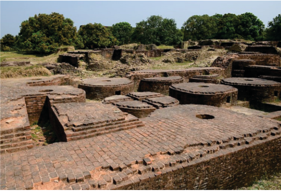
کئی کلومیٹراں 'چ پھیلے گوڑ دے کھنڈر کہانی دس رہے کہ اس ناسوان سنسار وچ کجھ وی سٹھانی نہی۔

پورب وچ اداسی روٹ - پٹنا < منگیر < بھاگلپور < کنت نگر < راج محل < مالدا < گوڑ .. پھر ایسے روٹ تے پٹنا واپسی .. پٹنا < لالکنج (ویشالی) < بیرگنج < کاٹھ منڈو (شوراتری ۱۵۱۰ ای) < جنکپور علاقہ < براہکھپتر < سکم دے مٹھ < بھوٹان < دہری < جوگیگھا < گھاٹی < گڑھ دول < برہمکنڈ .. واپسی .. برہمکنڈ < شوساگر < دیماپر < سلہٹ < ڈھاکا < دیویپر < چٹاگانگ (۱۵۱۱ ای) < مراک و (ماگھ دیس اج برما وچ) < ان و (مانڈلے-برمالے) واپسی .. جگن ناتھ پوری براستا کلکتہ (۱۵۱۲ ای)