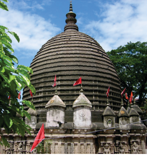
گہائی دا کامکھیا مندر۔ ۵۲ شکتی پیٹھاں وچوں ایہہ پرمکھ ہے۔ ایہدا دھاریدار سکھر وی الوکک ہے پر آسام دی عمارت ساجی وچ ایہہ عام ہے۔

دیوی دیاں بھیناں پیدیاں ہن تے اک دھار خود دیوی دا کٹیا ہویا سر پیندا ہے۔ کہانی وچ حالات کاماک دسے گئے ہن جہناں دا ورنن کرناں اتھے سوبھا نہی دندا۔