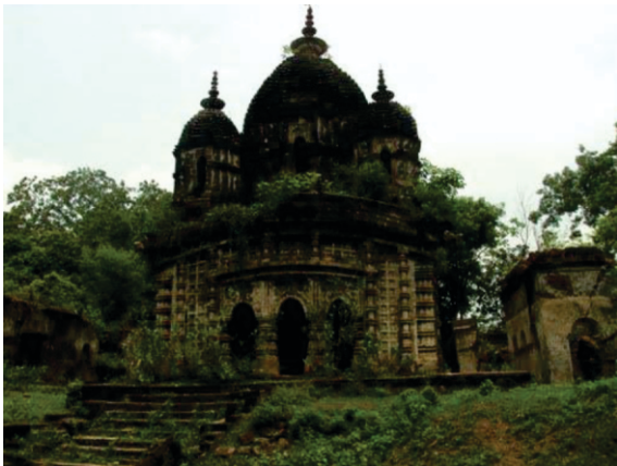
گورو صاحب دی چرن چھوہ پراپت کر کے راجا چندرکیتو تاں امر ہو گیا ہے۔ چھوٹے جے راجے نے ہور وی دھارمک استھان بناوئے۔ اوسے دا بناوایا ایہہ مالیشور مندر آج وی چندرکونا وکھے موجود ہے۔

پر جدوں جنم ہویا تاں میرے گھر پتر نہی، دھی آئی۔ راجا کتے دور نیڑے مہمتے گیا ہویا سی۔ اس براہمن نوں جوہیں پتہ لگا تاں اوہ میرے تک آیا اتے کہن لگا کہ "توں راجا نوں جھوٹھ بول دے کہ منڈا ہویا ہے۔ براہمن نے مینوں ڈر پا دتا کہ جے راجا نوں پتہ لگا کہ