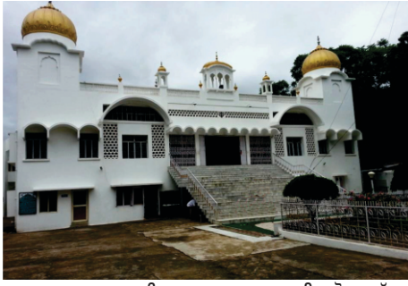
ਗੁਰਦੁਆਰਾ ਦਾਤਨ ਸਾਹਿਬ ਜਾ ਗੁਰਦੁਆਰਾ ਕਾਲੀਆਬੋਧਾ, ਕੱਟਕ