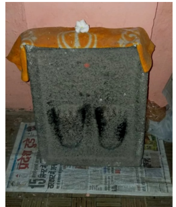
سوہاگپر وچ چرن پادکا

پہلے بہرے رین کے ونجاریا مترا حکم پیا گربھاس .. اردھ تپ انتر کرے ونجاریا مترا خصم سیٹی ارداس .. خصم سیٹی ارداس وکھانے اردھ دھیان لو لاگا .. نہ مرچاڈ آیا کلی بھیتر باہڑ جاسی ناغہ .. جیسی قلم وڑی ہے مستک تیسی جیڑے پاس .. کہ نانک پرانی پہلے بہرے حکم پیا گربھاس .. ا دوجے بہرے رین کے ونجاریا مترا وسر گیا دھیان .. ہتھو ہتھ نچائیئی ونجاریا مترا جیو جسدا گھر کان .. ہتھو ہتھ نچائیئی پرانی مات کہے سبت میرا .. چیت اچیت موڑ من میرے انت نہی کچھ تیرا .. جن رچ چیا تسہہ ن جانے من بھیتر دھر گیاں .. کہ نانک پرانی دوجے بہرے وسر گیا دھیان .. آ تیجے بہرے رین کے ونجاریا مترا دھن جوہن سیو چت .. پر کا نام ن چیتھی ونجاریا مترا بدھا چھتہ جت .. پر کا نام ن چیتے پرانی بکل بھیا سنگ مایہ .. دھن سیوڑتا جوہن متا ایہلا جنم گواہ .. دھرم سیٹی واپاڑن کیتو کرمن کیتو مت .. کہ نانک تیجے بہرے پرانی دھن جوہن سیو چت .. ۳ چوتھے بہرے رین کے ونجاریا مترا لاوی آیا کھیٹ .. جاجم پکڑ چلایا ونجاریا مترا کسے ن ملیا بھیٹ .. بھیٹ چیت پر کسے ن ملیو جا جم پکڑ چلایا .. جھوٹھا ردن ہوا دوالے کھن مہہ بھیا پرایا .. سائی وست پراپت ہوئی جس سیو لایا ہیٹ .. کہ نانک پرانی چوتھے بہرے لاوی لنیا کھیٹ .. ۴