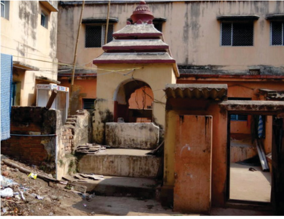
ہاؤلی صاحب، پوری۔ شہر نواسیاں دی بینتی تے گورو صاحب نے اوہ جگا پرگٹ کیتی جتھے زمین وچ مٹھا جل موجود سی۔

توں وی آتے ہے۔ بن جگن ناتھ دی پریبھاشا کجھ اس طرحاں دی بن گئی: 〇