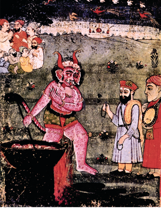
کوڈا راکھش - بی: ۴۰ جنم ساکھی تصویر

پہل فروٹ ملے۔ پر سفر توں من اکّ چکا سی۔ امرکنٹک گورو صاحب نال ناراض ہویا کہ "تہانوں جتھے سادھ سنت ملدے نے تسے اوتھے ہی ڈیرہ جما بہندے ہو۔ اس طرحاں تاں اسیں ساری عمر پنجاب نہی پہنچ پوانگے۔ میرا تاں اجے ویاہ دا چاء وی نہی لہیا۔ جے تسے نہی جانا تاں مینوں اکلے نوں جان دیو۔" گورو صاحب اوہدی ضد اگے منّ گئے۔