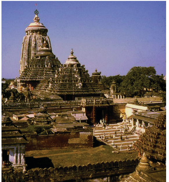
800 ਸਾਲ ਪਰਾਨਾ ਆਠੇ ਪੋਰੀ ਮੰਦਰ ਆਠੇ ਸਲਾਨੇ ਰੇਠੇ ਯਾ ਤਰਾ ਭੰਦੋਸਤਾਨ ਚੋਂ ਪਰਸਫੇ

ਫੇਹਲਾ ਸਰੀ ਮੇਲੇ ਆਰਤੀ ਸੰਗੋਰ ਪਰਸਾਠੇ.. ਗੰਗੇ ਆਠੇ ਰੋ ਆਂਦੇ ਦੀਕੇ ਭੈ ਤਾਰਕਾ ਮੰਡਲ ਆਠੇ ਮੋਰਤੀ