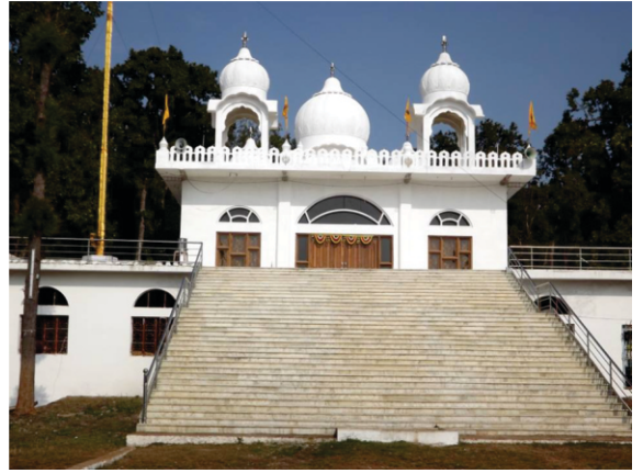
ਗੁਰੂ ਨਾਨਕ ਮਕਤਦਾਰ, ਅਮਰਕੰਠ

ਸਾਹਬ ਦੇ ਦੁਆਲੇ ਬਿਹਿੜਾ ਅਠ੍ਹਈ ਖੋ ਗਈ- ਪਚਾਰੀ ਗੁਰੂ ਸਾਹਬ ਨੂੰ ਮਨਦਰ ਬਾਰੇ ਜਾਨਕਾਰੀ ਦੇ ਰਿਖਾ ਸੀ- ਅਠ੍ਹਈ ਘੋਏ ਲੋਕ ਵੀ ਦਲਜਸੀਪੀ ਨਾਲ ਸਨ ਰੇ ਸਨ- ਪਚਾਰੀ ਨੇ ਸ਼ਨੀ ਦਿਓਤਾ ਦੀ ਕਹਾਣੀ ਸਨਾਈ ਕੇ ਅਕ ਸੂਰਜ ਨਾ ਦਾ ਰਾਜਾ ਸੀ ਜਹਦੇ ਅਠ ਪਤਰ ਸਨ- ਅਠਾਹਾ ਚੋਠ ਸ਼ਨੀ ਨਾ ਦਾ ਪਤਰ ਬਿਹਤ ਖੀ ਬਦਸ਼ਕਲ ਕਾਲਾ ਕਲੋਠਾ ਤੇ ਡਰਾਨਾ ਜਿਘਾ ਸੀ- ਜਦੋਂ ਰਾਜਾ ਮਰਿਆ ਤਾਂ ਸ਼ਨੀ ਦੀ ਮਾਂ ਵੀ ਨਾਲ ਖੀ ਸਤੀ ਘੋ ਗਈ- ਰਾਜੇ ਦਾ ਵਡਾ ਪਤਰ ਤਖ਼ਤ ਤੇ ਬਿਠਾ- ਬਦਸ਼ਕਲ ਚੇਨਚੇਰ ਦੀ ਕੋਠੀ ਪਚੇ ਗਠੇ ਨਹੀ ਸ— ਸੀ ਕਰਦਾ- ਬੇਰਜਾਨੀਆਂ ਬੀਚਾ ਕੇਚੀਆਂ ਬੇਹੋਜ ਚੇਨਚੇਰ ਦੇ ਸੇ ਸੇ ਦਿਆ ਕਰਦਿਆਂ ਸਨ- ਪਰਾਨੇ ਸ਼ਰਾਨੇ ਕੀੜੇ ਆਪਨੋਂ ਦੇ ਦਿਨੇ- ਕਾਲੇ ਰੰਗ ਤਾਂ ਦਾ ਪੇਲਾ ਖੀ ਸੀ ਅਤੇ ਅਸਨੇ ਤਿਲ ਦੀ ਮਾਲਸ਼ ਕਰ ਲਿਨੀ ਤੇ ਕੋਹਰੀ ਖੀ ਡੰਕ ਮਾਰਦਾ ਪੰਦਾ ਸੀ ਚੇਨਚੇਰ- ਜਦੋ ਅਸ ਵਿਕੇਖੀਆ ਕੇ ਪਰ ਕੋਠੀ ਅਨੋਂ ਗੇਰਨਾ ਦੀ ਨਗਾ ਨਾਲ ਤਕਦਾ ਬੇ ਤਾਂ ਕਸੇ ਮੇਹਾਨੇਰ ਕੇ ਦੇ ਅਪਿਸ਼ ਅਨੋਸਾਰ ਬਾਰੇ ਚੇਨਚੇਰ ਨੇ ਰੱਬ ਦੀ ਬੇਗੁਣੀ ਦਾਰਾ ਅਪਨਾਯਾ- ਚੇਨਚੇਰ ਮੇਹਾ ਬਨ ਗਿਆ-