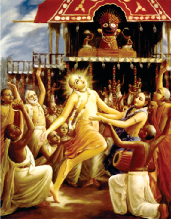
ਰੱਬ ਦੀ ਯਾਦ ਵਿੱਚ ਬਿਸ਼ਨ ਨਚਨ ਗਾਊਨ ਵਾਲਾ ਬੰਗਾਲੀ ਸੰਤ ਚਿੱਟਨੀਆ ਮਹਾਂ ਪ੍ਰਬੋਹ (1487-1534)

ਦਾ ਅੱਜਮ ਕਿੱਤਾ। ਆਪਣੇ ਆਕ ਸ਼ਿਯੋਕ ਆਦੇ-ਏਦਾ ਡੀ ਡਮੇ ਵਾਰੀ ਲਾਠੀ ਤੋਨ ਗੋਰੋ ਸਾਹਬ ਡੀ ਸ਼ਿਯੋ ਠੇਲ ਵੱਛ ਪਰ ਵਿਲੇ ਚਾਹਰ ਰਿਨਾ ਏ۔