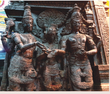
اس کہانی وچ پتا وشنوں، دھی مناکسی دا ہتھ شو نوں پھڑا رہے۔ - مدرائ دا مناکشی مندر۔ پھر کی ہویا جے بھگوان وشنو اتے شو دی شکل اتھے مدراسیاں ورگی بن گئی ہے تان؟

جے جگ کیتے جاہ جیو۔۔ جے جگ کیتے جاہ سوامی تین پھل توٹن اوع۔۔ تندران مرنا نرنک ن پرنا جسو پر نام دھیاوے۔۔ پر پر کرہ میں سوکہہ ناہی نانک پیڑن کھاہہ جیو۔۔ نام لیز میں سوہہہ تہ سکھ پھل ہووہ مانہ سے جن جاہ جیو۔۔ ۱۴