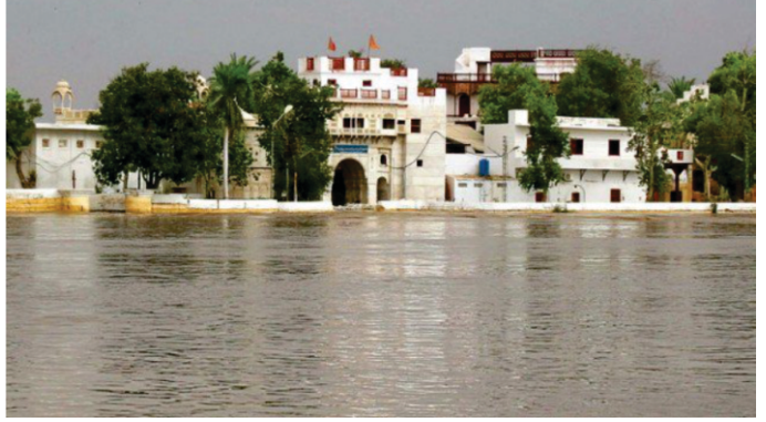
سندھ دریا دے کنڈھے سادھو بیلا سکھ۔

موتی ت مندر اوسرہ رتنی ت ہوہ جڑاؤ .. کستور کنگو اگر چندن لیب اؤے چاؤ .. مت دیکھ بھولا ویسرے تیرا چت ن اؤے ناؤ .. اہر بن جیو جلی بل جاؤ .. مے اپنا گڑ پوچھ دیکھیا اوڑ ناہی تھائو .. ا رہاؤ .. دھرتی ت پیرے لال جڑتی پلنگ لال جڑاؤ .. موہنی مکھ منی سوہے کرے رنگ پساؤ .. مت دیکھ بھولا ویسرے تیرا چت ن اؤے ناؤ .. آ سدھ ہوا سدھ لائی ردھ آکھا اؤ .. گپت پرگٹ ہوئی بیسا لوک راکھے بھاؤ .. مت دیکھ بھولا ویسرے تیرا چت ن اؤے ناؤ