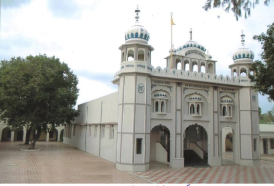
گورو نانک دھام رمیشورم

اُودا ہے؟ گورو صاحب نے کہا نہیں بھائی مینوں ہر جی وستو وچ کرتے دی کار نظر آرہی ہے۔