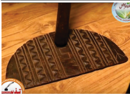
اچ دا وڈا پیر مکھدوم سید سلطان جہانیا گورو صاحب دیاں نشانیاں گرج آئے بیراگن دکھاؤدے ہوئے۔ بیٹھاں بیراگن۔