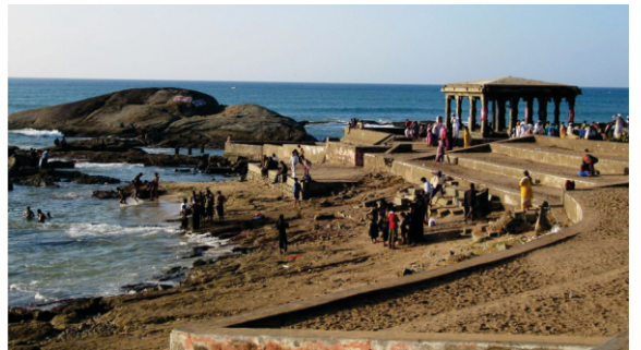
کنیا کماری مندر جتھے بنگال دی کھاڑی اتے عرب ساگر دا میل ہندا ہے۔ گورو صاحب دے ویلے وی ایہہ تھان مشہور سی۔

پدمنابھیر توں گورو صاحب الاچی پہاڑاں لاگوں دی لنگھ کے ۴۰ کلومیٹر دور کنیا کماری پہنچتے مندر ویکھے۔ ہندو متھاس انوسار اتھوں دی اک کڑی نے لنکا حملے ویلے بھگوان رام دی بہت مدد کیتی۔ رام چندرنے انوں بھروسہ دتا سی کہ جت توں مگروں اوہ رسمی ویاہ اوس مٹیاری نال کر لینگے۔ پر لنکا جتن توں بعد بھگوان نے اس کنیا نال ویاہ کرن توں ناہ کر دتی تے وعدہ کیتا کہ کسے اگلے جنم وچ