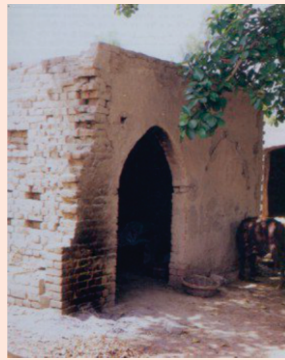
چھوٹا ننکانہ - حجرہ شاہ مقیم دا ج اہو کجھ بچیا ہے۔

کرم کرتوت بیل بستھاری رام نام پھل ہوا .. تسں روپ ن ریکھ اناہڈ واجے سبڈ نرنجن کیا .. ا کرے وکھیاں جانے جے کوئی .. امرت پیوے سوئی .. ارہاؤ .. جنپیا سے مست بھئے ہے توڈ بندھن پہاے .. جوتی جوت سمانی بھیترا تا چھوڈے مایہ کے لاپے .. ۲ سرب جوت روپ تیرا دیکھیا سگل بھون تیری مایہ .. رارے روپ نرالہ بیٹھا ندر کرے وچ چھایا .. ۳ بینا سبڈ وجاوے جوگی درسن روپ اپارا .. سبڈ اناہڈ سو سہ راتا نانک کہے وچارا ..