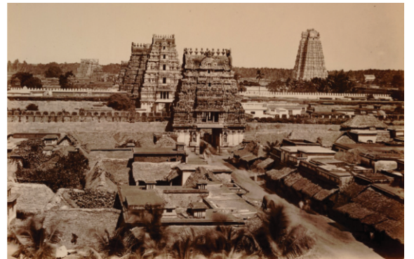
سریرنگم دے مندر سن ۱۸۷۰ ای۔

کہانی ایہہ دسدے نے کہ بھگوان رام نے بھیشن دی مدد توں خوش ہو کے اونوں وشنوں بھگوان دی اک خوبصورت مورتی بخش دتی۔ پر نال شرط سی کہ مورتی نوں صرف اک تھان تے ہی ستھاپت کرناں ہے انوں تھان تھان نہی لئے پھرنان۔ پر جدوں بھیشن اتھو دی (ترچناپلی) لنگھ رہا سی تان انوں حاجت آئی تے انے مورتی اک تھان تے رکھ دتی۔ واپس جدوں