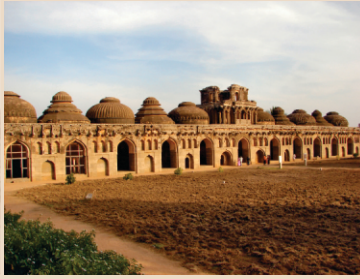
اتھاسک دستاویزاں نوں پرے رکھ کے، ذرا وجینگر دے کھنڈرات نوں ویکھو تاں پتہ لگدا ہے کہ شہر دی کی شان رہی ہوویگی۔ بھارت وچ ہور کتے وی ایے وشال کھیتڑ وچ کھنڈرات نہی ہن۔

سی۔رمائن وچ تنگبھدرا دریا نوں ہی ہمپا-سہریا کیہا گیا ہے۔ ہنومان دا وی ایہو علاقہ ہے۔