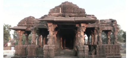
ستگاؤ دا وشنو مندر

مورت صورت کر آپارا۔۔ جوت دات جیتی سبھ تیری تو کرتا سبھ