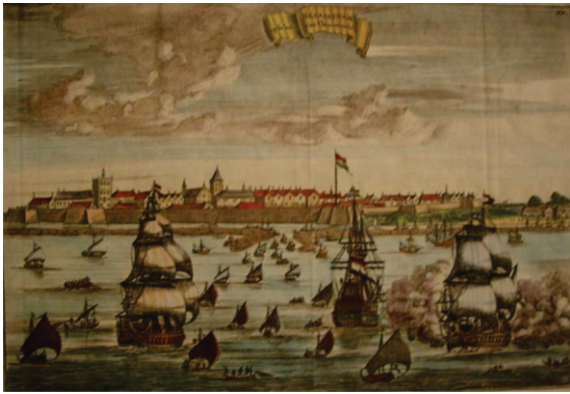
ناگا پٹنم -۱۶۸۰ء۔ دی تصویر: ڈچ کلکار

گرمّت ساچی حجتِ دور .. بہتّ سیانپ لاگے دھور .. لاگی میلّ مٹے سچ نائی .. گر پرسادِ رے لولائی .. ۱ بے حضور حاجزِ ارداس .. دکھ سکھ ساچ کرتے پرہ پاس .. ارباؤ .. کوڑ کماوے اوے جاوے .. کہن کتھن وارا نہی اوے .. کیا دیکھا سوچھ بوجھ ن پاوے .. بن ناوے من ترپت ن اوے .. آ جو جنم سے روگ ویاپے