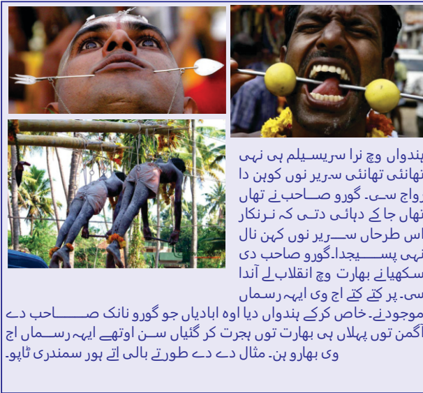
ہندواں وچ نرا سریسلم ہی نہی تھانئی تھانئی سریر نوں کوہن دا رواج سی۔ گورو صاحب نے تھان تھان جا کے دہائی دتی کہ نرنکار اس طرحاں سریر نوں کہن نال نہی پسیجدا۔ گورو صاحب دی سکھیا نے بھارت وچ انقلاب لے آندا سی۔ پر کتے کتے اچ وی ایہہ رسماں موجودے۔ خاص کر کے ہندواں دیا اوہ ابادیاں جو گورو نانک صاحب دے آگم تون پہلاں ہی بھارت تون ہجرت کر گئیاں سن اتھے ایہہ رسماں اچ وی بہارو ہن۔ مثال دے دے طور تے بالی اتے ہور سمندری ٹاپو۔

اتھے وی پھر گورو صاحب نے دہائی دتی کہ سریر نوں کوہن نال نرنکار پرسن نہی ہندا۔ ایہہ ظلم ہے۔ رب دے راہ وچ جورا زبردستی نہی پروان۔ اکھن