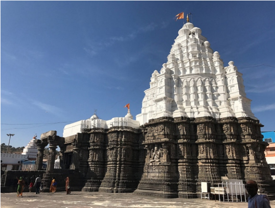
ناگپور جاں اوڈھا ناگتھ

گورو صاحب نے پنڈیاں نوں 'دھرتی دھرم سال' دے