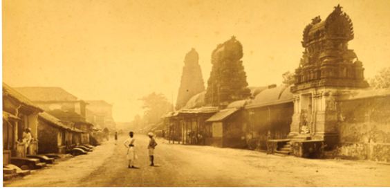
تہنجاوور دی ۱۸۶۷ ای دی فوٹو - (سروت- وکیپیڈیا)