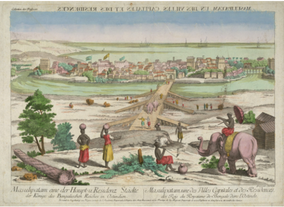
مچھلیپٹنم - ۱۷۷۶ ای دی تصویر

گوڑی چیتی محلہ ۱ کت کی مائی باپ کت کیرا کدو تھاوہ ہم آئے .. اگن بمب جل بھیتر نیچے کاہے کم اپائے .. ۱ میرے صاحبہ کون جانے کن تیرے .. کہے ن جانی اوگن میرے .. ۱ رہاؤ .. کیتے رخ برکھ ہم چینے کیتے پسو اپائے .. کیتے ناگ قلی مہ آئے کیتے پنکھ اڈائے .. ۲ ہٹ پٹن بچ مندر بھنے کر چوری گھر آوے .. ۳ اگے دیکھے پچھے دیکھے تجھتے کہا چھپاوے .. ۳