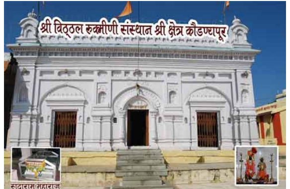
وٹھل رکمنی مندر کونڈنیاپر

پرسدھی تاں گورو صاحب دی علاقے وچ ہو ہی چکی سی۔ گورو صاحب نے اعلان کر دتا کہ اوہ لوکائی دے دکھ دور کر دینگے۔ جم وی نیڑے نہیں آئیگا۔ اک دن پھر وڈے میلے تے گورو صاحب نے چڑھدی کلھا دا سدھانت سبھ لوکاں نوں سمجھایا تے سترتار، ستگورو واہگورو نام دے لڑ لایا۔ ساری سبھا کیل کے پھر اعلان کیتا کہ لاه دیو بنے ایہہ پتھر، مٹا دیو اہ