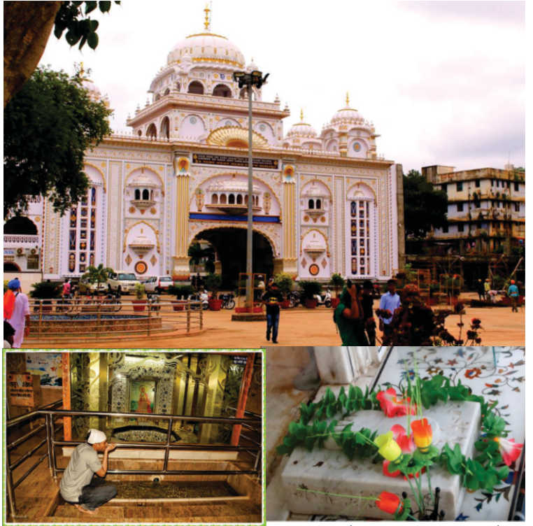
گرو دوارہ نانک جھیرا بدر۔ گورو صاحب نے جو جھیرا (چشمہ) جاری کیتا تے پتھر تے چرناں دا نشان۔

گورو صاحب دا بدر جانا ثابت کر دا ہے کہ اوہ ۱۵۱۸ء توں پہلاں پہلاں ہی دکھن دی یاترا کر چکے سن۔ جدوں گورو صاحب بدر گئے اودوں بادشاہ ویرا- شاہا عرف محمود شاہ باہمنی دوجا تخت تے سی۔ کیونکہ ایہہ یاترا سریسلم دے میلے (شورائری) تے پنڈھرپر دے میلے بعد ہوئی اس پرکار ایہہ اکتوبر ۱۵۱۴ء بندی ہے۔ ایہہ کوئی اشارہ نہیں ملا کہ راجے نے گورو صاحب نوں ملن لئی وقت کڈھیا کہ نہیں۔ پر اتہاس توں ایہو اندازہ لگدا کہ ایشو آرام توں علاوہ راجے کول اجیہے روحانیت دے کماں لئی وقت کتھے سی۔ بدقسمت گورو صاحب دے درشنا توں وانجھارہ گیا تے صاحب دے پرتن توں چھیتی بعد ہی ۱۵۱۸ء وچ اوپداراج کھیرو کھیرو ہو جاندا ہے۔