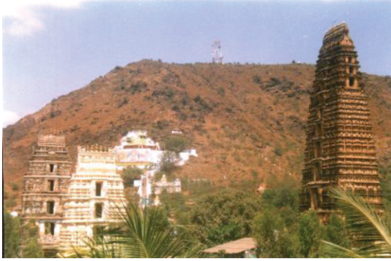
پانکلا مندر جتھے سوامی صرف گڑ دا شربت ہی پیندا ہے۔ چیتنیا پر بہو وی اتھے آئے سن۔

گورو صاحب چیتنیا مہاں پر بہو نوں پہلاں جگن ناتھ پوری وکھے مل چکے سن۔ پھر جویں آتے دتا ہے کہ چیتنیا دے اُون بابت شل لیکھ وی موجود ہے سو ایہو اندازہ ہے کہ گورو صاحب انوں دوبارہ اتھے