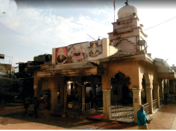
اکولا دا راج راجیشور مندر

ٹھائی ہے۔۔ ۴ تچھ ہی کیا جمن مرنا۔۔ گرتے سمجھ پڑی کیا ڈرنا۔۔ تو دیال دتیا کر دیکھہ دکھ درڈ سریربو جائی ہے۔۔ ۵ نچ گھر بیس رہے بھوٹا خایا۔۔ دھاوت راکھے ٹھاک رہایا۔۔ کمل بگاس پرے سر سبھر اتم رام سکھائی ہے۔۔ ۶ مرن لکھائی منڈل