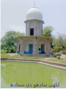
لکھی سادھو دی سمدھ

لکھی جنگل اصل وچ سندھ وچ کراچی دے علاقے وچ ہندا سی جتھوں دے گھوڑے مشہور سن۔ گورو صاحب نے لکھی بھگت ہون کر کے اسے علاقے نوں لکھی جنگل دا خطاب دے دتا سی۔