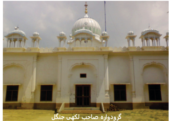
ਗੁਰੂਦੁਆਰੇ ਹਾਜੀ ਰتن ਭੁੰਨਣ

ਸ਼ਹਾਨ ਤੇ ਆਂ ਜਾਨ ਹੋ ਗਿਆ، لگدا ہے کہ پيرنے اندرون سکھی دھارن کر لئی سی۔