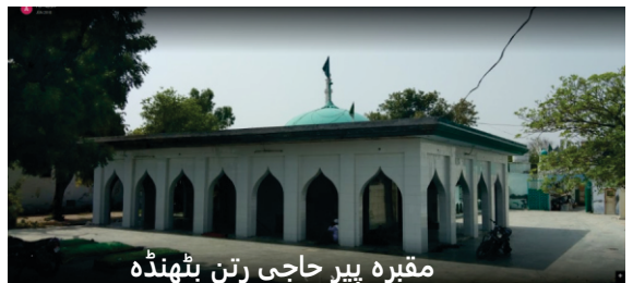
مقبرہ پیر حاجی رتن بٹھنڈہ

جنم ساکھیاں وچ گورو صاحب دارتن ہندی نال وی میل لکھیا ہے۔ دوسرے پاسے جنمساکھیاں دی پرمپرا جے ویکھیئے تاں اوہناں وچ جتھے وی گورو صاحب کسے وڈی شخصیت دے ستھان تے جاندے ہن تاں جنمساکھیاں ستھان دے موجودہ گدی نشین دا ناں دین دے بجائے سدھا ہی پرسدھ شخصیت نال میل دسدیاں ہن کیونکہ جنمساکھیاں سنیاں سنائیاں کہانیاں دے ادھارتے لکھیاں گئیاں ہن۔ جنمساکھی لکھاریاں واسطے موجودہ گدی نشین دا ناں لبھنا مشکل ہی نہی اسمبھو ہندا سی۔ بھاؤ جے گورو صاحب اجین وکھے بھرتھری جوگی دی جگا جاندے نے تاں اوتھے موجودہ گدی نشین نال گوشٹ ہندی ہے، پر جنم ساکھیاں والے سدھا ہی بھرتھری نال گل