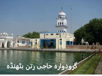
→ ਏਪਿਸ਼ਾਹਰ ਦਾ ਮਨਦਰ: ਦਰਗਾਹ ਪਿਰ ਰتن ਨਾਨਕ.