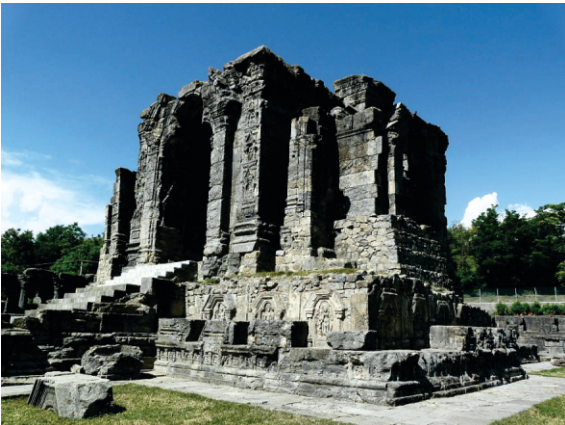
مٹن وکھے ۸وی صدی ای۔ دے مارتنڈ مندر دے کھنڈرات

سلوک م ۱ سہنسہر دان دے اندر روایا۔ پرس رام رووے گھر آیا۔ اجے سورووے بھیکھیا کہائ۔ ایسی درگہ ملے سچائ۔ رووے رام نکالا بھیا۔ سیتا لکھمن وچھڑ گیا۔ رووے دپسہر لنگ گوائ۔ جن سیتا عادی ڈرو وائی۔ رووہ پانڈو بھئے مجور۔ جن کے سوامی رہت حدور۔ رووے جنمیا کھئی گیا۔ ایکسی کارن