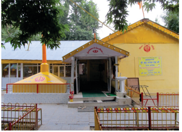
گرو دوارہ پہلی پاتشاہی مٹن

اوتھے پھر گورو صاحب نے مردانے نوں سچیت کر کے