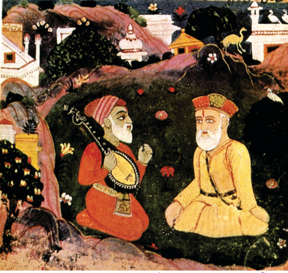
جدوں آجڑی نے باپے مردانے نوں لگاتار دو دن باہر بیٹھیاں دیکھیا تان کہندا، ”مینوں تان تسی کوئی چور ڈاکو لگدے ہو۔ بی: ۴۰ تصویر۔ (کشمیر وچ بابا)

گرنسستھان اوسے پہلی تھان بھاؤ سکھ نالہ دے کنڈھے بنا لیا۔