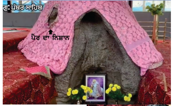
پتھر وچّ گورو صاحب دی تراشی ہوئی مورت اتے نشان چرن۔