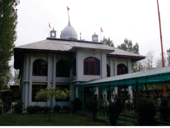
گروداره صاحب اونٹیرا

آپے ونچارا ساچے ابرهوبھاندا .. ۱۲ بید کتیب ن سمرت ساست .. پاٹھ پرا ن اده نهی آست .. کرهتا بکتا آپ اگوچڑ آپے الکھ لکھاندا .. ۱۳ جاسن بھانا تا جگت اپایا .. باجه کلا آڈان رهایا .. برهما بسن مهیسن اپائے مایه موه ودهاندا .. ۱۴ ورلے کو گر سبڈ سنایا .. کر کر دیکھے حکم سبایا .. کهنڈ برهمند پاتال ارمبهے گپته پرگئی اندا .. ۱۵ تا کا انت ن جانے کوئی .. پورے گرتے سوچهی ہوئی .. نانک ساچ رتے بسما دی بسم بهئے گن گاندا .. ۱۶ ۳ ۱۵