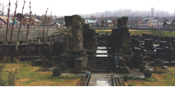
بھگوان اونتی سوامی مندر دے کھنڈرات، اونتیپیر۔

رقم پھرتی دی لے کے گیا ہے۔ گورو صاحب نے محسوس کیتا ایہہ سنہری موقع ہے کہ بابر نوں جا کے ملیا جائے تے دلی نوں اباراہمولودھیب ابراہیم خاندان توں چھٹکارا ملے۔ گورو صاحب نے محسوس کر لیا سی بنگالی تلان وچ تیل نہی (بادشاہ الاؤالدین حسین) اوہ سمبھانا گورو صاحب نوں بابر وچ نظر آئی جہڑی اوہ پورب وچ ڈھونڈ رہے سن۔