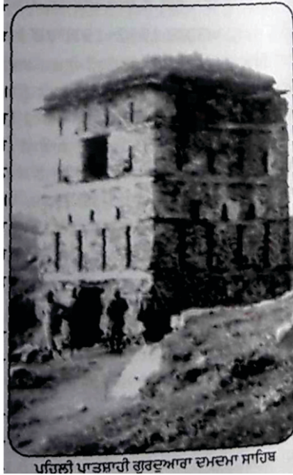
توسمیدان -خالصہ فوج دی نگاہ چوکی جس نں سائیکل یاتری نے کتے دمدا صاحب لکھیا کتے گورو دارہ پہلی پاتشہابی - یاتری دوارا ۱۹۳۲ ای. وچ لئی گئی تصویر۔

سو بکروال ل ہوش آئی جو مال سننجا چھڈ کے دور نکل آیا سی۔ واپس اس پاسے دوڑیا جتھے بھیڈاں بکریاں چردے چھڈ گیا سی۔ دور دور ویکھے کتے کوئی جانور نظر نہی سی ا رہا۔ گھبراہٹ وچ اس ساری چرانڈ گاہ ماری۔ جانوراں دا کتے کوئی کھوج کھرا نہی سی مل رہا کہ کدھر گئے۔ لبھدے لبھدے شام ہو گئی۔ میرا سارا اجڑ گواچ گیا ہے۔ ہو سکدے کہ بگھیاڑ بے گیا ہووے تے ڈردا سارا اجڑ کتے دوڑ گیا ہے۔ آجڑی سوچ رہا سی کہ جانوراں دے مالکان نے ساڈا جیناں حرام کر دینا جے اجڑ ناں ملیا تاں۔