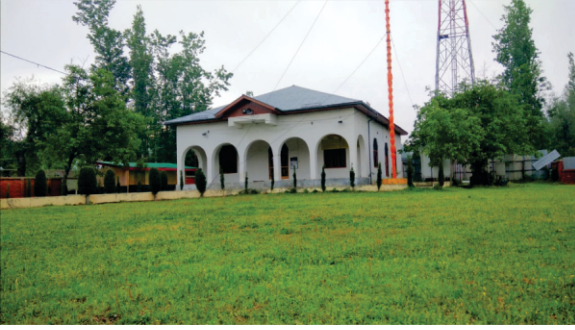
سری گورو نانک چرن استھان بیروہا

تے کیسے دا تلک جیہا سی۔ کجھ سادھوآں نے گورو صاحب دی پچھان دسّ دتی کہ ایہو ہن گورو بابا نانک۔ پرسدھ مندران تے دھارمک مکھیاں تک گورو صاحب دی اپما پہلاں ہی پہنچ چکی سی۔ براہمن لوک گورو صاحب نوں ہندو دھرم رکھنک سمجھدے سن کیونکہ صاحب نے کئی تھانئی مسلمان حکمراناں نوں مذہبی کٹڑواد اتے پکھپات توں ورجیا سی۔