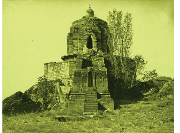
سنکاراچاریا مندر، بری پریت، سری نگر

مٹن رهنڈیاں ہی بابا جی نوں خبر ملی کہ افغانستان دا بادشاہ بابر پنجاب دیاں ریاستاں بهیڑا (بهیڑا) کھشابتے چنیوٹ گیڑا کت، ریاستاں کولو موئی