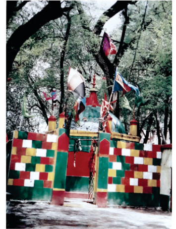
بالے دا چشمہ

ا سائیکل یاتری - ۵۱۴، ۵۱۴ سائیکل یاتری - ۵۱۳ کرپال - ۱۱۰، مہان کوش-۲۸۶ (اسیں نقشیاں رانہی اس کلیانسر نوں لبھن دا اپرا کیتا ہے پر کتے نہی ملیا)۔ ایہہ وی ہو سکدے کہ ایہہ داماسر ہی ہووے جس دا سائیکل یاتری ذکر کر رہا ہے، نبروالا-۶۸، و اقبال قیصر