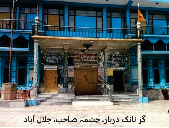
گڑ نانک دربار، چشمہ صاحب، جلال آباد

چوہا صاحب - پيشاور توں اگے ۱۳۶ کھ. می. تے جلال آباد قصبہ ہے۔ جس دی جوہ وچ جدو گورو صاحب جا رہے سن تان رستے وچ اک ڈنگراں دا پالی بیے ہوش حالت وچ ملیا۔ پالی بول نہی سی پا رہا اس نے اشارے نال کيہا کہ اوہ پیاسا ہے۔ گورو صاحب نے مردانے نوں حکم کيٲا کہ انوں جل چھکاؤ۔ مردانہ کہن لگا گورو جی ساڈی مشق وی بالکل خالی ہے۔