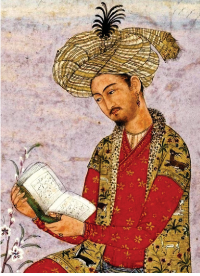
بادشاہ بابر دی اصل اتہاسک تصویر (پتہ نال بنی) یاد رہے مغل بادشاہ، مول وچ منگولیا توں ہون کر کے کھو دے جے ہی ہندے سن۔ صرف ٹھوڈی تے ماڑے جے وال ہندے سن۔

علاقہ دے انیکان لوکان دی سوچ وگڑ گئی ہے۔ مینوں لگا کہ ایہو جہی خوبصورت تھان تے کسے کافر دا مزار نہی ہونا چاہیدا۔ سو میں حکم دے کے اوہ ڈھہا دتاتے تھان پدھرا کروا دتا۔ ایہہ اینی خوبصورت تھان سی کہ میرا اوتھوں جان نوں جی ناں کرے۔ اتھے پھر میں نماز وی پڑی۔ اتھے کجھ سماں میں رہا۔