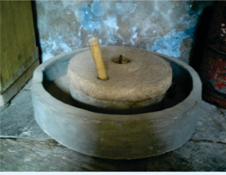
پنجاب وچ اس طرحاں دی ہتھ چکی پرچلت ہندی سی۔ دھیان رہے ایہہ چکی دا ماڈل ہے۔ ساکھی وچ دتی چکی نال ایہدا کوئی سبندھ نہیں۔

سو سپاہی جہڑی سادھو فقیراں دی ڈھانسی پھڑھ کے لیائے اناں وچ رشٹ- پشٹ سادھواں نوں چکی پیہن ڈھاہ دتا۔ باقیاں نوں گھوڑیاں دی خدمت آدی تے۔ جہڑا چکی نال پیہے سپاہی انوں کوٹڑے مارن۔