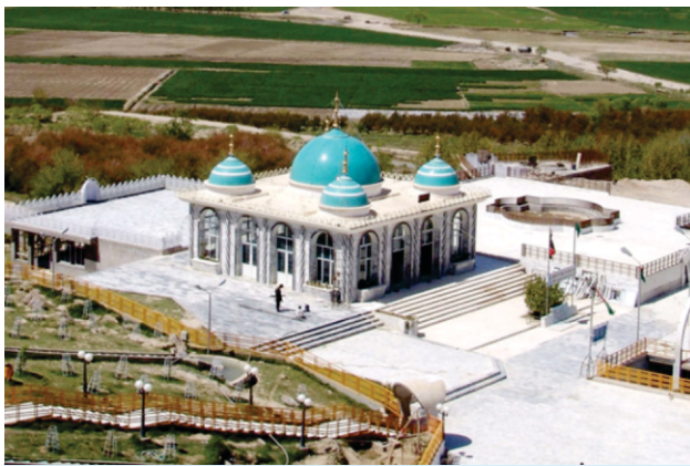
حضرت ولیؤلا بنام ولی قندھاری دا قندھار توں ۴۷ ک۔ می. ہٹواں مقبرہ۔ گورو صاحب جدوں بغداد توں پرط رہے سن تان گڑ صاحب نے ولی دے ٹکانے بارے پتہ کیتا۔ صاحب نوں پھر خبر ملی کہ اوہناں دا یار تان فوت ہو گیا ہے۔

پیر نوں جدوں پتہ لگا کہ نانک نے پیٹھاں اک چشمہ جاری کر دتا ہے تان اس نے اک پتھر گورو صاحب ول ریڑیا۔ گورو صاحب نے آ رہے پتھر اگے اپنا پنچہ کرکے روک لیا۔ اخیر تھک ہار کے پیر ولی قندھاری جس دا اصلی ناں پیر سید جمال الا سی گورو صاحب دے چرناں تے ڈھیہہ گیا۔ اوٹھے گورو صاحب نوں پیر نوں اپدیس دتا