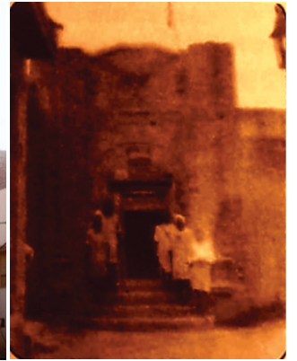
گردوارہ چکی صاحب۔ ۱۹۱۴ وچ بنی عمارت دیاں تصویراں۔ کھے ۲۰۱۶ وچ آئے سچے ۱۹۳۲ وچ۔ دھیان ویکھو عمارت اوہو ہی ہے۔ اٹ وی موجدا بھاؤ وڈی لگی ہے۔

علاقیاں دی خدائی موقعے چکیاں اکثر نکل آؤدیاں بن۔