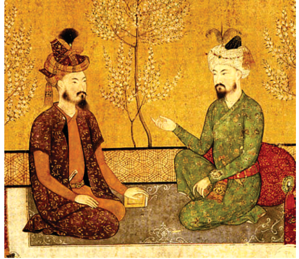
بابر (سجے) اپنے پتر شاہزادہ ہمایو نال

سدا، نریاب اتے ہنگو آدی وچ جہڑا گورو صاحب دا اونا ثابت ہندا ہے اس توں لگدا ہے کہ صاحب قابل توں دکھن نوں ہو ترے سن۔ قابل توں ۱۲۷ ک۔می۔ دا پہاڑی پینڈا کر کے اتھاسک شہر گردیز پہنچے۔ صاحب دی گردیز آمد بارے اتھاس چپّ ہے۔ اس توں ایہو اندازہ لگدا ہے کہ صاحب صرف اس پاسیو دی نکل رہے سن۔ ہو وی سکدا کہ ستھانک پیراں فقیراں نال گوسٹاں ہوئیاں ہون۔ گردیز توں ۱۰۵ ک۔می۔ سفر کر کے کھوست شہر پہنچے۔ انج اوہ اپرلے راہ وی جا سکدے سن۔ پر سانوں ایہو اندازہ لگدا ہے کہ انان پرچار والے پاسیو جان دے بجائے کھوست نوں ترجیح دتی ہوویگی۔