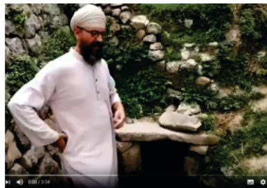
چشمہ گورو نانک ہنگو۔ اک پٹھان گرسکھ چشمے دے درشن کراؤدا ہویا

پھر نریاب وکھے چوکھی سکھی سیوکی ہو گئی سی۔ اتھے اک جوگی کول گورو صاحب ٹھہرے سن جس نے سکھی دھارن کیتی۔ اس سنت نے سکھی دا چوکھا پرچار علاقہ وچ کیتا۔ اتھے گرنستھان وی ہندا سی جس دی سیوا تیسرے پاتشہاہ سری گورو امرداس دی