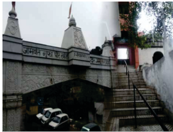
گفا پیر کھو، جامونت، جموں۔ اتھے گورو صاحب دا اؤنا تصدیق ہندا ہے۔

رامکلی محلہ ۱ جگ پر بودھ مڑی بدھاوہ .. آسن تیاگ کاہے سچ پاوہ .. ممتا موہ کامن ہتکاری .. نہ اؤدھوتی نہ سنساری .. ا جوگی بیس رہے ددھا دکھ بھاگے .. گھر گھر ماگت لاج ن لاگے .. ا رہاؤ .. گاؤہ گیت ن چینہ آپ .. کیو لاگی نورے پرتاپ .. گر کے