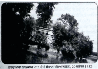
گرودارہ نانکسر ۲۰۰۸ سال ۲۰۰۸ (سیمالکوٹ)، 20 ستمبر 1932

گرودارہ نانکسر سیوکی دی پرانی تصویر (سائیکل یا تری) اصلی ناں: سیوکی