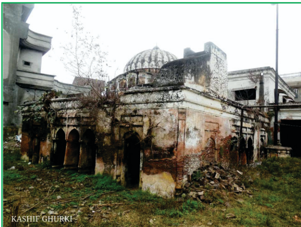
گرودارہ باؤلی صاحب۔ جدوں دوسری واری گورو صاحب سیالکوٹ آئے تاں اتھے رکے سن۔ اتھے ہی مولے کراڑ دی لاش اوہدے رشتے دار چکّ لیاے سن کہ مولے کولوں غلطی ہو گئی ایہنوں بخش دیو۔

پیر نوں اک دم ہوش آ گئی۔ پیر لاجواب سی۔ اگے کجھ وی کہن دی ضرورت نہ پئی۔ پیر صاحب گورو صاحب دے چرناں تے سی۔ پھر وی دلیل ماتر کہن لگا کہ سیالکوٹ دے لوک