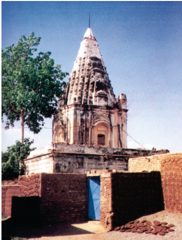
گڑ نانک استھان ساہووالا۔ ایہہ اداسیاں دا گرو دوارہ صاحب جو مندر دی نیانی بنیا ہے۔ مول وچ ایہہ وی کوئی بودھی استھان ہوے گا جو بعد وچ جوگیاں کول گیا تے پھر اداسیاں اتھے گرو دوارہ صاحب بنا یا۔ کیہا جاندا ساہووالا قصبہ ۸۰۰ سال پرانا ہے۔ آج کلہ اسلام دا پرستھ کیندر بن چکا ہے۔

ہمجاً گونس دی اس ہڑتال دا گورو صاحب نوں پتہ لگا تاں اتاں سیالکوٹ نوں چلے پائے سن۔ ہمجاً گونس دے تکیئے توں تھوڑا ہٹواں گورو صاحب تے مردانے اک بییری تھلے آڈیرہ جما لیا۔