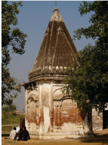
سیالکوٹ علاقے وچ اج وی مقبول ہے، پورن بھگت دا کھوہ۔

بمجا گونس دے ناں خالصہ سرکار ویلے اک پنڈ بنیا گیا جو اج وی پھل