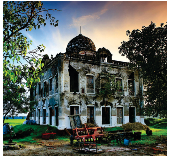
گورو نانک چرن استھان فتح بھنڈر

روپا جدوں پرتیا تاں اسنوں ایہہ ویکھ کے اتیننت دکھتے پیڑا ہوئی۔ روپا کہن لگا بابا جی ایہہ پنڈ غرقن تے آ گیا ہے جہڑا نیک انساناں دی قدر نہی کردا۔ گورو صاحب نے روپے نوں سمجھایا کہ اتاں دا کی دوش اتاں دی بدھ ہی بھر شٹ گئی ہے۔ روپا ضد کرن لگا کہ بابا جی تسی نرنکار داروپ ہو اجیہے جیواں نوں سجاتاں ملنی ہی چاہیدی ہے۔ پر شانتی دے سمندر گورو صاحب روپے نوں ہی