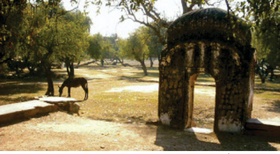
پسرور دے گرودارہ صاحب دیوکے دا بس ایہہ کجھ بچیا ہے۔ پسرور بھاؤ پرسرامپر۔ ہندو متھاس دے برہمن دیوتا پرسرام دا شہر۔ اوہ پرسرام جس نے کھتربیاں نوں ختم کرن دی سونہ کھاہی سی۔