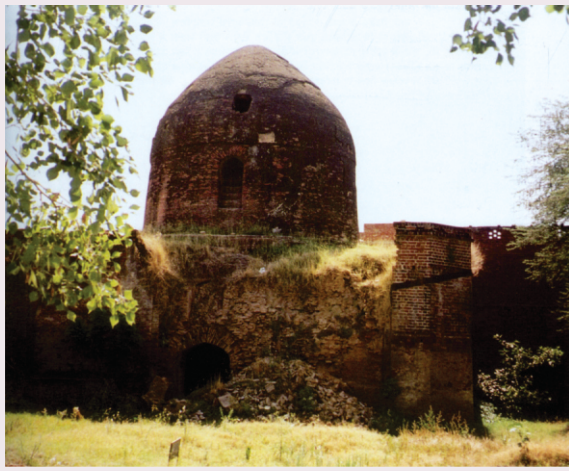
چلھاتے قبر ہمجھا گونس، سیالکوٹ۔ ایہناں نوں وی مرمت دی سخت ضرورت ہے۔ سانوں نہی لگدا کہ اسلامک سٹیٹ پاکستان اس استھان دی مرمت کروائے۔ سو ضرورت ہے سکھ سنگتاں کوشش کر کے ایہہ یادگار وی بچائی رکھن۔

اسنکھ جب اسنکھ بھاؤ .. اسنکھ پوجا اسنکھ تپ تاؤ .. اسنکھ گرتھ مکھ وید پاٹھ .. اسنکھ جوگ من رہہ اداس .. اسنکھ بھگت گن گیان ویچار .. اسنکھ سستی اسنکھ داتار .. اسنکھ سور مہ بھکھ سار .. اسنکھ مون لو لائی تار .. قدرت کون کہا ویچار .. واریاں جاوا ایک وار .. جو تده بھاوے سائی