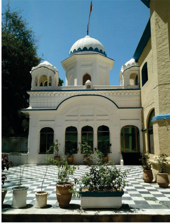
گرو دوارہ صاحب باے دی بیر۔ بمجھا گونس دا چلھا تڑاؤن ویلے جتھے گورو صاحب براجے ہوئے سن۔ اتھے دی اس ویلے دی بیر اج وی موجود ہے۔ پاکستان سرکار نے عمارت دی کار سیوا کروائی ہے۔

جمنوں دے راہ تون تھوڑا جیہا پاسے جا کے مطلب چہراڑ روڈ تے پنڈ تلکپرتے کانپور ہن۔ (سیالکوٹ توں ۱۵ ک. می. چڑھا بہاڑ پاسے) اتھے تلکپرتے وکھے گورو صاحب دے براجن دی یادگار وجوں گرو دوارہ نانکسر صاحب موجود ہے۔ حالان ہن گرو دوارہ صاحب دے کھنڈرات ہی بچے ہن۔ پتہ لگا ہے کہ استھان دی زمین تے لوکانے قبجے کر لئے تے آپس وچ اونان دے مقدمے وی چل رہے۔ ***** ہو سکدے اتھے وی جوگیان دا کوئی مہتوپورن استھان ربا ہووے گا جہڑا گورو صاحب اتھے آئے۔ جا کوئی وڈا مندر آدی ہووے گا۔ کیوک لاپور پاسیو جدوں ہندو شردھالو ویشنودیوی دے درشناں نوں جاندے سن تاں