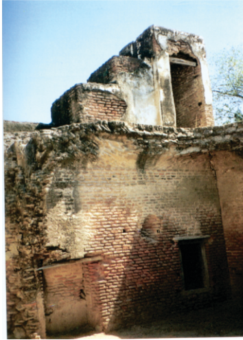
بجے کھجے کھنڈر گرو دوارہ تلک پور

ਗورو صاحب ਦਾ جامونت دی گفا جانا وی لکھیا ملدا ہے۔ ایہہ توی دریا دے کنڈھے ہے۔ اس مندر دا ناں ۱۸ وی صدی (?) وچ ہوئے پیر کھو دی گفا کر کے زیادہ پرسدھ ہے۔ پیر کھو وی کوئی جوگی سی۔