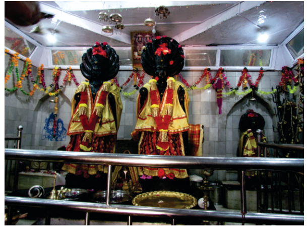
۱۱۰۰ سال پرانا وسوکی ناگ مندر اندر موجود راجیاں دیاں وڈیاں وڈیاں مورتیاں۔ بھدرواہ کسے طرحان مسلمان بت سکن راجیاں دی پہنچ توں دور رہیا ہے۔ ادھی صدی پہلاں تک اتھے صرف چچران رانہی ہی پہنچیا جاندا سی۔

جگہ جگہ کے راجے کینے گا وہ کر اوتاری۔۔ تن بھئی انت ن پایا تا کا کیا کر آکھ ویچارے۔۔ (م، ۳، انگ-۴۲۳) نالے دے این کنارے تے ہی پھر شو مندر (گپت گنگا) بے جو جوگیان تے سدھا دا مٹھ سی۔ سدھ جوگیان تے بدھ مت توں پہلاں اتھے ساقط مت تے ناگ-پوجا پردھان رہی ہے۔ اج وی اجیہے کئے ہی مندر ہن: چنڈی ماتا مندر، تھپو ناگ مندر، ناگنی ماتا مندر، الالبانی مندر، سبر ناگ مندر، سینلا ماتا مندر۔