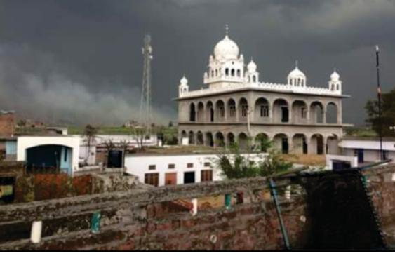
صاحب دی کیڑی افغاناں وکھے آمد دی یادگار

گرہ گرہ کوکر نیائی مانگت نہ جاؤ۔ بھیکھ کا جوگی کدے ن کہاؤ۔