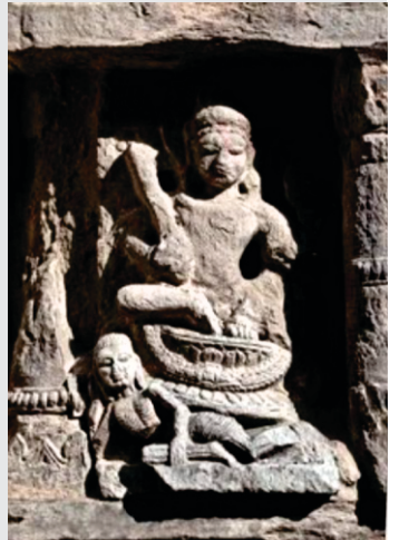
چرپٹ ناتھ ہی چمبے دا دیوتا ہے۔ مورتی دھیان نال ویکھو کوے جوگی دے پیراں تھلے سندری دی مورتی ہے۔ در اصل مغل حملہ آوران دے اون توں پہلاں کام واشنا مندر دے گرہ گرہ تک پہنچ چکی سی۔ شاہد ایہو کارن ہووے جہڑا گورو صاحب نے کام بابت گرسکھ نوں بہت سچیت کیتا ہے۔

مٹھ تے پہنچ گورو صاحب نے مہنت نوں ستکار نال آدیس کیا۔ بعد وچ چرپٹ ونی دے مہنت نے