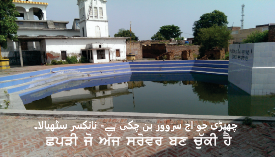
ਚھਿੜੀ جو اچ سروور بن چکی ہے۔ تانکسر سٹھیالا۔ ਹੁਪਤੀ ਜੋ ਅਜ ਸਰਵਰ ਬਣ ਚੁਕੀ ਹੈ

پہنچی۔ گورو صاحب اِتے مردانہ کیرتن وچ مسست سن۔ اس بیبی نے بچہ گورو صاحب دے لاگے پا دتا تے آپ پرے ہو کے بہہ گئی۔ شبد دی سماپتی تے گورو صاحب نے روندی ماں دا درد سمجھیا اِتے اس نوں اشارہ کیتا کہ بچے نوں نال دی چھڑی وچ اشنان کراؤ۔ چھیريو ہار چکی ماں نے جھٹ بچے نوں ڈبکی لوا دتی۔