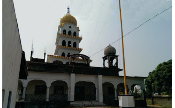
چہڑی جواں سرور بن چکی ہے دے کنڈھے گرودارہ نانکسر سٹھیالا۔

بڈھا تھیہ توں ۷ ک۔می دکن گورو صاحب پنڈ سٹھیالا پہنچے۔ سٹھیالا بابا بکالا تو پہاڑ پاسے ساڈھے چار ک۔می ہے ائے بٹالا سڑک توں اک ک۔ می۔ چڑدے پاسے ہے۔ جنی دنی گورو صاحب اتھے ائے اودو اس پنڈ دا ناں مگلانی ہویا کر دا سی ائے بہتی مسلمان آبادی ہی سی۔ اک مسلمان پیر دی پنڈ وچ بڑی مانتا سی۔ گورو صاحب پنڈوں باہروار ہی بہہ گئے تے کیرتن شہرے وچ کر دتا۔ مردانہ ربابی نال سی۔ گورو صاحب دی آمد دی خبر پنڈ واسیاں نوں لگی۔ اک ماں جس دا بچہ سوکڑے دا مریض سی اوہ تھان تھان علاج کرا کے پار چکی محسوس کر رہی سی۔ گورو صاحب دی پنڈ وچ آمد دا سن کے اوہ وی