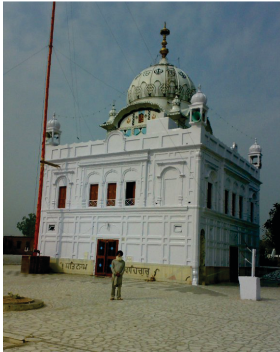
کوٹھا صاحب ادو کے

ایسری سویرے سوادی بھوجن تیار کر کے سہرے نوں گڈے تے پا، گورو صاحب دے ڈیرے تے پہنچدی