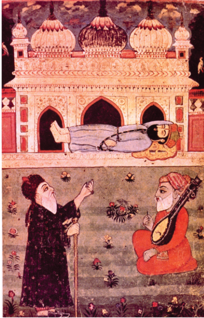
جدوں کعبے گورو صاحب دے چرناں ول گھم گیا۔ بی۔ ۴۰ تصویر

جیوں واپو داہی کعبے ول گیا۔ اوتھے پور مولانے وی صاف صفایاں کر رہے سن۔ جیوں نے دہائی دے دتی