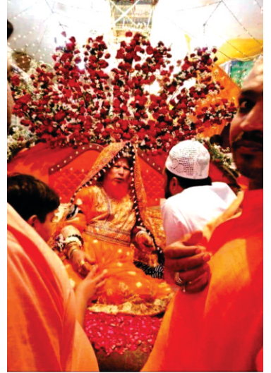
(کہیے) بی: ۴۰ پیننگ زانی بنیا پیر ٹٹیری۔ پیران فقیران دا زانی بن دا پاکھنڈ اچ وی بادستور جاری ہے۔ آہ ویکھو پاکستان دے اک پیر دا حال۔

پاکھنڈی مایہ ادھک لگے۔۔ ا رہاؤ۔۔ پھول مالا گل پہروگی بارو۔۔ ملیگا پریتم تب کروگی سیگارو۔۔ ۲ پنچ سسخی ہم ایکو بھتارو۔۔ پیڈ لگی ہے جیڑا چالنہارو۔۔ ۳ پنچ سخی مل ردن کریہا۔۔ ساہو پچوتا پرنوت ناک لیکھا دیہا۔۔ ۴ ۱ ۳۴