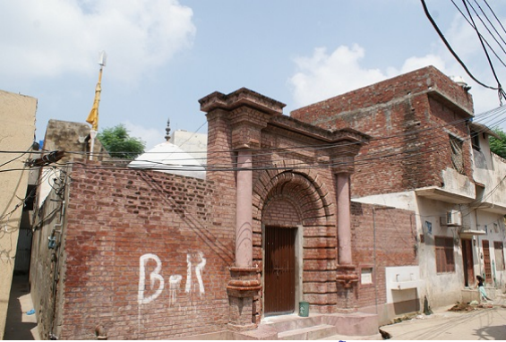
سیدپیر (اج ناں ایمن آباد) دے چڑھدے پاسے، محلہ دیوان کرم چند وچ بہائی لالو دا گھر۔

جدوں بھوجن دا وقت آیا تان کرتی لالونے چونکا تیار