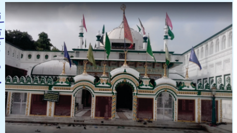
بو علی دا مقبرہ - پانیبت

کرنال توں گورو صاحب پھر پانیبت آئے تے سمبھاونا ہے کہ اوہ بو علی دی درگاہ تے وی پدھارے۔ پانیبت دا گرو دوارہ موجودہ دور وچ ہی کسے نے جی ٹی روڈ تے بنایا ہے آتے گورو صاحب دی آمد نال جوڑ دتا ہے۔