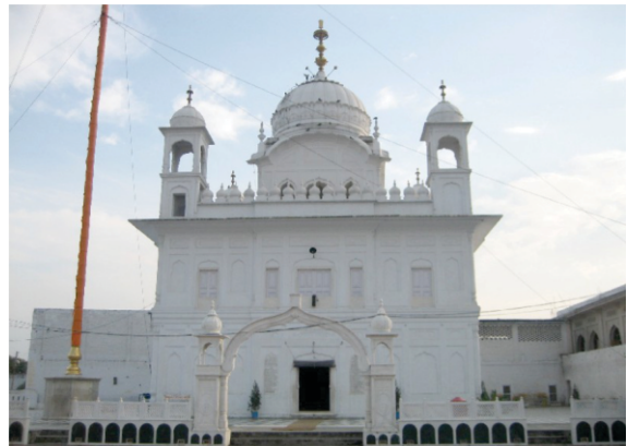
تپیان صاحب - کھڈور وکھے جتھے گورو صاحب آڈیرہ لایا سی۔