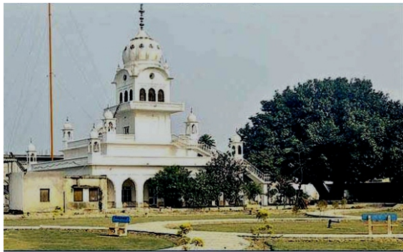
گرودارہ نانک پڑاؤ پہتہباد (دھنواد اجیت اخبار)

تیسرے دن پھر صاحب گوئندوال توں روانے ہوئے تے کسے چلڈے قافلے نال جرنیلی سڑک تے موجود قصبہ پہتہباد آٹھہرے۔ اوتھے پٹھاناں دی فوج دی وی