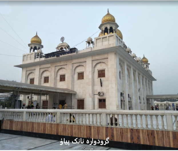
ਗੁਰਦੁਆਰੇ ਨਾਨਕ ਪਿਆ