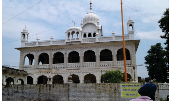
اچ گرو دوارہ بن چکا ہے - بیبی بھرائی دا گھر

گورو صاحب نے پنڈوں باہر کیرتن ارمبھ دتا۔ لوکائی اکٹھی ہوئی۔ مردائے توں لوکائی نوں پتہ لگا کہ ایہہ گورو نانک جو مودیخانا تیاگ دنیاوی دے ادھار لئی نکلے۔ گورو صاحب دے اپدیش تے علاقہ اشّ اشّ کر اٹھیا۔ جویں انیں دنی رواج ہندا سی ہر کوئی اپنے وتّ انوسار بھیٹاں لے لے پہنچیا۔ مرداناں نالو نال سنگتاں وچ ورتائی گیا۔