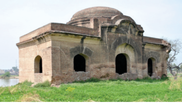
ایمن آباد دے چڑھدے پاسے اج وی لودھی پٹھاناں دی بنائی ہوئی مسیت کھڑی ہے۔ پو سکدے اوسے پٹھان نے بنائی ہووے جہدا منڈا بیمار سی۔

گیا تاں نواب بہت مایوسی دے عالم وچ سی کہ منڈا دن بدن بیٹھاں ہی جانی جا رہا ہے۔ بھاگو نوں کہندا توں ہی کوئی صلاح دے کی کیتا جاوے؟ بھاگو نے جنے حکیمان ویدان دے ناں دسے پٹھان نے جواب دتا کہ اوہ تاں سارے پہلاں ہی متھا مار چکے۔ بھاگو کہندا جے وید حکیم منڈے نوں راضی نہی کر پائے تاں آہ سادھاں فقیراں نوں پھڑیئے جہڑیاں ڈاراں دیاں ڈاراں تیریاں پھردیاں نے۔ اتھاس وچ اؤدا ہے کہ بعد وچ بابر نے وی فقیراں تے اپنا غصہ جھاڑیا سی جدوں اس نے پیر کنوٹے اسدے سیوکاں دا قتل کر دتا سی۔