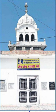
بیرووال گرو دوارہ

گورو صاحب نے پنڈوں باہر کیرتن ارمبھ دتا۔ لوکائی اکٹھی ہوئی۔ مردائے توں لوکائی نوں پتہ لگا کہ ایہہ گورو نانک جو مودیخانا تیاگ دنیاوی دے ادھار لئی نکلے۔ گورو صاحب دے اپدیش تے علاقہ اشّ اشّ کر اٹھیا۔ جویں انیں دنی رواج ہندا سی ہر کوئی اپنے وتّ انوسار بھیٹاں لے لے پہنچیا۔ مرداناں نالو نال سنگتاں وچ ورتائی گیا۔