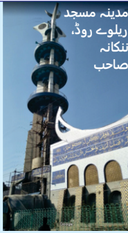
مدینہ مسجد ریلوے روڈ، ننکانہ صاحب

گرو دوارہ منجی صاحب پاتشاہی پہلی، بنومان گلی، محلہ کھتریان، کرنال۔ مندرتے مسیت اس فوٹو نوں دھیان نال ویکھیا جاوے۔ اتھاسک گرو دوارے دے نال تھوڑی جہی تھان 'ج' ۴-۵ منزلان اچا مندر بنا دتا ہے۔ این گیٹ اگے بجلي دا پول گڈھ دتا۔ گرو دوارہ صاحب نال ایرکھا صاف نظر آ رہی ہے۔