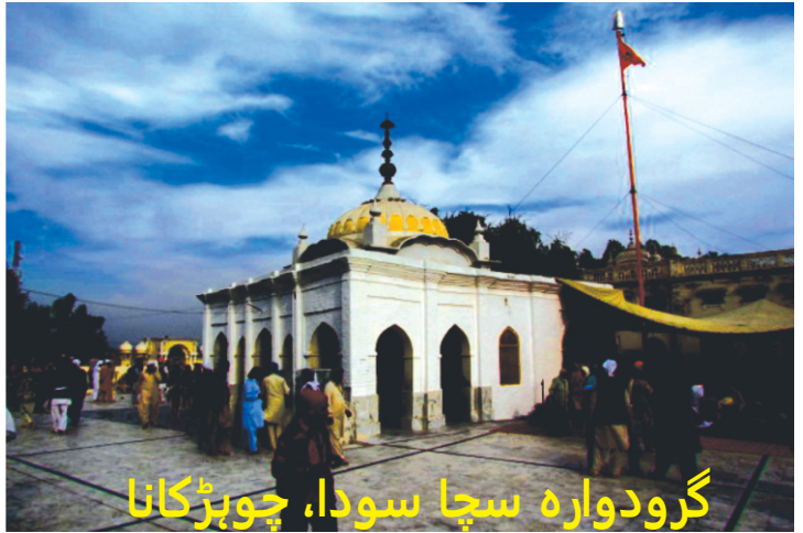
گرو دوارہ سچا سودا، چوہڑکانا

گورو صاحب نے اس تے پنڈت نوں منکھی برابر تا بارے سمجھایا۔ بھائی جوہیں توں کہنا کہ جی پنج تتان دا پتلا ہے تے اچھوت کھڑا وکھرے تتان توں بنا ہے اوہ وی تاں اونان پنجان تتان تے ربّ دی ہی اولاد ہے تے پھر اچھوت نیواں کوے ہو گیا۔ تے کیہا کہ جے کوئی اچھوت ہے تے نرنکار دا بھگت ہے تاں میرے واسطے