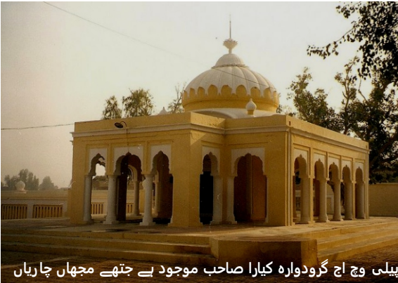
پیلی وچ اج گرو دوارہ کیرا صاحب موجود ہے جتھے مجھاں چاریاں

رائے نے کجھ پنچ (منصف) بھیجے کہ جا کے ویکھو کہ کھیت دا کنا کو اجاڑا ہویا ہے۔ پنچاں نے کھیت جا کے ویکھیا تان حیران رہ گئے۔ کیونکہ کھیت اینا ہرا بھرا لہ لہاؤندا سی کہ علاقہ وچ اوہو جیہا جھونا ہور کسے دا ہے ہی نہیں سی۔ کسان وی حقہ بکا سی۔ پنچاں نے کسان نوں کیہا کہ کجھ شرم کردوں اجیہی جھوٹھی شکانت کرن لگیان۔ کسان دہائی پائے، سونہاں کھائے کہ اس نے اکھی ویکھیا کہ مجھاں سارا کھیت کھا گئیاں سن تے کجھ تان جھونے وچ ہی