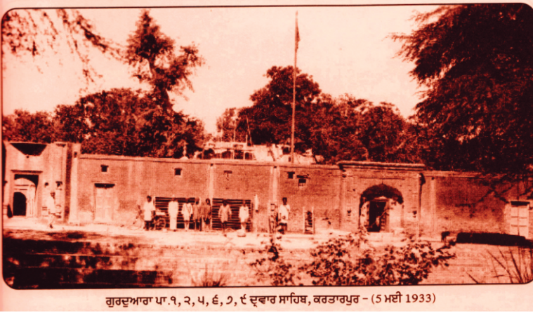
گوردوارہ ۱۹۳۱ء - ۱۹۳۱ء (5 مئی 1933) - گوردوارہ صاحب دی تصویر کھچی۔ اس موقع عمارت دی کارسیوا چل رہی سی۔

۱۹۳۱ء وی وچ سائیکل یاتری نے گوردوارہ کرتارپور صاحب دی تصویر کھچی۔ اس موقع عمارت دی کارسیوا چل رہی سی۔