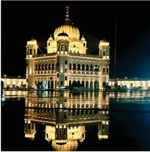
ਅੱਜ ਪੂਰੀ ਸ਼ਾਨ ਹੈ ਕਰਤਾਰਪੁਰ ਸਾਹਿਬ اج پوری شان ہے کرتارپور

کیونکہ گورو نانک نوں مسلمان اپنا پیرتے ہندو اپنا سادھو سنت سمجھدے سن اس کرکے مسلمانان دی منگ نوں نجرنداز کرناں پروار واسطے مشکل ہو رہا سی۔ پھر ورودھ کرن والے مسلمانان وچ کجھ علاقے دے طاقستور چودھری وی شامل ہو گئے۔