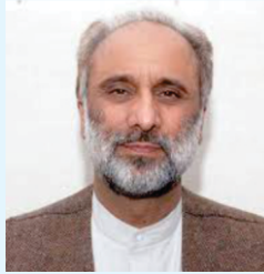
सरदार हजरी मुरीमर रामनी ची 4 साल परिलां ची उमदीरा।

اساں پاکستانی افسر نوں کیہا کہ اتھوں دا انتظام تہاڈا ہے۔