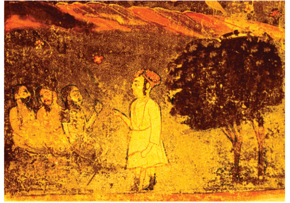
کملا سادھوآں کولو گورو صاحب لئی ڈھیمے لے رہا ہے۔ (تصویر بی: ۴۰ اسان تصویر دا کجھ حصہ ہٹا دتا تے خراب ہو چکی تصویر تے برش وی ورتیا ہے تان کہ کجھ اگھڑ لے۔)

گورو صاحب نے اعلان کر دتا کہ گرسکھو ایہہ ڈھیمے