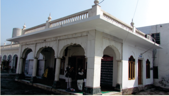
مڈھ س.گ.س. کیرتن استھان گورو ارجن دیو جی۔

تے لؤ ۱۹۷۳' چ بنے مضبوط دربار صاحب دی لینٹر والی چھت نے ہن چوناس شروع کر دتا۔ شرومنی کمیٹی امرتسر تگ شکایت کیتی گئی کہ