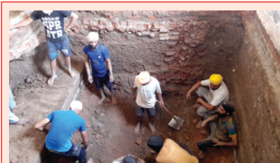
پراتت پکھو بہت ہی امیرے گرو دوارہ دربار صاحب دا چگردا (حاطہ)۔ جدوں نوی عمارت واسطے نیہہ پٹی جا رہی سسی تان سبھنے ویکھیا کہ اتھے وکھرے وکھرے سمیاں دیاں انیکاں قسم دیاں کئی کئی نیہاں سن۔ بھائی نانک چند ٹنڈن والی عمارت دی کنگریاں والی نیہہ وی دس رہی سسی کہ اس تے شاہی خرچے ہوئے ہن۔ ایہہ امیری ثابت کردی ہے کہ کرتارپور صاحب بنن توں پہلاں اتے رندھاوے دا ڈیرہ ہی دھرم سال سسی۔

انان ہی دناں وچ پھر شرومنی کمیٹی نے اک کارسیوا بابے رانہی دربار صاحب لاگے سرواواں دا