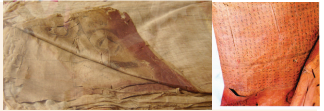
چولا صاحب۔ اج رنگ اوہ ہے جو کھبے پاسے والی تصویر وچ دسدا ہے۔

پھر ۱۵۷۰ ای وچ اوسمانیاں حکومت دے ہتھوں وولگا دریا دے سرے تے ستھت شہر استراکھان (اس + ترکھان) جاندا رہا جس کرکے پوربی وپاریاں لئی یورپ دا سدھا ہی راہ کھل گیا۔ ہولی ہولی پھر انیکاں پنجابی وپاریاں نے بکھارا توں استراکھان ول